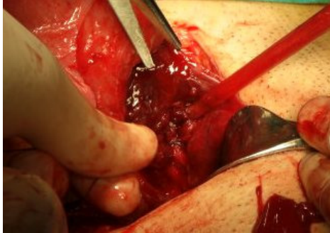
Resim 1: Eski insizyon skarının sol kenarında tam kat rüptür.

Intraoperatif dört ünite eritrosit süspansiyonu, dört ünite taze donmuş plazma transfüze edilmiştir. Rüptür primer sütürasyon ile onarılmış ve atoni için B-Lynch sütürü uygulanmıştır (Resim 2). Hasta postoperatif üçüncü günde taburcu edilmiştir.