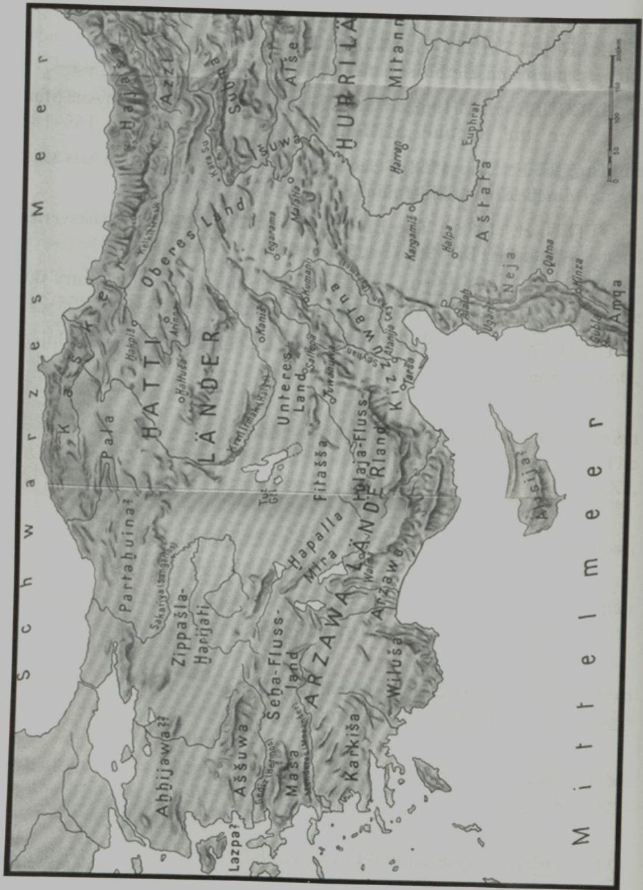
GOETZE, A. (1957), Kleinasien. Kulturgeschichte des Alten Orients, München.