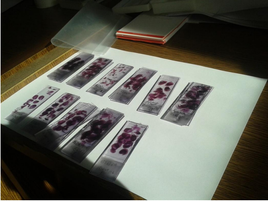
Şekil 2. Böbrek kesiti

Özellikle sıçan, renal anatomi ve fizyoloji çalışmalarında çok kullanılan bir hayvan olup birçok renal hastalığın modellenmesinde de; sıklıkla tercih edilmektedir. Sıçan böbreği insan böbreğine göre çok daha küçük olmakla birlikte ünipapillerdir ve daha az renal tubule sahiptir. Ayrıca sıçan böbreğinin pelvisi çok daha basit olup çok küçük bir üriner boşluğu bulunmaktadır. Bununla beraber medulla hacminin korteks hacmine oranı insan böbreğine çok yakındır. Bu oran sıçan, köpek ve insanda 1:2 iken tavşanda 1:16'dır (Coe et al. 1991).