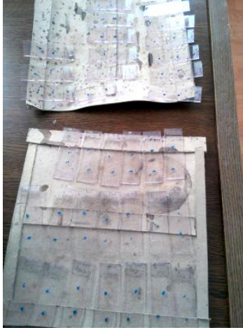
Şekil 6. Boyama sonrası mikroskopta incelenmek üzere hazır lamalar.

Preparatlardaki doku örnekleri mikroskop altında incelenirken korteks ve medulla kısımları belirlendikten sonra korteks ve medulla arasındaki sınıra yakın olan bölge dışında inceleme yürütüldü. Herbir bölge içindeki glomeruluslar Mshot 9.0 programı yüklü olan bilgisayar monitörü üzerinden görüntüledi. Bilgisayar programı aracılığıyla görüntülenen glomerulusların çapları en az 2 ayrı yerden ölçülerek ortalamaları kaydedildi.