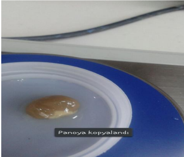
Şekil 3. Bilateral böbrek diseksiyonu.

Bütün ratların diseksiyon öncesi vücut ağırlıkları tartıldı ve kayıt altında tutuldu. Ratlara 50 mg/kg Ketamin HCL ve 10 mg/kg Ksilazin HCL intramuskuler (IM) olacak şekilde anesteziye alındı (Tapısız ve Özat, 2009; Erdem ve ark., 2014). Servikal dislokasyon ile sakrifiye edilerek bilateral böbrekleri çıkarıldı. Çıkarılan organ ağırlıkları kayıt altına alındı.