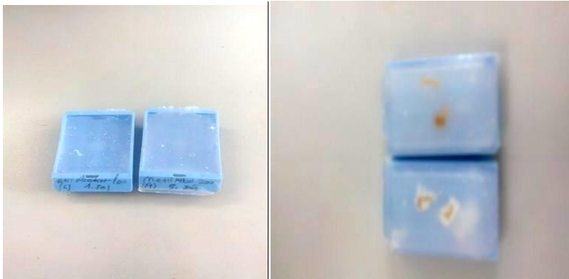
Şekil 4. Parafine gömülmüş kesit alma işlemine hazır bir doku örneği.

Sağ ve sol böbrekler rutin histolojik doku takip işlemlerinden geçirilerek parafine gömüldü ve parafin blokları hazırlandı.