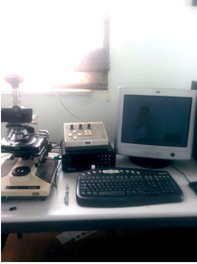
Şekil 5. Sayımda kullanılan fotoğraf ataşmanı ilave edilmiş mikroskop (Olympus BH2- Japon).

Parafin bloğundan rotary mikrotomla 5 µm kalınlığında ardışık kesitler alındı. Bir hayvandan ortalama 200 kesit olacak şekilde kesitler arasında rastgele bir tanesinden başlanarak ve onun ardından gelen her 5. kesit ve yanına yedeği alınarak sistematik ve rastgele bir şekilde 1/5 oranında örnekleme yapıldı. Elde edilen tüm kesitler sırayla numaralandırıldı ve jelatinli lama çekilerek kuruması beklendi. Kuruduktan sonra lamlar 60 derece ısıda bir gün etüvde bekletildi. Kesitler deparafinize edildi. Böbreklerin en iyi şekilde görüntülenebildiği boyama şekli olan hematoxylen boyama işlemine tabi tutuldu. Lamlar Entellan (Merck) aracılığıyla lamelle kapatıldı. Boyalı kesitlerin değerlendirilmesinde fotoğraf ataşmanlı Olympus BH-2 (KHW10X/20L) ışık mikroskobu kullanıldı ve sonuçlar karşılaştırıldı.