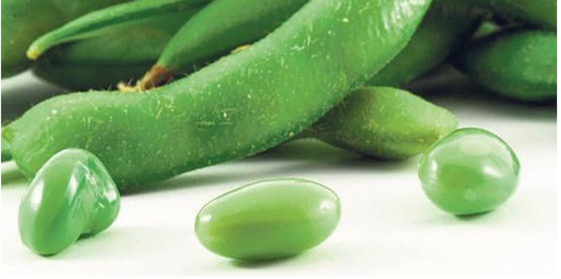
Şekil 1. Soya bitkisinin resmi

Ayrıca, soya ürünlerinin kanser, kemik erimesi (osteoporoz), böbrek hastalıkları gibi kronik hastalıkları önleyici veya tedavi edici ve menopoz rahatsızlıklarını azaltıcı etkisi olduğu da belirtilmiştir (Garcia ve dig., 1997; FDA, 1999). Sarılık ve ödemin tedavisinde bitkisel bir ilaç olarak kullanılmıştır. Aynı zamanda böbrek ve dalak fonksiyonlarını etkileyerek enürezis tedavisinde kullanılmıştır (Fukuda et al. 2011). Soya fasüyesinin kardiyovasküler hastalıkların insidansını ve trombosit agregasyonunu azalttığı (Arjmandı et al. 1996; Yıldırım ve Tokgözoğlu, 2001; Kamiloğlu ve ark., 2002; Büyüktuncer ve Başaran, 2005; Okwu et al. 2007; Xiao, 2008; Byun ve Lee, 2010; Sosic et al. 2011), hafıza güçlendirici etkiye sahip olduğu, menopoz döneminde hormonal denge, diyabet ve böbrek yetmezliğinde olumlu etkilerinin bulunduğu (Tham et al. 1998; Albert et al. 2002; Naciff et al. 2002; Şahingöz ve Arlı, 2002; Anaç, 2003; Kim et al. 2006; Aydın, 2007; Ünsal ve Sarıyar, 2008; Byun ve Lee, 2010; Modaresi et al. 2011; Ponnusha et al. 2011) kadınlarda ani ateş basması, uykusuzluk, migren, eklem ağrıları gibi semptomların tedavisinde kullanılabildiği (Başer, 2002) pek çok çalışmada gösterilmiştir. Soya ve ürünleri hormon replasman tedavisi (HRT) ile ilişkili risk olmaksızın doğal bir alternatif ürün olarak piyasada yer almaktadır (Allred et al. 2001).