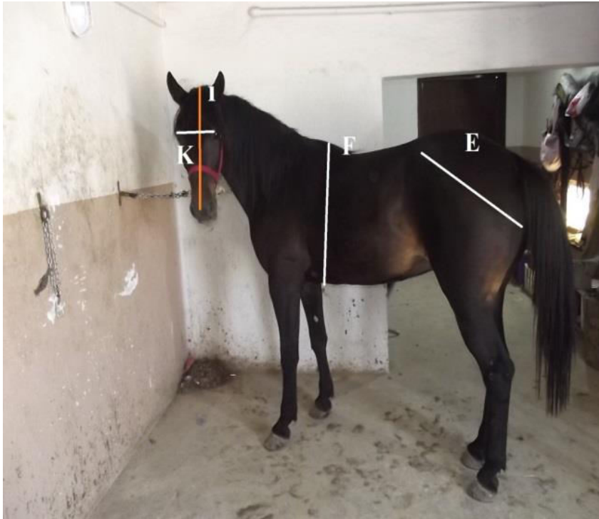
Şekil 2. 2. Vücut ölçüleri ve alındığı yerlerin fotoğraf üzerinde gösterilmesi.