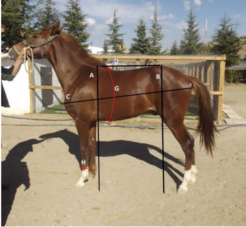
Şekil 2.1. Vücut ölçüleri ve alındığı yerlerin fotoğraf üzerinde gösterilmesi.