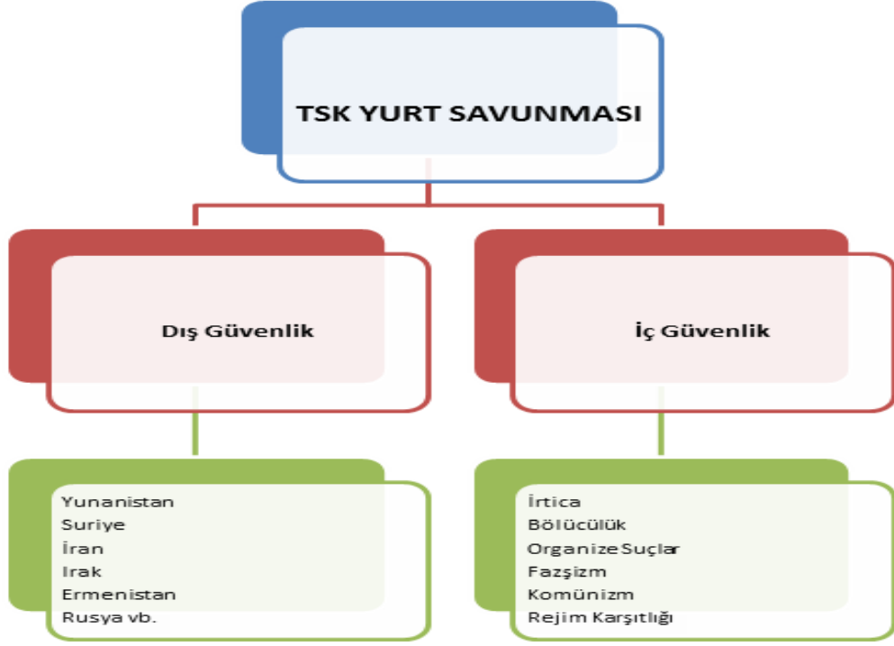
Şekil 2.1. TSK Yurt Savunması