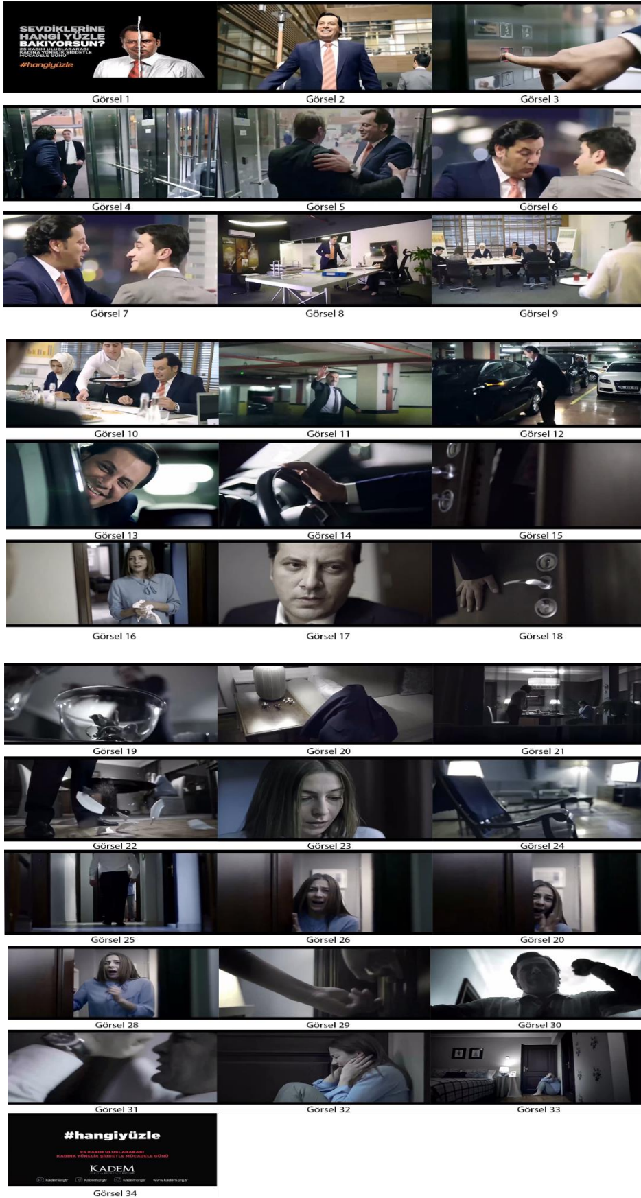
Resim 3. “Hangi Yüzle” kamu spotundan kareler