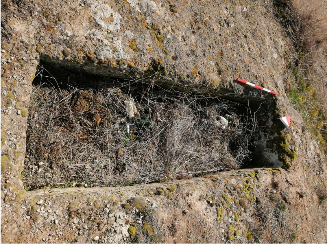
Şekil 35. Yumrukaya Nekropolisi Mezar 33

Basit khamosorion tipindeki mezar, YMK Nekropolünün kuzeydoğusunda kayalık arazinin yer seviyesinde bulunmaktadır. Kuzeybatı-güneydoğu doğrultusunda uzanmıştır. Mezar Roma Dönemine tarihlenmekle birlikte Phryg ve Phryg öncesi de kullanıldığı tahmin edilmektedir.