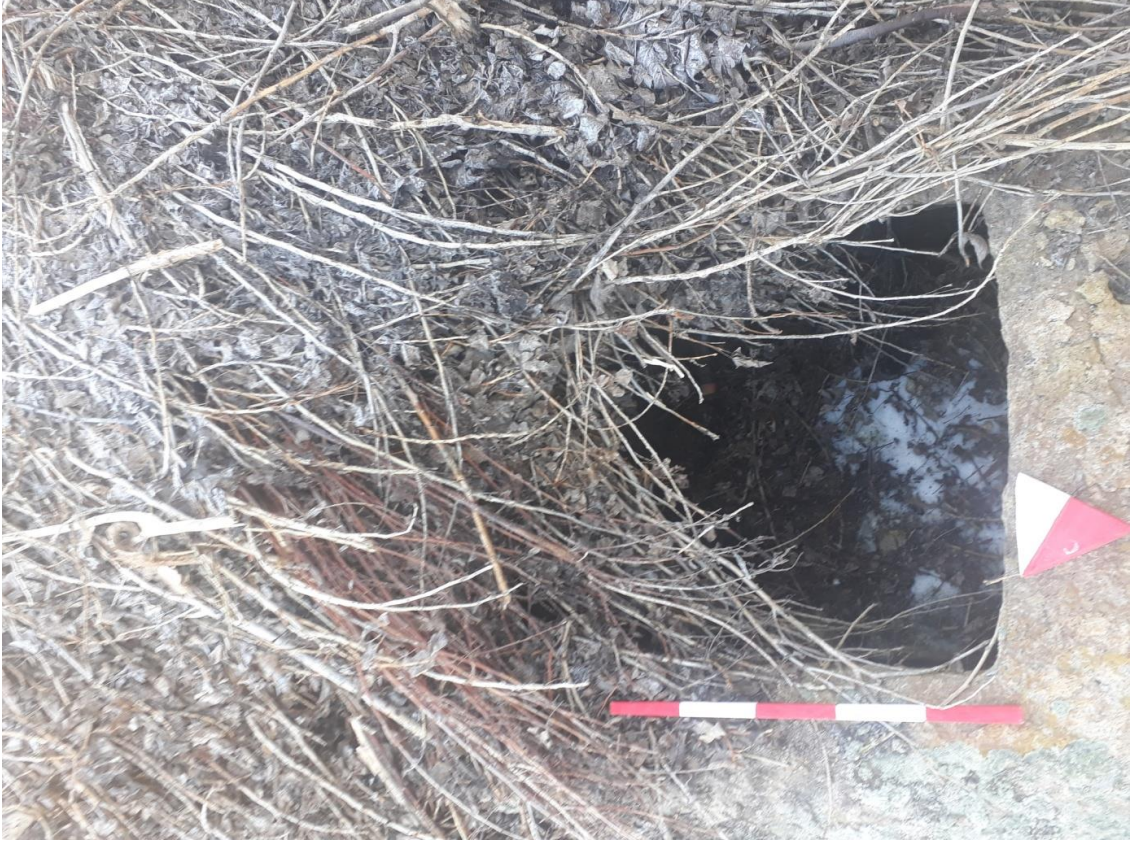
Şekil 82. Merkez Nekropolisi Mezar 3

Basit khamosorion tipindeki mezar, kuzeybatı-güneydoğu yönünde uzanmaktadır.