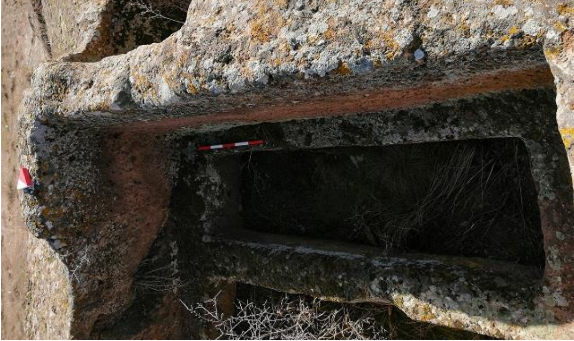
Şekil 11. Yumrukaya Nekropolisi Mezar 9

Basit khamosorion tipindeki mezar, YMK Nekropolünün kuzeydoğusunda yer almaktadır. Kuzeybatı-güneydoğu doğrultusunda uzanmıştır. Mezar Roma Dönemine tarihlenmekle birlikte Phryg ve Phryg öncesi de kullanıldığı tahmin edilmektedir.