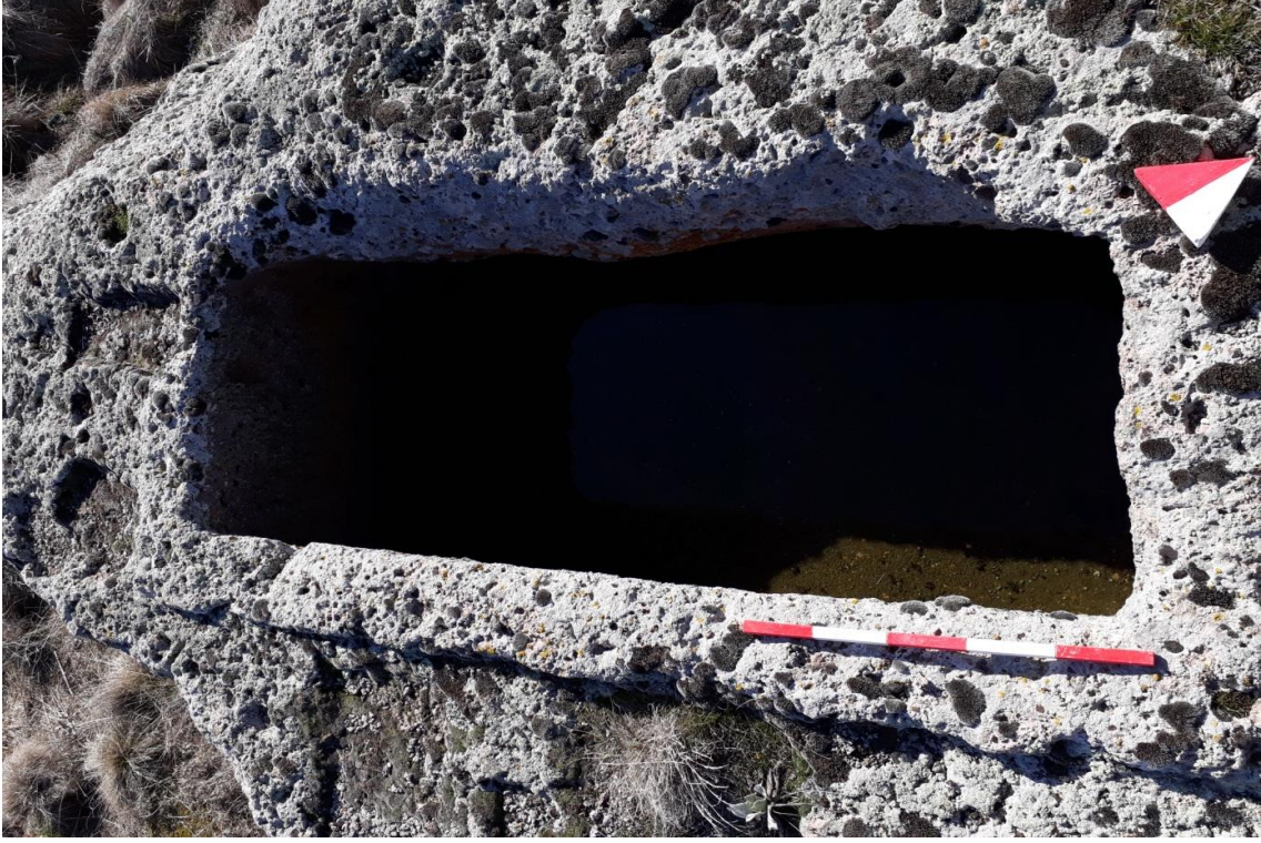
Şekil 54. Köy Mezarlığı Nekropolisi Mezar 1

Bu mezarın tipi kabaca anakayanın dikdörtken tarzında oyularak düzgün bir çukur meydana getirilmesi şeklinde tanımlanan Basit Khamosorion 'dur. Kuzeydoğu-güneybatı yönünde uzanan mezar, Nekropolisin güneybatısında bulunmaktadır.