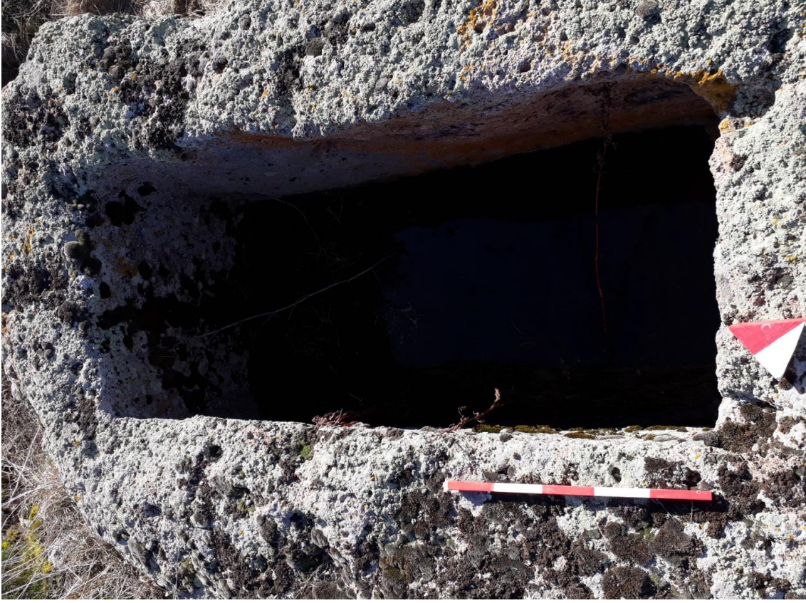
Şekil 63. Köy Mezarlığı Nekropolisi Mezar 10

Basit khamosorion tipindeki mezar, Nekropolisin, güneybatısında yer almaktadır. Mezar, kuzeybatı-güneydoğu yönünde uzanmaktadır.