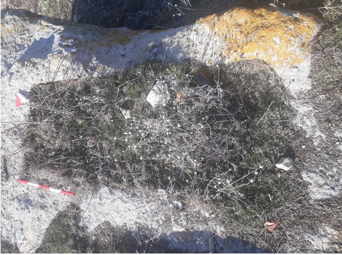
Şekil 81. Merkez Nekropolisi Mezar 2

Basit khamosorion tipinde düzenlenen mezar, doğu-batı doğrultusunda uzanmıştır.