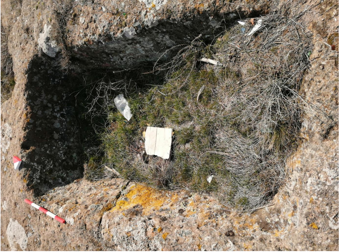
Şekil 25. Yumrukaya Nekropolisi Mezar 23

Basit khamosorion tipindeki mezar, YMK Nekropolünün kuzeydoğusunda kayalık arazinin yer seviyesinde bulunmaktadır. Kuzeybatı-güneydoğu doğrultusunda uzanmıştır. Mezar Roma Dönemine tarihlenmekle birlikte Phryg ve Phryg öncesi de kullanıldığı tahmin edilmektedir.