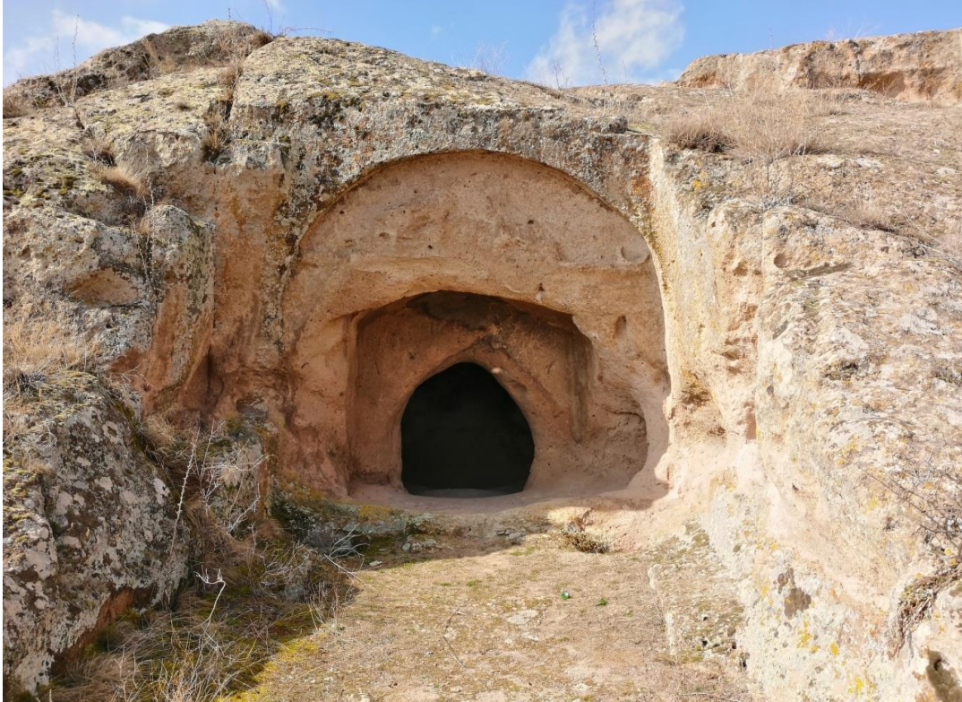
Şekil 50. Yumrukaya Nekropolisi Oda Mezar 2

Coğrafi Konumu: Enlem: 39.047747°; Boylam: 30.473168°; Yükselti: 1106 m