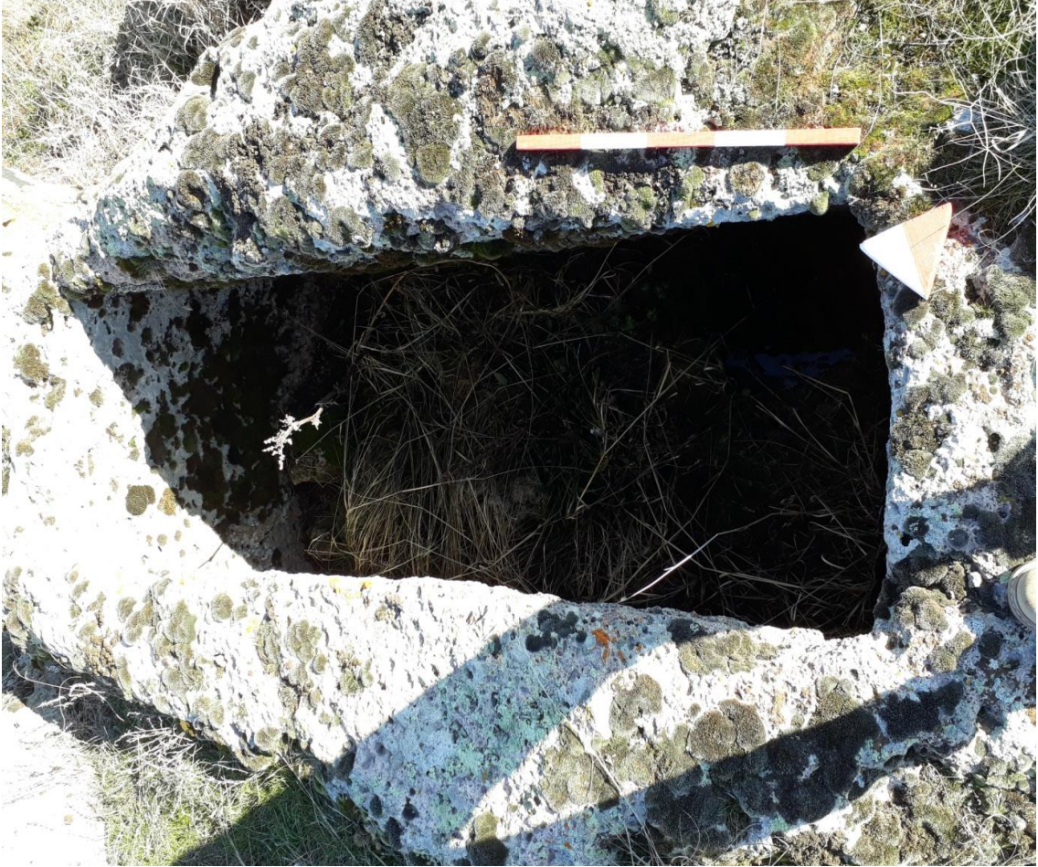
Şekil 61. Köy Mezarlığı Nekropolisi Mezar 8

Basit khamosorion tipindeki mezar, Nekropolisin, güneybatısında yer almaktadır. Mezar, kuzeydoğu-güneybatı yönünde uzanmaktadır.