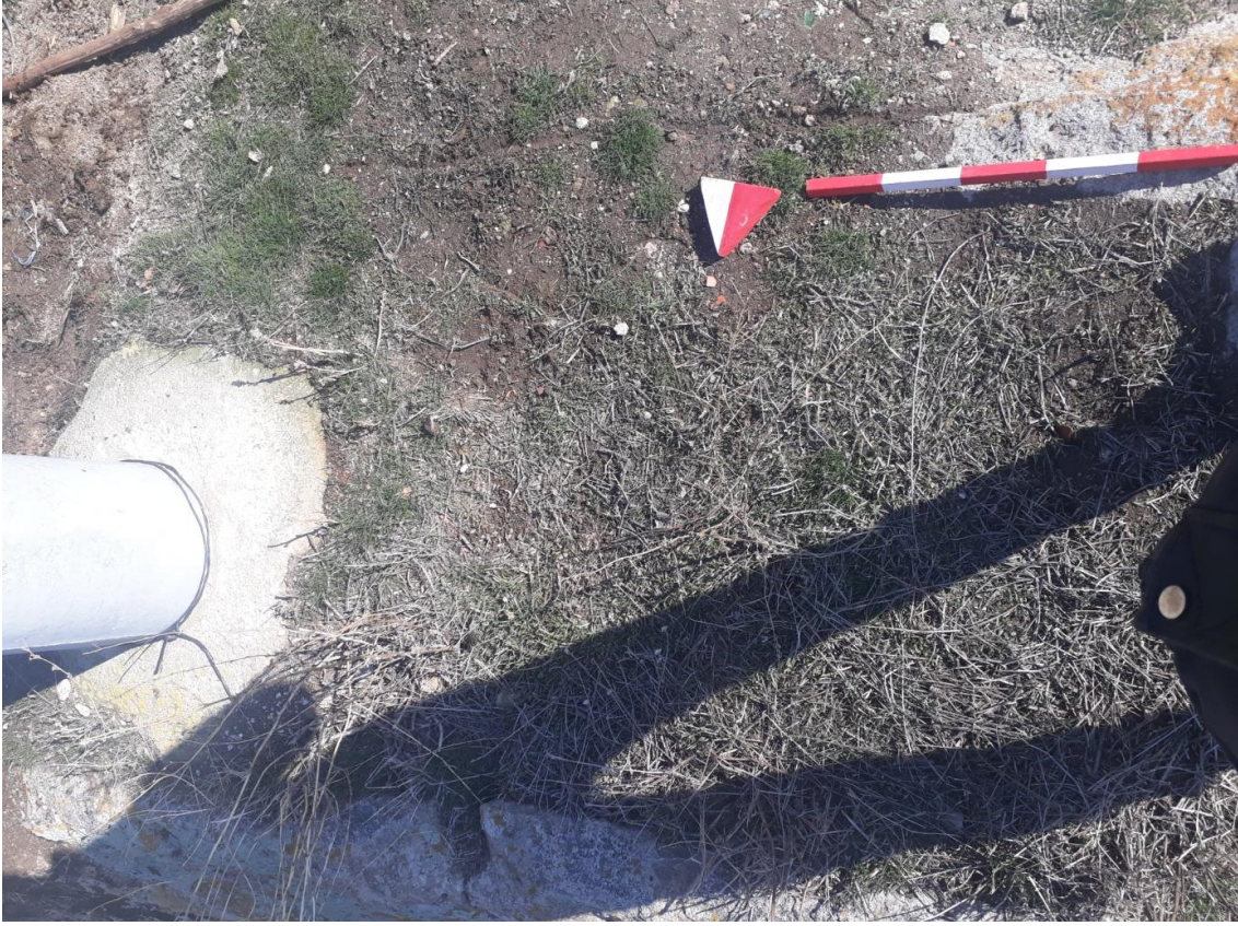
Şekil 84. Merkez nekropolisi Mezar 5

Basit khamosorion tipindeki mezar, kuzeydoğu-güneybatı yönünde uzanmaktadır. Günümüzde mezarın bir uzun kenarı ve bir kısa kenarı neredeyse tamamen tahrip olmuştur. Ayrıca mezarın içine elektrik direği oturtulmuştur.