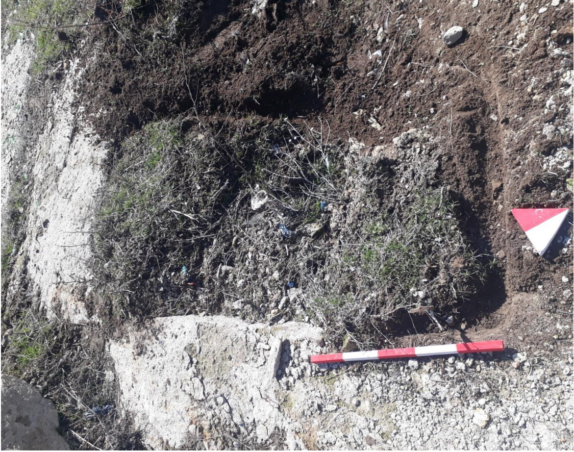
Şekil 86. Merkez Nekropolisi Mezar 7

Basit khamosorion tipindeki mezar, kuzey-güney yönünde uzanmaktadır.