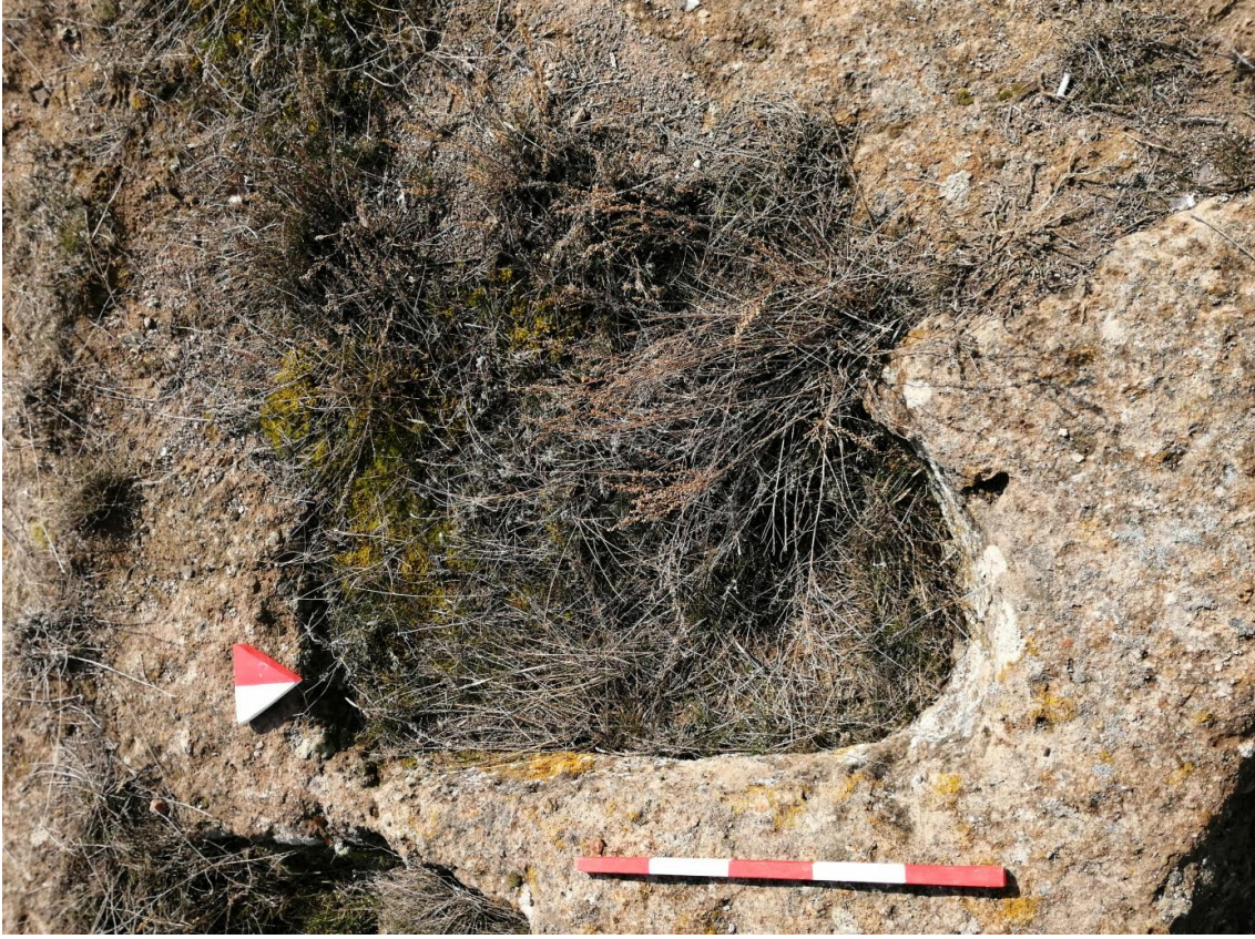
Şekil 26. Yumrukaya Nekropolisi Mezar 24

Basit khamosorion tipindeki mezar, YMK Nekropolünün kuzeydoğusunda kayalık arazinin yer seviyesinde bulunmaktadır. Kuzeybatı-güneydoğu doğrultusunda uzanmıştır. Mezar Roma Dönemine tarihlenmekle birlikte Phryg ve Phryg öncesi de kullanıldığı tahmin edilmektedir.