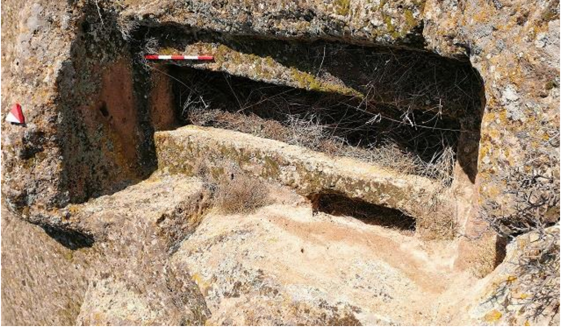
Şekil 8. Yumrukaya Nekropolisi Mezar 6

Basit khamosorion tipindeki mezar, YMK Nekropolünün güneydoğusunda yer almaktadır. Kuzeybatı-güneydoğu doğrultusunda uzanmıştır. Mezar Roma Dönemine tarihlenmekle birlikte Phryg ve Phryg öncesi de kullanıldığı tahmin edilmektedir.