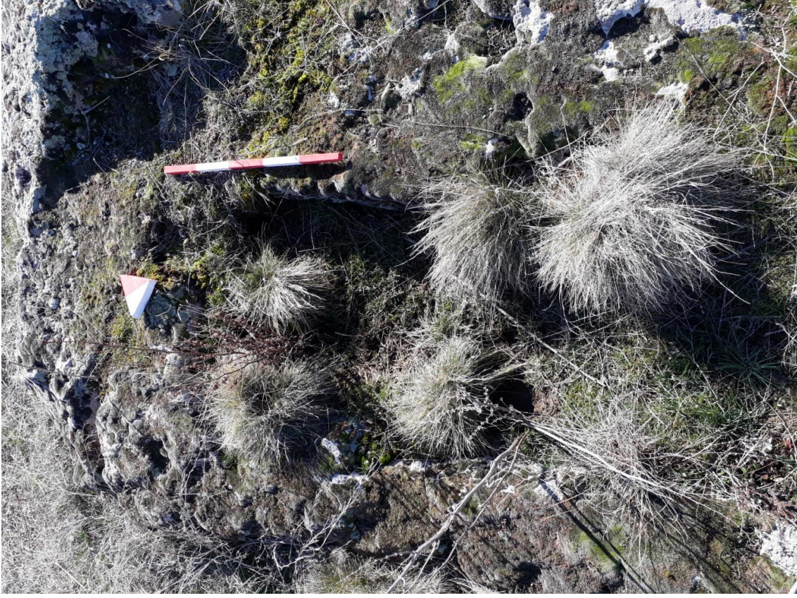
Şekil 59. Köy Mezarlığı Nekropolisi Mezar 6

Basit khamosorion tipindeki mezar, Nekropolisin, güneybatısında yer almaktadır. Mezar, kuzeydoğu-güneybatı yönünde uzanmaktadır.