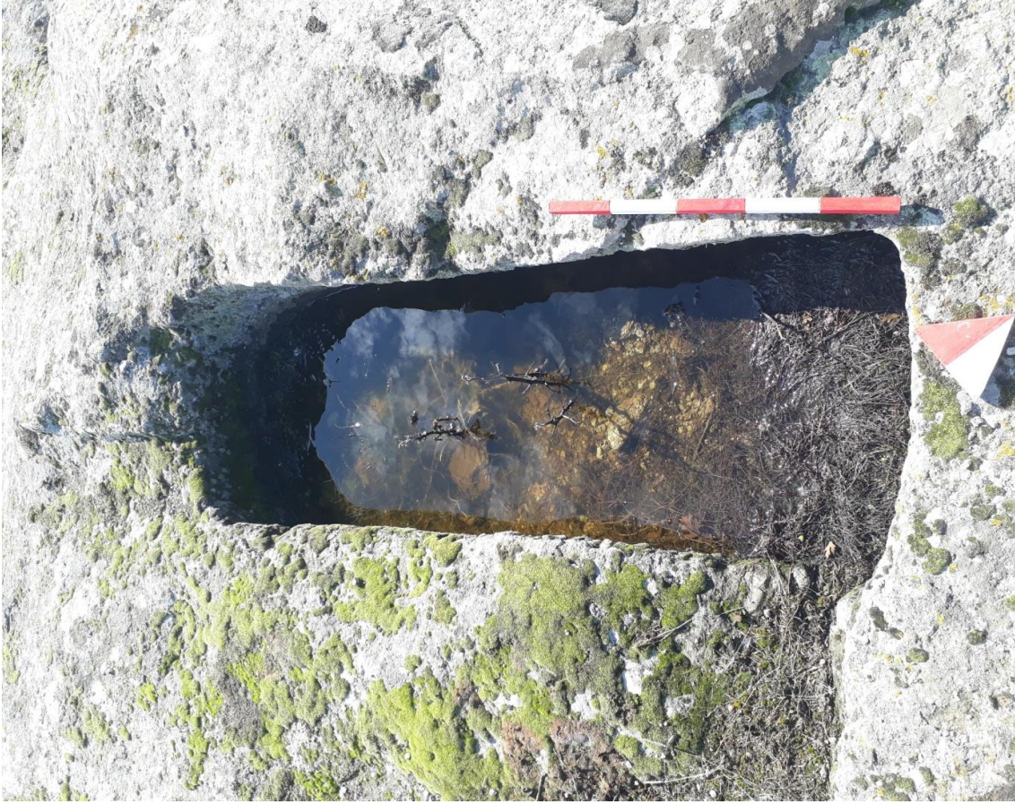
Şekil 69. Karaçayır Nekropolisi Mezar 2

Basit khamosorion tipindeki mezar, Karaçayır Nekropolisinin güneybatısında yer almaktadır. Mezar, kuzeydoğu-güneybatı yönünde uzanmaktadır.