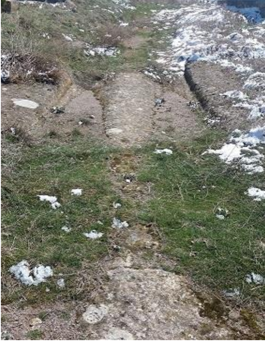
Şekil 105. Köy Mezarlığı Antik Yolu

Antik yol, Köy Mezarlığı Nekropolisinin güneybatı köşesinde yer almaktadır. Antik Yolun 360 m batısında Merkez Neropolisi ve 480 m kuzeydoğusunda Yumrukaya Nekropolisi bulunmaktadır.