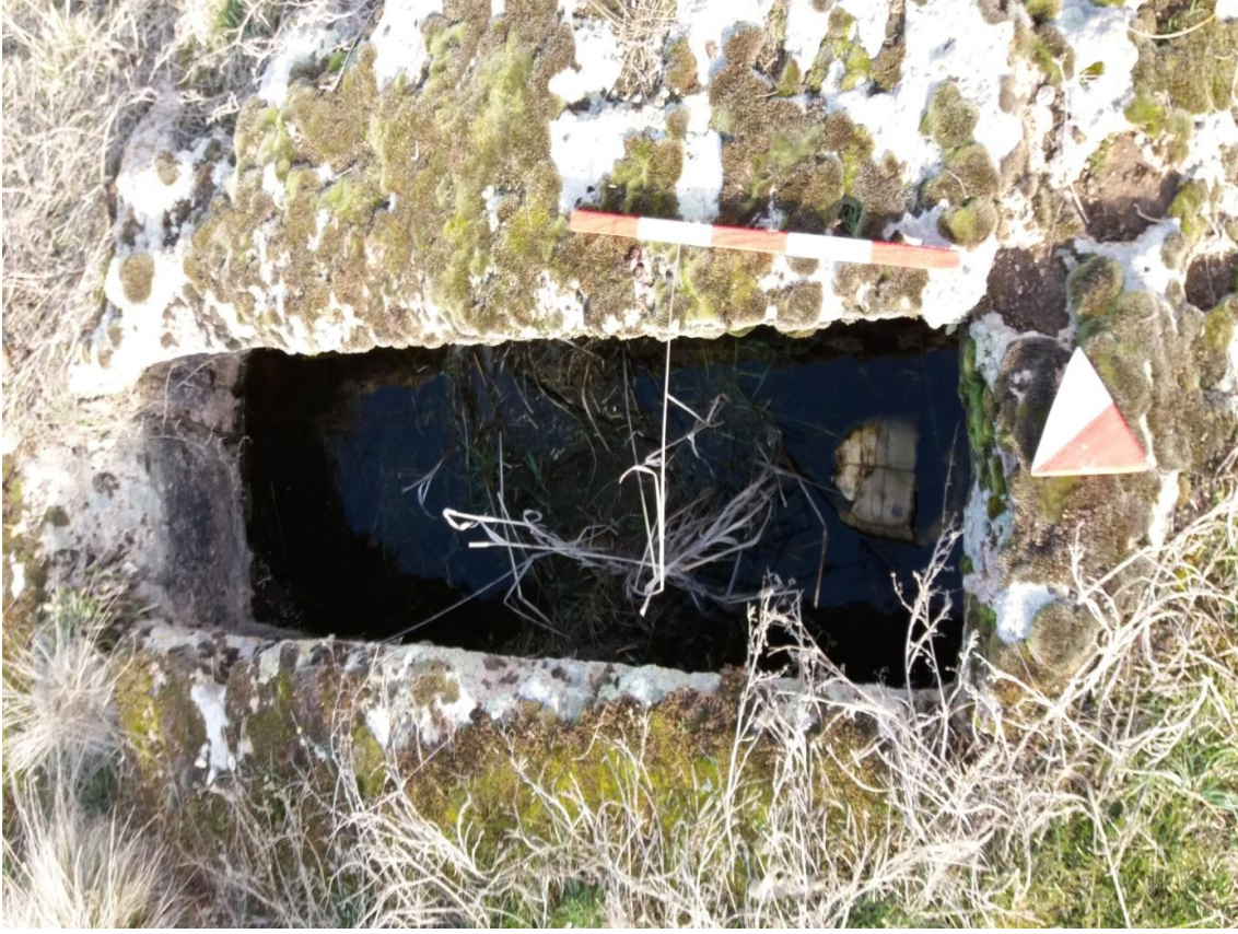
Şekil 60. Köy Mezarlığı Nekropolisi Mezar 7

Basit khamosorion tipindeki mezar, Nekropolisin, güneybatısında yer almaktadır. Mezar, kuzeydoğu-güneybatı yönünde uzanmaktadır.