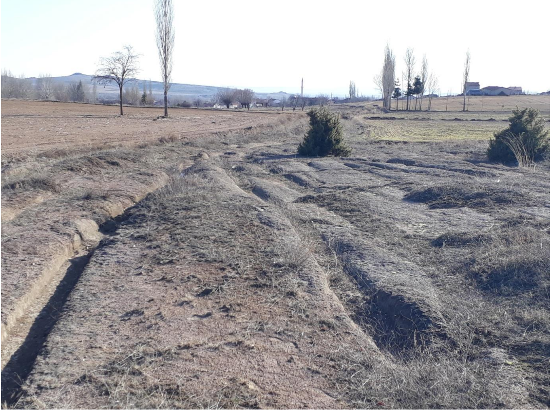
Şekil 89. Tavşan Düşen Antik Yolu

Tescilli Tavşan Düşen Antik Yolu köy merkezinden (Muhtarlık) 1,5 km kuzeydoğudadır. Tescilli Tavşan Düşen Antik Yolundan 650 m doğu yönüne gidildiğinde Çanaklı Antik Yolu 1 ve 2 ile yolun kesiştiği görülmektedir.