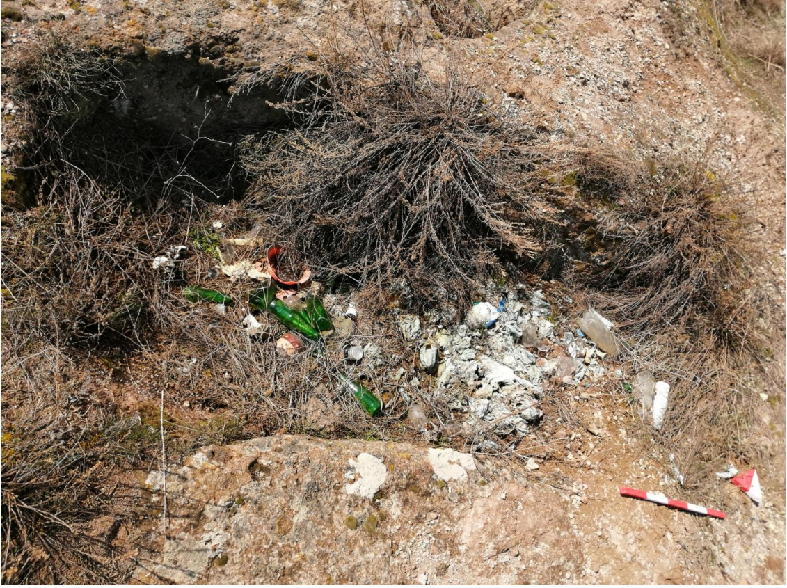
Şekil 36. Yumrukaya Nekropolisi Mezar 34

Basit khamosorion tipindeki mezar, YMK Nekropolünün kuzeydoğusunda kayalık arazinin yer seviyesinde bulunmaktadır. Doğu-batı doğrultusunda uzanmıştır. Mezar Roma Dönemine tarihlenmekle birlikte Phryg ve Phryg öncesi de kullanıldığı tahmin edilmektedir.