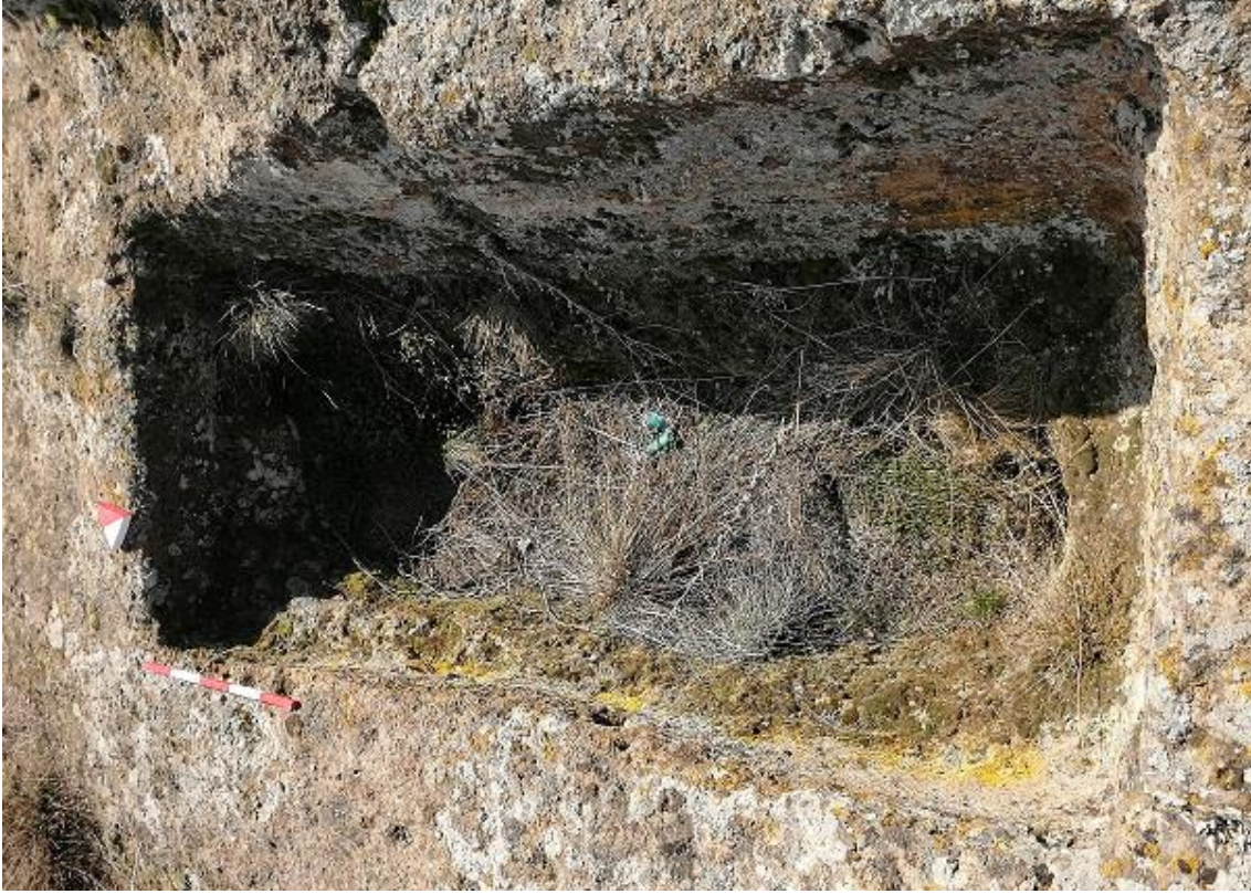
Şekil 23. Yumrukaya Nekropolisi Mezar 21

Basit khamosorion tipindeki mezar, YMK Nekropolünün kuzeydoğusunda kayalık arazinin yer seviyesinde bulunmaktadır. Mezarlar genel anlamda kuzeybatı-güneydoğu doğrultusunda sıralanmıştır. Güneyden başlayarak ilk mezar Kuzeybatı-güneydoğu doğrultusunda uzanmıştır. Mezar Roma Dönemine tarihlenmekle birlikte Phryg ve Phryg öncesi de kullanıldığı tahmin edilmektedir.