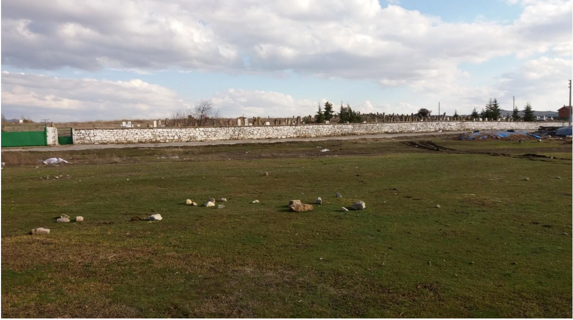
Şekil 53. Köy Mezarlığı Nekropolisi

Beyköy Mezarlığı, Beyköy merkezinin (Muhtarlık) 267 m güneydoğusunda yer alır. Etrafı 780 m'lik bir duvarla çevrilen Mezarlık 34.504. 42 m 2 'lik bir alana sahiptir. Köy Mezarlığınının 375 m kuzeydoğusunda Yumrukaya Nekropolisi yer almaktadır.