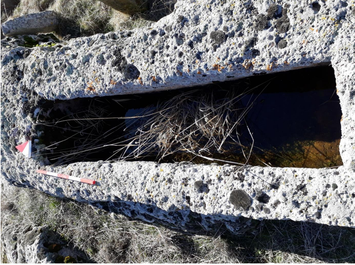
Şekil 58. Köy Mezarlığı Nekropolisi Mezar 5

Basit khamosorion tipindeki mezar, Nekropolisin, güneybatısında yer almaktadır. Mezar, doğu-batı yönünde uzanmaktadır.