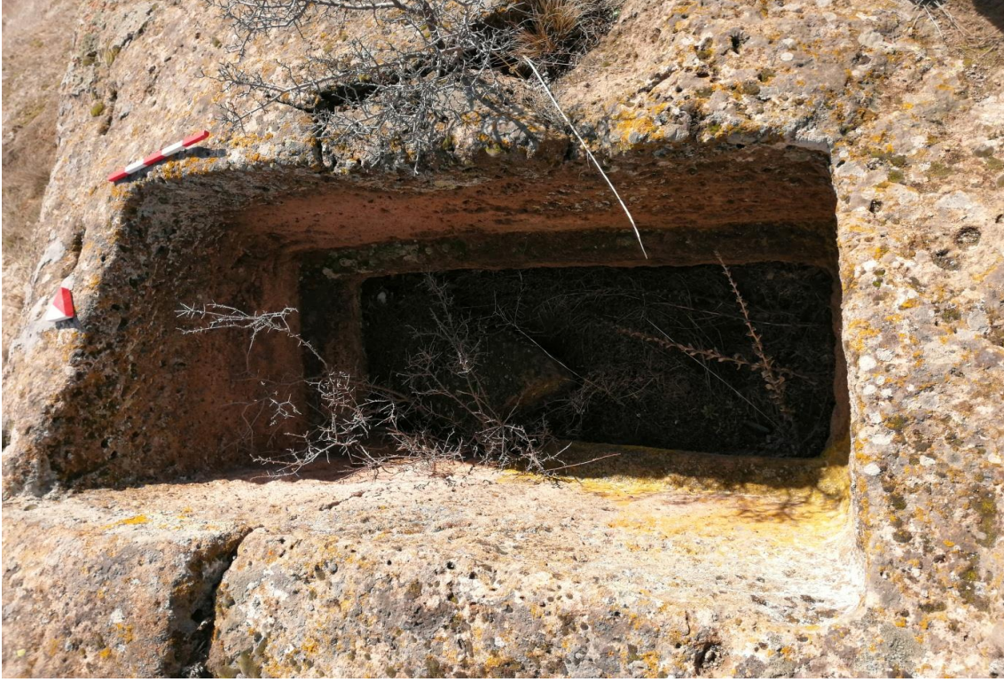
Şekil 5. Yumrukaya Nekropolisi Mezar 3

Basit khamosorion tipindeki mezar, YMK Nekropolünün güneydoğusunda yer almaktadır. Doğu-batı doğrultusunda uzanmıştır. Mezar Roma Dönemine tarihlenmekle birlikte Phryg ve Phryg öncesi de kullanıldığı tahmin edilmektedir.