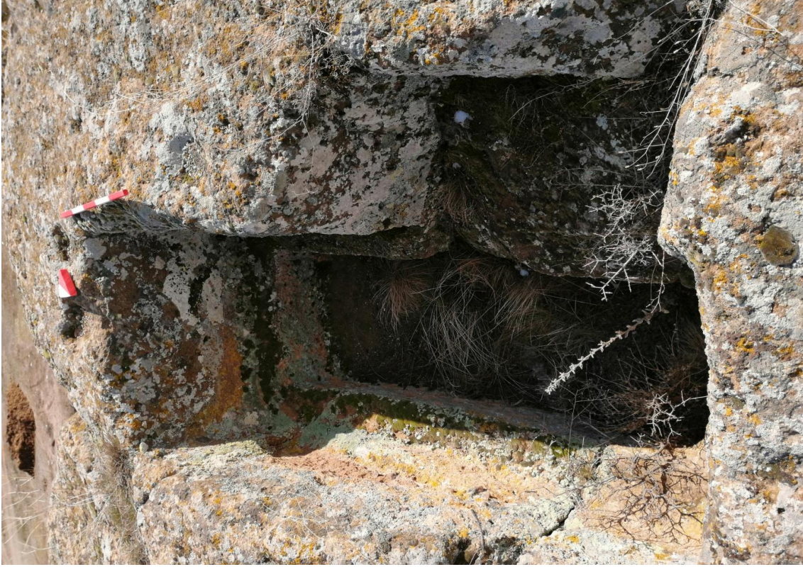
Şekil 14. Yumrukaya Nekropolisi Mezar 12

Basit khamosorion tipindeki mezar, YMK Nekropolünün kuzeydoğusunda yer almaktadır. Doğu-batı doğrultusunda uzanmıştır. Mezar Roma Dönemine tarihlenmekle birlikte Phryg ve Phryg öncesi de kullanıldığı tahmin edilmektedir.