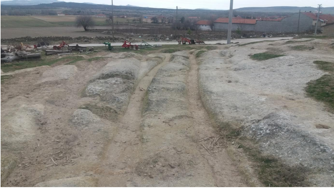
Şekil 91. İğdeler Antik Yolu 2

İğdeler Antik Yolu 2, Köy merkezinin 675 m kuzeyinde yer almaktadır. Beyköy Nekropolünün 125 m kuzeyinde bulunur. Bu Antik yolun kuzeyinde Çanaklı Antik Yolu 1-2 ve Tavşan Düşen Antik yolu vardır.