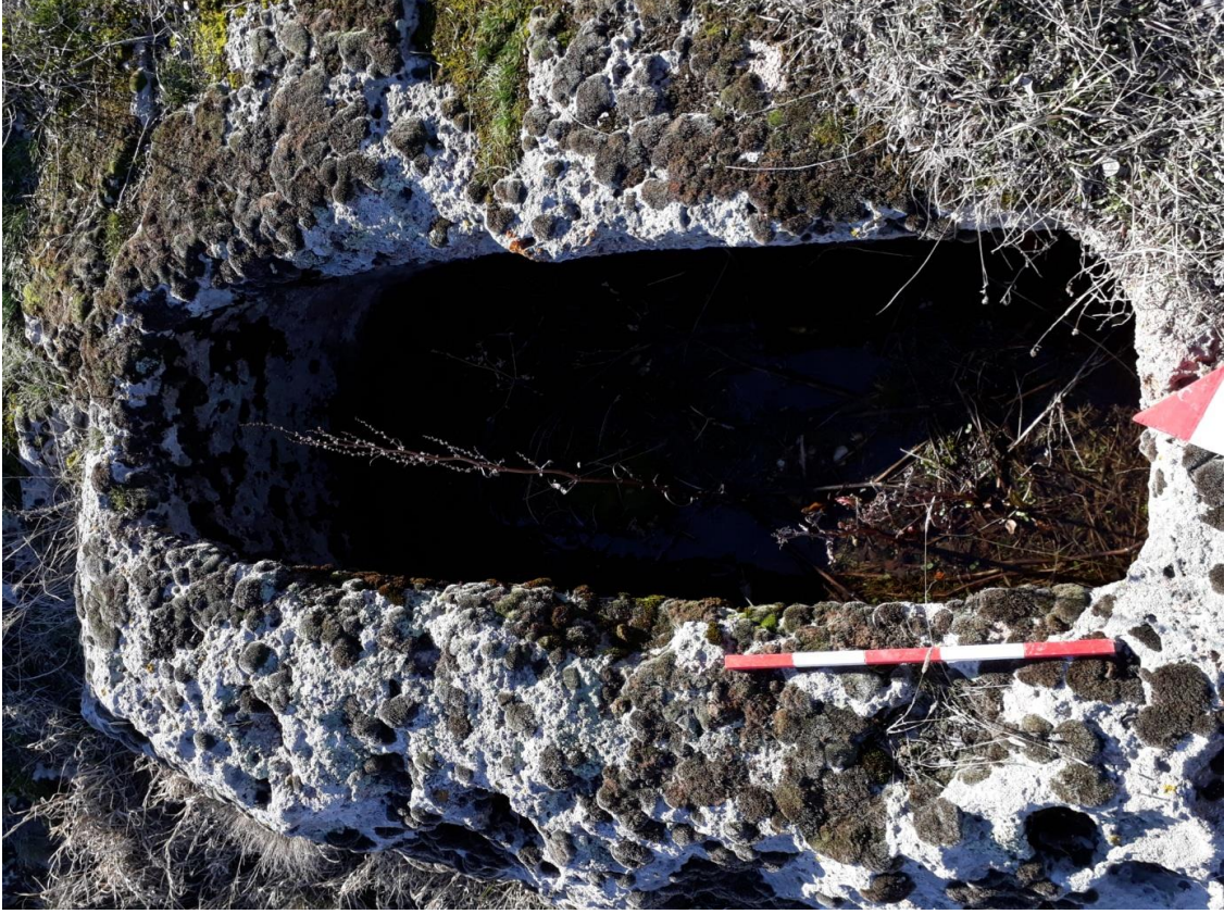
Şekil 62. Köy Mezarlığı Nekropolisi Mezar 9

Basit khamosorion tipindeki mezar, Nekropolisin, güneybatısında yer almaktadır. Mezar, doğu-batı yönünde uzanmaktadır.