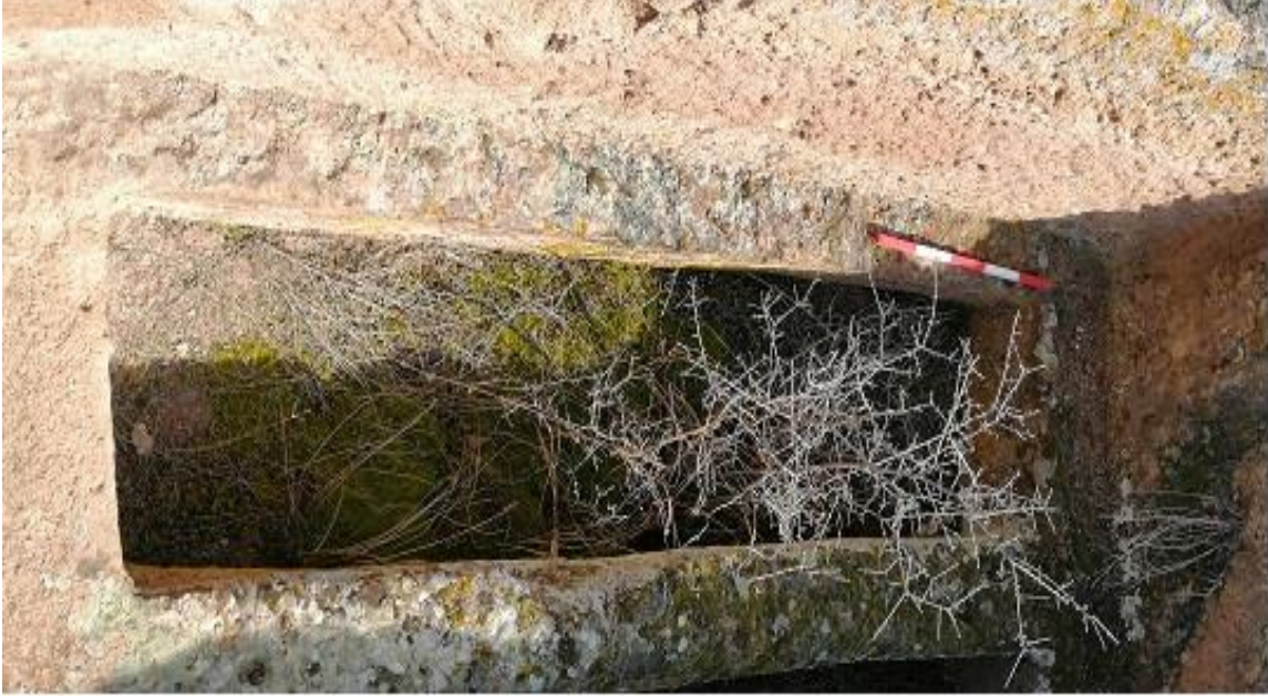
Şekil 12. Yumrukaya Nekropolisi Mezar 10

Basit khamosorion tipindeki mezar, YMK Nekropolünün kuzeydoğusunda yer almaktadır. Kuzeybatı-güneydoğu doğrultusunda uzanmıştır. Mezar Roma Dönemine tarihlenmekle birlikte Phryg ve Phryg öncesi de kullanıldığı tahmin edilmektedir.