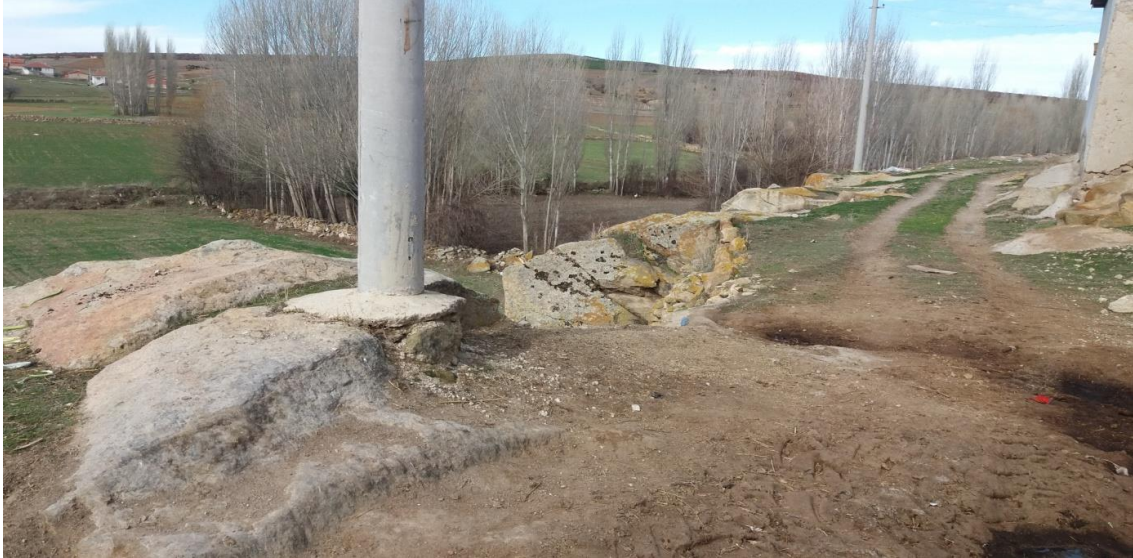
Şekil 79. Merkez Nekropolisi

Merkez Nekropolisi, Köy merkezinden (Muhtarlık) 217 m güneybatı da yer almaktadır. Nekropolisin çevre uzunluğu 161 m ve alanı 1.037. 34 m 2 'dir. Köy mezarlığı Nekropolisi 411 m güney doğusunda kalmaktadır. Karaçayır Nekropolisi de 643 m kuzeyinde yer almaktadır.