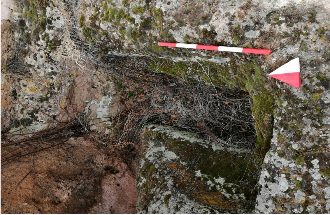
Şekil 46. Yumraya Nekropolisi Mezar 44

Basit khamosorion tipindeki mezar, YMK Nekropolünün kuzeydoğusundaki küçük kayalık kısmın yer seviyesinde bulunmaktadır. Doğu-batı doğrultusunda uzanmıştır. Mezar Roma Dönemine tarihlenmekle birlikte Phryg ve Phryg öncesi de kullanıldığı tahmin edilmektedir.