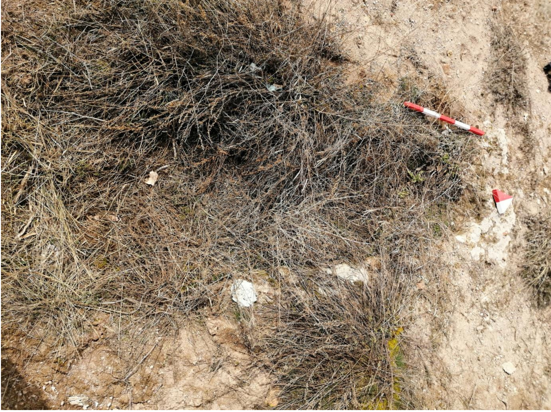
Şekil 42. Yumrukaya Nekropolisi Mezar 40

Basit khamosorion tipindeki mezar, YMK Nekropolünün kuzeydoğusunda kayalık arazinin yer seviyesinde bulunmaktadır. Doğu-batı doğrultusunda uzanmıştır. Mezar Roma Dönemine tarihlenmekle birlikte Phryg ve Phryg öncesi de kullanıldığı tahmin edilmektedir.