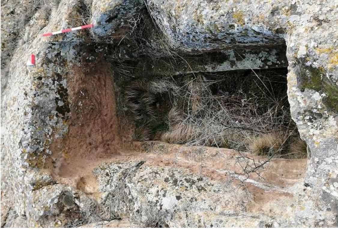
Şekil 18. Yumrukaya Nekropolisi Mezar 16

Basit khamosorion tipindeki mezar, YMK Nekropolünün kuzeydoğusunda yer almaktadır. Doğu-batı doğrultusunda uzanmıştır. Mezar Roma Dönemine tarihlenmekle birlikte Phryg ve Phryg öncesi de kullanıldığı tahmin edilmektedir.