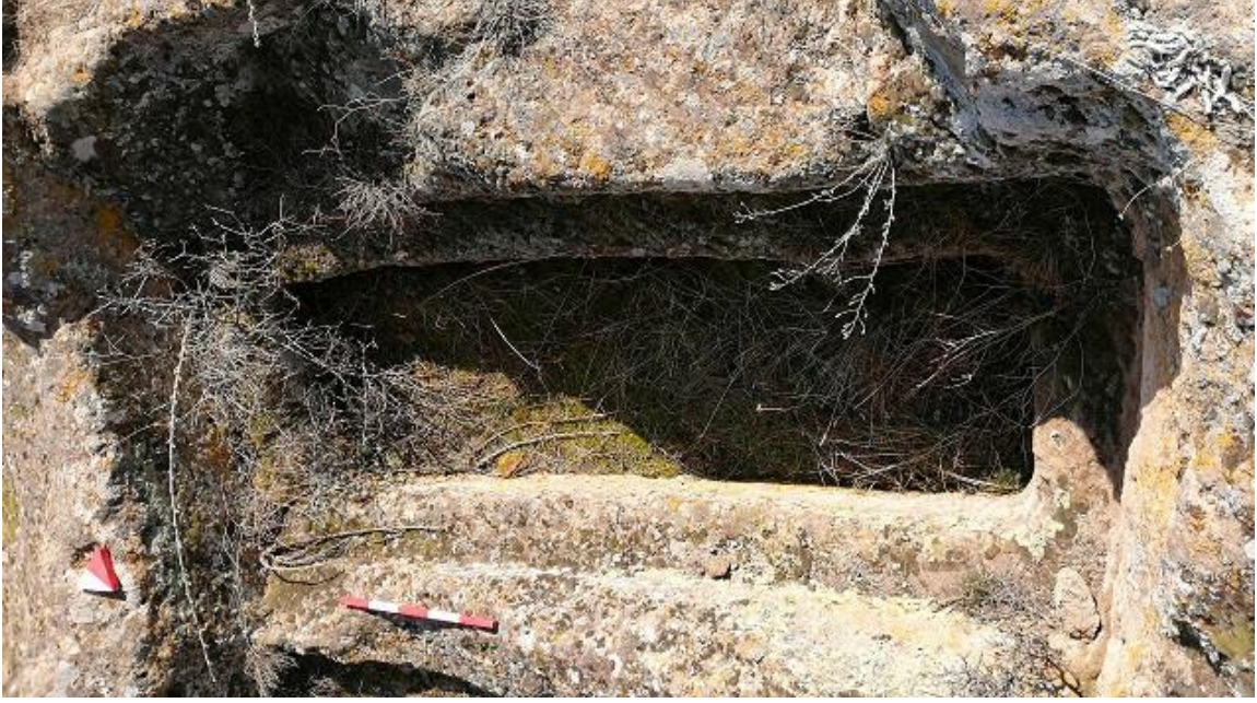
Şekil 7. Yumrukaya Nekropolisi Mezar 5

Basit khamosorion tipindeki mezar, YMK Nekropolünün güneydoğusunda yer almaktadır. Kuzeybatı-güneydoğu doğrultusunda uzanmıştır. Mezar Roma Dönemine tarihlenmekle birlikte Phryg ve Phryg öncesi de kullanıldığı tahmin edilmektedir.