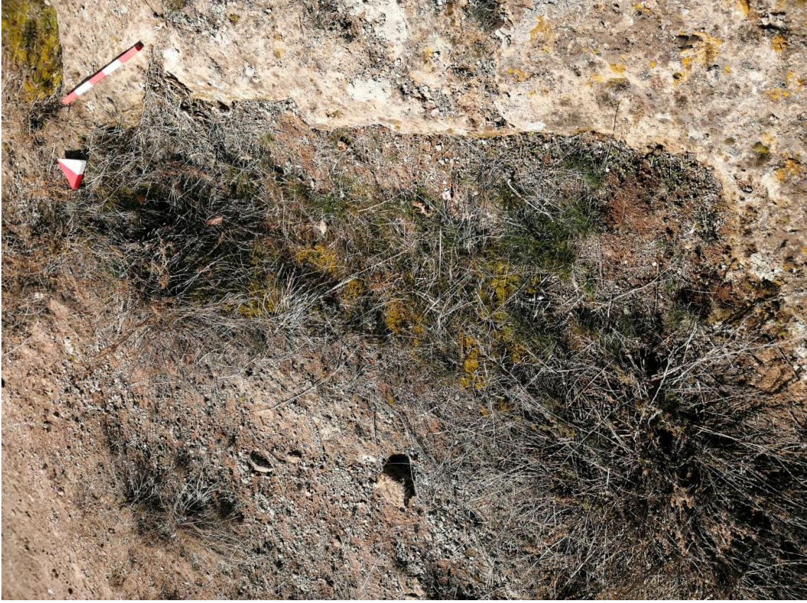
Şekil 34. Yumrukaya Nekropolisi Mezar 32

Basit khamosorion tipindeki mezar, YMK Nekropolünün kuzeydoğusunda kayalık arazinin yer seviyesinde bulunmaktadır. Kuzeybatı-güneydoğu doğrultusunda uzanmıştır. Mezar Roma Dönemine tarihlenmekle birlikte Phryg ve Phryg öncesi de kullanıldığı tahmin edilmektedir.