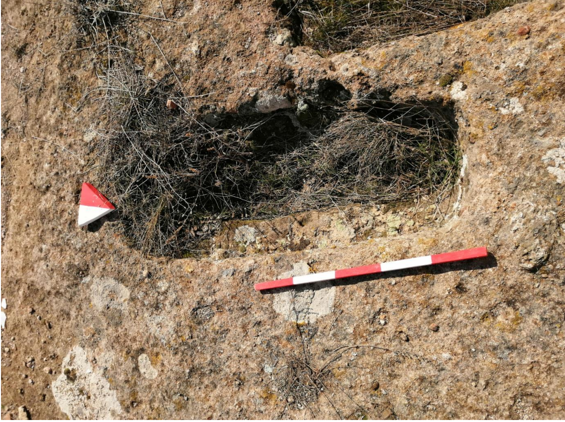
Şekil 27. Yumrukaya Nekropolisi Mezar 25

Basit khamosorion tipindeki mezar, YMK Nekropolünün kuzeydoğusunda kayalık arazinin yer seviyesinde bulunmaktadır. Kuzeybatı-güneydoğu doğrultusunda uzanmıştır. Mezar Roma Dönemine tarihlenmekle birlikte Phryg ve Phryg öncesi de kullanıldığı tahmin edilmektedir.