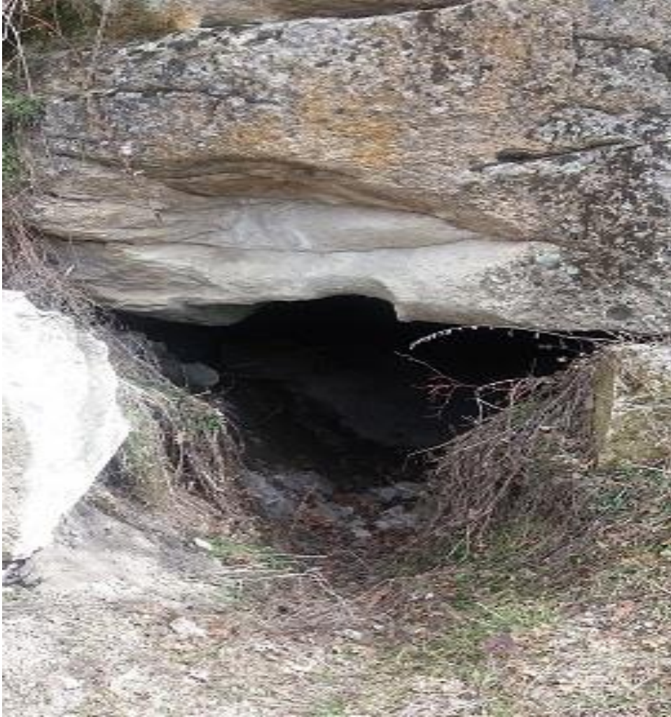
Şekil 75. Karaçayır Nekropolisi Oda Mezar 2 Dış Görünüş

Coğrafi Konumu: Enlem: 39.050569° ; Boylam: 30.463238° ; Yükselti: 1112 m