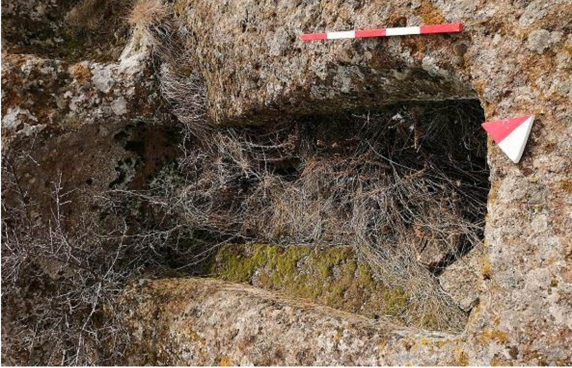
Şekil 45. Yumrukaya Nekropolisi Mezar 43

Basit khamosorion tipindeki mezar, YMK Nekropolünün kuzeydoğusundaki küçük kayalık kısmın yer seviyesinde bulunmaktadır. Doğu-batı doğrultusunda uzanmıştır. Mezar Roma Dönemine tarihlenmekle birlikte Phryg ve Phryg öncesi de kullanıldığı tahmin edilmektedir.