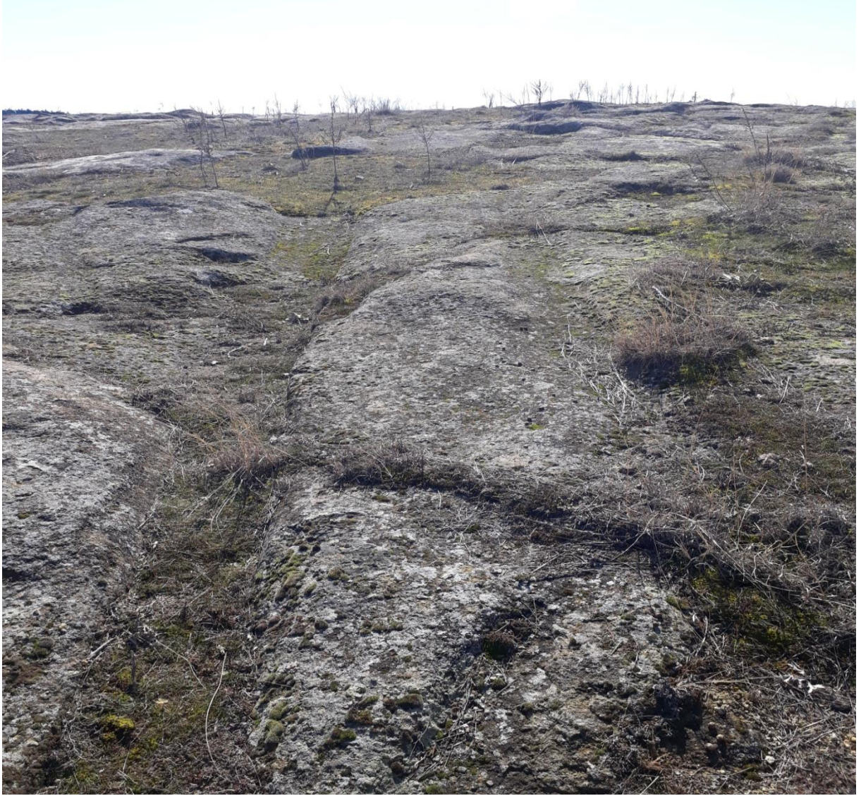
Şekil 93. Karaçayır Antik Yolu 2

Karaçayır Antik Yolu 2, Köy merkezinin (Muhtarlık) 670 m kuzeyinde karaçayır Mevkiinde yer almaktadır. Yol, Karaçayır Antik Yolu 3 ve 4 ile kesişmektedir.