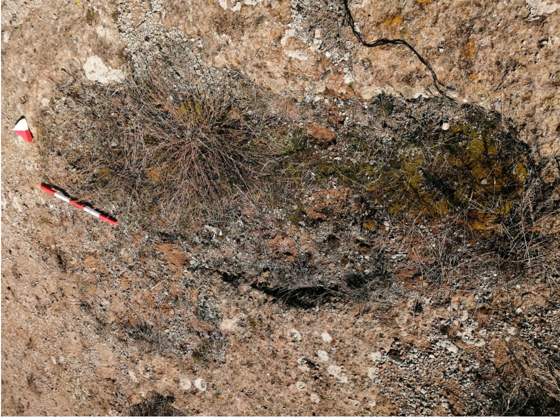
Şekil 33. Yumrukaya Nekropolisi Mezar 31

Basit khamosorion tipindeki mezar, YMK Nekropolünün kuzeydoğusunda kayalık arazinin yer seviyesinde bulunmaktadır. Kuzeybatı-güneydoğu doğrultusunda uzanmıştır. Mezar Roma Dönemine tarihlenmekle birlikte Phryg ve Phryg öncesi de kullanıldığı tahmin edilmektedir.