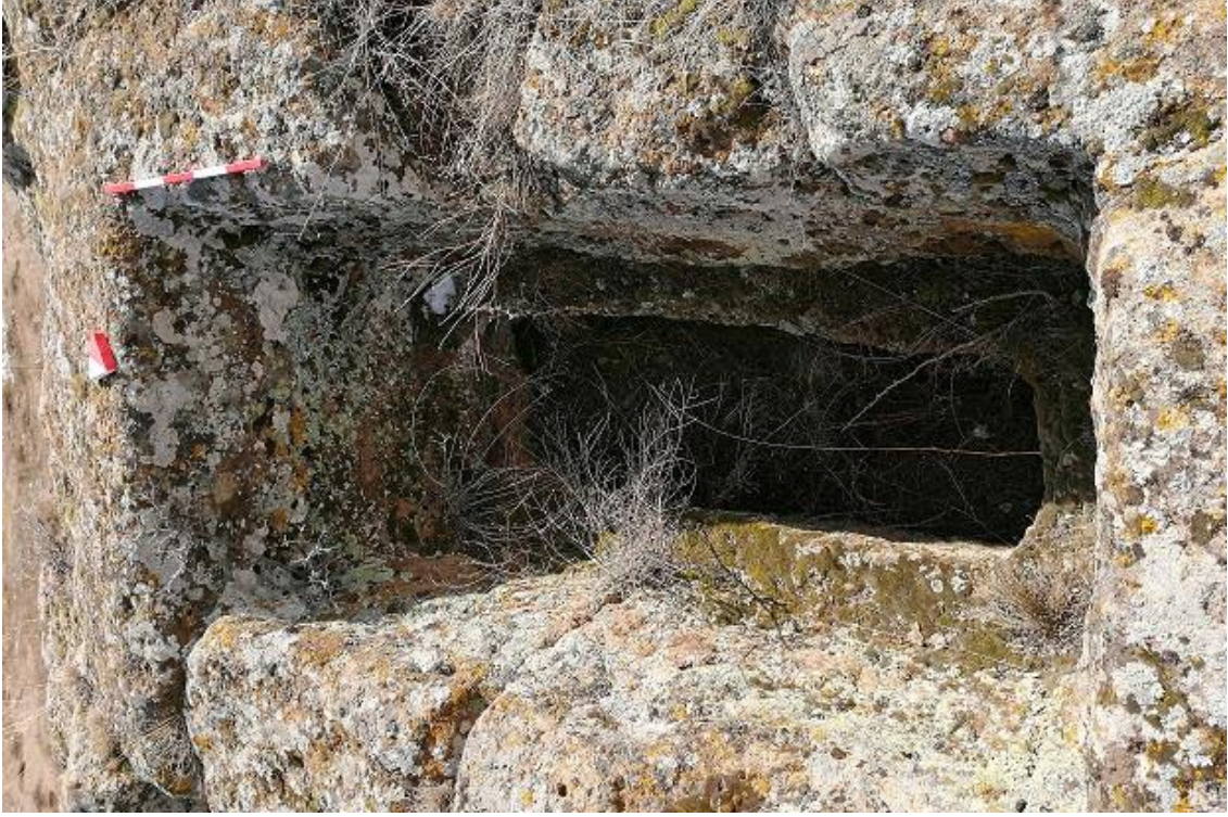
Şekil 15. Yumrukaya Nekropolisi Mezar 13

Basit khamosorion tipindeki mezar, YMK Nekropolünün kuzeydoğusunda yer almaktadır. Doğu-batı doğrultusunda uzanmıştır. Mezar Roma Dönemine tarihlenmekle birlikte Phryg ve Phryg öncesi de kullanıldığı tahmin edilmektedir.