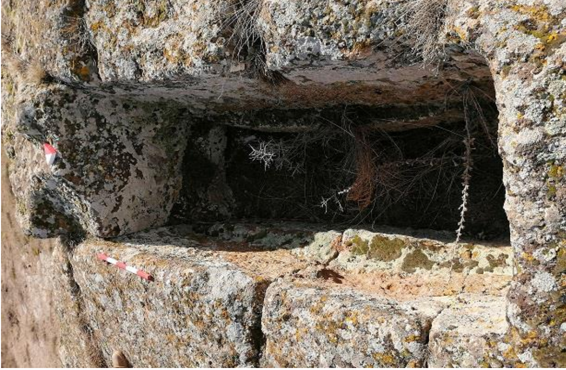
Şekil 16. Yumrukaya Nekropolisi mezar 14

Basit khamosorion tipindeki mezar, YMK Nekropolünün kuzeydoğusunda yer almaktadır. Kuzeybatı-güneydoğu doğrultusunda uzanmıştır. Mezar Roma Dönemine tarihlenmekle birlikte Phryg ve Phryg öncesi de kullanıldığı tahmin edilmektedir.