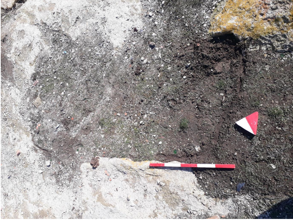
Şekil 87. Merkez Nekropolisi Mezar 8

Basit khamosorion tipindeki mezar, doğu-batı yönünde uzanmaktadır.