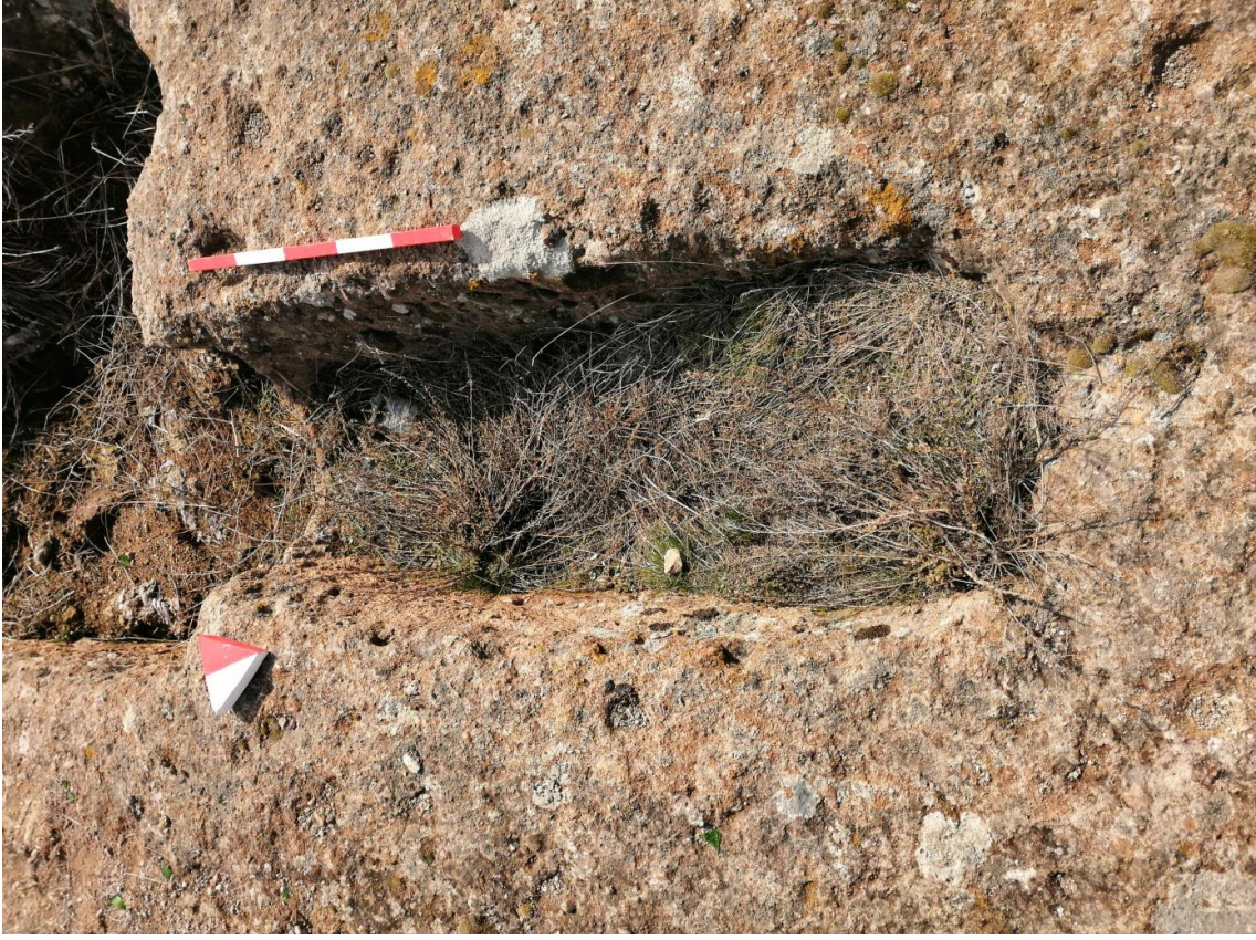
Şekil 30. Yumrukaya Nekropolisi Mezar 28

Basit khamosorion tipindeki mezar, YMK Nekropolünün kuzeydoğusunda kayalık arazinin yer seviyesinde bulunmaktadır. Kuzeybatı-güneydoğu doğrultusunda uzanmıştır. Mezar Roma Dönemine tarihlenmekle birlikte Phryg ve Phryg öncesi de kullanıldığı tahmin edilmektedir.