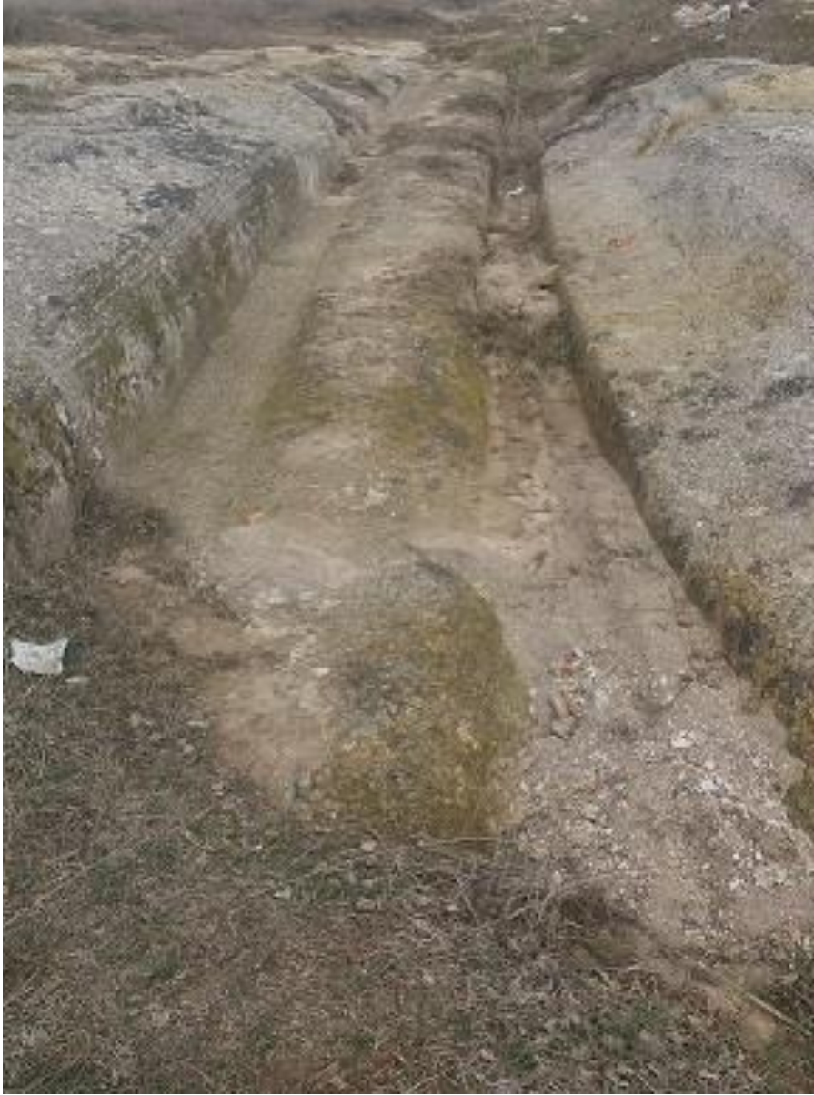
Şekil 102. anaklı Antik Yolu 1

Köy merkezinden 706 m kuzeyde yer alan anaklı Antik Yolu 1, anaklı Mevkii'nde yer almaktadır. Bu yolun 870 m kuzeyinde aynı istikamette Tavşan Düşen Antik Yolu yer almaktadır. Yolun 120 m batısında anaklı Antik Yolu 2 yer almakla birlikte bu yollar kesişmektedir.