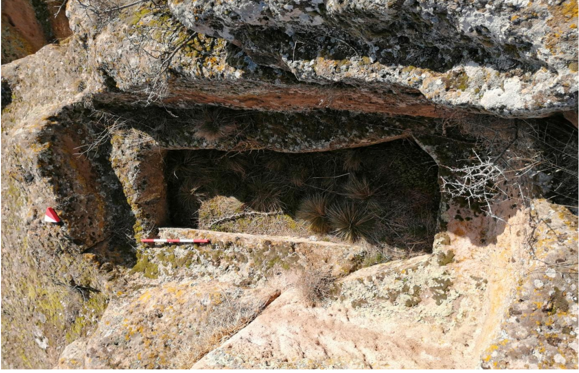
Şekil 9. Yumrukaya Nekropolisi Mezar 7

Basit khamosorion tipindeki mezar, YMK Nekropolünün kuzeydoğusunda yer almaktadır. Kuzeybatı-güneydoğu doğrultusunda uzanmıştır. Mezar Roma Dönemine tarihlenmekle birlikte Phryg ve Phryg öncesi de kullanıldığı tahmin edilmektedir.