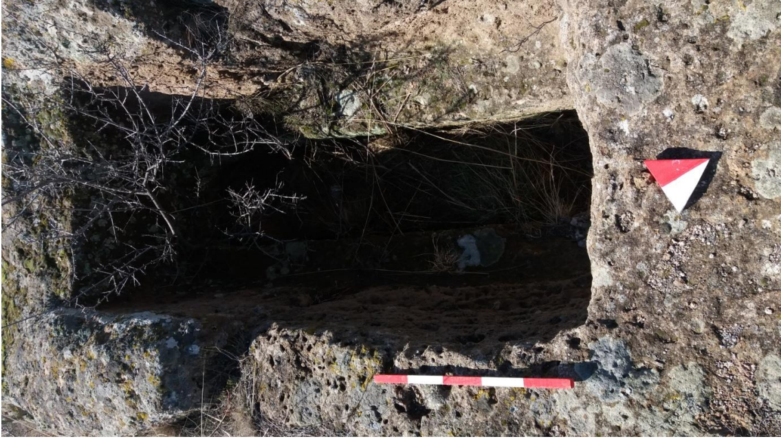
Şekil 3. Yumrukaya Nekropolisi Mezar 1

Bu mezarın tipi kabaca anakayanın dikdörtken tarzında oyularak düzgün bir çukur meydana getirilmesi şeklinde tanımlanan Basit Khamosorion 'dur. Mezarlar YMK Nekropolünün güneyinden başlayarak kuzeye doğru sıralanmışlardır. Güneyden itibaren ilk mezar, doğu-batı doğrultusunda uzanmıştır. Mezar Roma Dönemine tarihlenmekle birlikte Phryg ve Phryg öncesi de kullanıldığı tahmin edilmektedir.