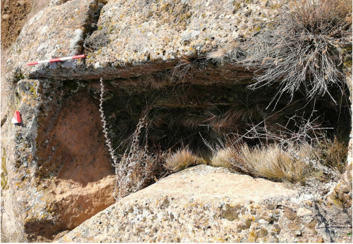
Şekil 6. Yumrukaya Nekropolisi Mezar 4

Basit khamosorion tipindeki mezar, YMK Nekropolünün güneydoğusunda yer almaktadır. Doğu-batı doğrultusunda uzanmıştır. Mezar Roma Dönemine tarihlenmekle birlikte Phryg ve Phryg öncesi de kullanıldığı tahmin edilmektedir.