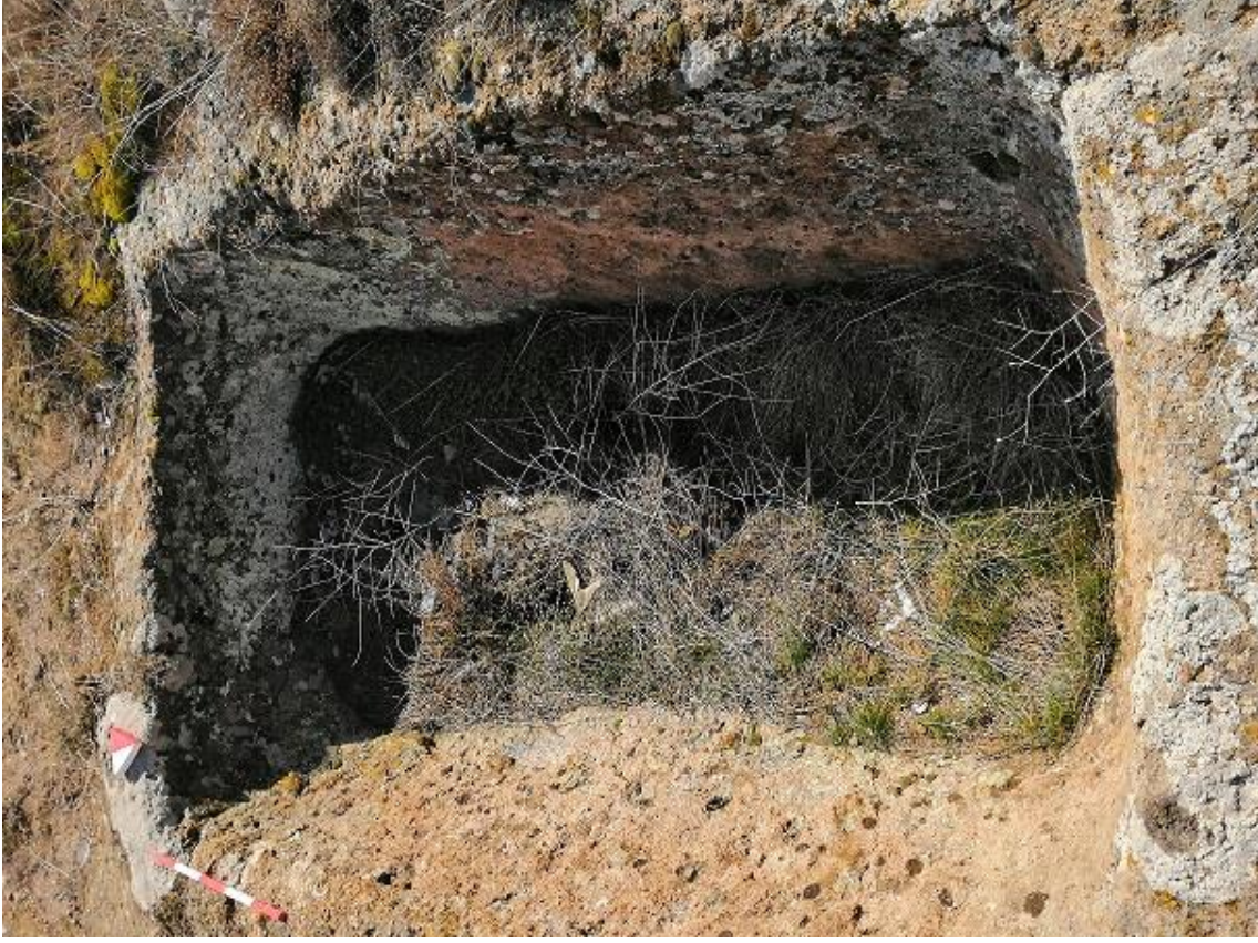
Şekil 24. Yumrukaya Nekropolisi Mezar 22

Basit khamosorion tipindeki mezar, YMK Nekropolünün kuzeydoğusunda kayalık arazinin yer seviyesinde bulunmaktadır. Kuzeybatı-güneydoğu doğrultusunda uzanmıştır. Mezar Roma Dönemine tarihlenmekle birlikte Phryg ve Phryg öncesi de kullanıldığı tahmin edilmektedir.