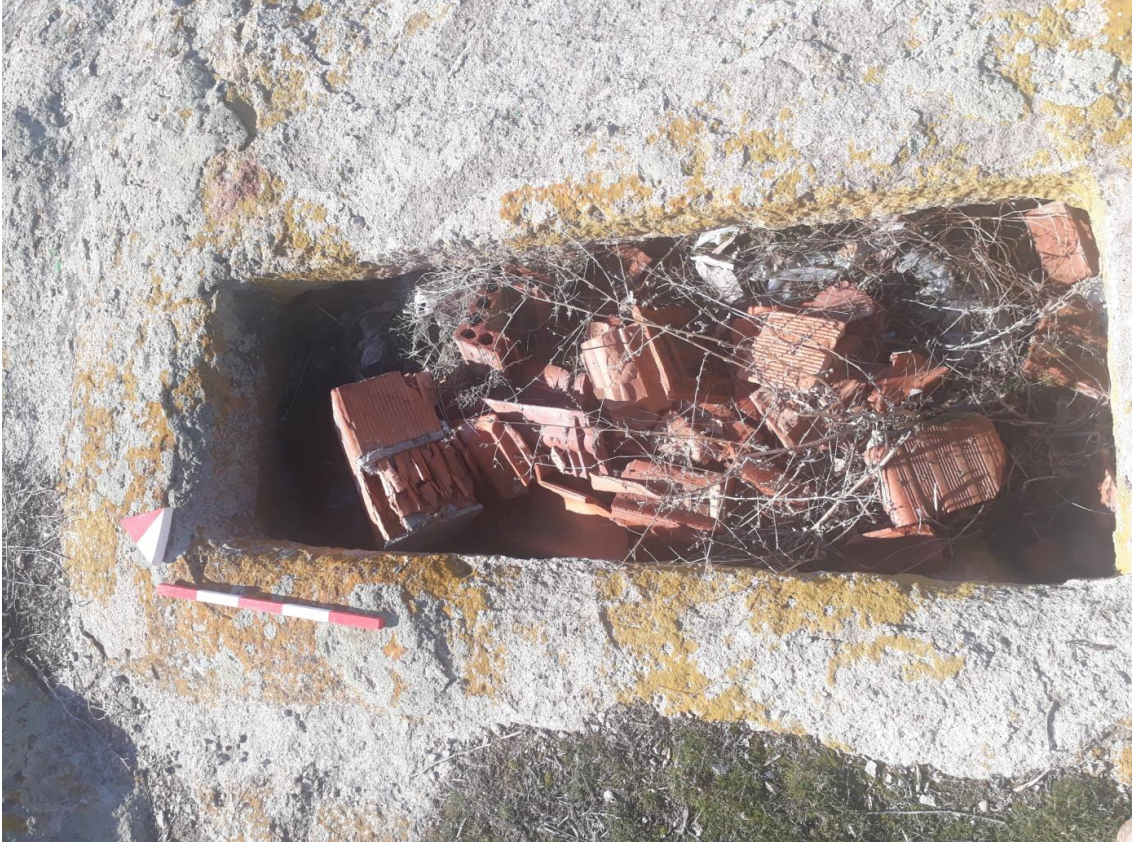
Şekil 80. Merkez Nekropolisi Mezar 1

Bu mezarın tipi kabaca anakayanın dikdörtken tarzında oyularak düzgün bir çukur meydana getirilmesi şeklinde tanımlanan Basit Khamosorion 'dur. Mezar, kuzeydoğu-güneybatı yönünde uzanmıştır.