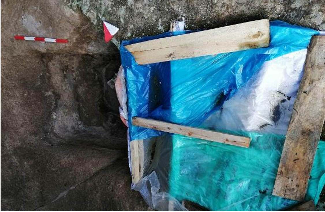
Şekil 22. Yumrukaya Nekropolisi Mezar 20

Basit khamosorion tipindeki mezar, YMK Nekropolünün kuzeydoğusunda yer almaktadır. Doğu-batı doğrultusunda uzanmıştır. Mezar Roma Dönemine tarihlenmekle birlikte Phryg ve Phryg öncesi de kullanıldığı tahmin edilmektedir.