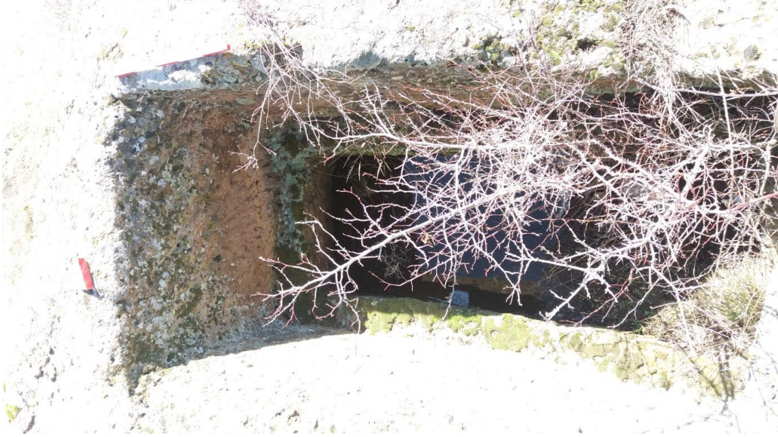
Şekil 4. Yumrukaya Nekropolisi Mezar 2

Basit khamosorion tipindeki mezar, YMK Nekropolünün güneydoğusunda yer almaktadır. İkinci mezar, Doğu-batı doğrultusunda uzanmıştır. Mezar Roma Dönemine tarihlenmekle birlikte Phryg ve Phryg öncesi de kullanıldığı tahmin edilmektedir.