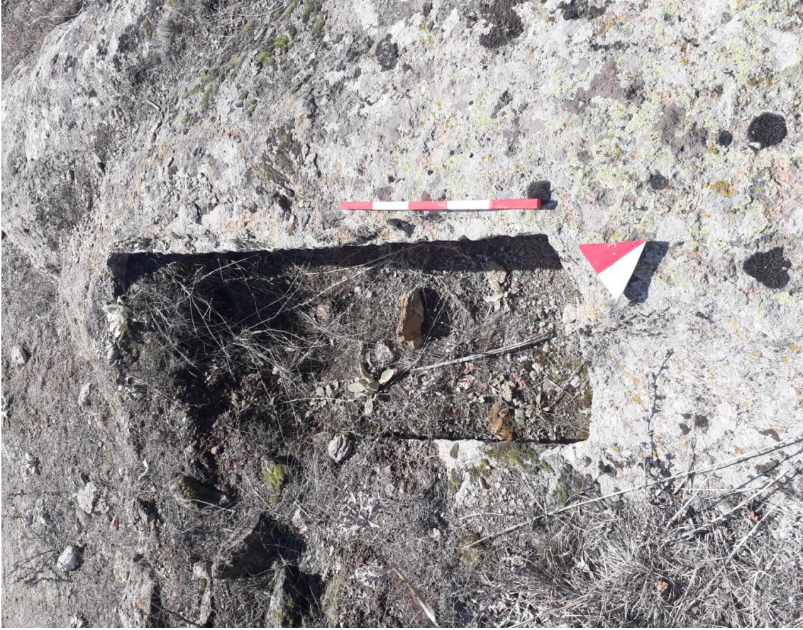
Şekil 70. Karaçayır Nekropolisi Mezar 3

Basit khamosorion tipindeki mezar, Karaçayır Nekropolisinin güneybatısında yer almaktadır. Mezar, kuzeydoğu-güneybatı yönünde uzanmaktadır.