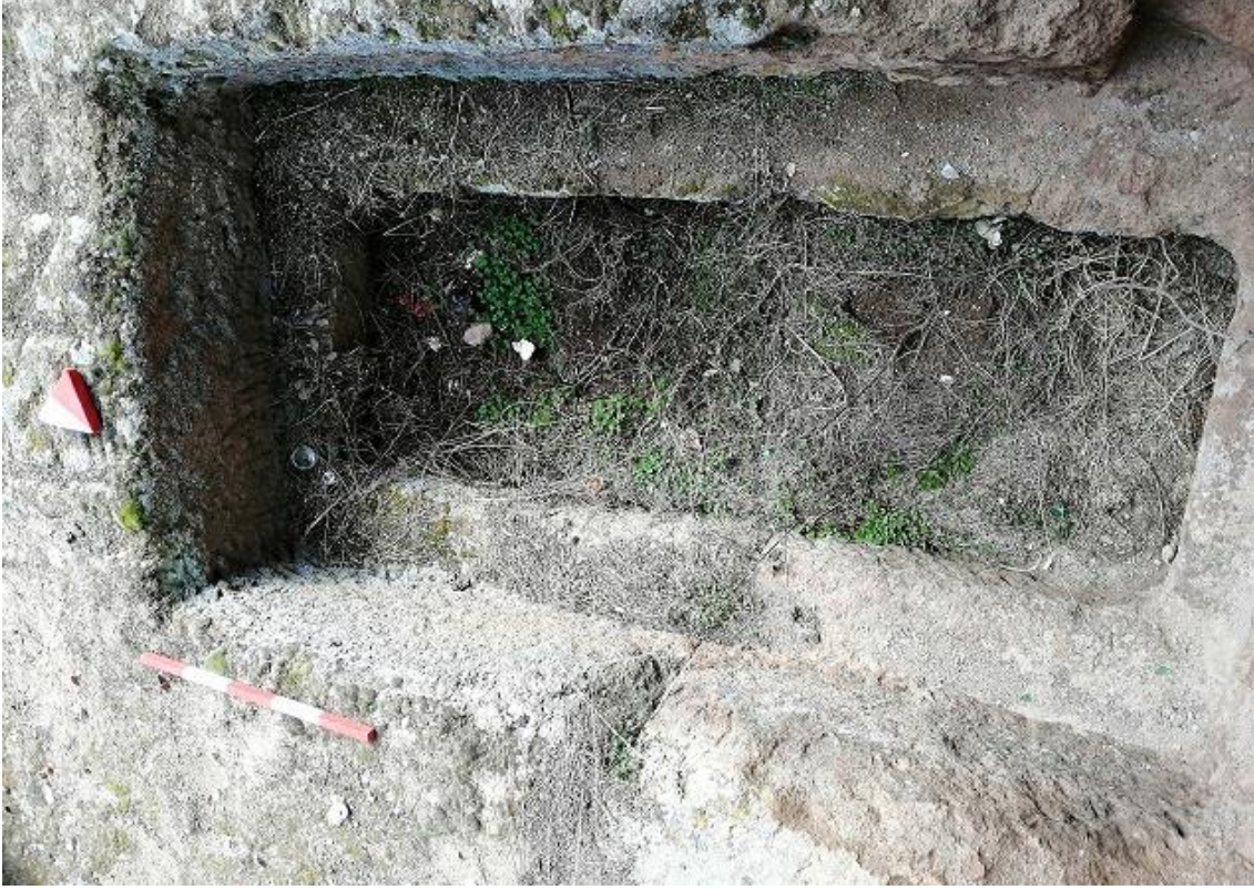
Şekil 21. Yumrukaya Nekropolisi Mezar 19

Basit khamosorion tipindeki mezar, YMK Nekropolünün kuzeydoğusunda yer almaktadır. Doğu-batı doğrultusunda uzanmıştır. Mezar Roma Dönemine tarihlenmekle birlikte Phryg ve Phryg öncesi de kullanıldığı tahmin edilmektedir.