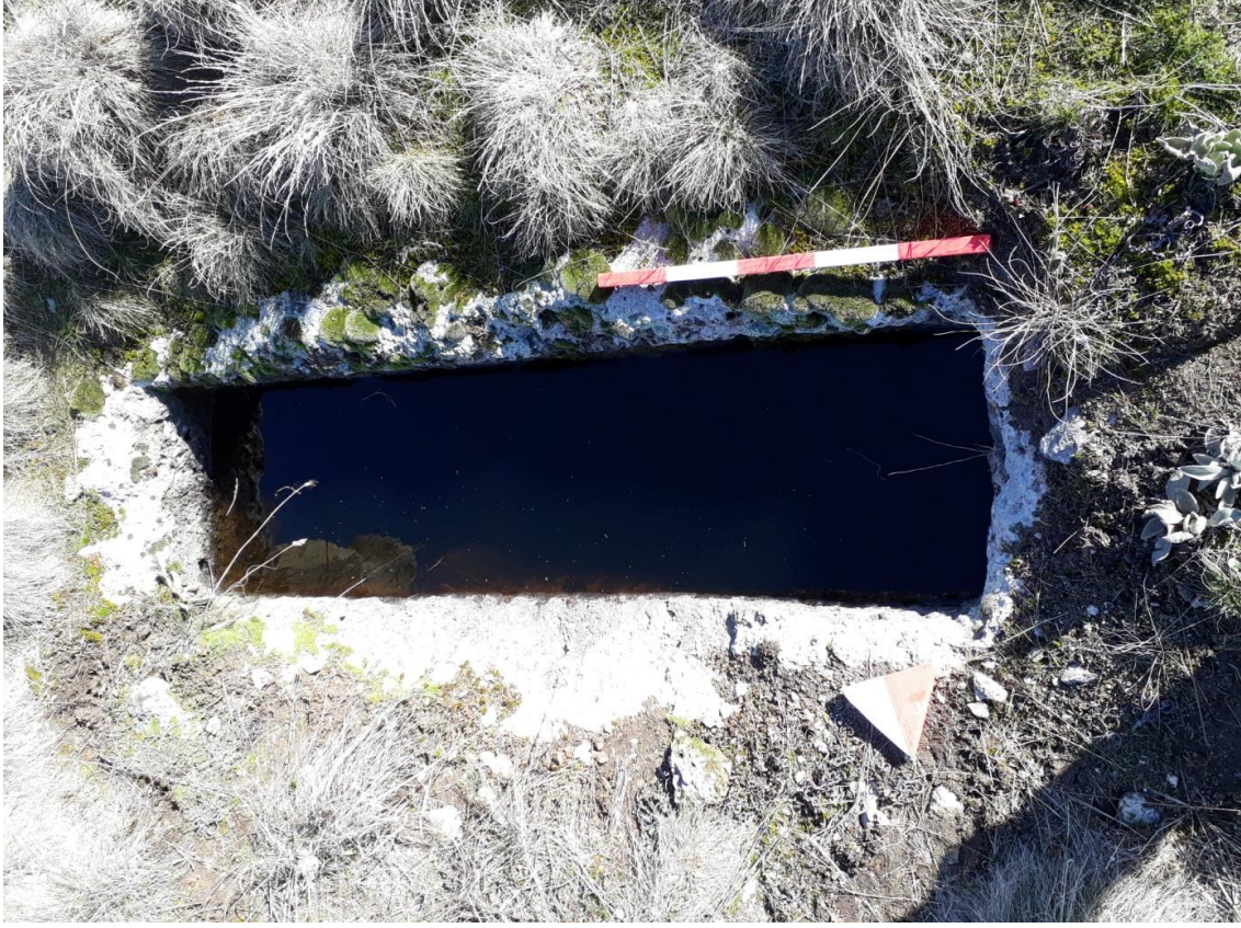
Şekil 57. Köy Mezarlığı Nekropolisi Mezar 4

Basit khamosorion tipindeki mezar, Nekropolisin, güneybatısında yer almaktadır. Mezar, doğu-batı yönünde uzanmaktadır.