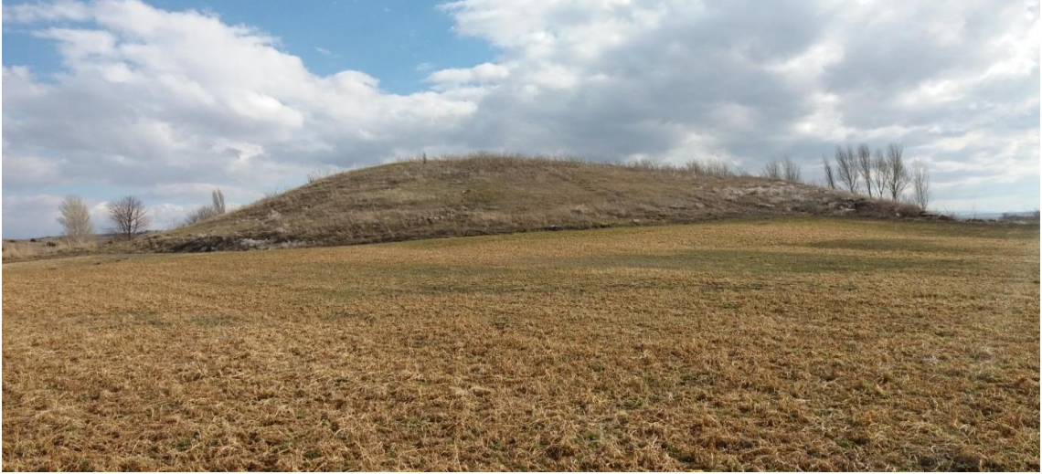
Şekil 1. Beyköy Höyük

Beyköy Höyük, İhsaniye ilçesine bağlı Beyköy'ün 2500 m güneyinde kalmaktadır. Bulunduğu yer Karakaya Mevkii olarak anılmaktadır. Höyük, İhsaniye – Kayıhan ve Gazlıgöl – Beyköy yolunun birleştiği kavşağın yaklaşık 200 m güneyinde yer almaktadır. Kayıhan yolu üzerinde bulunan köprüden 150 m güneybatıda kalmaktadır. Höyük etrafına göre yaklaşık olarak 11 m ile 12 m yüksekliğindedir.