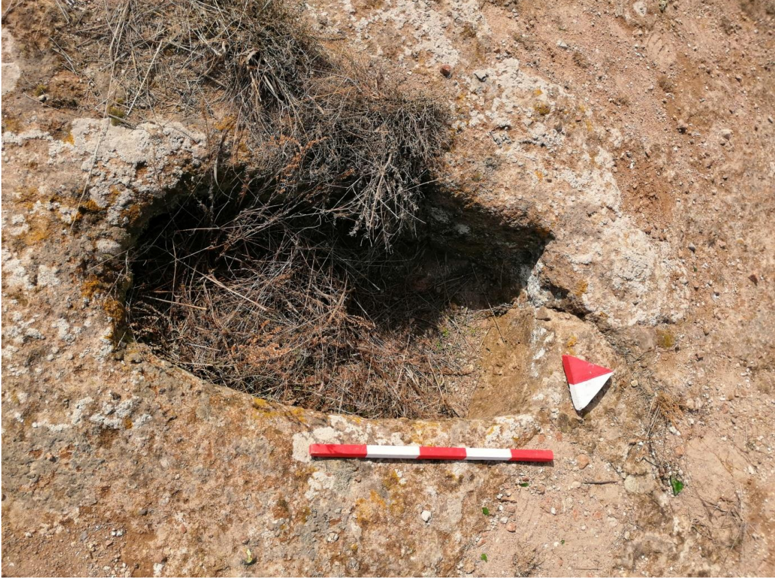
Şekil 40. Yumrukaya Nekropolisi Mezar 38

Basit khamosorion tipindeki mezar, YMK Nekropolünün kuzeydoğusunda kayalık arazinin yer seviyesinde bulunmaktadır. Kuzeybatı-güneydoğu doğrultusunda uzanmıştır. Mezar Roma Dönemine tarihlenmekle birlikte Phryg ve Phryg öncesi de kullanıldığı tahmin edilmektedir.