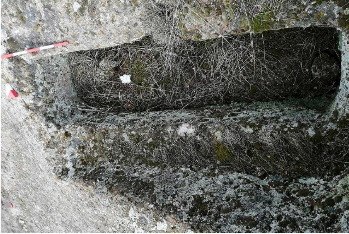
Şekil 44. Yumrukaya Nekropolisi Mezar 42

Basit khamosorion tipindeki mezar, YMK Nekropolünün kuzeydoğusundaki küçük kayalık kısmın yer seviyesinde bulunmaktadır. Doğu-batı doğrultusunda uzanmıştır. Mezar Roma Dönemine tarihlenmekle birlikte Phryg ve Phryg öncesi de kullanıldığı tahmin edilmektedir.