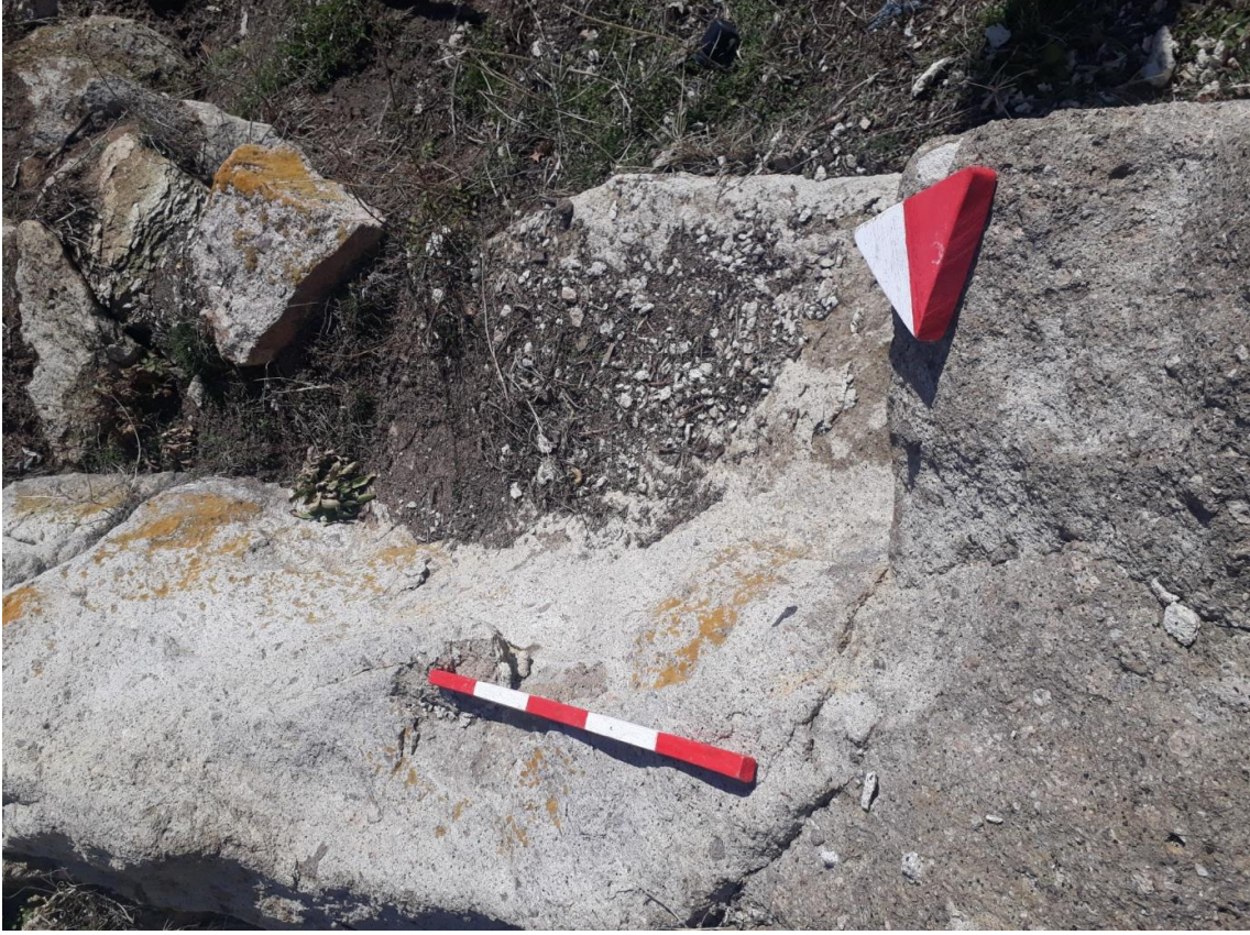
Şekil 85. Merkez Nekropolisi Mezar 6

Basit khamosorion tipindeki mezar, doğu-batı yönünde uzanmaktadır.