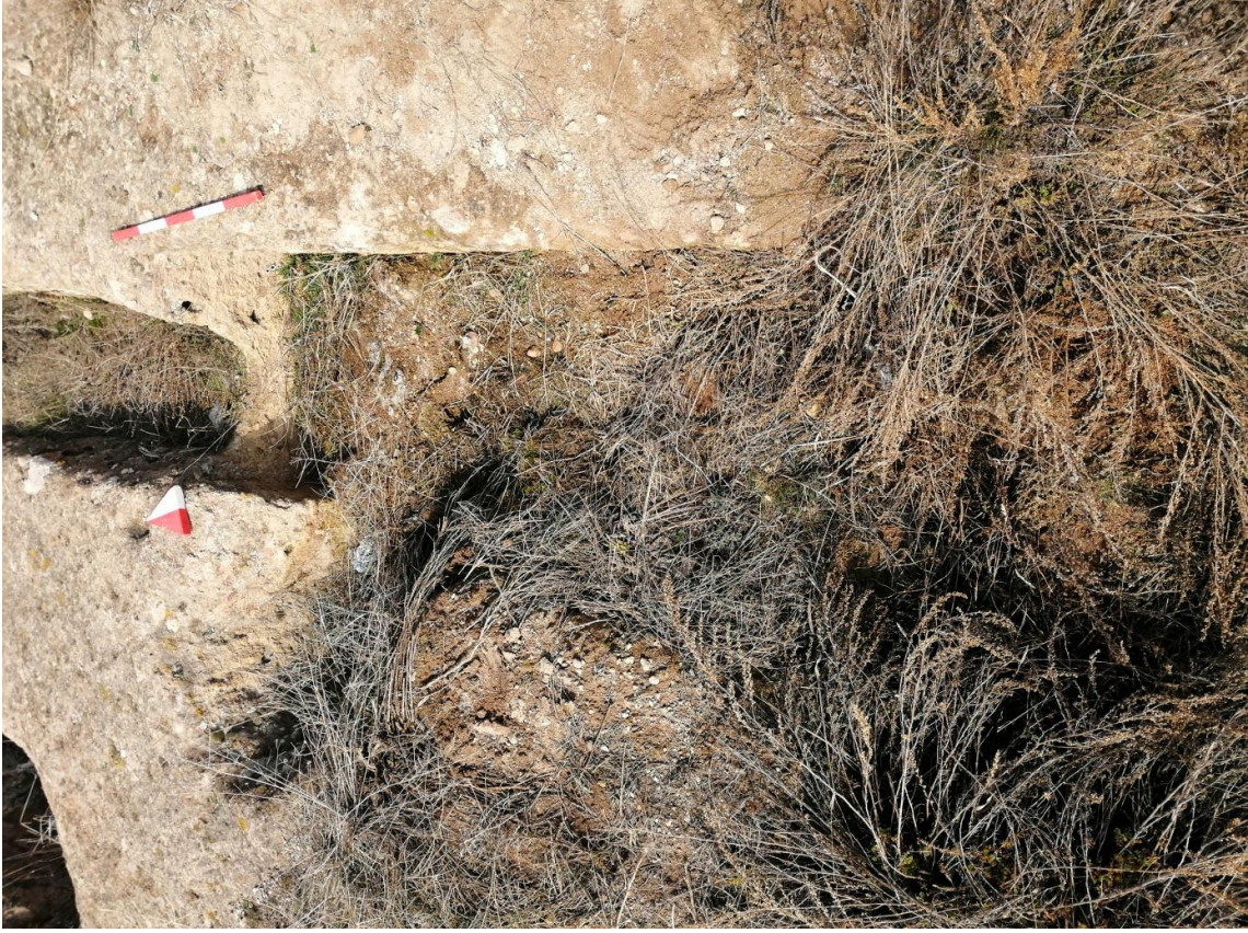
Şekil 31. Yumrukaya nekropolisi Mezar 29

Basit khamosorion tipindeki mezar, YMK Nekropolünün kuzeydoğusunda kayalık arazinin yer seviyesinde bulunmaktadır. Kuzeybatı-güneydoğu doğrultusunda uzanmıştır. Mezar Roma Dönemine tarihlenmekle birlikte Phryg ve Phryg öncesi de kullanıldığı tahmin edilmektedir.