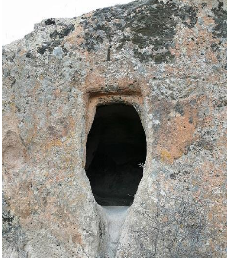
Şekil 49. Yumrukaya Nekropolisi Oda Mezar 1 İç Görünümü