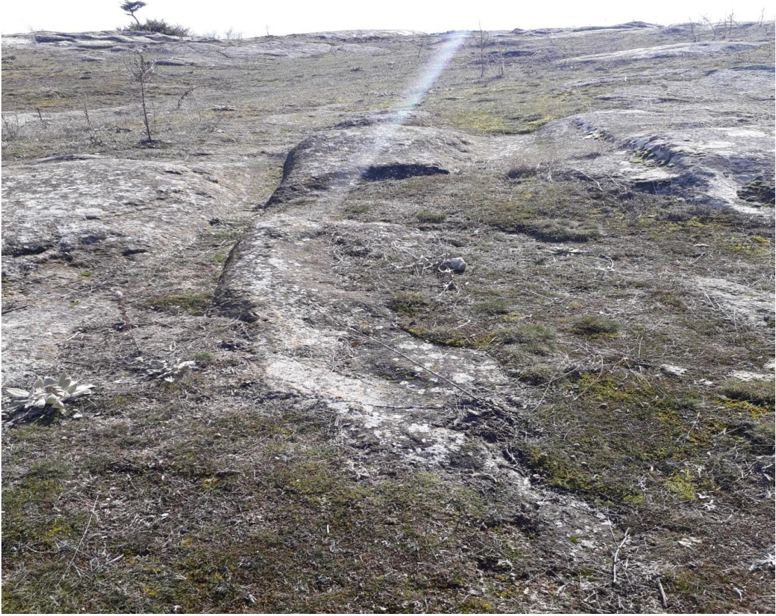
Şekil 94. Karaçayır Antik Yolu 3

Karaçayır Antik Yolu 3, Köy merkezinin (Muhtarlık) 670 m kuzeyinde karaçayır Mevkiinde yer almaktadır. Yol, Karaçayır Antik Yolu 2 ve 4 ile kesişmektedir