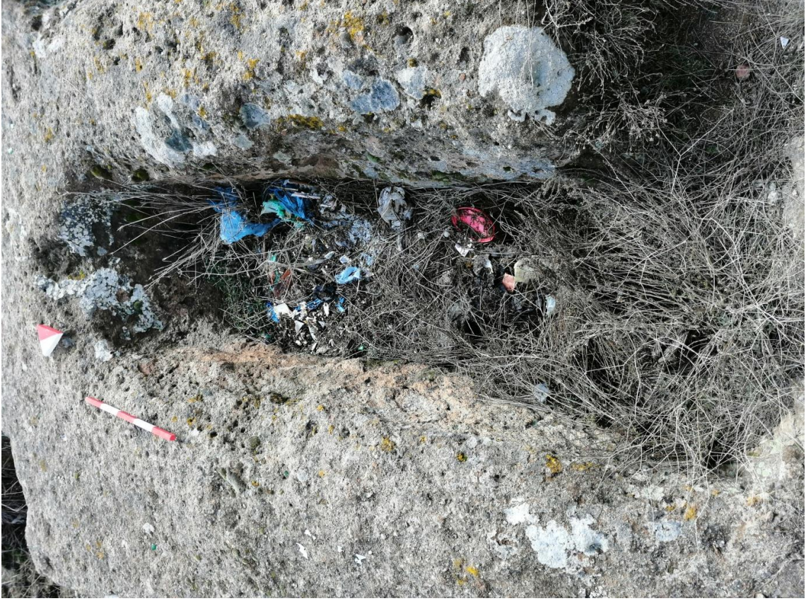
Şekil 29. Yumrukaya Nekropolisi Mezar 27

Basit khamosorion tipindeki mezar, YMK Nekropolünün kuzeydoğusunda kayalık arazinin yer seviyesinde bulunmaktadır. Kuzeybatı-güneydoğu doğrultusunda uzanmıştır. Mezar Roma Dönemine tarihlenmekle birlikte Phryg ve Phryg öncesi de kullanıldığı tahmin edilmektedir.