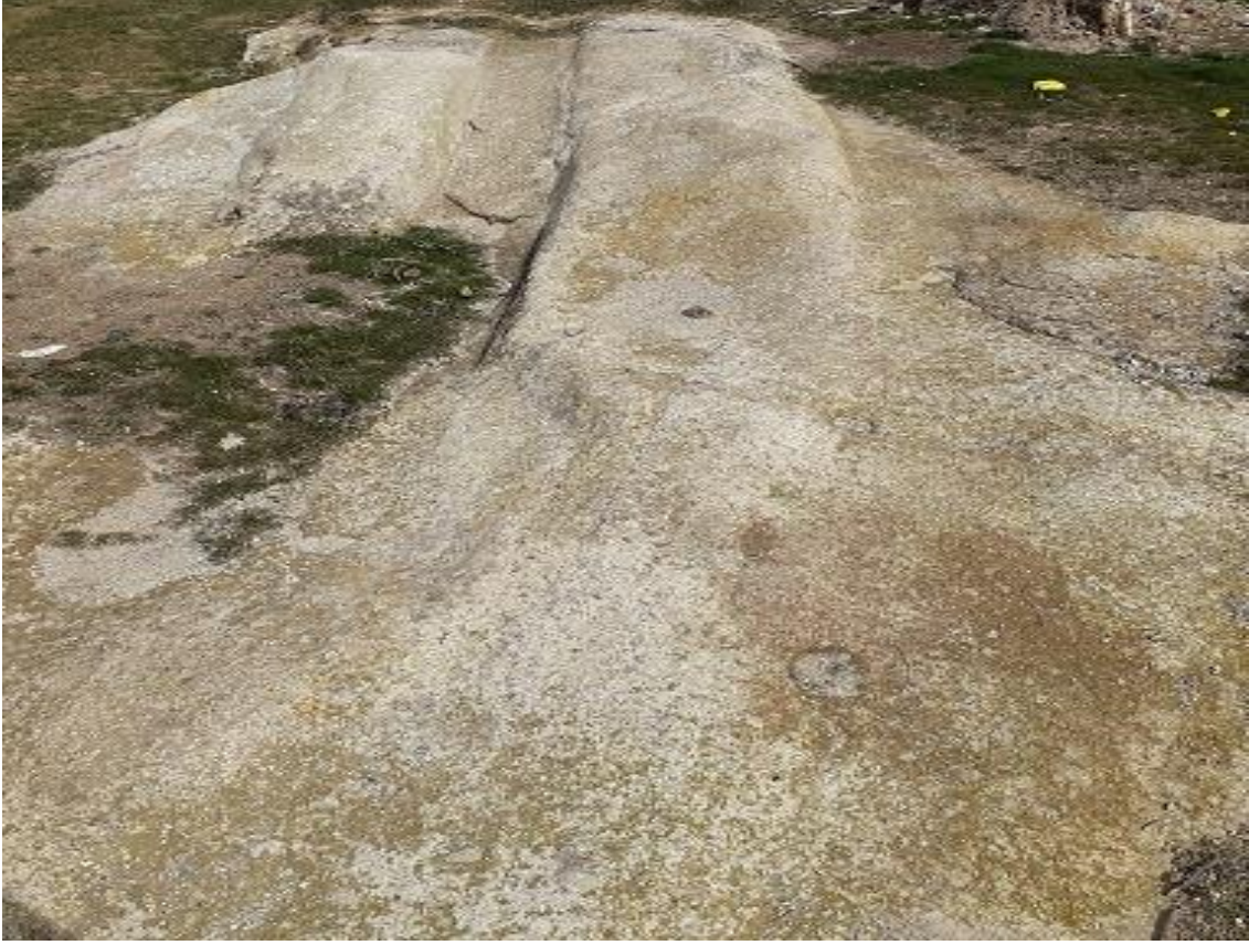
Şekil 104. Çanaklı Antik Yolu 3

Çanaklı Antik Yolu 3, köy merkezinden 500 m kuzeyde yer almaktadır. Bu yolun 250 m kuzeybatısında Çanaklı Antik Yolu 1 ve 2 yer almaktadır. Yumrukaya Nekropol'ünün de 440 m kuzeybatısında kalmaktadır. Yolun 220 m kuzeybatısında da Beyköy Nekropolü yer almaktadır.