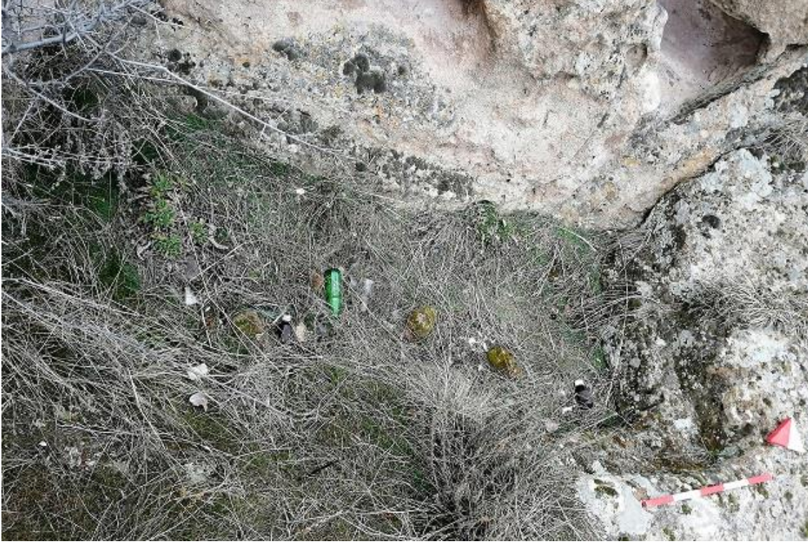
Şekil 47. Yumrukaya Nekropolisi Mezar 45

Basit khamosorion tipindeki mezar, YMK Nekropolünün güneydoğusunda yer almaktadır. Kuzeybatı-güneydoğu doğrultusunda uzanmıştır. Mezar Roma Dönemine tarihlenmekle birlikte Phryg ve Phryg öncesi de kullanıldığı tahmin edilmektedir.