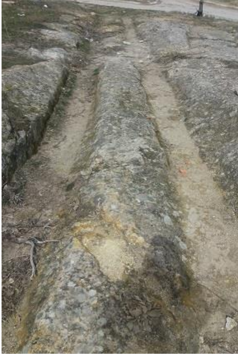
Şekil 90. İğdeler Antik Yolu 1

İğdeler Antik yolu 1, Köy Merkezinin 600 m kuzeyinde yer almaktadır. Karaçayır nekropolü ve Beyköy Nekropolü'nün ortasında bulunmaktadır. Yolun 160 m doğusunda İğdeler Antik Yolu 2 vardır. İğdeler Antik Yolunun 1'in 1 km kuzeydoğusunda ise Tavşan Düşen Antik Yolu vardır.