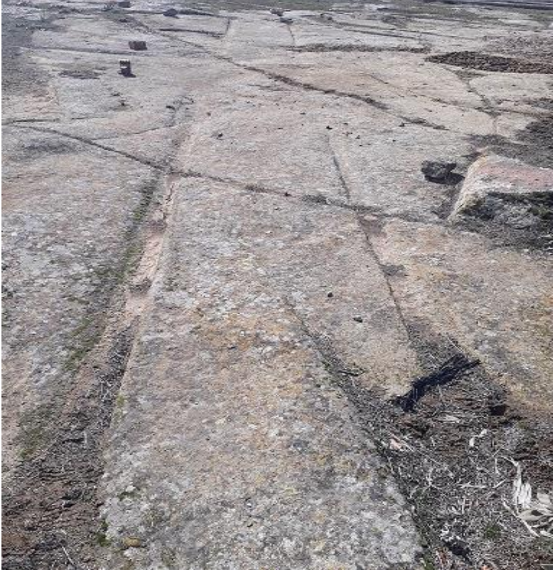
Şekil 101. Karaçayır Antik Yolu 10

Karaçayır Antik Yolu 9, Köy merkezinin (Muhtarlık) 670 m kuzeyinde karaçayır Mevkiinde yer almaktadır. Karaçayır antik Yolu 10 ile kesişmektedir.