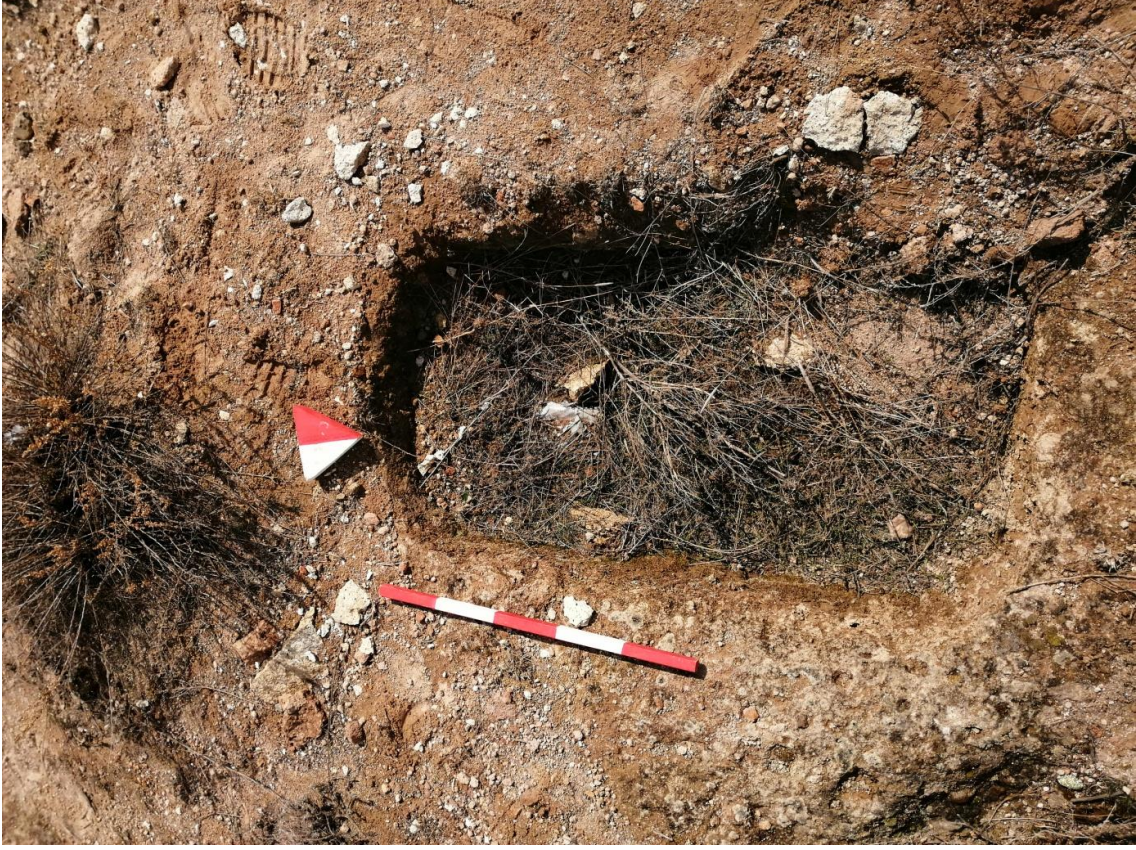
Şekil 41. Yumrukaya Nekropolisi Mezar 39

Basit khamosorion tipindeki mezar, YMK Nekropolünün kuzeydoğusunda kayalık arazinin yer seviyesinde bulunmaktadır. Doğu-batı doğrultusunda uzanmıştır. Mezar Roma Dönemine tarihlenmekle birlikte Phryg ve Phryg öncesi de kullanıldığı tahmin edilmektedir.