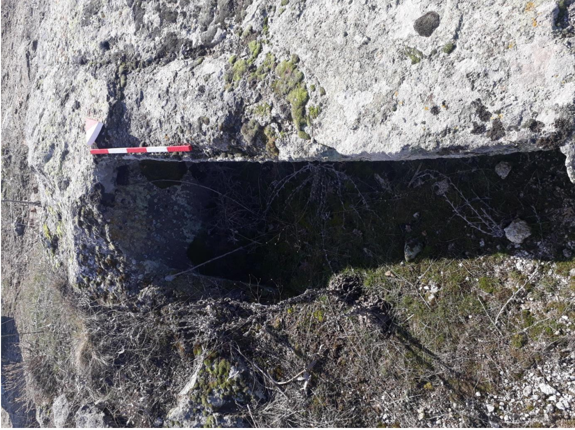
Şekil 68. Karaçayır Nekropolisi Mezar 1

Basit khamosorion tipindeki mezar, Karaçayır Nekropolünün güneybatısında yer almaktadır. Mezar, Kuzey-güney yönünde uzanmaktadır.