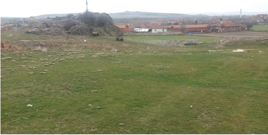
Şekil 52. Beyköy Nekropolisi

Köy merkezinin (Muhtarlık) 1 km kuzeyinde yer alan Beyköy Nekropolisi doğu – batı yönünde uzanmakta ve 1920 m 2 alanındadır. Çok önceki zamanlarda köy yerleşiminin dışında yer alan Nekropolis zamanla etrafına evlerin yapılmasıyla yerleşim sınırları içinde kalmıştır. Beyköy Nekropolis genel olarak kayalık bir görünüme sahiptir ve Köy yerleşiminden yüksekte yer almaktadır. Nekropolis'in 100 m kuzeyinden İğdeler Antik yolu geçmektedir. Günümüzde ise Nekropolis'in 30 m doğusundan ve 130 m batısından olmak üzere iki yol geçmektedir.