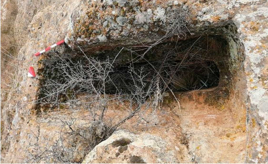
Şekil 20. Yumrukaya Nekropolisi Mezar 18

Basit khamosorion tipindeki mezar, YMK Nekropolünün güneydoğusunda yer almaktadır. Kuzeydoğu-güneybatı doğrultusunda uzanmıştır. Mezar Roma Dönemine tarihlenmekle birlikte Phryg ve Phryg öncesi de kullanıldığı tahmin edilmektedir.