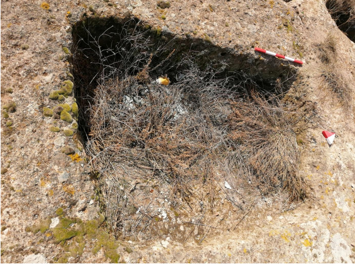
Şekil 37. Yumrukaya Nekropolisi Mezar 35

Basit khamosorion tipindeki mezar, YMK Nekropolünün kuzeydoğusunda kayalık arazinin yer seviyesinde bulunmaktadır. Doğu-batı doğrultusunda uzanmıştır. Mezar Roma Dönemine tarihlenmekle birlikte Phryg ve Phryg öncesi de kullanıldığı tahmin edilmektedir.