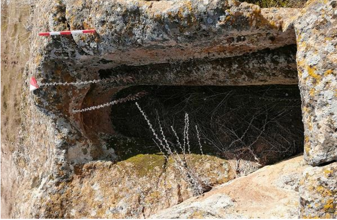
Şekil 13. Yumrukaya Nekropolisi Mezar 11

Basit khamosorion tipindeki mezar, YMK Nekropolünün kuzeydoğusunda yer almaktadır. Doğu-batı doğrultusunda uzanmıştır. Mezar Roma Dönemine tarihlenmekle birlikte Phryg ve Phryg öncesi de kullanıldığı tahmin edilmektedir.