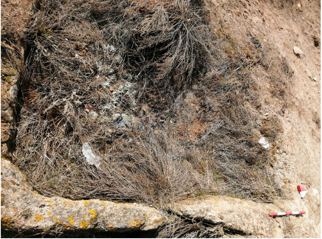
Şekil 39. Yumrukaya Nekropolisi Mezar 37

Basit khamosorion tipindeki mezar, YMK Nekropolünün kuzeydoğusunda kayalık arazinin yer seviyesinde bulunmaktadır. Doğu-batı doğrultusunda uzanmıştır. Mezar Roma Dönemine tarihlenmekle birlikte Phryg ve Phryg öncesi de kullanıldığı tahmin edilmektedir.