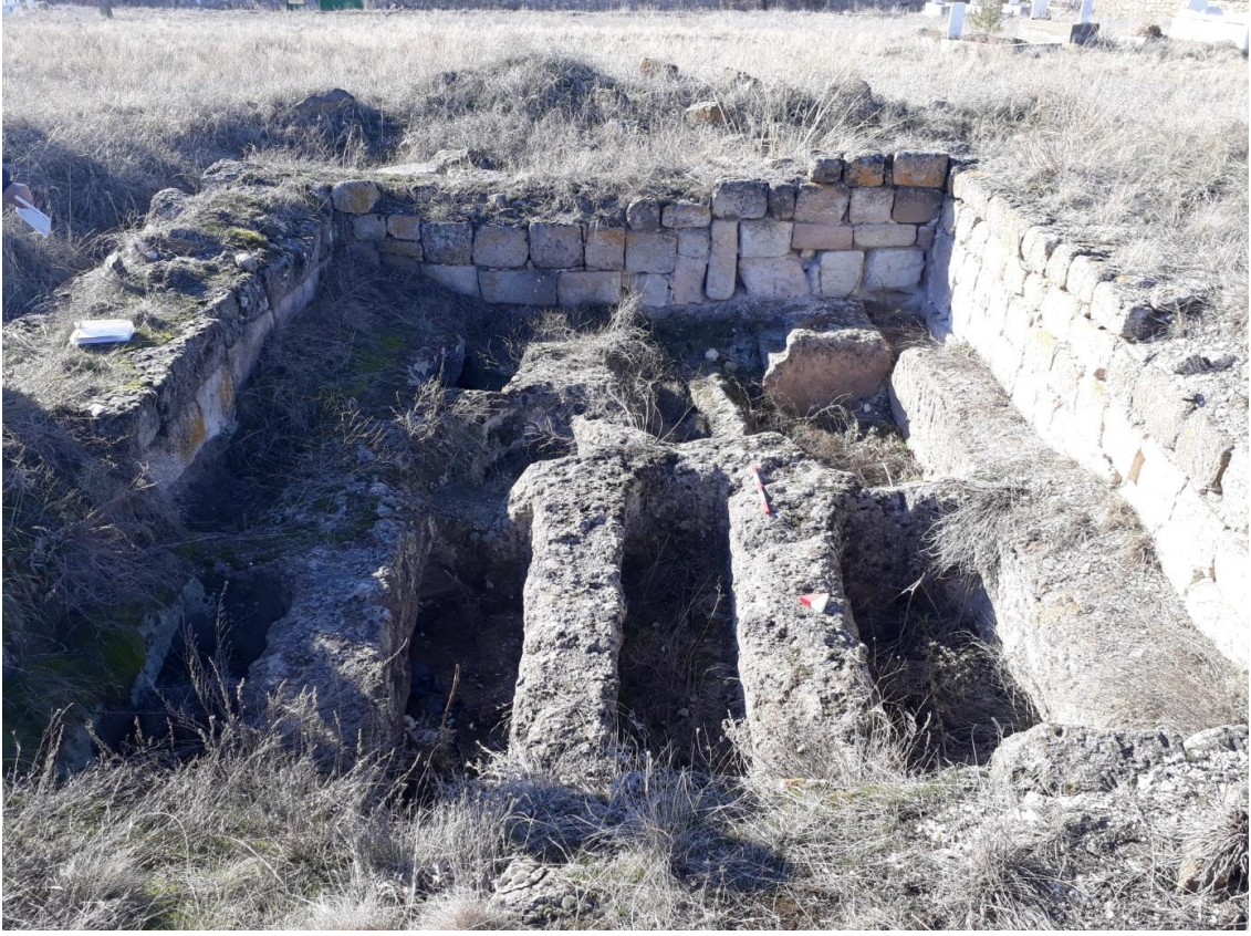
Şekil 64. Köy Mezarlığı Nekropolisi Ortak Mezar

Toplu mezar, basit khamosorion tipinde on iki mezardan oluşmaktadır. Erken Bizans Dönemine ait olan ortak mezar, Köy Mezarlığı Nekropolisinin kuzeybatısında yer almaktadır. On iki mezarın tamamı doğu-batı yönünde uzanmakta olup tam on bir iskelet bulunmuştur. Kare şeklindeki ortak mezarın çevre uzunluğu 20 m, alanı ise 22 m 2 'dir.