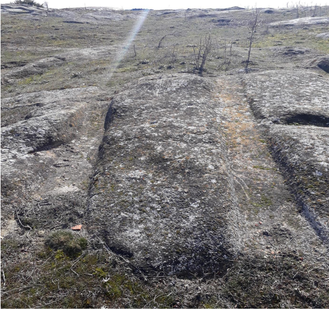
Şekil 95. Karaçayır Antik Yolu 4

Karaçayır Antik Yolu 4, Köy merkezinin (Muhtarlık) 670 m kuzeyinde karaçayır Mevkiinde yer almaktadır. Yol, Karaçayır Antik Yolu 2 ile kesişmektedir.