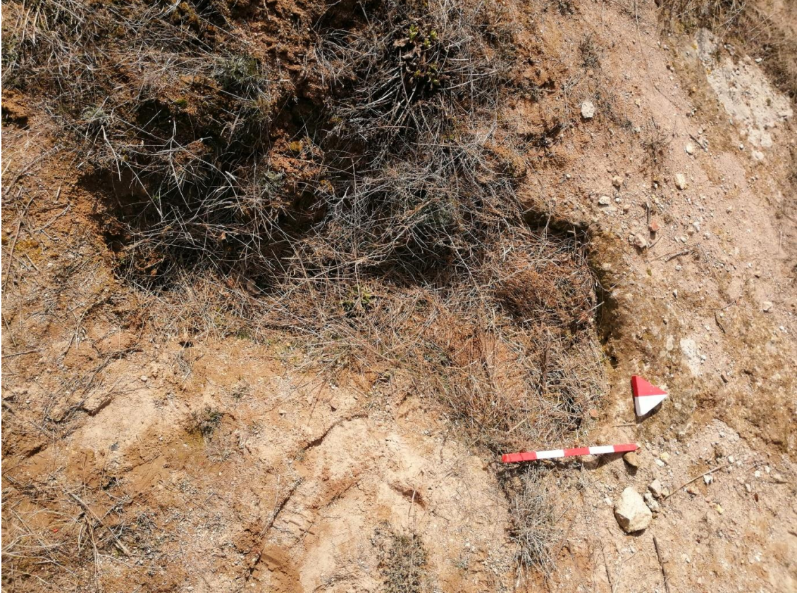
Şekil 43. Yumrukaya Nekropolisi Mezar 41

Basit khamosorion tipindeki mezar, YMK Nekropolünün kuzeydoğusunda kayalık arazinin yer seviyesinde bulunmaktadır. Doğu-batı doğrultusunda uzanmıştır. Mezar Roma Dönemine tarihlenmekle birlikte Phryg ve Phryg öncesi de kullanıldığı tahmin edilmektedir.