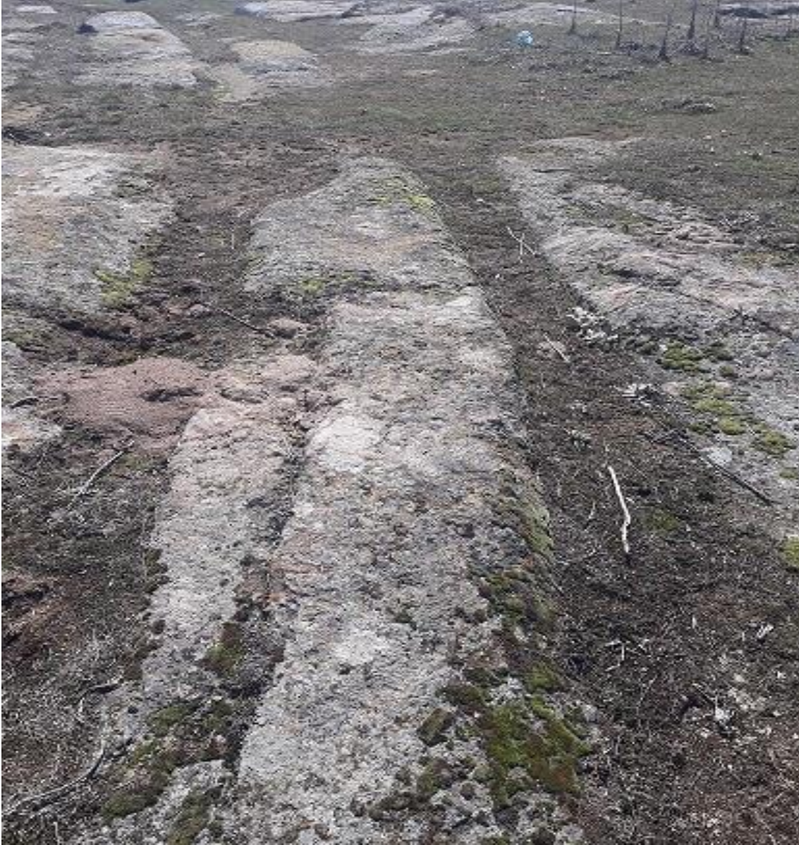
Şekil 96. Karaçayır antik Yolu 5

Karaçayır Antik Yolu 5, Köy merkezinin (Muhtarlık) 670 m kuzeyinde karaçayır Mevkiinde yer almaktadır.