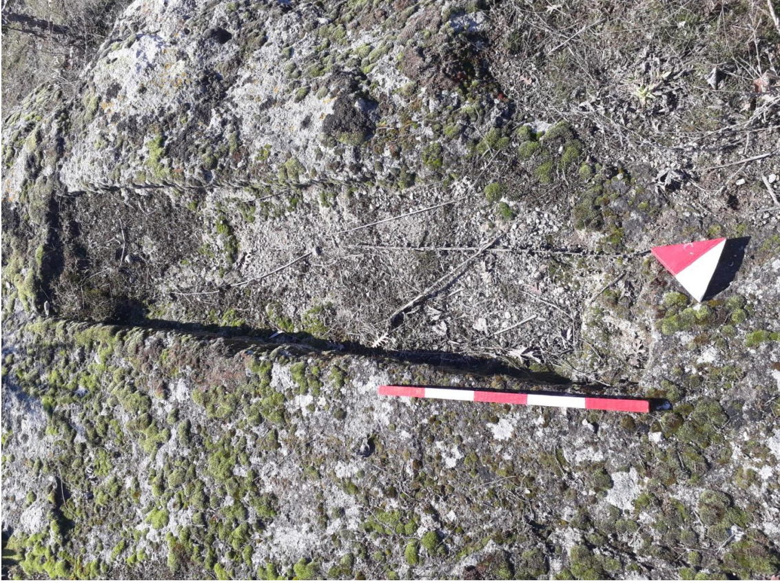
Şekil 72. Karaçayır Nekropolisi Mezar 5

Basit khamosorion tipindeki mezar, Karaçayır Nekropolisinin güneybatısında yer almaktadır. Mezar, Kuzeydoğu-güneybatı yönünde uzanmaktadır.