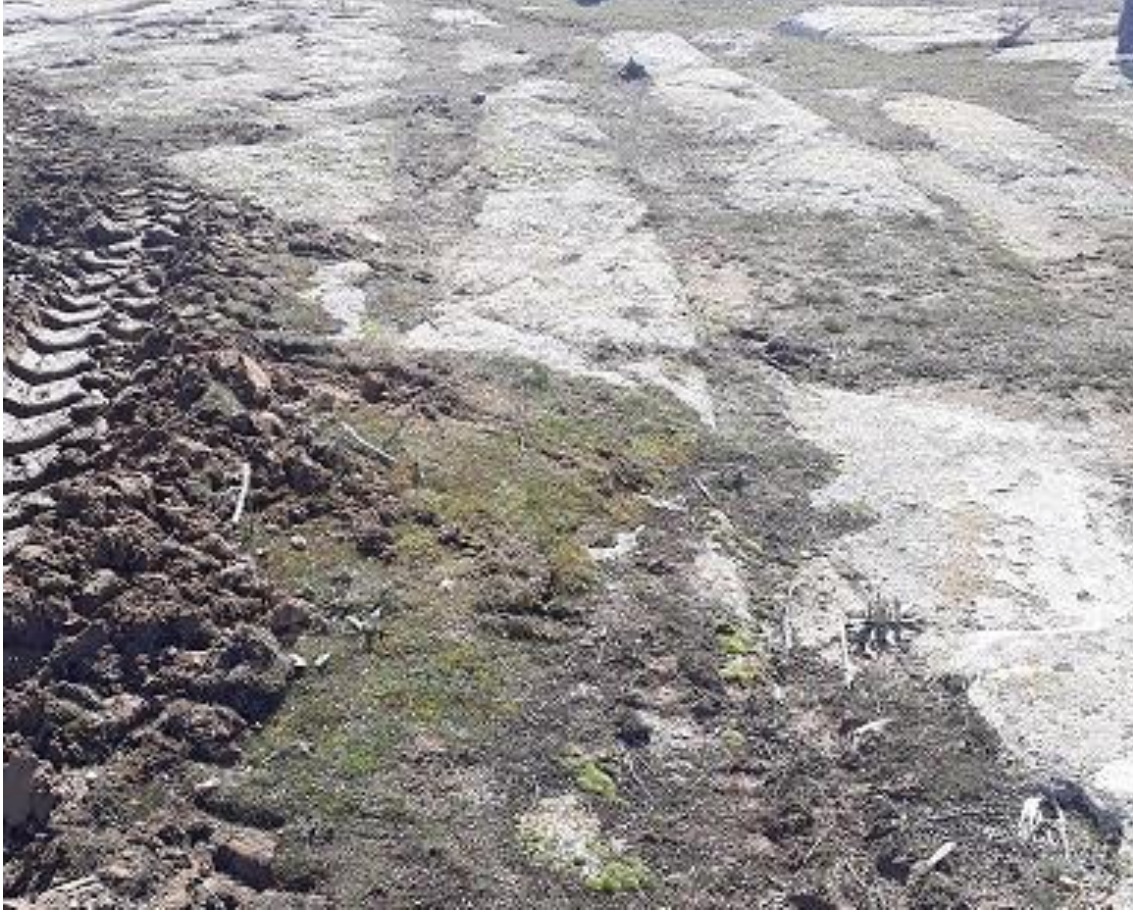
Şekil 97. Karaçayır antik Yol 6

Karaçayır Antik Yolu 6, Köy merkezinin (Muhtarlık) 670 m kuzeyinde karaçayır Mevkiinde yer almaktadır. Karaçayır antik Yolu 1 ile kesişmektedir.