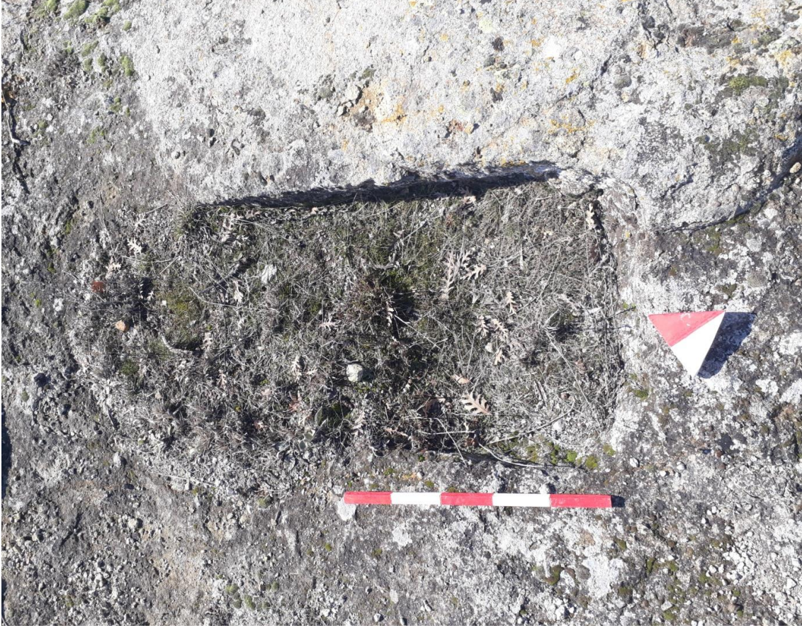
Şekil 71. Karaçayır Nekropolisi Mezar 4

Basit khamosorion tipindeki mezar, Karaçayır Nekropolisinin güneybatısında yer almaktadır. Mezar, Kuzey-güney yönünde uzanmaktadır.