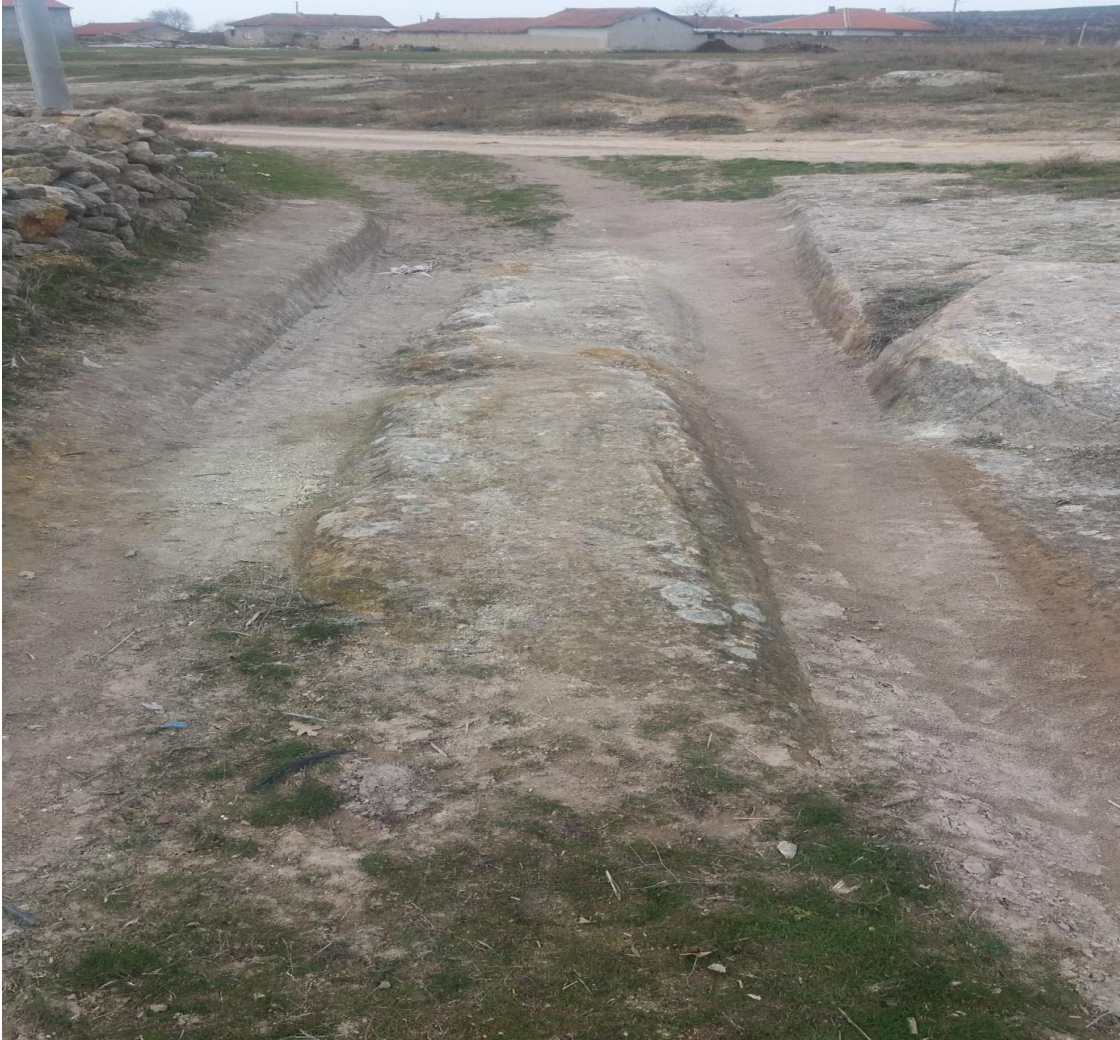
Şekil 103. anaklı Antik Yolu 2

Köy merkezinden 690 m kuzeyde yer alan anaklı antik Yolu 2, anaklı mevkii'nde yer almaktadır. Bu yolun 900 m kuzeyinden Tavşan Düşen Antik Yolu yer almaktadır. Yolun 120 m doğusunda anaklı Antik Yolu 1 yer almakla birlikte bu iki yol kesişmektedir. anaklı antik Yolu 2'nin 134 m güneyinde Beyköy Nekropolü yer almaktadır.