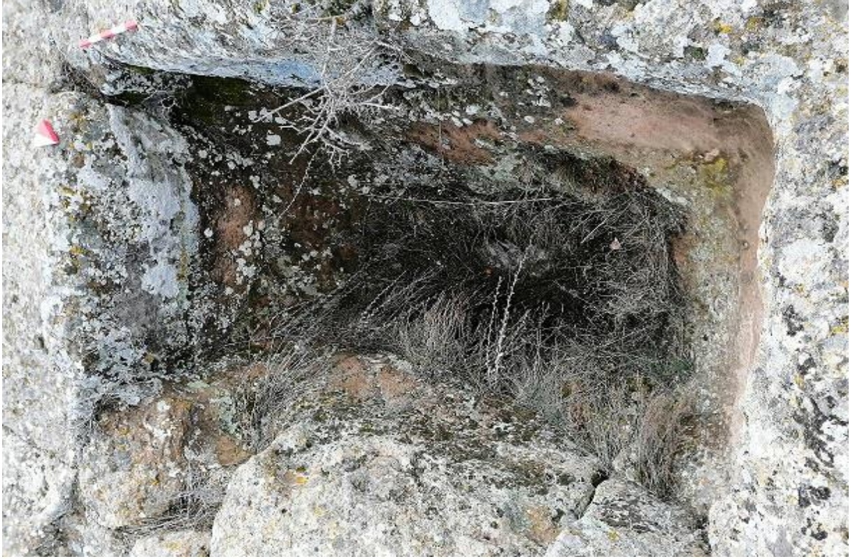
Şekil 19. Yumrukaya Nekropolisi Mezar 17

Basit khamosorion tipindeki mezar, YMK Nekropolünün kuzeydoğusunda yer almaktadır. Doğu-batı doğrultusunda uzanmıştır. Mezar Roma Dönemine tarihlenmekle birlikte Phryg ve Phryg öncesi de kullanıldığı tahmin edilmektedir.