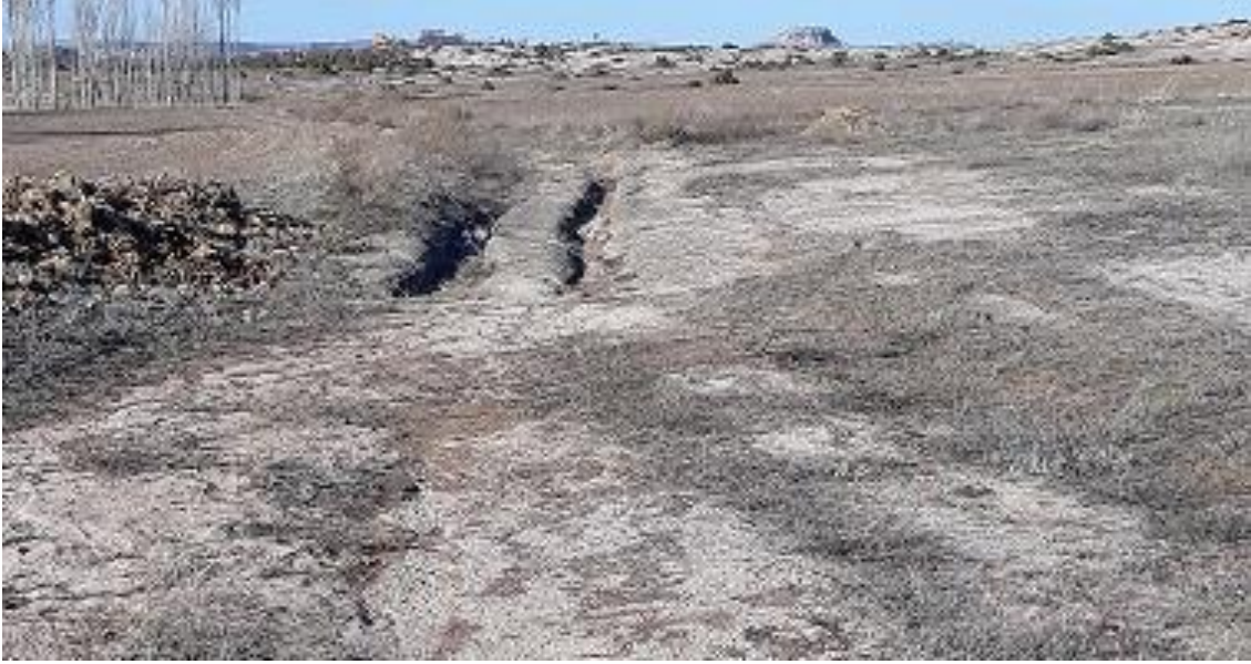
Şekil 88. Tavşan Düşen Antik Yolu

Coğrafi Konumu: Enlem: 39060899; Boylam: 30471022; Yükselti: 1130 m.