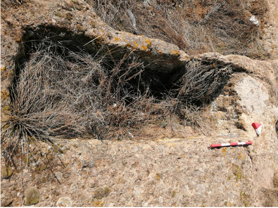
Şekil 38. Yumrukaya Nekropolisi Mezar 36

Basit khamosorion tipindeki mezar, YMK Nekropolünün kuzeydoğusunda kayalık arazinin yer seviyesinde bulunmaktadır. Doğu-batı doğrultusunda uzanmıştır. Mezar Roma Dönemine tarihlenmekle birlikte Phryg ve Phryg öncesi de kullanıldığı tahmin edilmektedir.