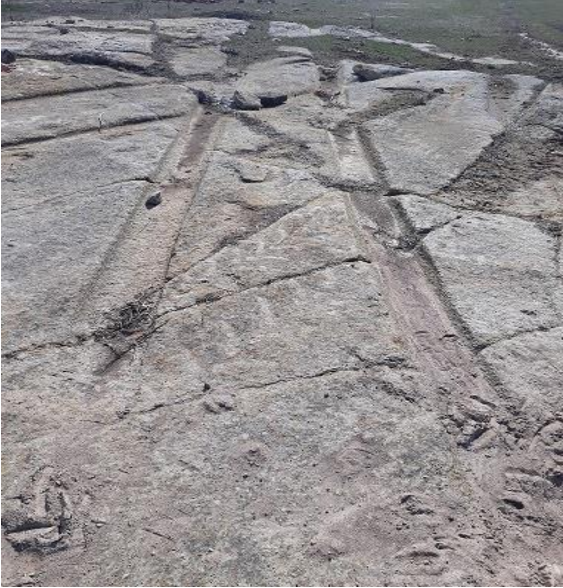
Şekil 100. Karaçayır Antik Yolu 9

Karaçayır Antik Yolu 9, Köy merkezinin (Muhtarlık) 670 m kuzeyinde karaçayır Mevkiinde yer almaktadır. Karaçayır antik Yolu 10 ile kesişmektedir.