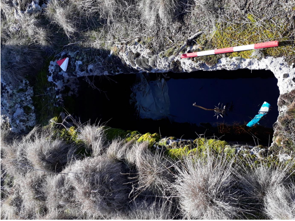
Şekil 56. Köy Mezarlığı Nekropolisi Mezar 3

Basit khamosorion tipindeki mezar, Nekropolisin, güneybatısında yer almaktadır. Mezar, kuzeydoğu-güneybatı yönünde uzanmaktadır.