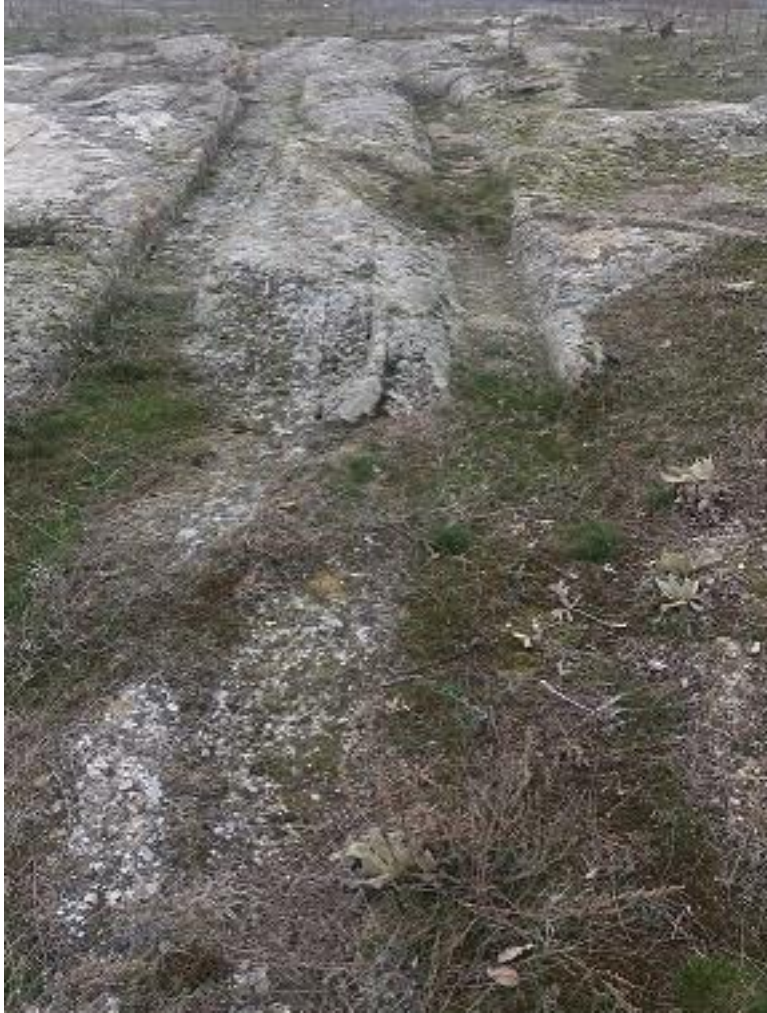
Şekil 92. Karaçayır Antik Yolu 1

Karaçayır Antik Yolu 1, Köy merkezinin (Muhtarlık) 670 m kuzeyinde karaçayır Mevkiinde yer almaktadır. Karaçayır Mevkii antik yol bakımından zengin bir bölgedir. Arazi keşfi sırasında bu bölgede toplamda 10 adet antik yol tespit edilmiştir. Bu yollar birbirini kesmiş vaziyettedir. Bölge büyük ihtimal bir kavşak görevi görmekteydi.