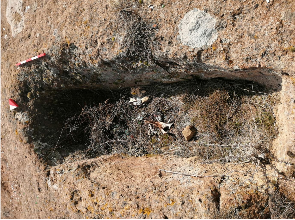
Şekil 28. Yumrukaya Nekropolisi Mezar 26

Basit khamosorion tipindeki mezar, YMK Nekropolünün kuzeydoğusunda kayalık arazinin yer seviyesinde bulunmaktadır. Kuzeybatı-güneydoğu doğrultusunda uzanmıştır. Mezar Roma Dönemine tarihlenmekle birlikte Phryg ve Phryg öncesi de kullanıldığı tahmin edilmektedir.