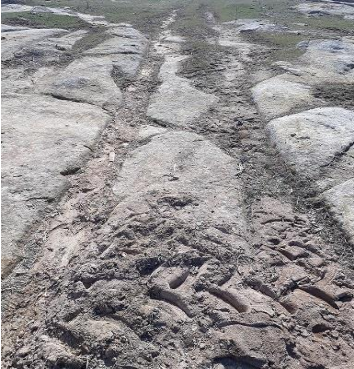
Şekil 99. Karaçayır Antik Yolu 8

Karaçayır Antik Yolu 8, Köy merkezinin (Muhtarlık) 670 m kuzeyinde karaçayır Mevkiinde yer almaktadır. Karaçayır antik Yolu 1 ile kesişmektedir.