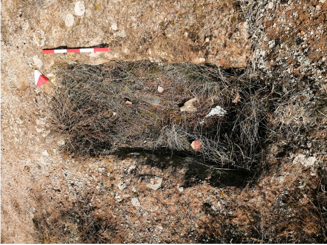
Şekil 32. Yumrukaya Nekropolisi mezar 30

Basit khamosorion tipindeki mezar, YMK Nekropolünün kuzeydoğusunda kayalık arazinin yer seviyesinde bulunmaktadır. Kuzeybatı-güneydoğu doğrultusunda uzanmıştır. Mezar Roma Dönemine tarihlenmekle birlikte Phryg ve Phryg öncesi de kullanıldığı tahmin edilmektedir.