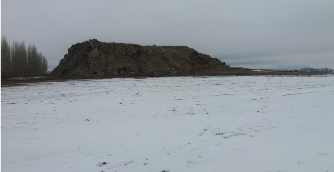
Şekil 2. Yumrukaya Nekropolisi

Beyköy'ün 1 km doğusundaki kayalık alanda bulunan Yumrukaya Tepesi volkanik tüf yapısındadır. Yumrukayalar Nekropolisinin çevre uzunluğu 1075 m alanı