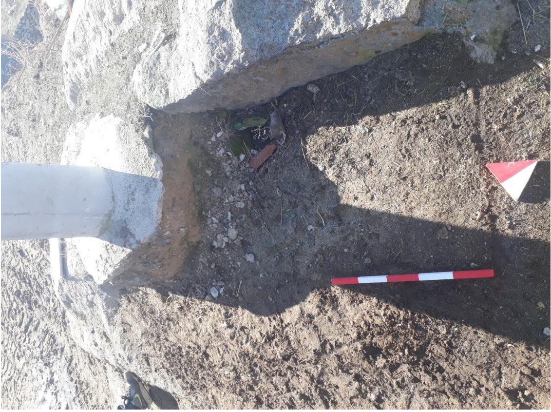
Şekil 83. Merkez Nekropolisi Mezar 4

Basit khamosorion tipindeki mezar, kuzey-güney yönünde uzanmaktadır. Günümüzde mezarın bir uzun kenarı ve bir kısa kenarı neredeyse tamamen tahrip olmuştur. Ayrıca mezarın içine elektrik direği oturtulmuştur.