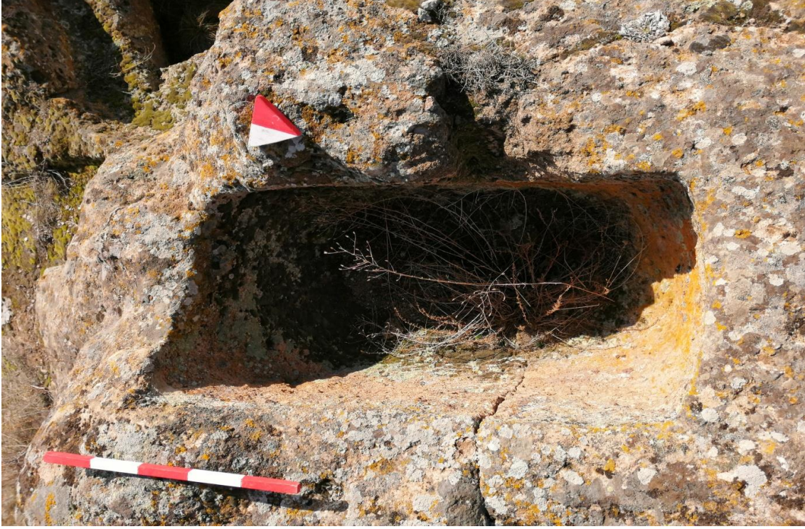
Şekil 10. Yumrukaya Nekropolisi Mezar 8

Basit khamosorion tipindeki mezar, YMK Nekropolünün kuzeydoğusunda yer almaktadır. Kuzeybatı-güneydoğu doğrultusunda uzanmıştır. Mezar Roma Dönemine tarihlenmekle birlikte Phryg ve Phryg öncesi de kullanıldığı tahmin edilmektedir.