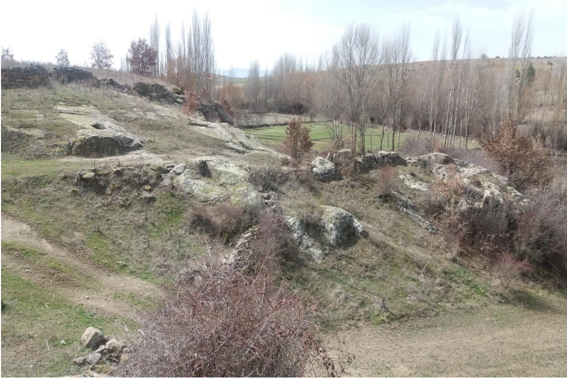
Şekil 67. Karaçayır Nekropolisi

Nekropolis, Köy merkezinin (Muhtarlık) 570 m kuzeybatısında yer alır. Karaçayır mevkiinde yer alan Nekropolis 970 m çevre uzunluğu ve 56.820,17. m2 alana sahiptir.