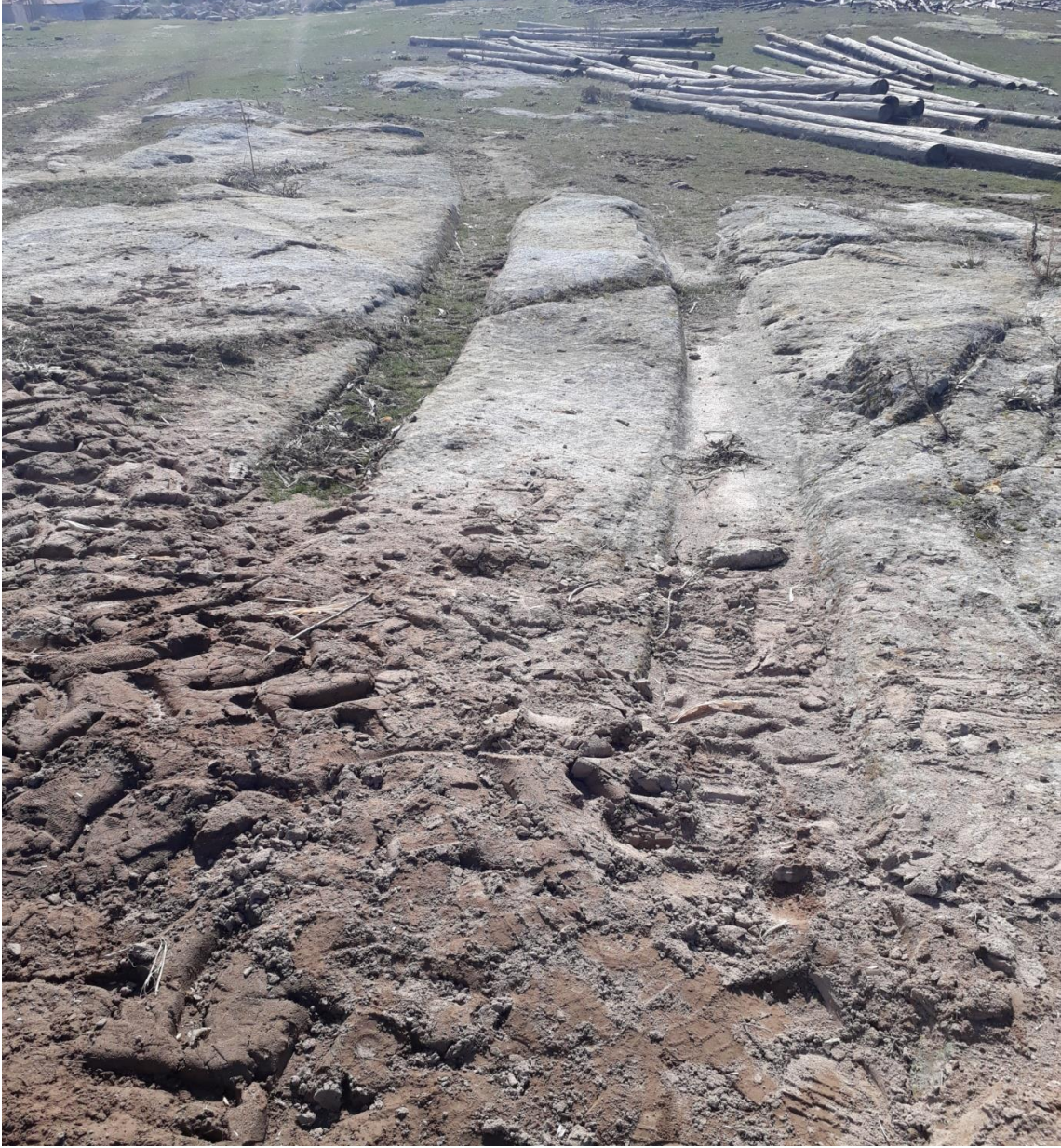
Şekil 98. Karaçayır antik Yolu 7

Karaçayır Antik Yolu 7, Köy merkezinin (Muhtarlık) 670 m kuzeyinde karaçayır Mevkiinde yer almaktadır. Karaçayır antik Yolu 1 ile kesişmektedir.