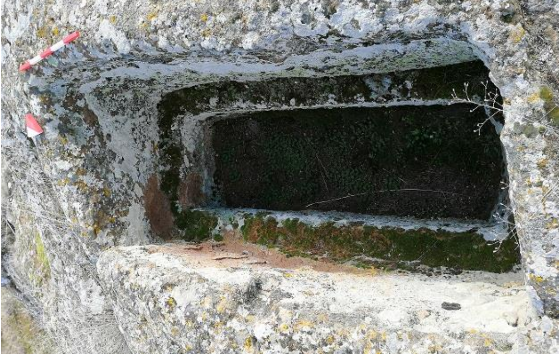
Şekil 17. Yumrukaya Nekropolisi Mezar 15

Basit khamosorion tipindeki mezar, YMK Nekropolünün kuzeydoğusunda yer almaktadır. Kuzeydoğu-güneybatı doğrultusunda uzanmıştır. Mezar Roma Dönemine tarihlenmekle birlikte Phryg ve Phryg öncesi de kullanıldığı tahmin edilmektedir.