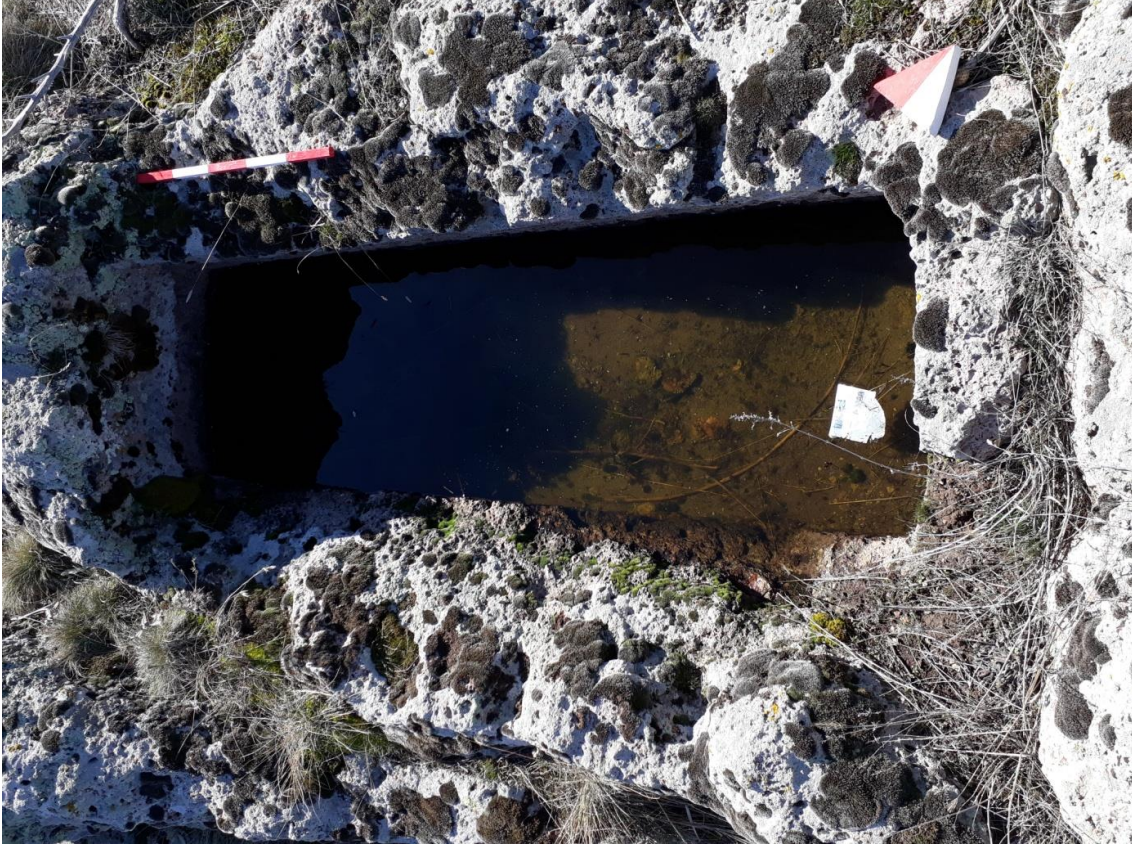
Şekil 55. Köy Mezarlığı Nekropolisi Mezar 2

Basit khamosorion tipindeki mezar, Nekropolisin, güneybatısında yer almaktadır. Mezar, kuzeydoğu-güneybatı yönünde uzanmaktadır.