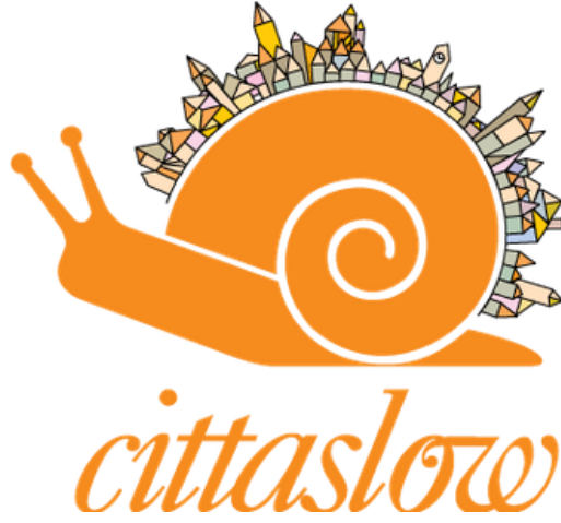
Şekil 1. Cittaslow Logosu