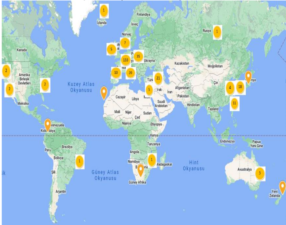
Şekil 2. Dünyada ki Cittaslow Şehirleri

Şekil 2’ de Cittaslow hareketine katılan şehirler konum işaretlemeleriyle gösterilmektedir. Haritada belirtilen sayılar o bölgede yer alan Cittaslow sayılarını ifade etmektedir. Dünyadaki Cittaslow şehirlerinin Avrupa’ da ve daha ziyade kıyı kesimlerde yoğunlaştığı görülmektedir.