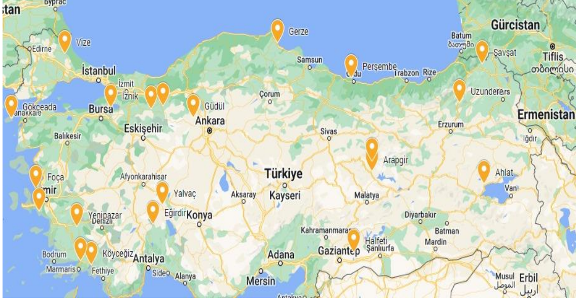
Şekil 3. Türkiye’de ki Cittaslow Şehirleri