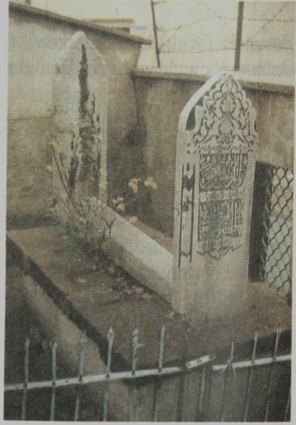
Resim III: Akmeşced Camii bahçesinde bulunan mezar