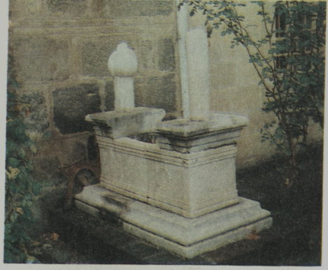
Resim VII: Mısrı Camii'nin bahçesinde Kasım Paşa'nın mezarı