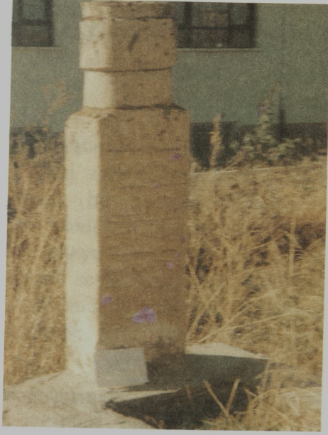
Resim XIII: Bolvadin'de Hoca Abbaszâde Necati'nin kabri