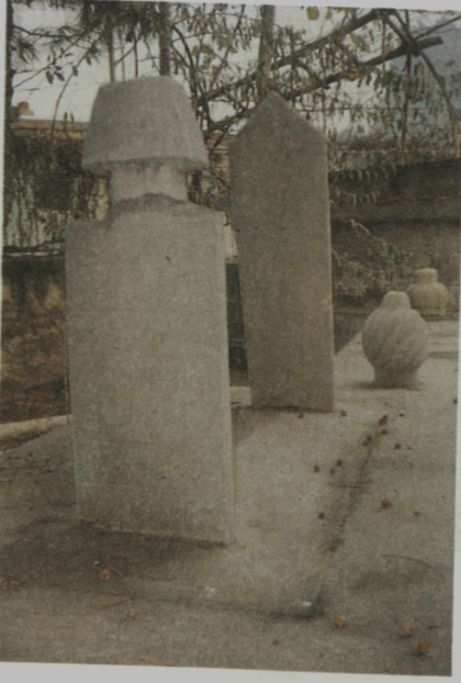
Resim IX: Çavuşbaş Camii bahçesindeki mezar taşı