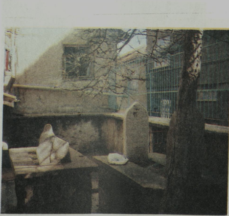
Resim VI: Başçeşme Camii'nin kible tarafında bulunan kabirler