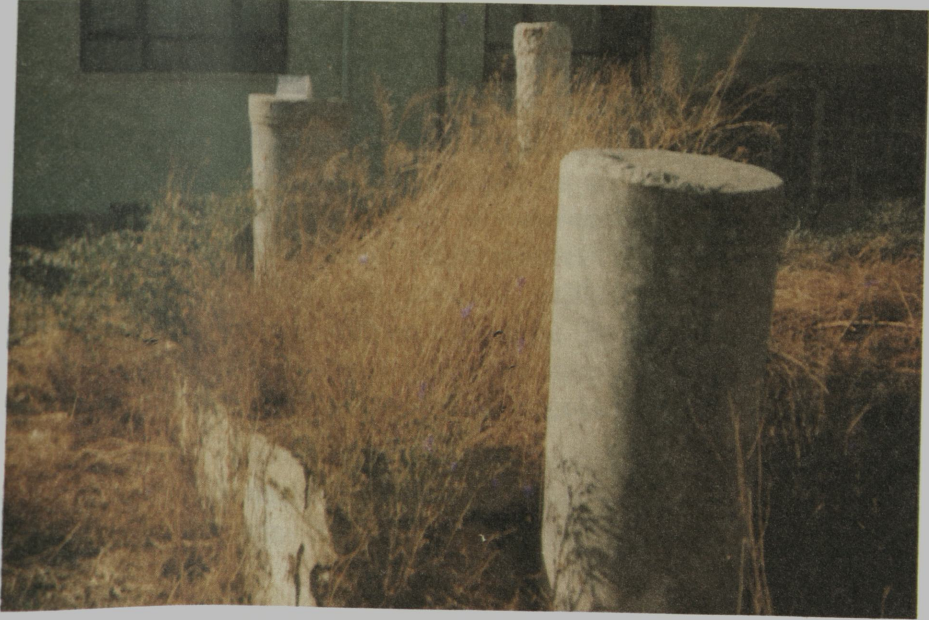
Resim XIV: Bolvadin'de Şeyh el-hac Veliyyuddin Efendi'nin mezarı