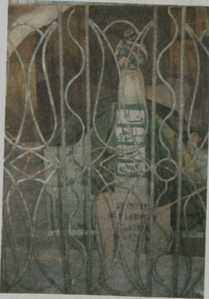
Resim X: Kadınlar Pazarı'nda Süleyman Şah'ın kabri