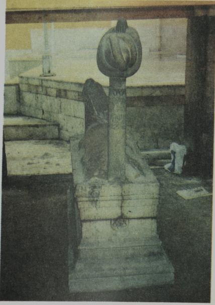
Resim V: Otopazarı Camii arkasında bulunan kabir