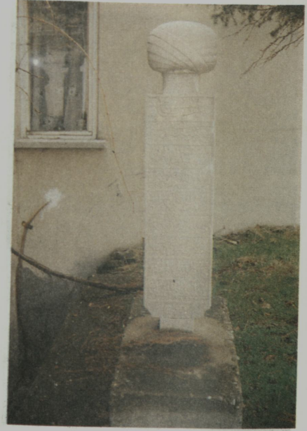
Resim XI: Hacı Aşık Camii bahçesindeki kitabe