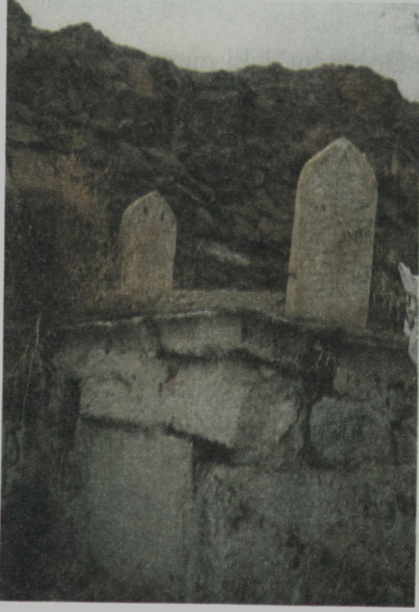
Resim I: Mürdümeck Sultan'a ait mezar