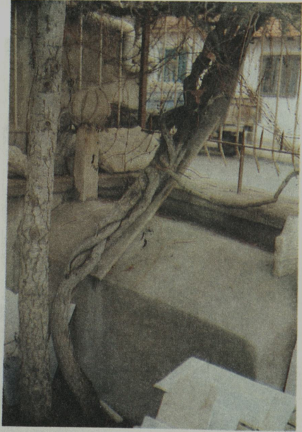
Resim VIII: Olucak Camii bahçesinde Çavuşbaş Dede'nin mezarı