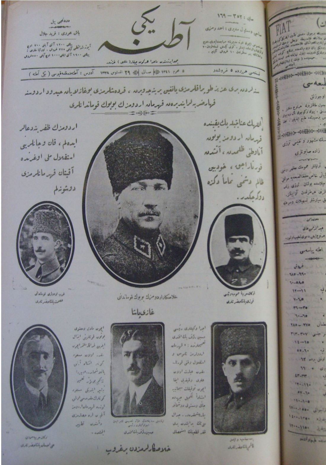
EK: 15. Büyük Taarruzun Başlamasının Yeni Adana gazetesince altın sarısı yazıyla Adana kamuoyuna aktarılması. Bkz: Yeni Adana, 29 Ağustos 1922, No: 169-352.