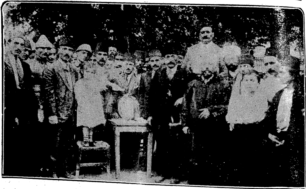
ظفر شنلکری مناسبتیه موزه عسکری مدیر محترمی احمد مختار پاشا حضرتلری طرفدن «۵۰» غروشه مایه اوانان قارپوزک آیاصوفیه جامعی حاویسنده هلال احمر نامه موقع مزایده به وضعی صره سنده خلقک مهالکانه اشتراکی

اجتماعنده تنسیب ایدیلش اولغله استانبول خلقنکده بوامر خیره و معاونه اشتراکی اسبابنک تأمین ریجا ایدیلکده در. خلقمزنک و وطن احتیاجاتی بزدن دها آتی تقدیر ایده چکی طبعیدر هلال احمر جمعیتی مرکز عمومیسی بوجهته مخصوص اوله رق ویریله چک اعاناتی قبوله آماده اولوب استانبول اهالیسنک بو ایدیلکه کمال تهالکله اشتراک ایتمسه منتظر بولنقده در .