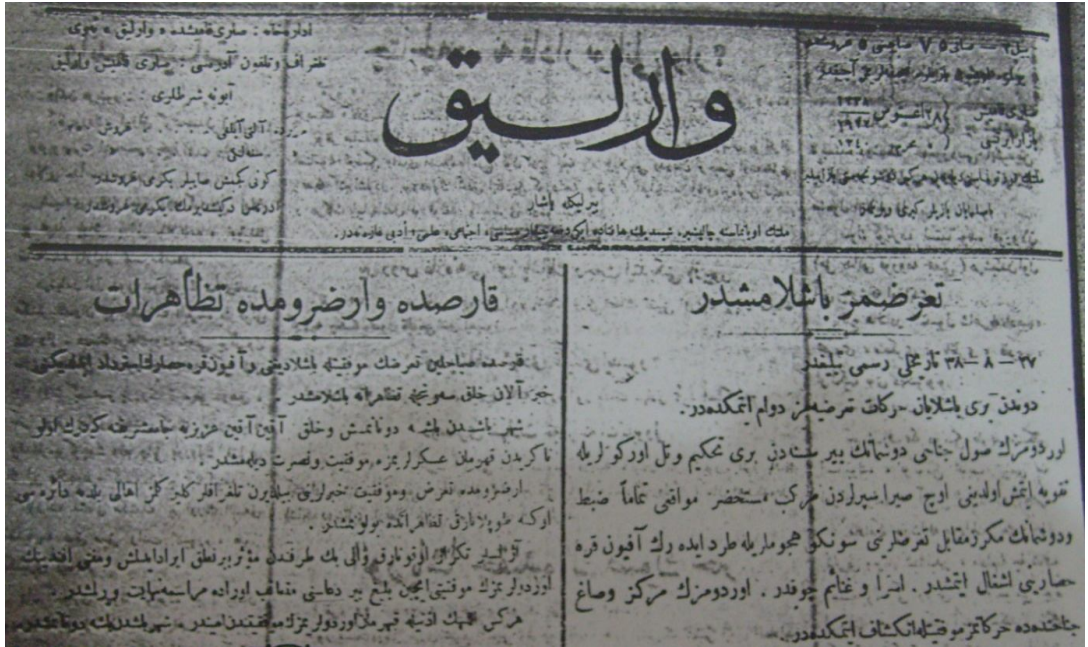
EK: 10. Büyük Taarruzun başladığı ve bu sebeple Kars ve Erzurum'da Tezahüratların Yapıldığına Dair Varlık 'ta Çıkan Haberler. Bkz: Varlık , 28 Ağustos 1922, No: 75.