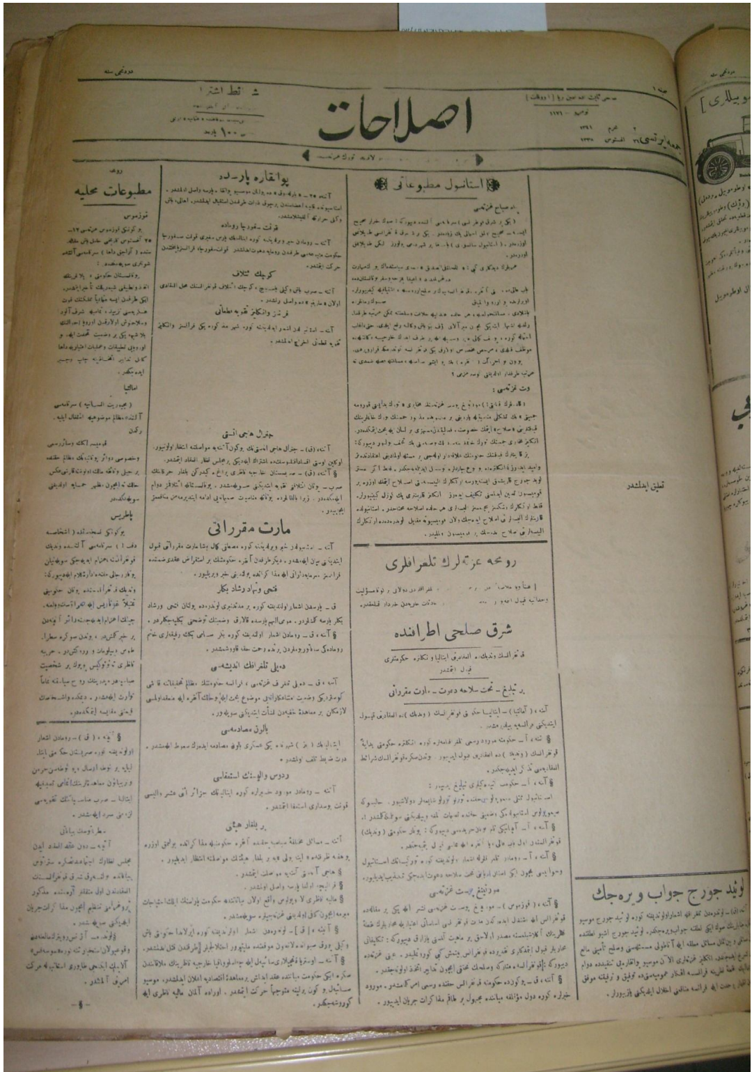
EK: 11. Islahât Gazetesinde Sansürlenlen Bir Başyazı. Bkz: Islahât , 26 Ağustos 1922, No: 1171.