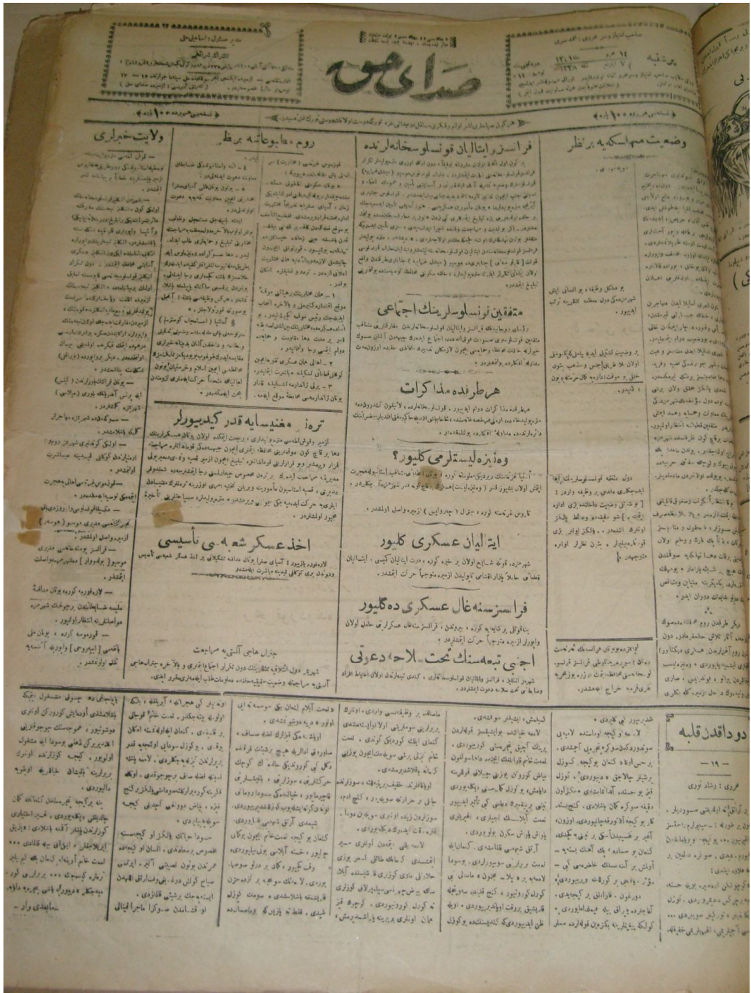
EK: 13. İzmir'in Kurtuluşundan İki Gün Önceki Sada-yı Hak Gazetesi. Sada-yı Hak , 7 Eylül 1922, No: 14.