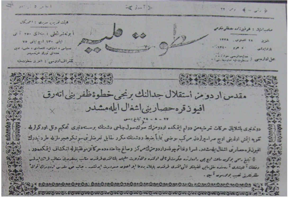
EK: 9. Afyonkarahisar'ın Kurtuluşunun Satvet-i Milliye 'ye Yansıması. Bkz: Satvet-i Milliye , 28 Ağustos 1922, No: 22.