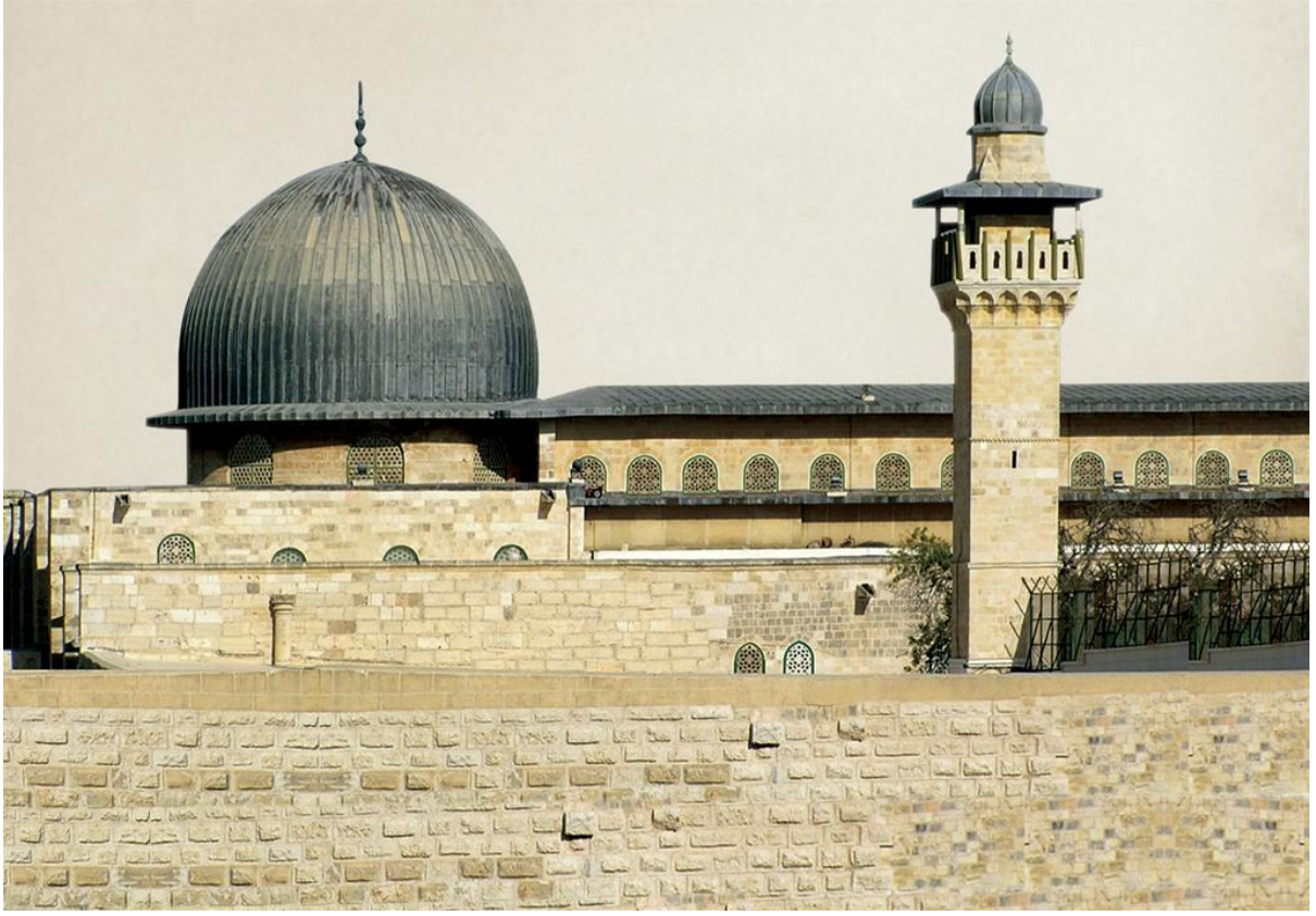
Ek 12. Mescid-i Aksa'dan Bir Görünüm