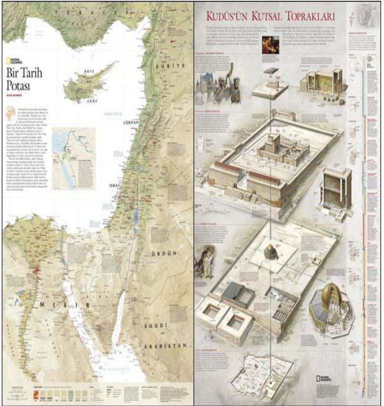
Ek 14. Kudüs'te Bulunan Kutsal Topraklar