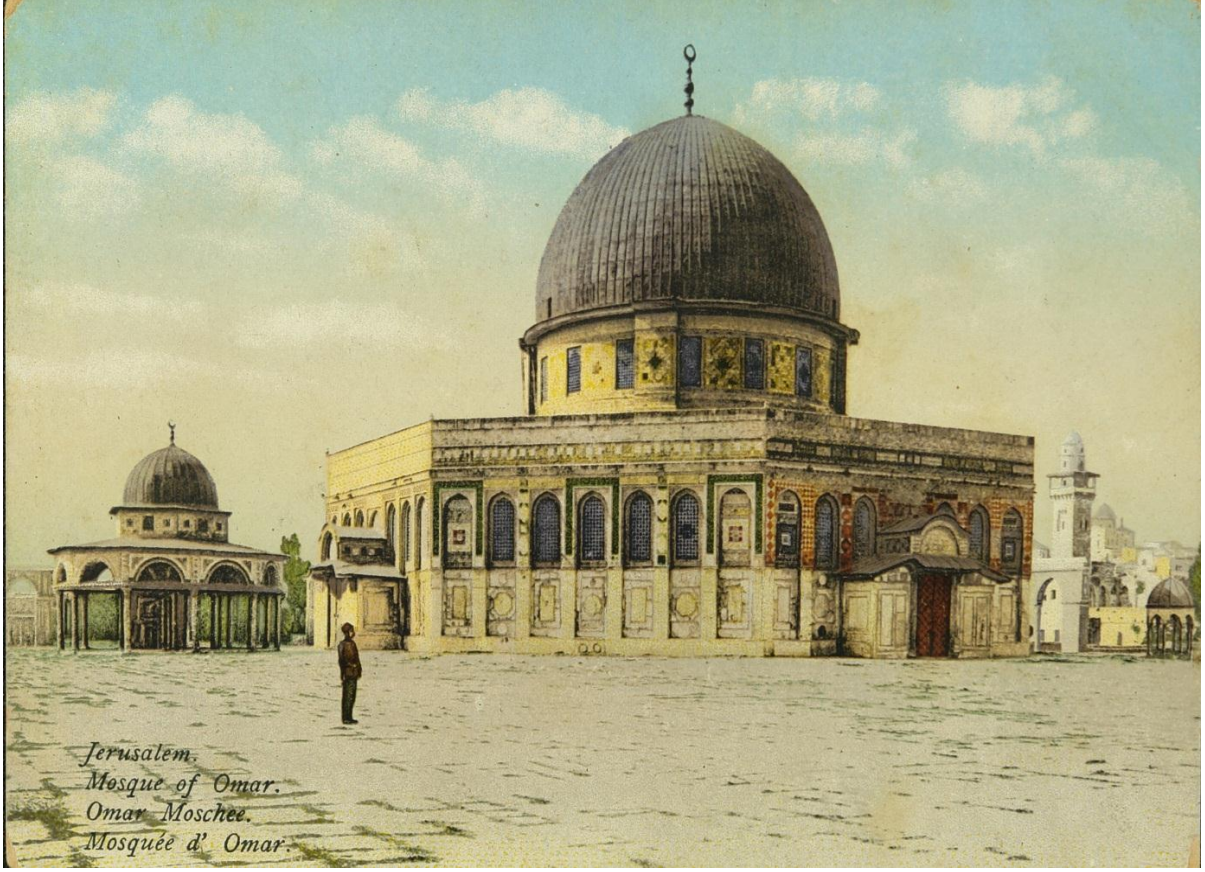
Ek 13. Sahratullah tan bir görünüm