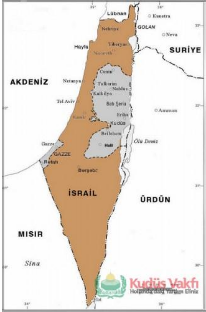
Ek 10. Günümüzde2 Kudüs ve el-Halil'i Gösteren Harita