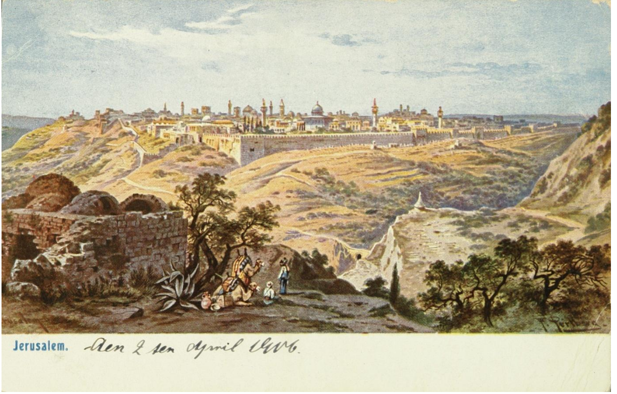
Ek 11. Kudüs'ten Genel Bir Görünüm