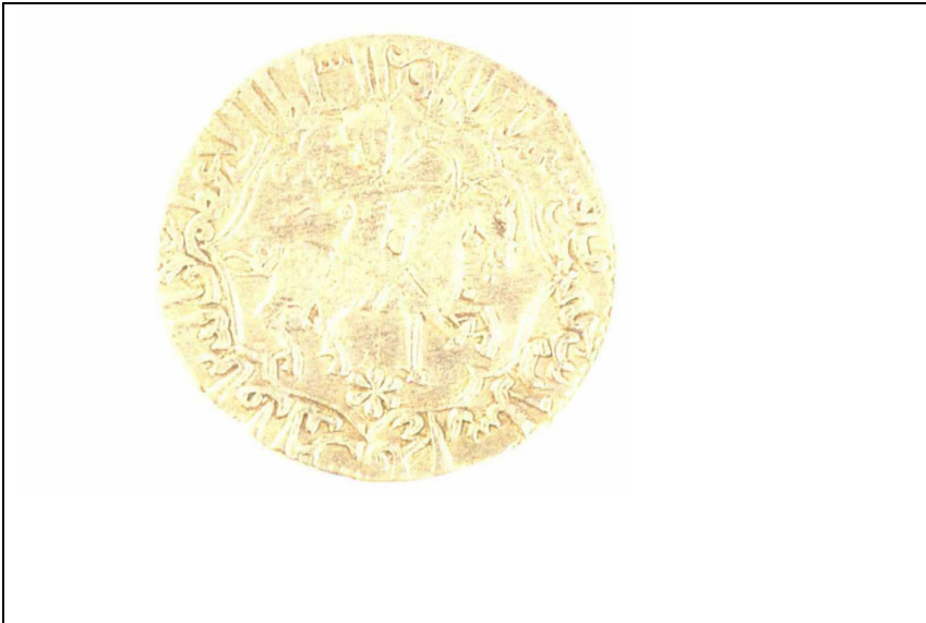
Resim 4: IV. Kılıç Arslan Dönemine ait, ok ve yay figürlü sikke