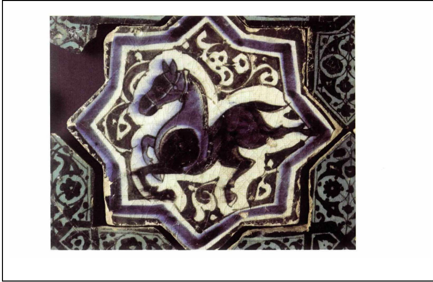
Resim 5: At Figürlü Çini