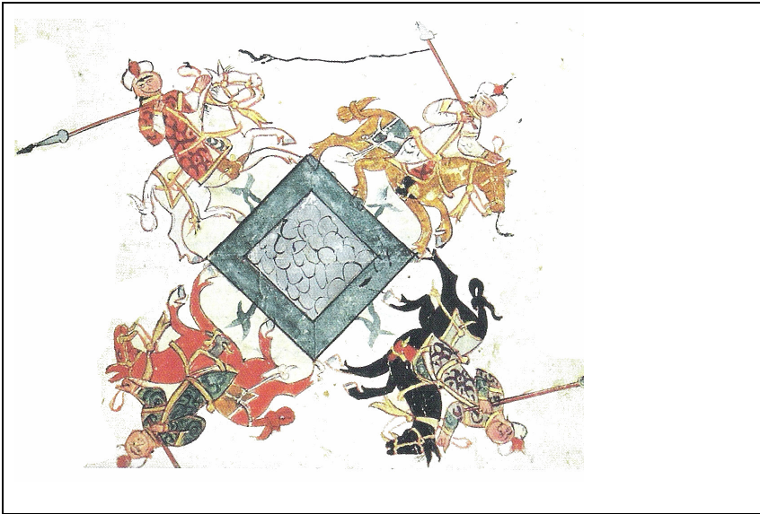
Resim 8: Selçuklularda Bir Cirit Oyunu