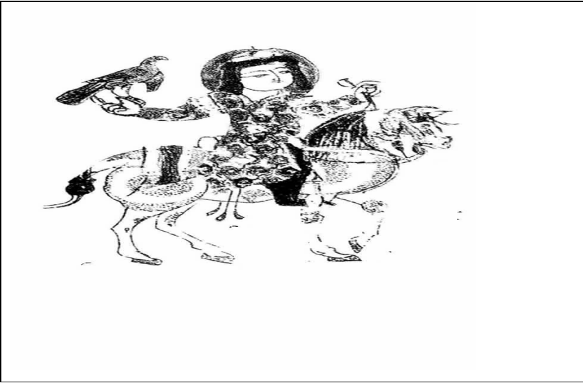
Resim 2: Selçuklu Tabağında Avcı ve Şahini