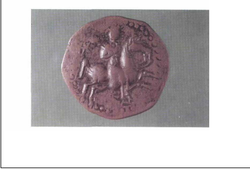
Resim7: Tokat Meliki II. Süleyman Şah Dönemine Ait Sikke