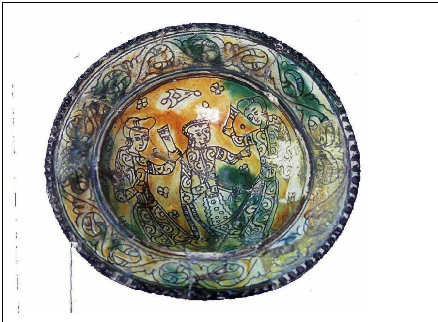
Resim 10: 13.yüzyıla Ait Rakkase Figürlü Seramik Tabak,