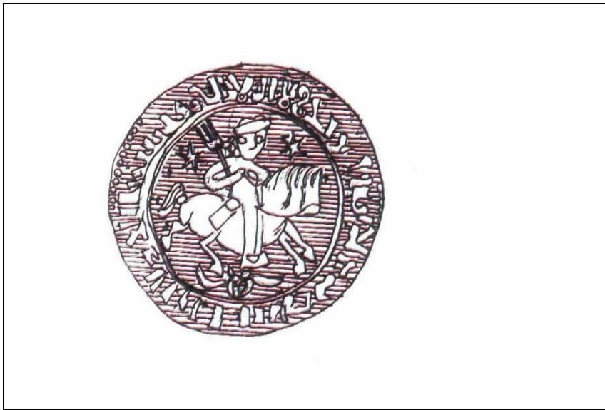
Resim6: II. Süleyman Şah Dönemine Ait Para Çizimi