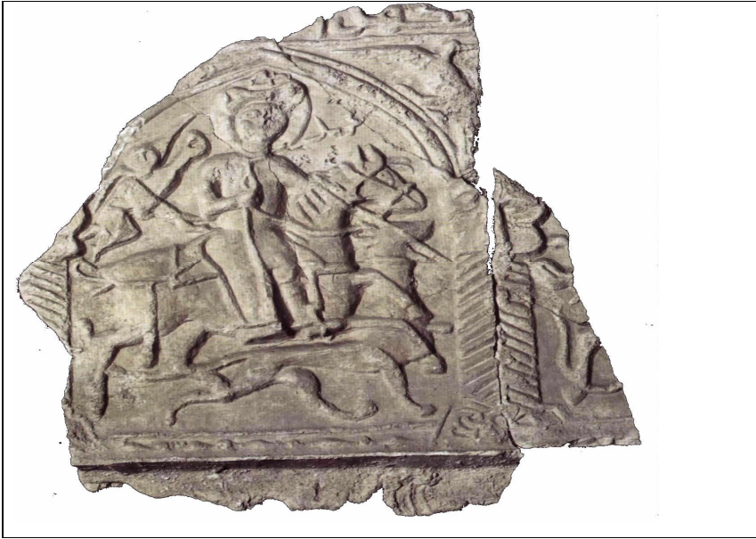
Resim 3: Av Sahneli Alçı Pano