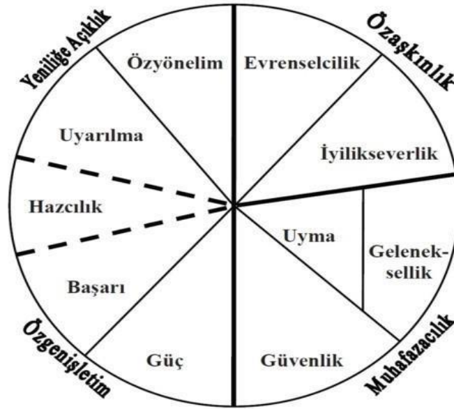
Şekil 1: Schwartz’ın Değerler Şeması