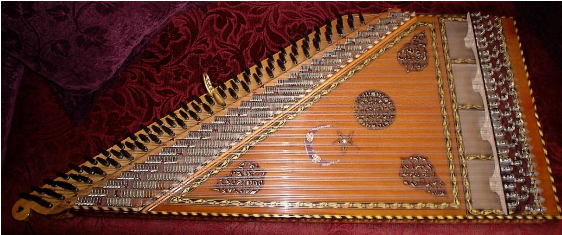
Resim 1. Kanun Enstrümanı.