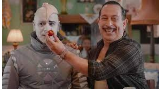
Resim 15. 216 (Ozan Güven) ve Arif Işık (Cem Yılmaz)