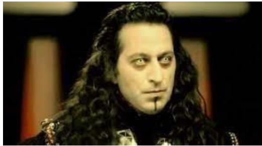
Resim 2. Komutan Logar (Cem Yılmaz)