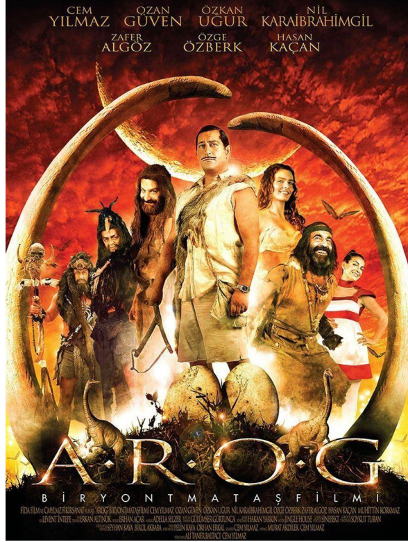
Resim 19. A.R.O.G Film Afiş Tasarımı