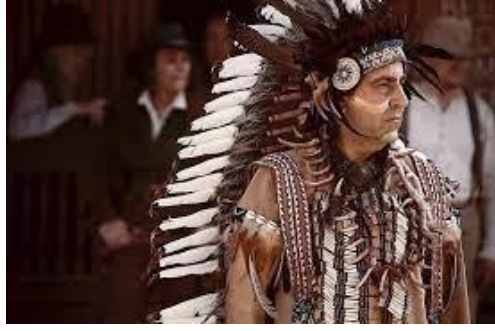
Resim 14. Kızılkayalar (Özkan Uğur)