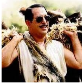
Resim 8. Arif Işık (Cem Yılmaz)