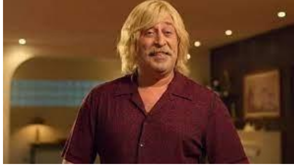
Resim 7. Erşan Kureri (Cem Yılmaz)