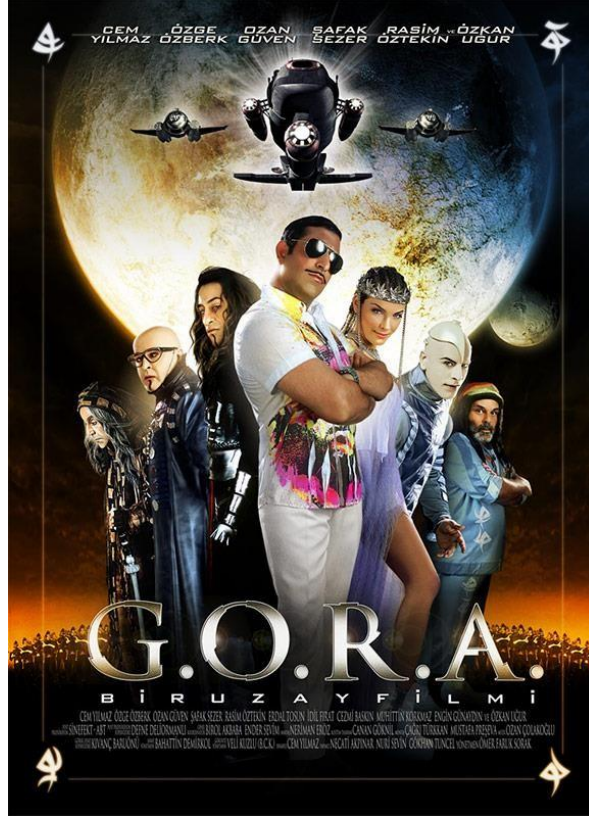
Resim 18. G.O.R.A. Film Afiş Tasarımı