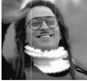
Resim 3. Komutan Kubar (Cem Yılmaz)