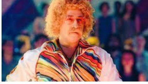
Resim 16. Erşan Kureri (Cem Yılmaz)