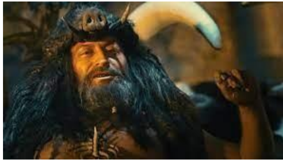
Resim 9. Kaaya (Cem Yılmaz)