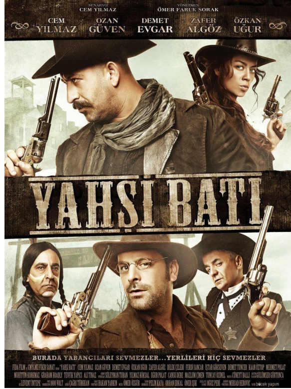
Resim 20. Yahşi Batı Film Afişi Tasarımı