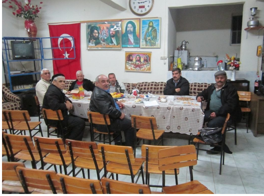
Serik Türkmenleri Derneği lokali ve Tahtacı vatandaşlarımız