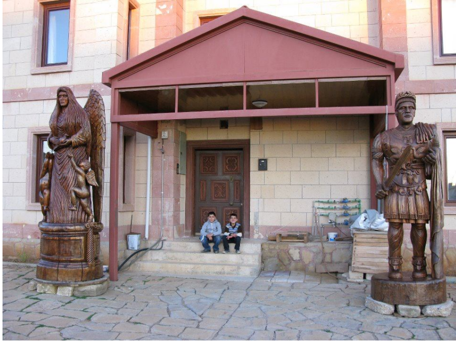
Tahtacılıktan el sanatçılığına 6.