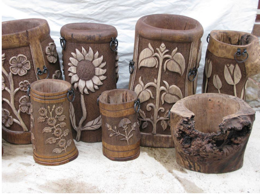
Tahtacılıktan el sanatçılığın 1. İbrahim Badruk isimli Tahtacı vatandaşımızın el emeği ile ortaya çıkan ağaçtan yapılmış eserler.