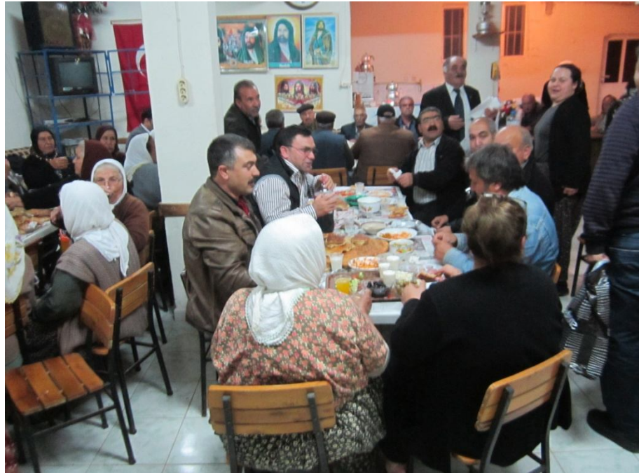
Nevruz günü akşamı, pay edilen kömbelerin kesilen cebrail ve yapılan yemekler eşliğinde yenilmesi