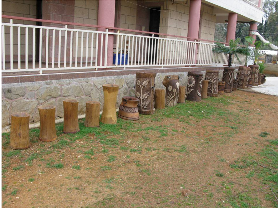
Tahtacılıktan el sanatçılığına 4.