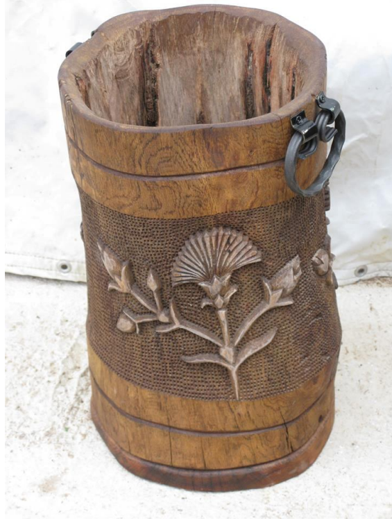
Tahtacılıktan el sanatçılığına 5.