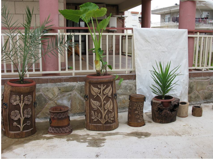
Tahtacılıktan el sanatçılığına 3.