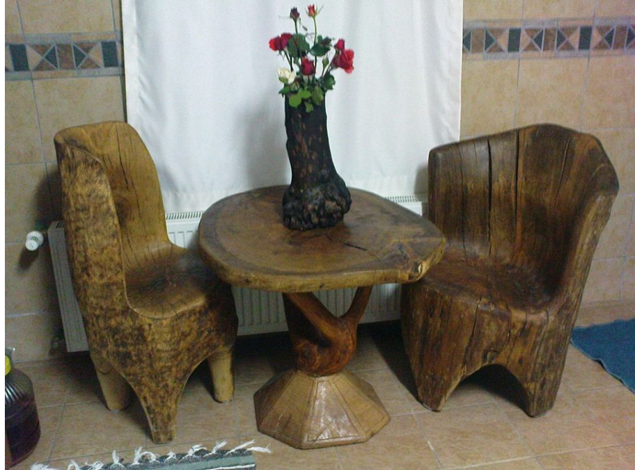
Tahtacılıktan el sanatçılığın 2.