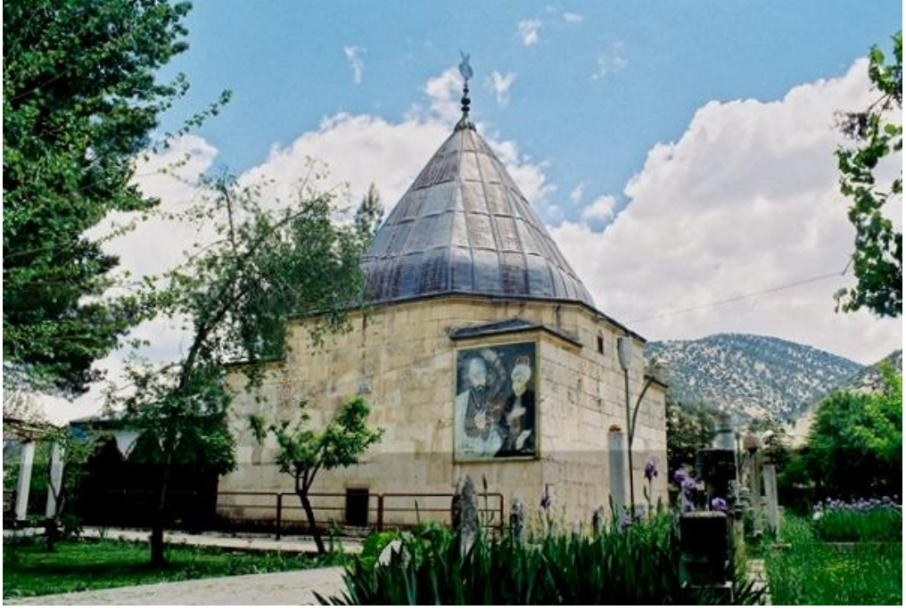
Serik Tahtacılarının ziyaret yerlerinden birisi olan ve Elmalı'nın Tekke köyünde bulunan Abdal Musa türbesi.