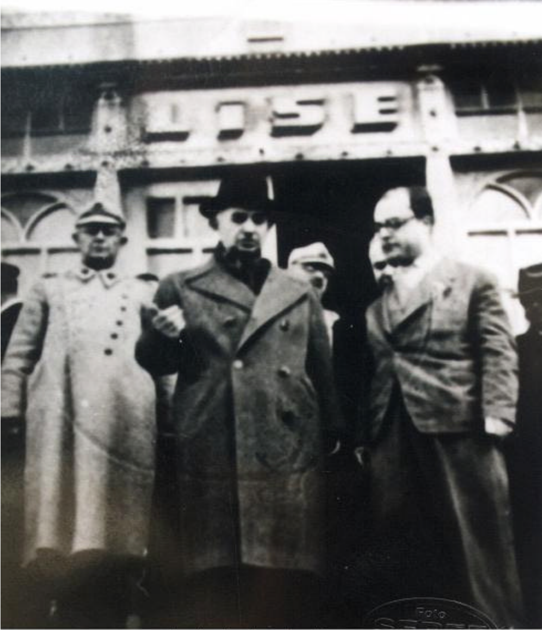
İNÖNÜ LİSE ÖNÜNDE

Ek 8: İsmet İnönü'nün Afyon Ziyareti'nden Afyon Lisesi Önünde