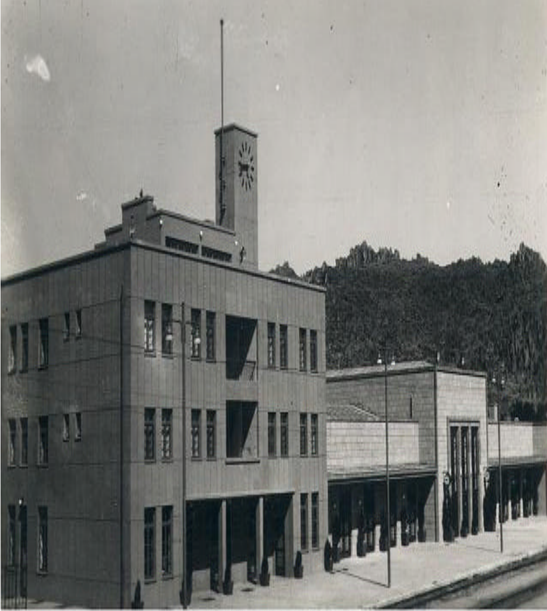
AFYON GAR BİNASI