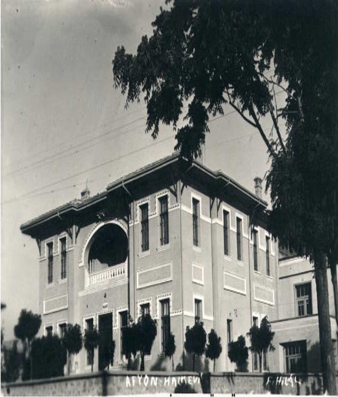
AFYON HALKEVİ (REKTÖRLÜK)