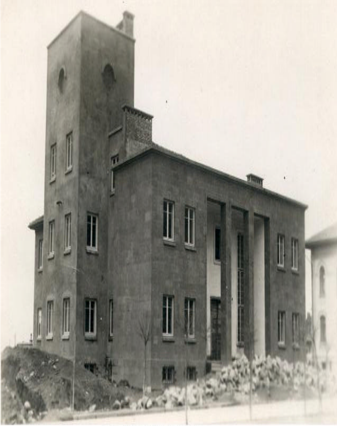
PTT BİNASI İNŞAATI