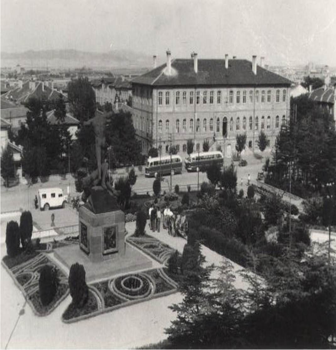
UTKU ANITI ve HÜKÜMET KONAĞI

Ek 1: Utku Aniti (Zafer Aniti) ve Hükümet Konagi'ndan Bir Görünüm