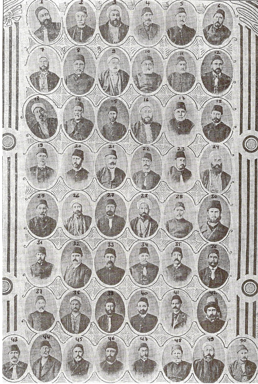
TPT, I ve II. Meşrutiyet, C:2, Hazırlayan: İhsan Güneş ve TPT Araştırma Grubu, TBMM Vakfı Yayınları, Ankara, 1998, s.218.

Yukarıdaki fotoğrafta Birinci Meşrutiyet döneminde, 1877 yılında Meclis-i Mebusan üyeleri toplu halde görülmektedir. Bu fotoğrafta Ermeni mebuslar şunlardır;