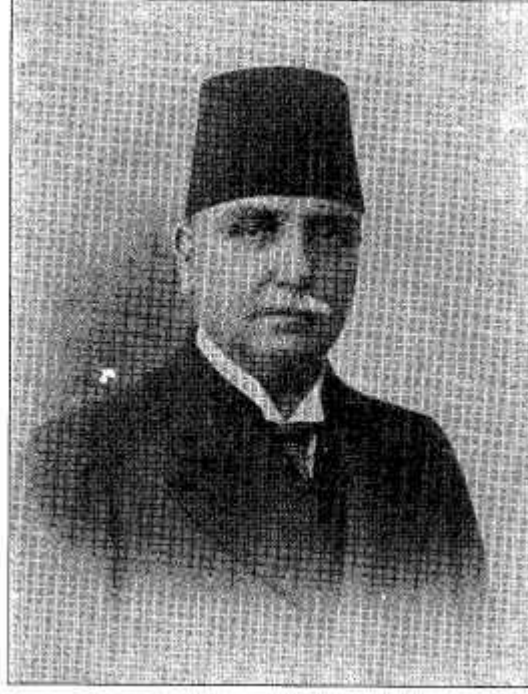
İstanbul mebusu Kırkor Zöhrap Efendi

TPT, I ve II. Meşrutiyet, C:2, Hazırlayan: İhsan Güneş ve TPT Araştırma Grubu, TBMM Vakfı Yayınları, Ankara, 1998, s.41.