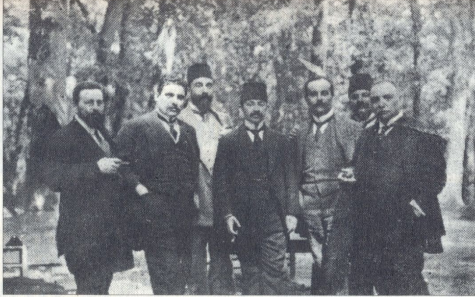
Zohrab, sevdiği mekânlardan İstanbul Alemdağ'da dostlarıyla.