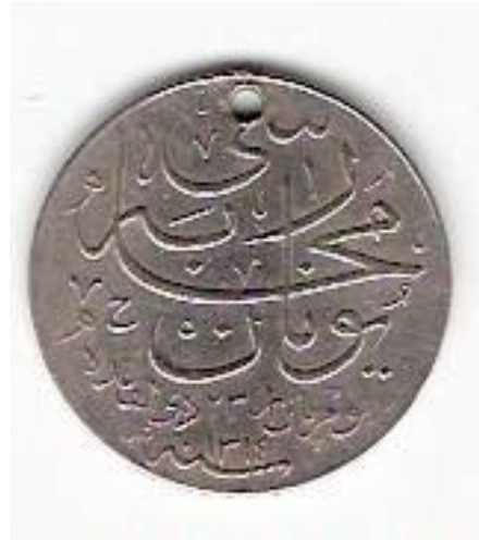
Resim 2. Gümüş Yunan Muharebe Madalyası Ön Yüz