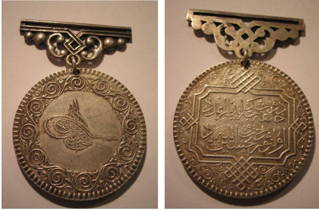
Resim 1. Tahlisiye Madalyası Ön Yüz

Tahlisiye Madalyası'nı, Osmanlı Devleti, can kurtarmada fiilî olarak hizmeti geçenlere verilmek üzere 1276 (1859) yılında ihdas etmiştir. Yangında nefislerini kurtarmağa muvaffak olamayarak ateş içinde kalanların, kazaen deniz, nehir ve göllere düşüp muhatarada bulunanların, anî olarak yıkılan bina ve duvar altında kalıp kurtulmak imkânı bulamayanların ve bu türlü âfetlerden tehlikeye uğrayanların canlarını kurtarmak maksadıyla kendilerini tehlikeye koymak suretiyle gayret gösterenlere verilirdi 451 .