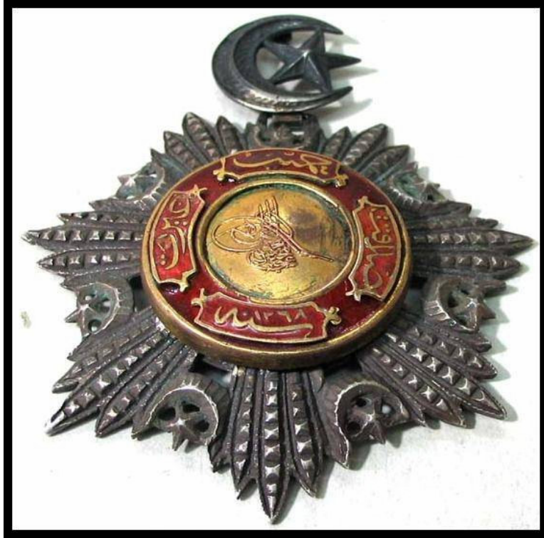
Resim 4. Beşinci Rütbeden Mecidi Nişanı

Toplam 109 Balıkesir'li memurun içinden, sadece 13 tanesi nişan ve madalyaya nail olabilmıştır. Bu durum, genellikle taşrada görev yapan, Balıkesir'li mülki görevlilerin sadece dokuzda birinin nişan sahibi olabilmeleri nişan ve madalya ihdası açısından, sayıca, merkezle taşra arasındaki farkı doğrular niteliktedir.