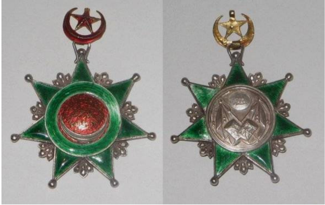
Resim 5. 4. Derece Osmani Nişanı 471