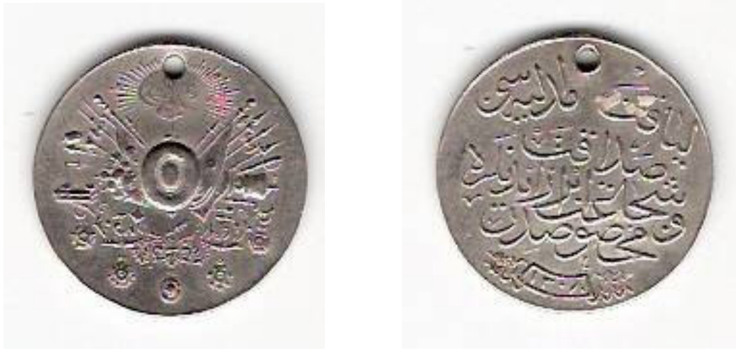
Resim 3. Gümüş Liyakat Madalyası Ön Yüz Gümüş Liyakat Madalyası Arka Yüz