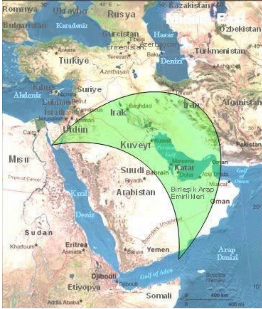
Şekil 5. Şii Hilali