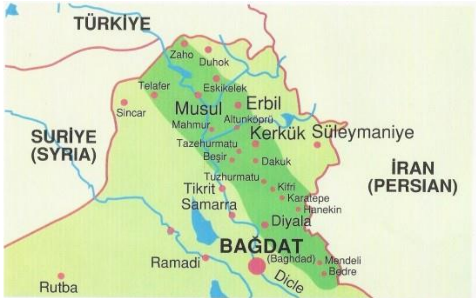
Şekil 4. Irak'taki Türkmeneli Bölgesi