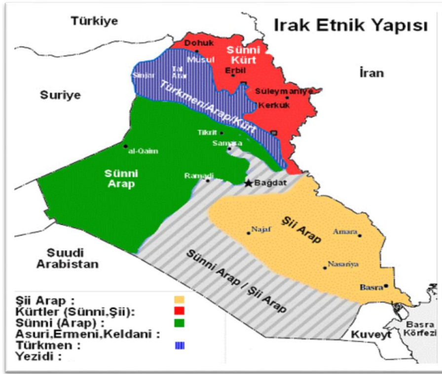
Şekil 2: Irak’ın Etnik Yapısı