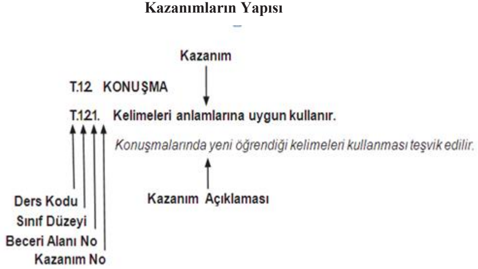
Tablo 5. Kazanımların Yapısı (Türkçe Dersi Öğretim Programı: 20)

Kazanımların yapısı tablosunda görüldüğü gibi, kazanım numaralandırılmasında çeşitli kodlar kullanılmıştır. Dersin kodu en başta yer almaktadır. Ders kodunu sırası ile sınıf düzeyi, hangi beceri alanına ait olduğu ve kazanım numarası izlemektedir. Yan tarafta ise kazanıma ait açıklama yer almaktadır.