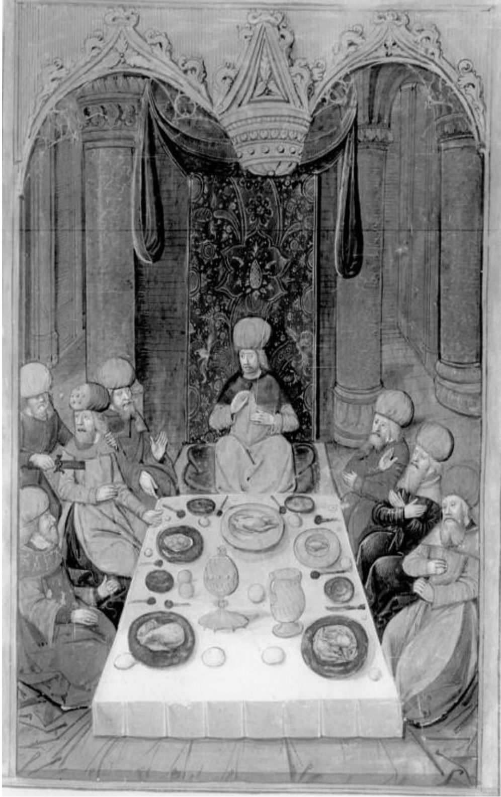
EK-4. Guillaume Caoursin tarafından resmedilen Gedik Ahmed Paşa'nın idamını tasvir eden bir minyatür. (Nicolas Vatin- Sultan Djem, Ankara 1997, s.321)