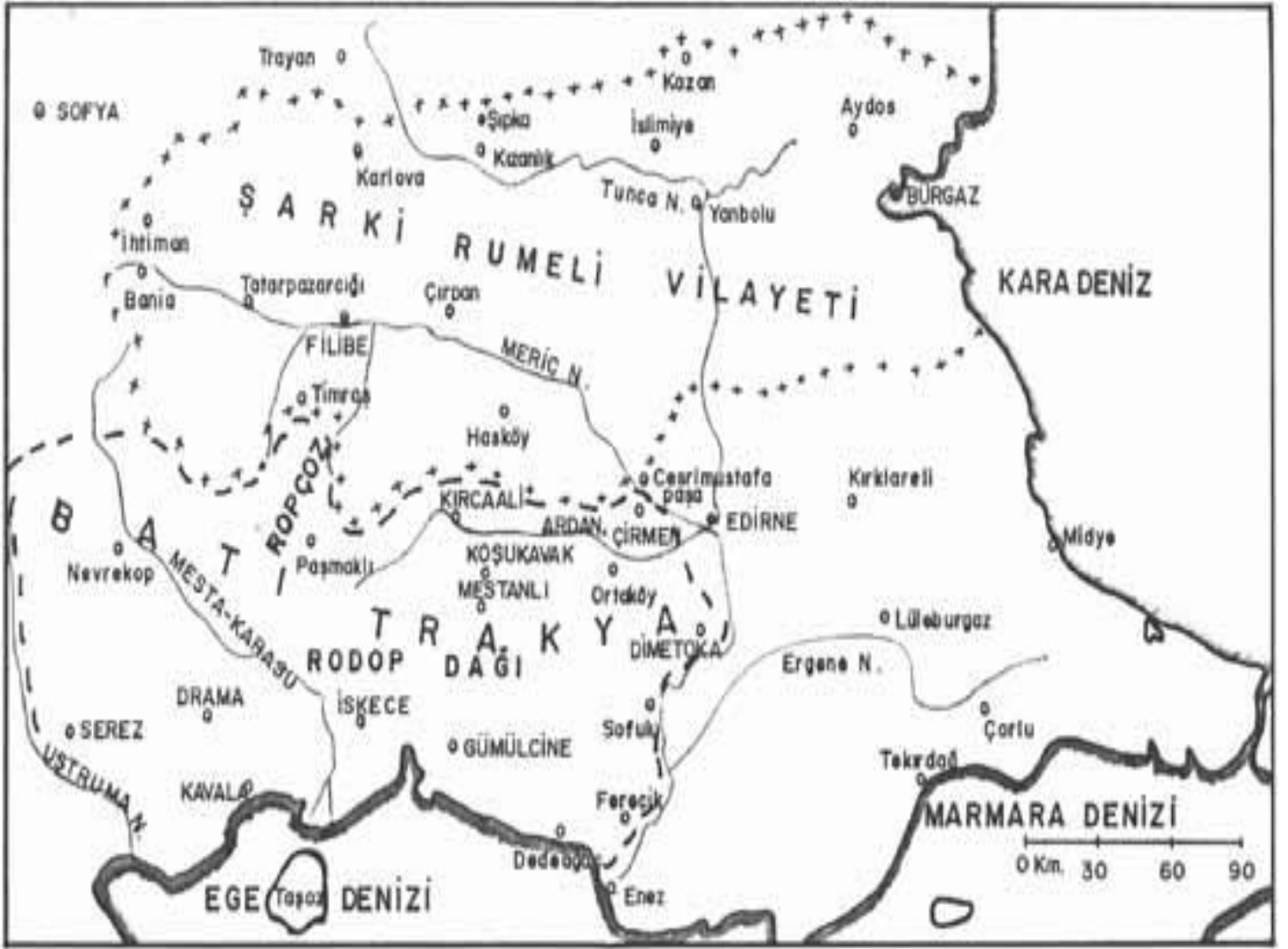
Harita 1. ŞARKİ RUMELİ VİLAYETİ VE BATI TRAKYA