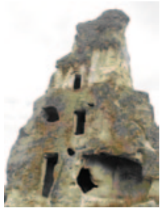
Dağlık Frigya bölgesindeki peribacaları hem doğal güzellikleri hem de yakın zamana kadar günümüz insanın yerleşimine sahne olması nedeniyle yöredeki ilgi çekici yapılar arasında yer alıyor.

Frigler de Anadolu'da MÖ 6000 yılından beri yapılan Ana Tanrıça'ya tapıyordu. Bu inançlarının gereği olarak, bereket getirmesi amacıyla özellikle Dağlık Frigya bölgesinin doğal giriş kapısı niteliğindeki Seydiler çevresinde yaptıkları Ana Tanrıça Martar Kubileya'nın kült anıtlarıyla zengin bir miras bırakmışlardır. Bu kültürün bir sonucu olarak, tüflerin içerisine oyulmuş, merdivenleri doğuya bakan başka bir dinsel yapıt da oluşturmuşlardır. Burada bir çeşit oturma yerine çıkan ve sunak olarak kullanılan merdivenler ve tanrıçanın oturması için hazırlanmış sembolik tahtlar vardır. Selimiye'nin İbrahim İnlerindeki Manastır'da, Seydiler'in Kırkinler Kilisesi'nde, Ağın Dağı'ndaki Ağınönü Kilisesi'nde ve İbrahim İnleri'nde kaya yerleşimleri, mezar odaları, kayalıkların üst kısımlarında kaklıklar (su havuzcukları), kayaların ulaşılması güç yerlerinde ise mezar odaları vardır.