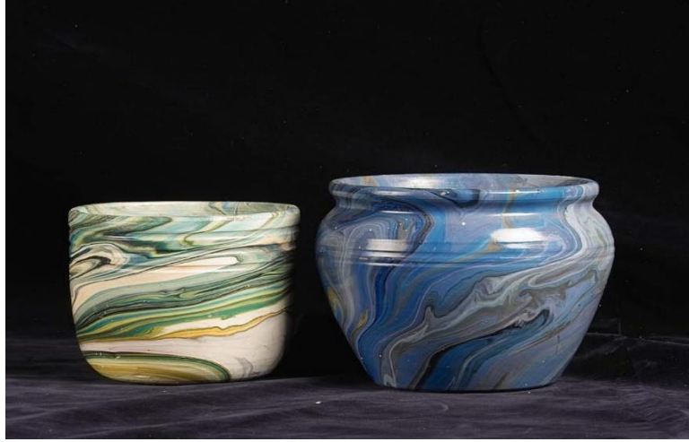
Şekil 3. Seramik Üzerine Uygulanan Ebru Çalışması

Elbeyi Pelit ve Turgut Türkoğlu, 3 (1) 2019