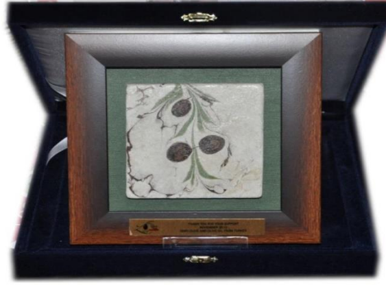
Şekil 4. Doğal Taşa Uygulanmış Küçük Zeytin Ebru Çalışması