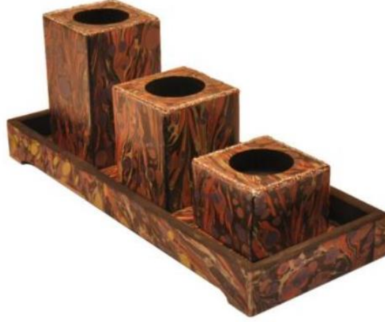
Őekil 1. Ebrulu Deri Mumluk