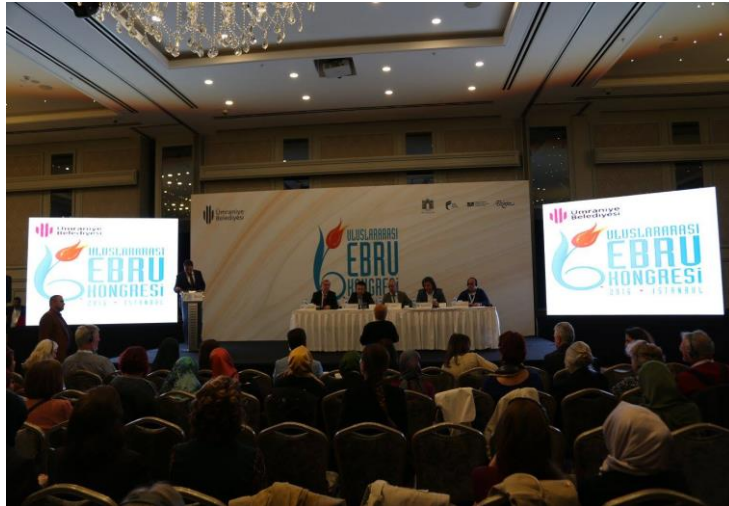
Şekil 6. 2016 Uluslararası Ebru Kongresi