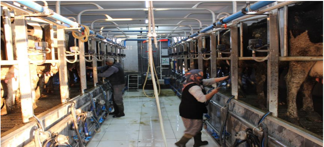
Resim 2.4. Süt sığırı işletmelerinde sađım yöntemleri