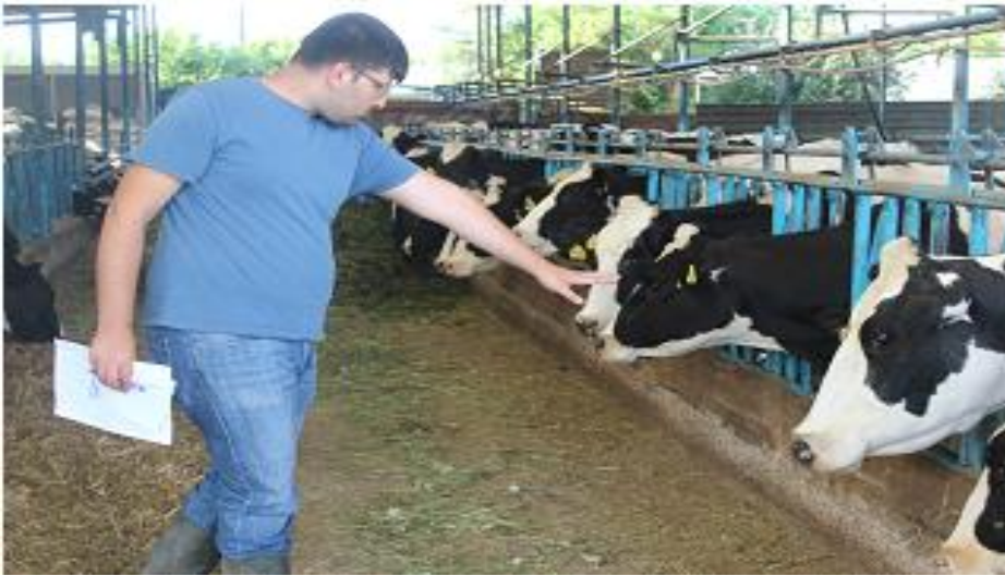
Resim 2.3. Süt ineklerinde kaçınma testinin uygulanışı