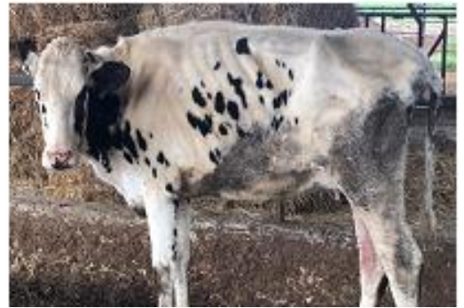
Resim 2.1. Süt ineklerinde beden kondisyon skorları