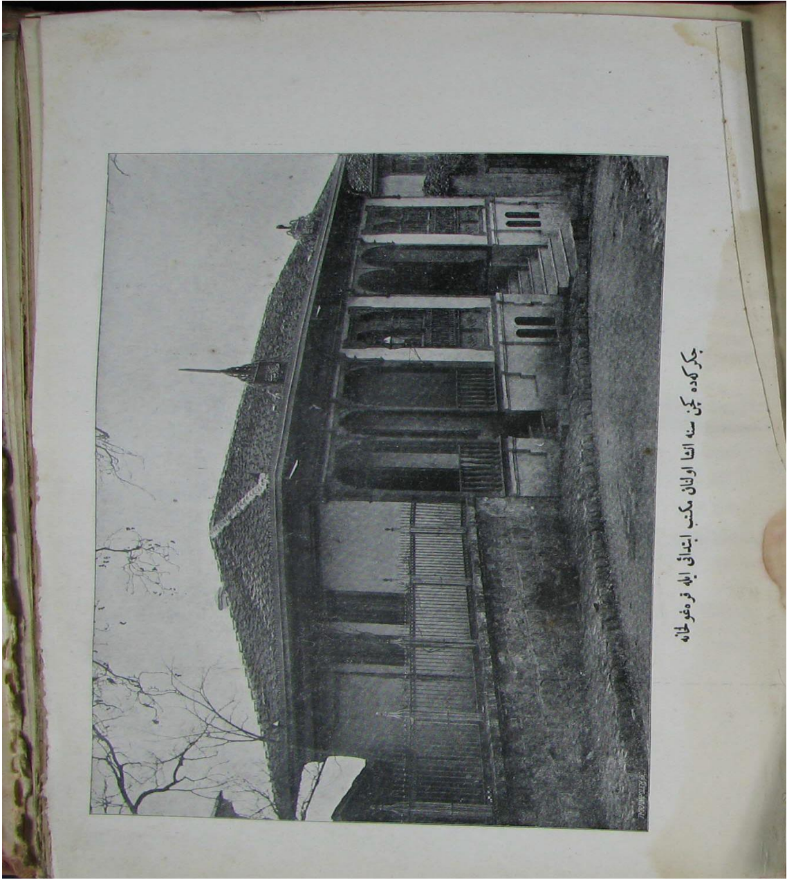
Ek 4 : Çekirge'de yeni inşa olunan ilkokul ile karakol (1905/1906)

(1324 Hüdavendigâr Vilayeti Salnamesi, s.280)