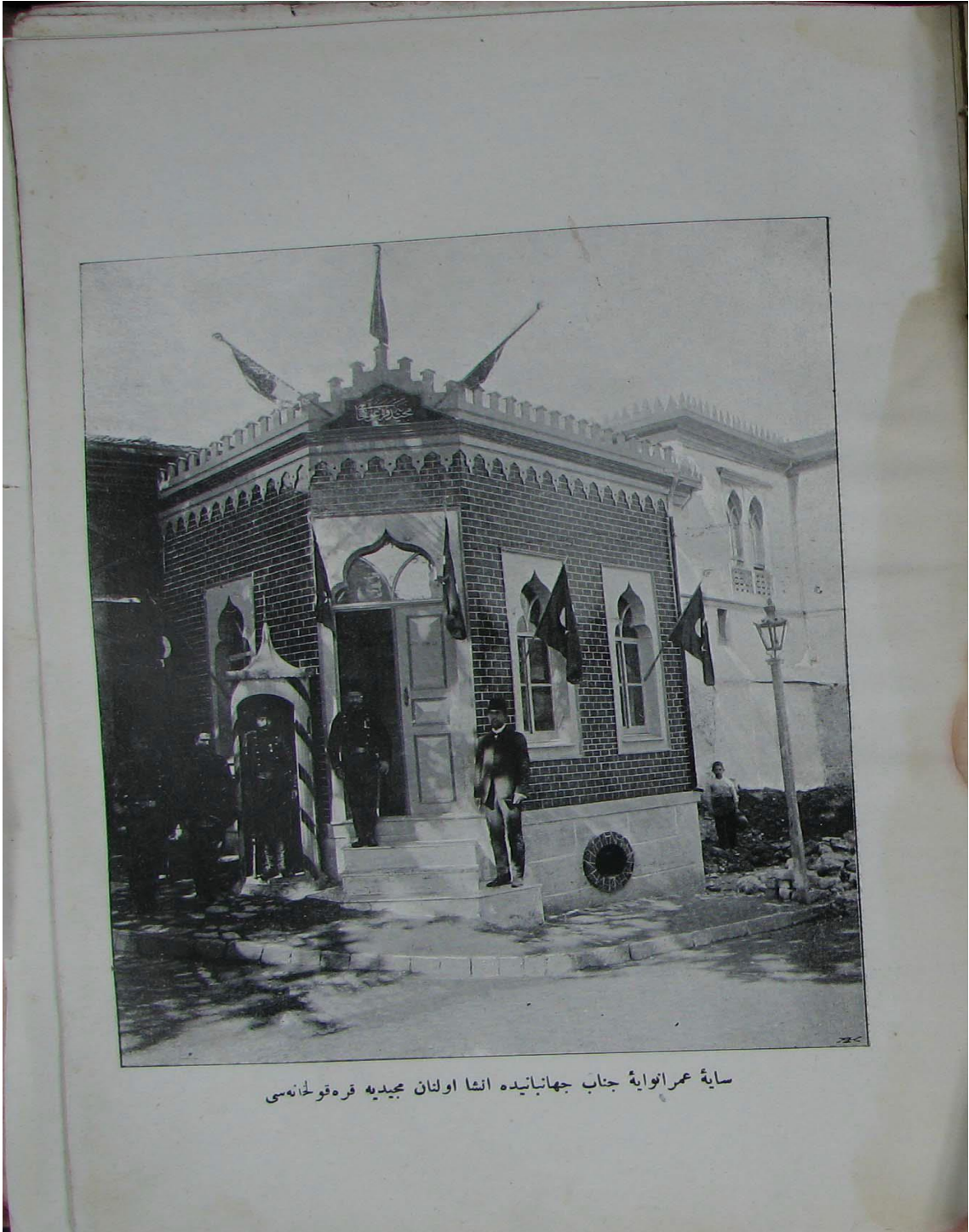
Ek 2: Mecidiye Karakolu (1906/1907).

(1324 Hüdavendigâr Vilayeti Salnamesi, s.273)