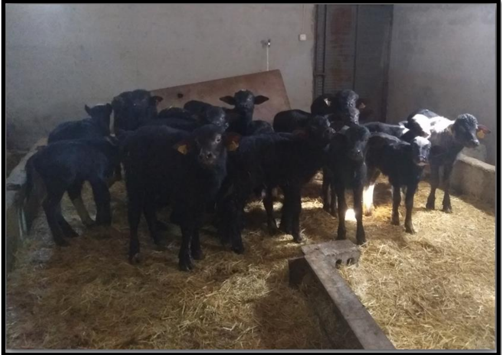
Resim 2.4: Yozgat ilinde yetiştirilen malakların işletmeden toplu görüntüsü