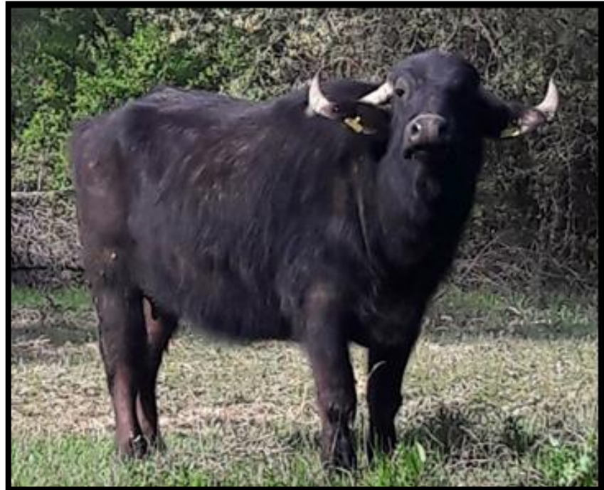
Resim 2.2: Yozgat ilinde yetiřtirilen bir manda ineęi (Medek)