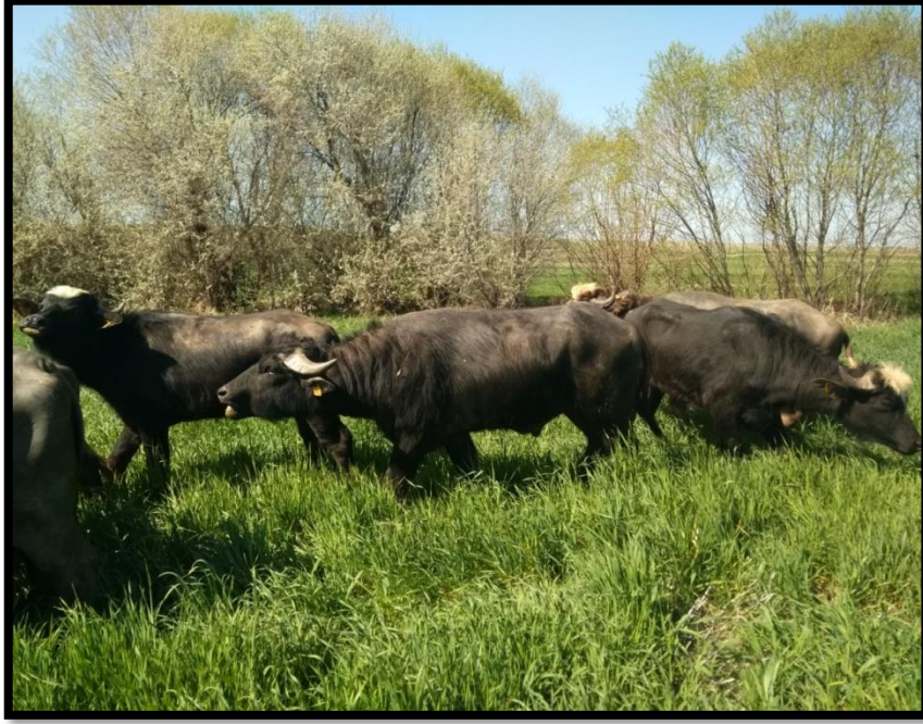
Resim 2.1: Yozgat ilinde yetiřtirilen bir manda boęası

izelgelerinde verilmiřtir. Mandalardan elde edilen veri sayısı modele ve incelenen zellięe gre hayvan sayıları (n) 552 ile 2330 arasında deęiřiklik gstermiřtir. Yozgat ilinde uygulanan projede yer alan mandalara ait resimler resim 2.1 ile 2.4 arasında gsterilmiřtir.