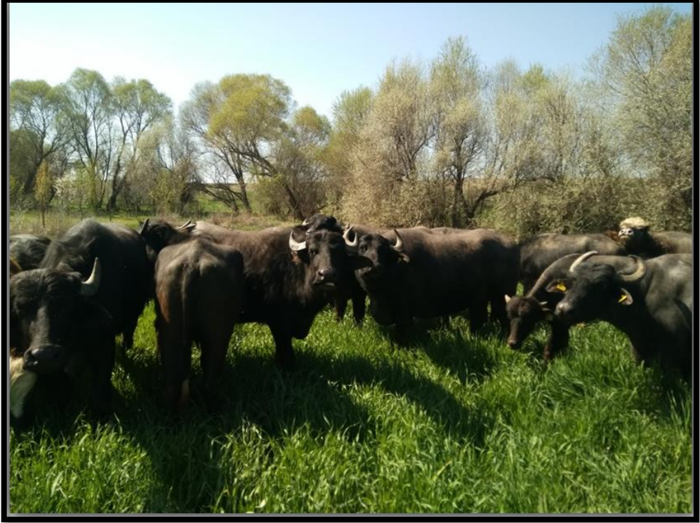
Resim 2.3: Yozgat ilinde yetiştirilen sürü halinde merada otlayan mandalar