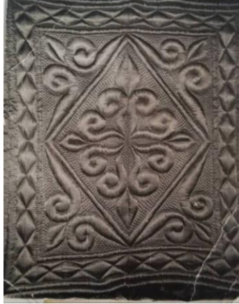
Şekil 14. Halı deseni

Şekil 13’de yer alan örnek Leman Küçükkurt’un 1985 yılında diktirdiği yorgandır. Astarı mermerşahi, yüzü işlemeli saten denilen kumaştan, 170cmx200cm boyutunda, pamuk dolgulu dikilmiştir. Kumaşın desenine uygun motif oluşturulmuştur. Şekli midyeye benzediği için “Midye Kabuğu” denilmiştir. Ağırlığı 6 kilo gelmektedir.