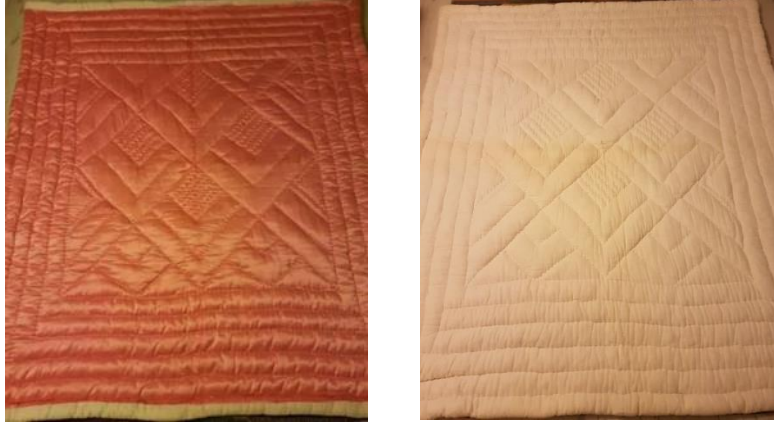
Şekil 19. Çavuş sırması yorganın yüzü ve arkası, Afyonkarahisar.

Şekil 18’de yer alan örnek R. Gülenay Yalçınkaya’nın 1978 yılında diktirdiği yorgandır. Astarı patiska, yüzü saten kumaşından, 170cmx200cm boyutunda, pamuk dolgulu, “Çerçeve” desenli çift kişilik yorganın ağırlığı 5 kilo gelmektedir.