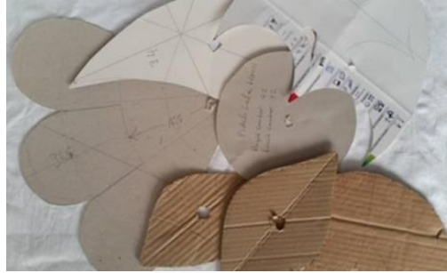
Şekil 6. Desen kalıpları, İsmet Kartal Atölyesi, Afyonkarahisar.

Desen kalıpları; yorgana uygulanacak desenin kumaşa düzgün çizilmesi için hazırlanan mukavva kalıplardır. Birçok desen ustaların hafızasında olmasına rağmen bazı desenlerde kalıp kullanılmaktadır. Bu kalıplar, bir birini tamamlayan ya da kendini tekrar eden desenler şeklinde hazırlanmaktadır (Şekil 6).