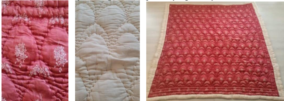
Şekil 13. Midye Kabuğu desenli pamuk yorgan, Afyonkarahisar.

Afyonkarahisar’da evlerde kadın ustalar, atölyelerde erkek ustalar tarafından dikilmiş geleneksel desenlere sahip yorganlar ailelerin yüklüklerinde, ustaların kataloglarda yer almaktadır. Bu bölümde, geleneksel değer taşıyan yorgan örnekleri malzeme, boyut, desen ve kompozisyon açısından incelenmiştir.