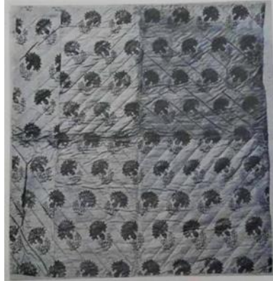
Kaynak: Öz, 1951: 73

Anadolu'nun birçok bölgesinde seçkin yorgan örneklerine rastlamak mümkündür. Bu yerlerden birisi de Afyonkarahisar'dır. Afyonkarahisar'da yorgan üretimi bir meslek olmasının yanında üzerinde taşıdığı desenlerle yöre insanının zevkini yansıtan bir kültür unsurudur. Makineleşme, insanların değişen yaşam tarzı birçok iş kolunu etkilediği gibi yorgan üretimini etkilemiş, usta sayısında düşüş meydana gelmiş, yorgan desenlerinin gün geçtikçe unutulmasına yol açmıştır. Bu nedenle araştırma başlığı “Afyonkarahisar Yorganlarının Teknik, Desen ve