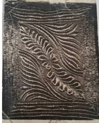
Şekil 16. Söğüt dalı

Şekil 14 de “Halı Deseni”, 15’de ise “Göbekli” kompozisyonuna sahip İsmet Kartal Usta’nın 1990 yılında diktirdiği, 190cmx200cm ebadında çift kişilik yorganlar görülmektedir. Yorganların yüzü atlas, astarı mermerşahi kumaşından dikilmiştir. Usta, bu yorganları sahiplerine teslim etmeden önce fotoğraflarını çektilerip desen kataloğuna eklemiştir.