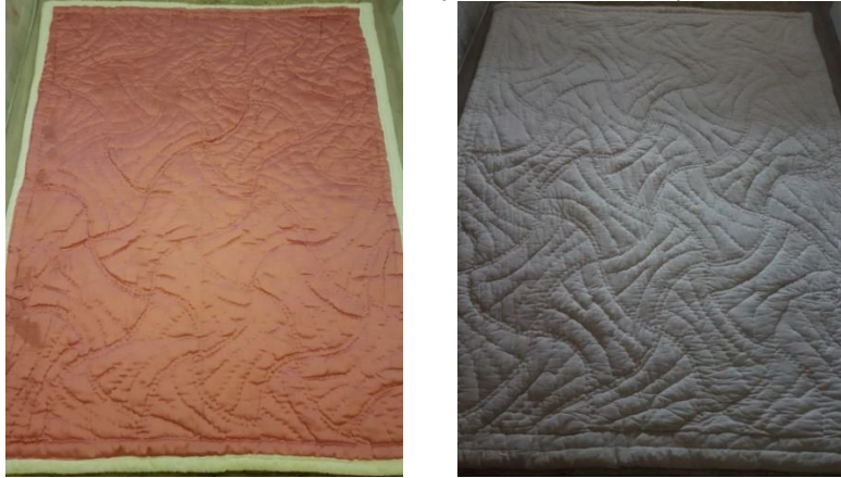
Şekil 20. Vabis desenli yorganın yüzü ve arkası, Afyonkrahisar.

Şekil 19’de yer alan örnek Güneş Yalçınkaya İlker’e aittir. 2006 yılında dikilen yorganın astarı patiska, yüzü saten kumaşından 170cmx200cm boyutunda, pamuk dolgulu dikilmiştir. “Çavuş Sırması” deseni uygulanmış yorganın ağırlığı 4 kilo gelmektedir.