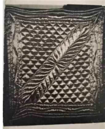
Şekil 17. Hurma dalı