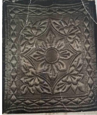
Şekil 15. Göbekli