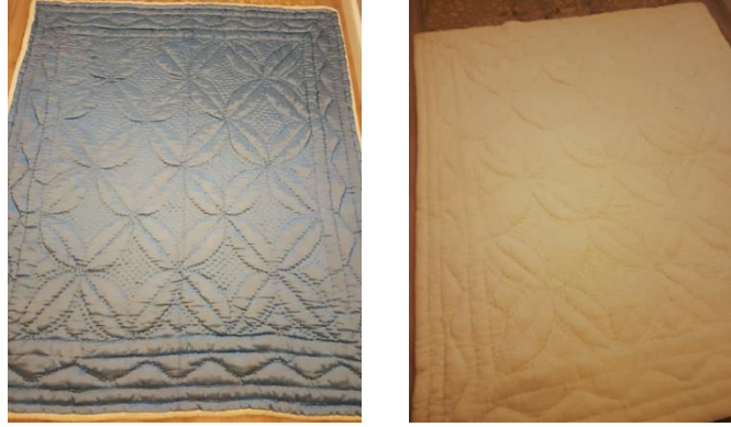
Şekil 18. Çerçevele desenli yorganın yüzü ve arkası, Afyonkarahisar.