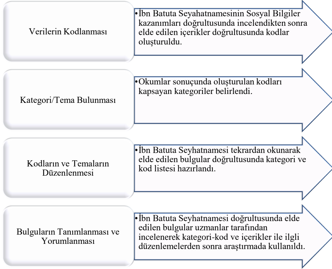
Şekil 3. İçerik Analizi Aşamaları

Araştırma sürecinde İbn Batuta Seyahatnamesi'ni incelendiği İçerik analizinin aşamalarını şu şekilde sıralanabilir: