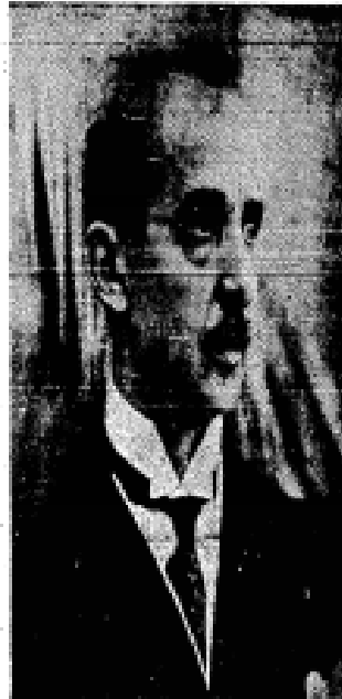
Genel Kurul'da konuşan Atatürk