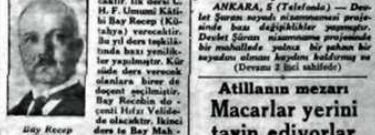
Bay Recep (Kütahya) ilk dersini verecek