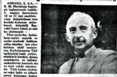
ulus, kadını, medeniyetle bütünleştiren işleri yaparlar. (Okuyunuz, 6 inci sahife)

"Türk inkilâbı demildiği vakit, bunun, kadının kurtuluş inkilâbı olduğu beraber söylenecektir,"