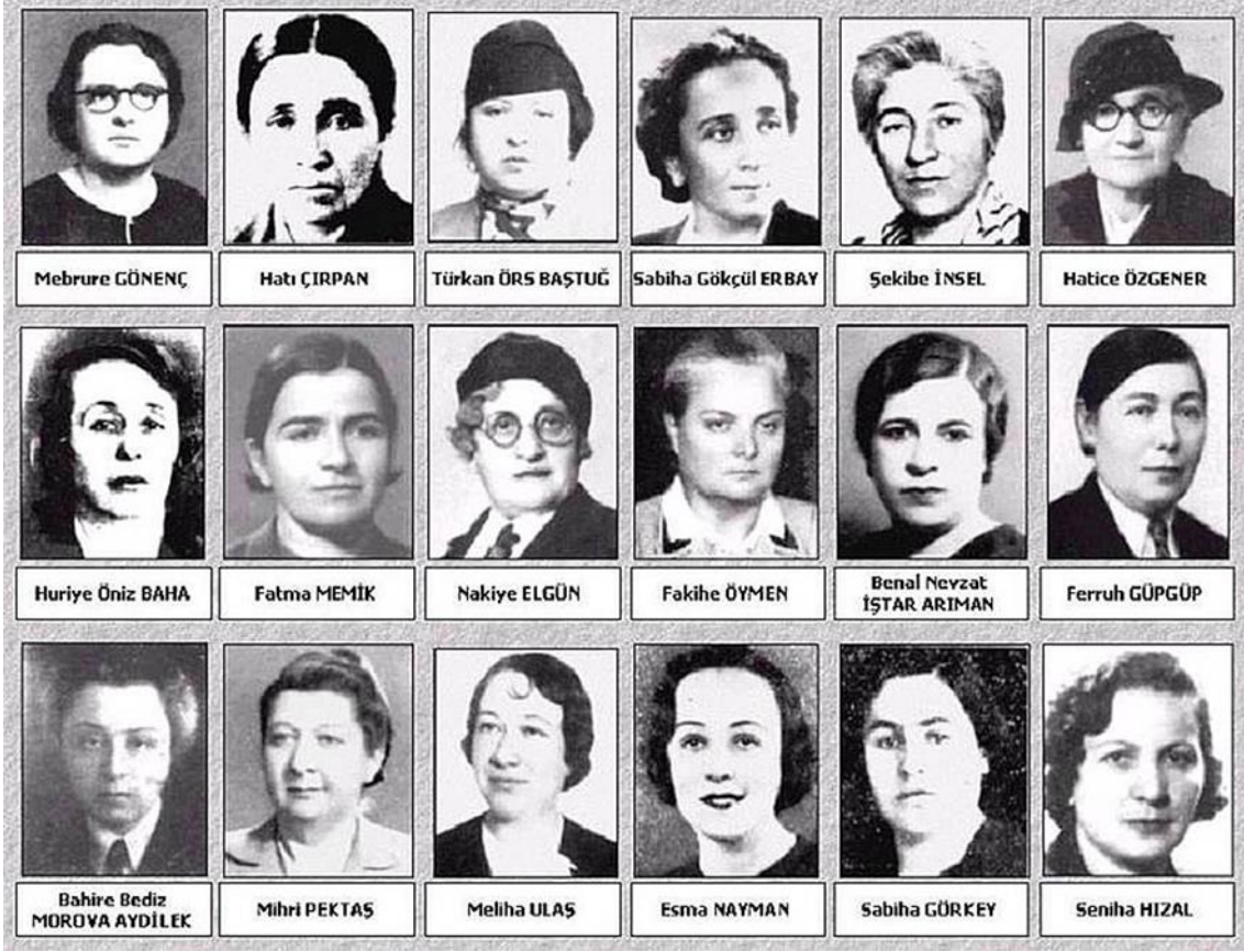
Ek 1: V. Dönem Kadın Milletvekili Resimleri