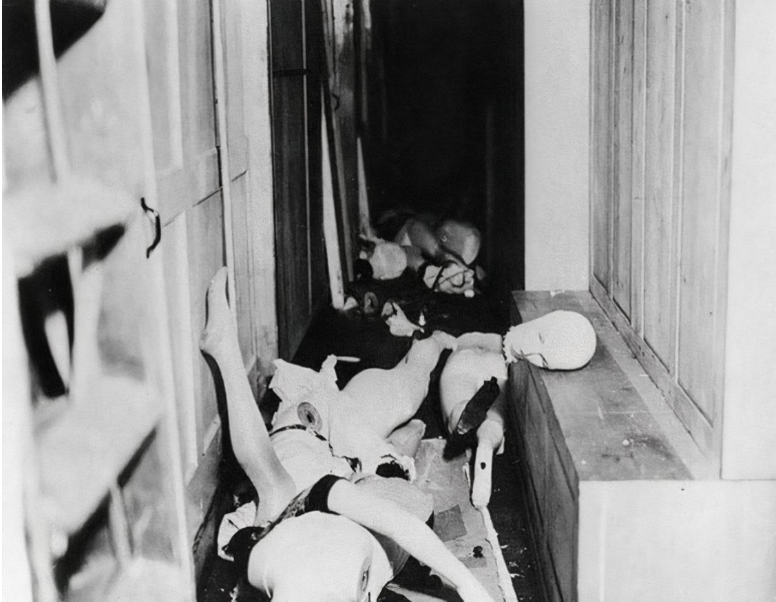
Şekil 1: Münih'te Büyük Bir Yahudi Mağazası- Kristal Gece, 9 Kasım 1938.

haberler yayınlamış Yahudi düşmanlığını artırmaya çalışmışlardır (Mora, 2011: 31). Bu kapsamda Hitler ve Gobbels'in teşvikleriyle 9 Kasım 1938'de 'Kristal Gece' adı verilen bir olay yaşanmıştır. Yüzlerce sinagog tahrip edilmiş, Yahudilere ait yüzlerce dükkan yağmalanmış, 100 Yahudi sokaklarda dövülüp öldürülmüş 73 ve yaklaşık 30 bin Yahudi tutuklanarak toplama kamplarına gönderilmiştir. Kristal Gece, Holokost süresince Alman topraklarında gerçekleşen tek büyük pogrom olmuştur (Bauman, 2016: 141). Bu katliam antisemitik şiddetin başlatılmasında bir dönüm noktası olmuştur. Yahudileri karşı soykırım yapılması düşüncesi henüz kararlaştırılmamış 74 olsa da Almanya'da ve uluslararası kamuoyunda tepkileri ölçebilmek açısından önemli bir yere sahiptir (Friedlander, 2016: 302).