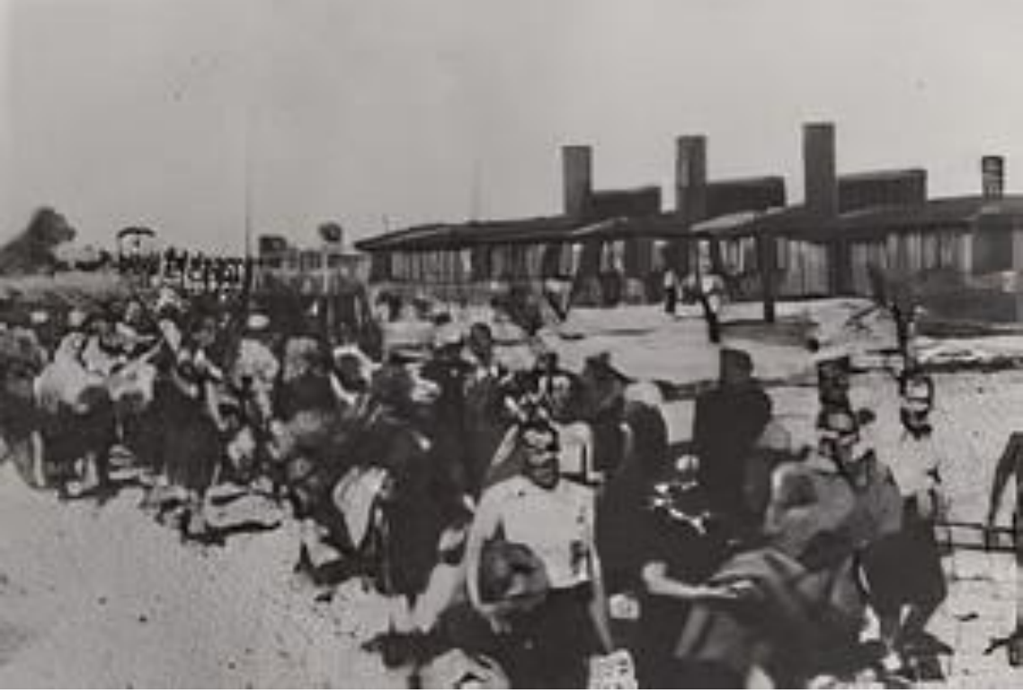
Kaynak: Holocaust a Call to Conscience (2021c).