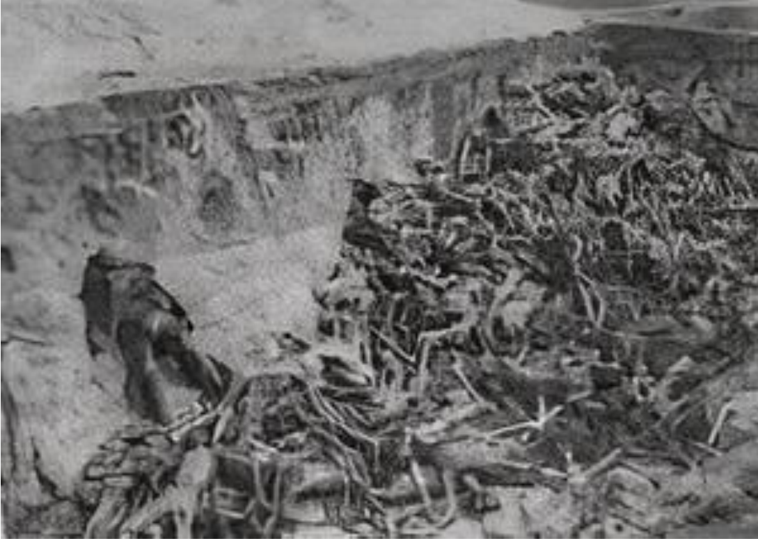
Şekil 5: Bergen-Belsen Toplama Kampında Bir Toplu Mezar.