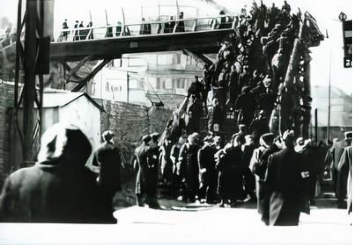
Kaynak: Holocaust a Call to Conscience (2021d).