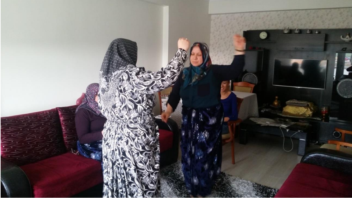
Düzağaç'ın Yöresel Oyunlarını Sergileyen Bayanlara Ait Bir Görünüm