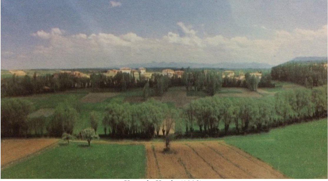
Şekil 2. Düzağaç Kasabası Tarım Arazilerinden Bir Görünüm