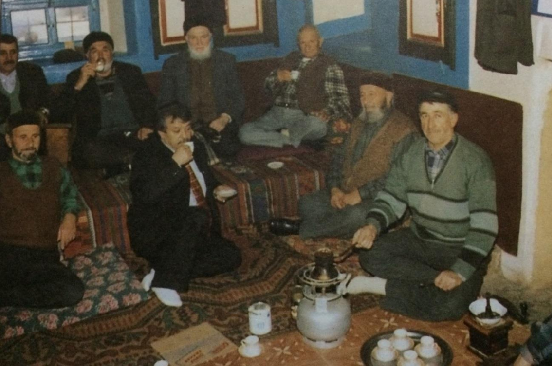
Düzağaç Köy Odası Sohbetlerinden Bir Görünüm (Kınık, 1998).