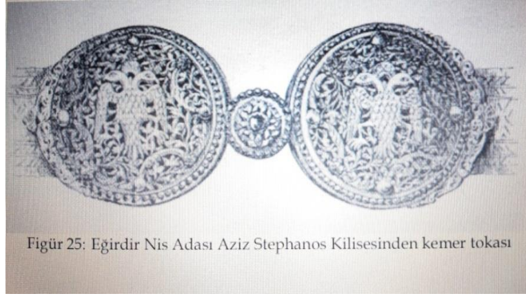
Figür 25: Eğirdir Nis Adası Aziz Stephanos Kilisesinden kemer tokası

Selçuklu dönemindeki çift başlı kartal motifi, daha çok sanatsal eserlerde karşımıza çıkmaktadır. Saray, camii gibi yapılarda görülen motif devletin gücünü simgelemektedir.