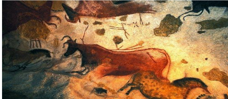
Şekil: 2.1: Mağara Resimleri 102

Eski çağlarda, insanın gördüğü hayvanları mağara duvarlarına resmetmesi, ilk sanatsal faaliyet olmuştur. Günümüze kadar ulaşabilen resimler, o dönemde yaşayan türler hakkında da bilgi edinmemizi sağlamıştır. Fransa, İtalya gibi çeşitli yerlerde duvarlarında binlerce resimler olan mağaralar tespit edilmiştir. Bu mağaraların dinî ritüelleri yerine getirmek için ya da farklı amaçlarla kullanıldığı öne sürülmüştür. 101