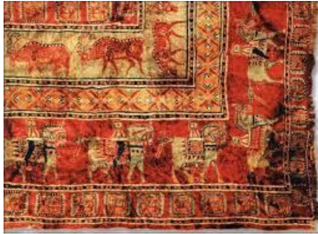
Şekil: 2.1.2: Pazırık Halısı 105

Ayrıca Türk boylarında bir hayvanı sembol olarak seçip kutsal görüp saygı göstermeleri, hayvanın siyasi ve sosyal hayatın bir unsuru olduğunu göstermektedir.