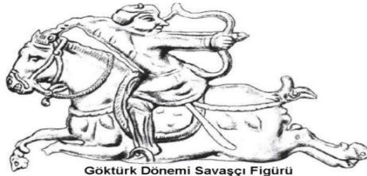
Göktürk Dönemi Savaşçı Figürü Yenisey Kıyısı, Kopenskiy Çaatas Resim: Z. Samaşev

Aynı gelenek Oğuzlarda da devam ettirilmiştir. Bulgarlara giderken Oğuz ülkesinden geçen İbn Fadlan'ın aktardığı bilgilere göre Oğuzlar, önemli bir kişi öldüğünde onun hayvanlarından bir kısmını öldürürler ve bu hayvanların kuyruğunu, başını, derisini ve ayaklarını bir sıraya geçirerek mezarının başına dikerlerdi. 268 İslâmiyet öncesinde uygulanan bu gelenekler İslâmiyet sonrası Türk devletlerinde de devam ettirilmiş olup Göktürklerde olduğu gibi soylu ve hanedan üyelerinin ölümünden sonra yas alameti olarak uygulanmıştır. 269 Atın gömülmesiyle ilgili farklı uygulamalar bulunmaktadır. Fakat bizim konumuz kapsamında olmadığı için bu uygulamalara detaylı şekilde değinmeyeceğiz.