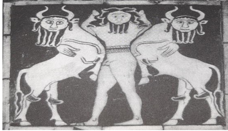
Şekil 4.3.1: Boğa-Adam Figürü 312

Öküz, boğa gibi hayvanlar devlet sembolü olarak görülen canlılar arasında yer almaktadır. Yak öküzü veya Kotuz denilen boğanın kuyruğu tuğ olarak kullanıldığı bilinmektedir. Chou boylarında görülen bu tuğ, Göktürk ve Uygurlarda yer almıştır. Hükümdar ve devlet sembolü olarak görülen bu canlılar, gök unsuruyla da ilişkilendirilmektedir.