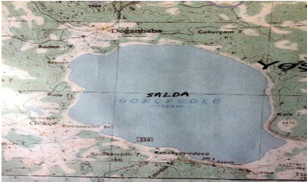
Şekil 4. Tarihi Salda Gölü Haritası 5

2. Yarışlı Gölü: İlçenin doğusunda yer alan Yarışlı Gölü yaklaşık 2000 dekarlık bir alanı kaplamaktadır. Çevreden inen sularla ve yağmur sularıyla beslenmektedir.