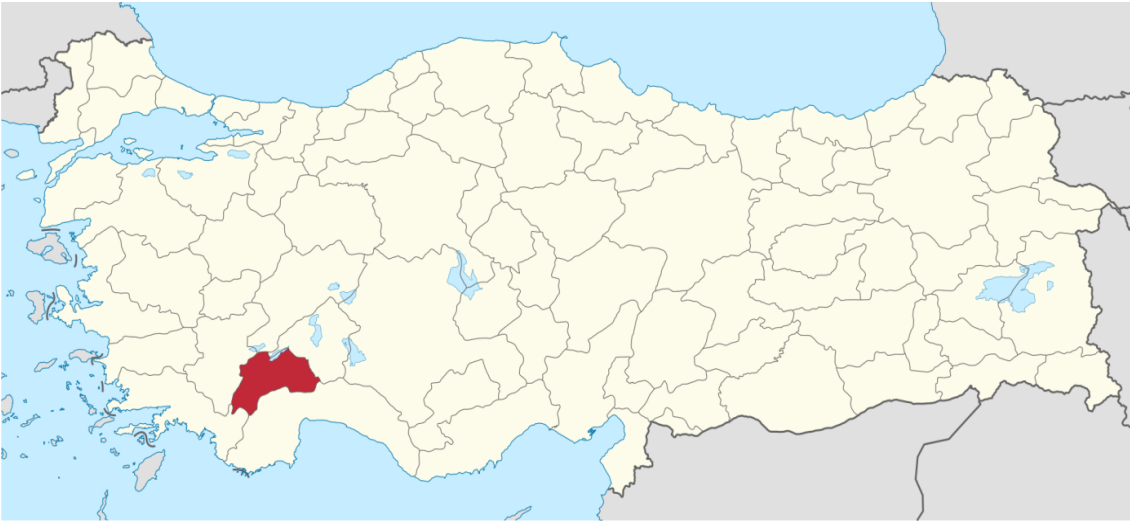
Şekil 1. Türkiye Haritasında Burdur 1

Yeşilova, Güneybatı Anadolu'da Göller Bölgesi'nde olup, Burdur ili merkezinin batısına düşmektedir. İlçe doğusunda Burdur ili, batısında Acıpayam ilçesi, güneyinde Karamanlı ilçesi, kuzeyinde ise Denizli ili Çardak ilçesi ve Afyon ili Başmakçı ilçesi ile çevrilidir. Yüzölçümü 1351 km 2 dir. Yeşilova ilçesi Ege ve Akdeniz Bölgeleri arasında bir alan olup, 37- 38 kuzey enlemi, 29- 30 doğu boylamı daireleri arasında olup, rakımı 1200 metredir. İlçe, Göller Bölgesi'nin karakteristik özelliklerini taşımaktadır (Ekinci, 2016: 121- 122).