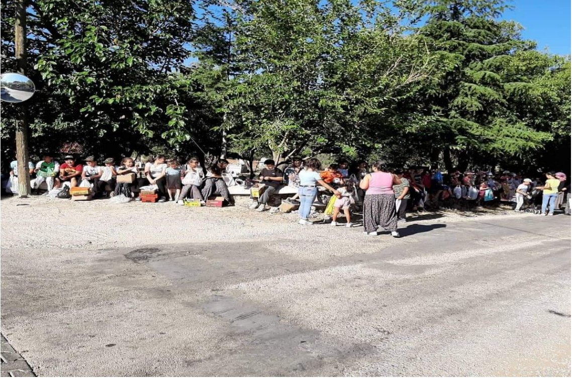
Fotoğraf 14. Doğanbaba Köyünde Meşale Eğlencelerinden Bir Fotoğraf