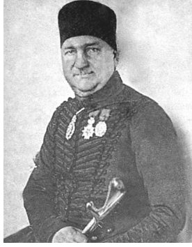
Resim 16. Giuseppe Donizetti'nin Dah Genç Iken Karakelmle Yapılmış “Napolyon Yakalı ve Omuzlu” Bir Resmi