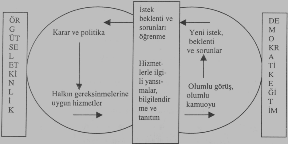
Şekil-1 Yerel Yönetim Örgütlerinde Halkla İlişkilerin Yerel Yönetim Halk Bütünleşmesine Etkisi

Şekil-1'de görüldüğü gibi, halkla ilişkiler yalnızca halkın hizmetler hakkında bilgilendirilmesine yardım eden teknik bir işlev değildir. Bu, halkla ilişkiler uygulamalarının görünen yönüdür. Halkla ilişkiler, aynı zamanda, örgütsel işleyişin halkın istek ve beklentilerine göre düzenlenmesini sağlayarak en çok gerekli olan hizmetlerin üretilmesine ve sunulmasına, halkın hizmetler hakkında bilgi edinmesine, kurumun çalışmalarını ve genel olarak toplumsal değerleri tanıtmayı sağlayarak toplumsal kesimlerin bütünleşmesine katkıda bulunur.