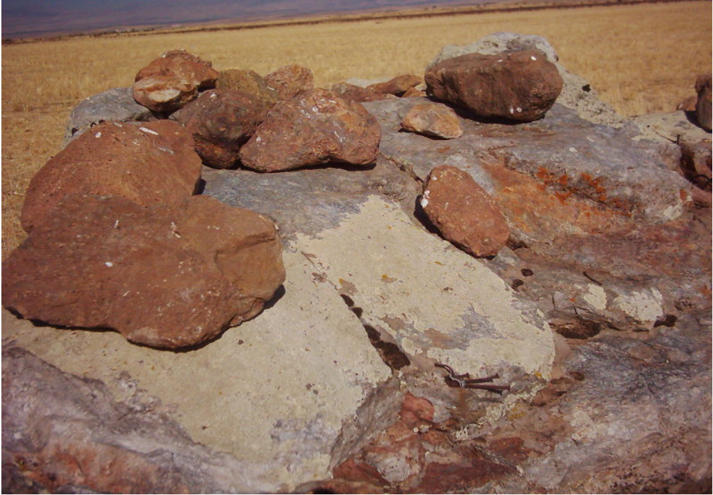
Fotoğraf -5: Afakan Taşı Üzerine Çakılan Çiviler (Ali Osman Karakuş'un "Ozan Çulsuz" Arşivinden)