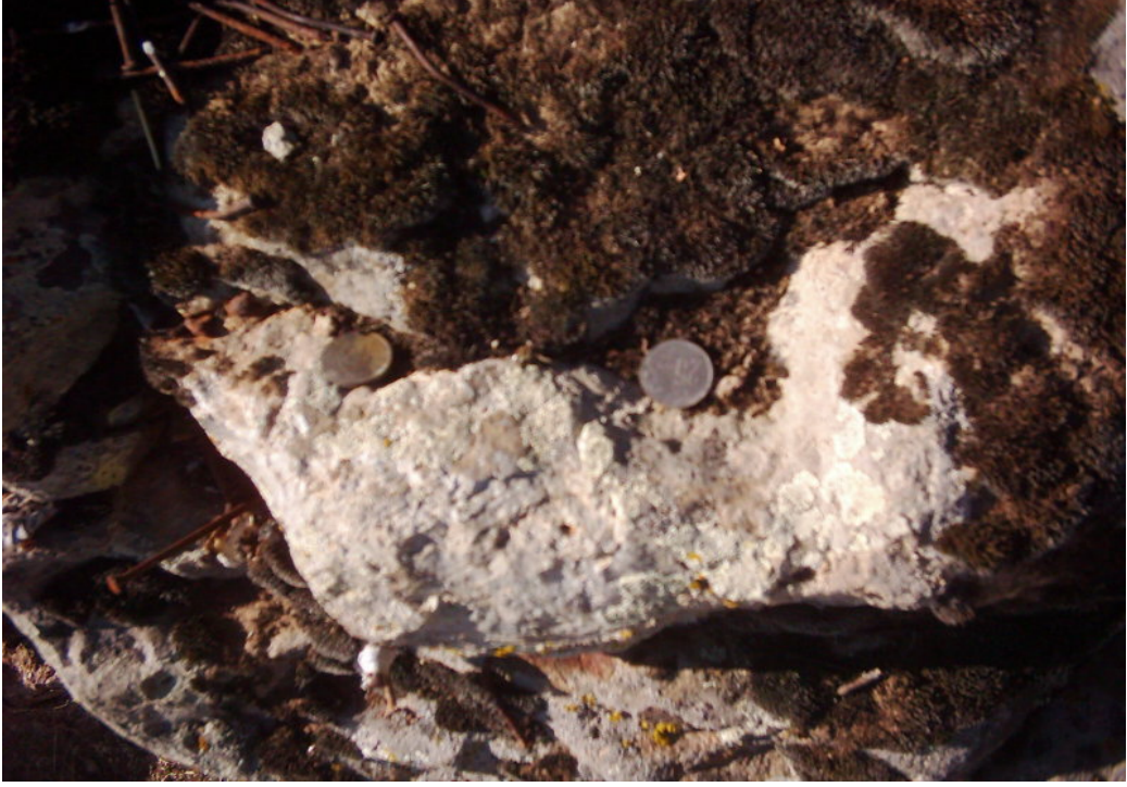
Fotoğraf -4: Afakan Taşı Üzerinde Bozok Paralar