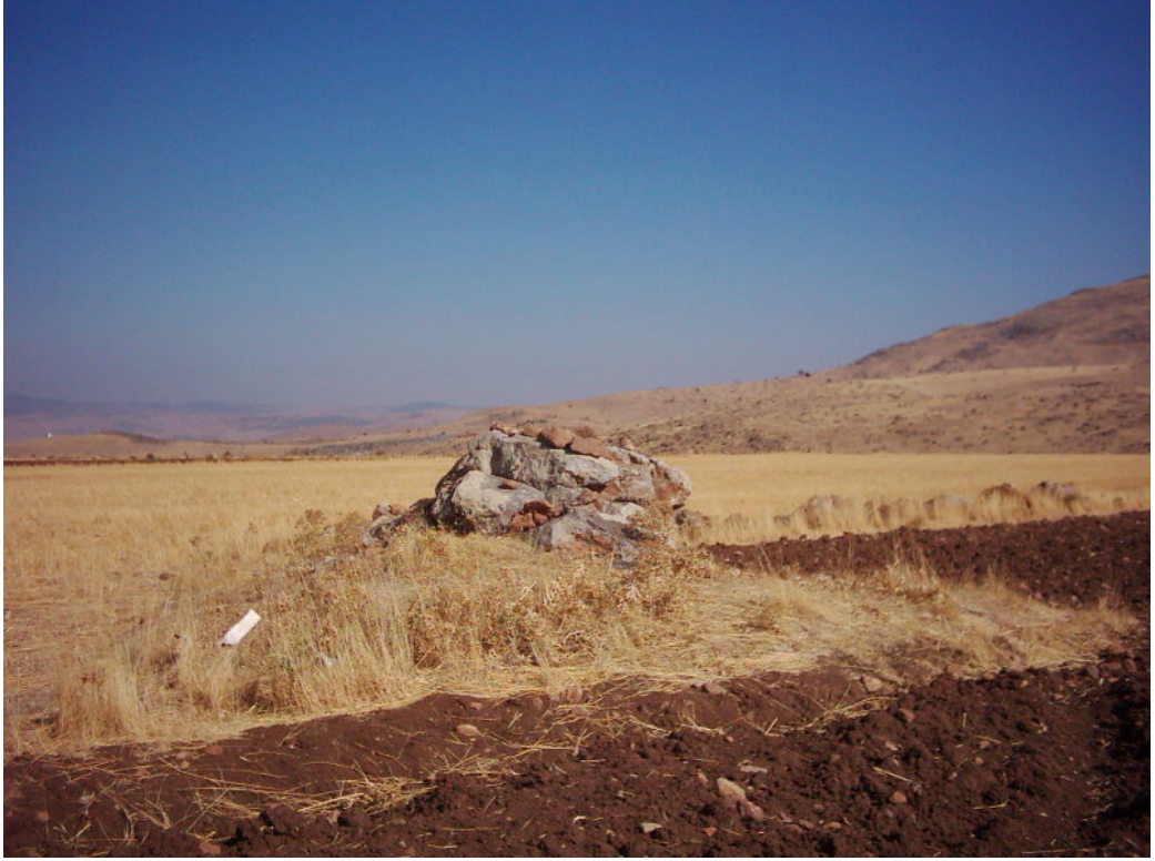
Fotoğraf -2: Afakan Taşı