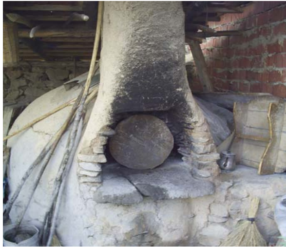
Foroğraf -20: Yumruca Köyü Ocak