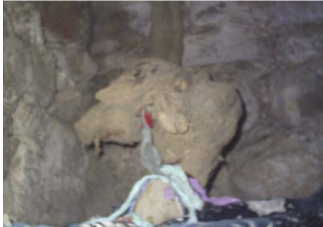
Fotoğraf -16: Menteş Dede'ye ait olduğuna inanılan başka bir baston