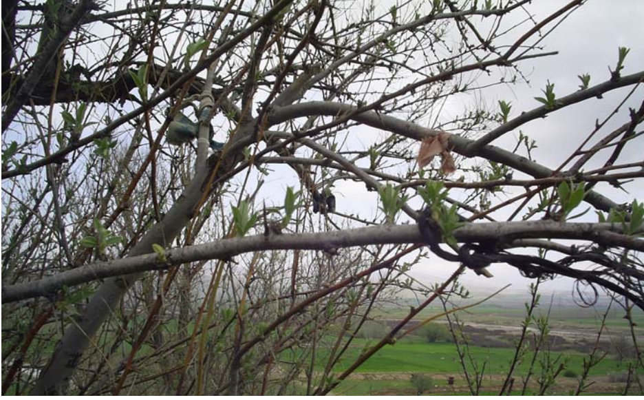
Fotoğraf -13: Yumruca Köyü yakınında bulunan Yumru Dede yatırını yanında bulunan ağaca bağlanan bez parçaları.