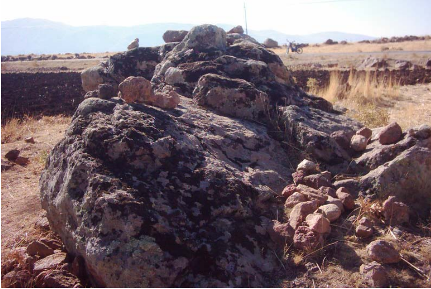
Fotoğraf -7: Afakan Taşı Üzerine Bırakılan/Yapıştırılan Taşlar