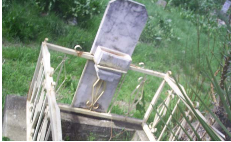
Fotoğraf -18: Alamescit köy mezarlığında kabir üzerinde bulunan su sunağı.