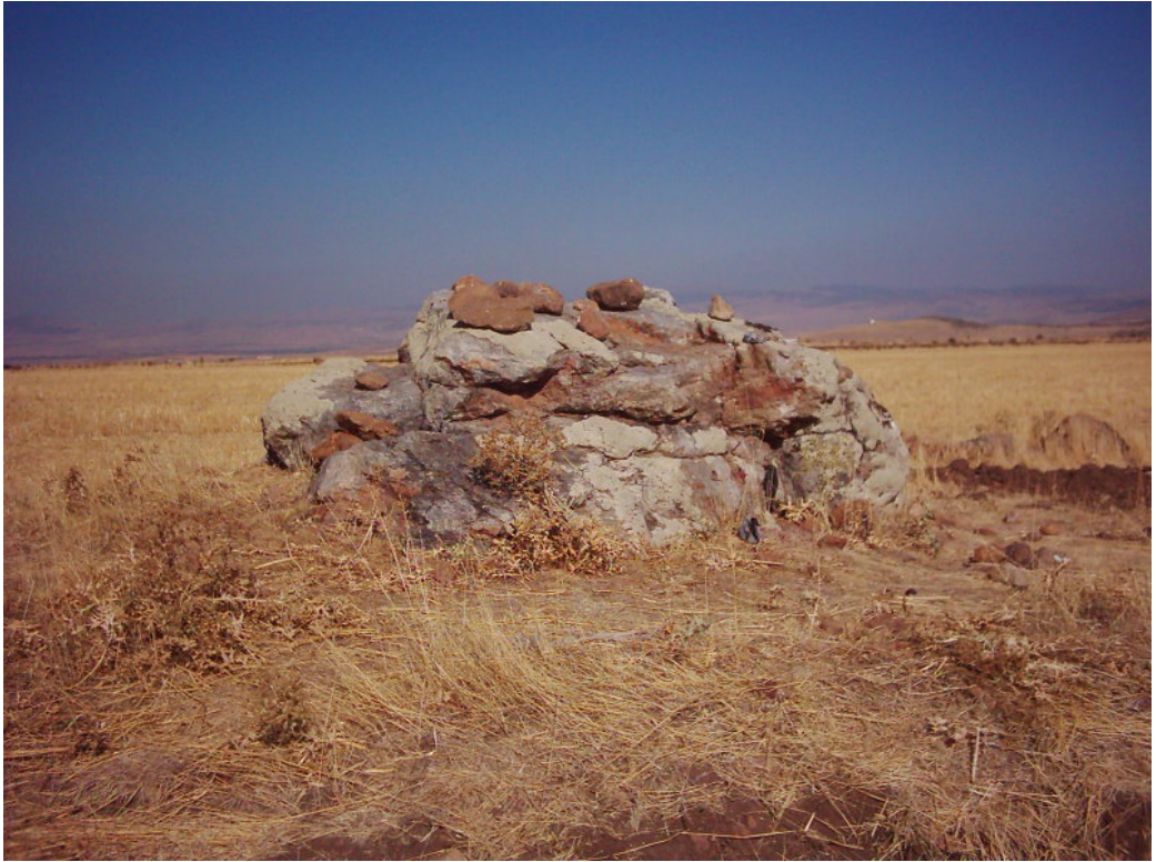
Fotoğraf – 3: Afakan Taşı