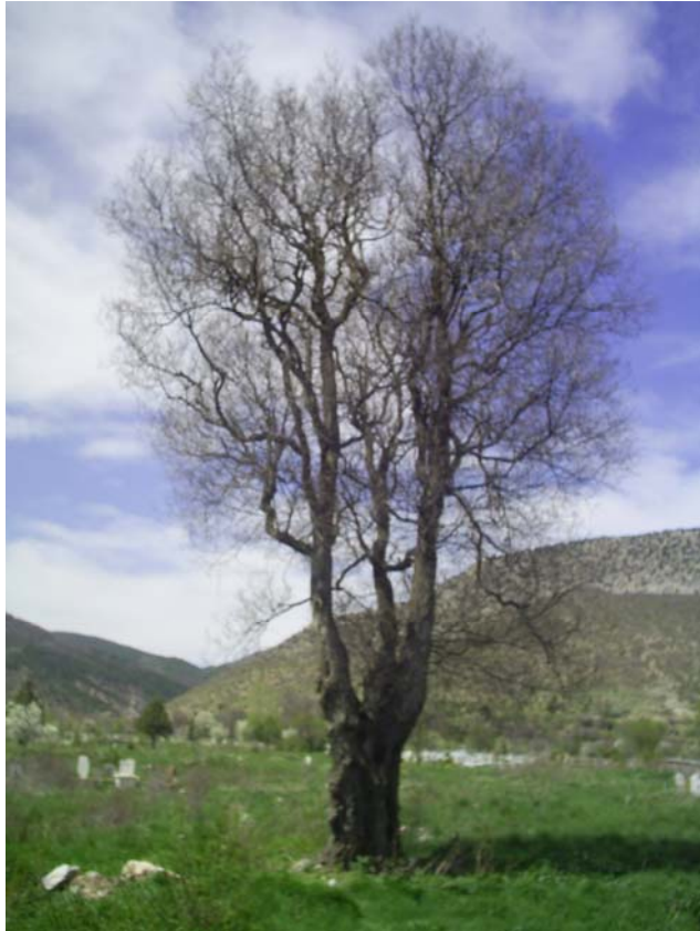
Fotoğraf -14: Menteş Köyünde bulunan Menteş Dede türbesinin yanında bulunan ve dallarına çaput bağlanan; altında kurban kesilen ağaç.