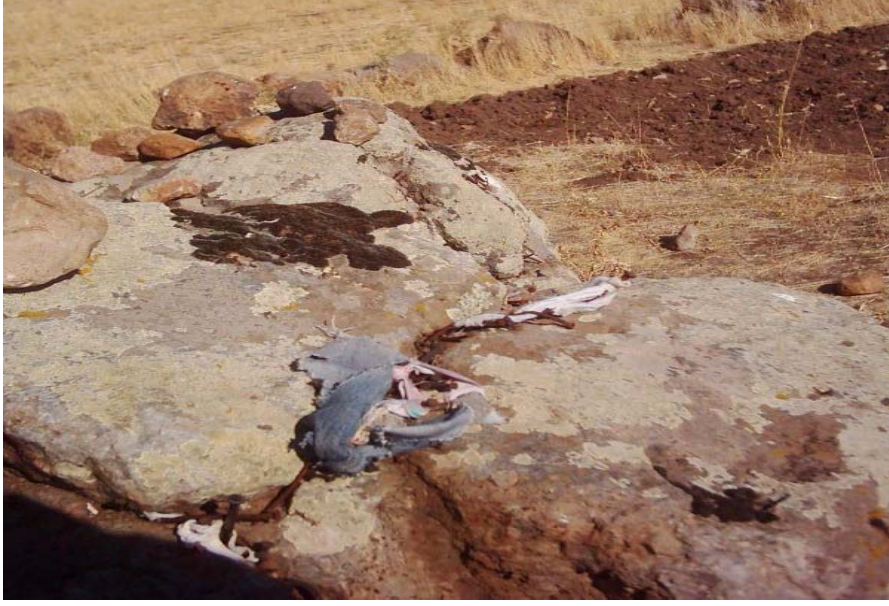
Fotoğraf -6: Afakan Taşı Üzerine Bağlanan Bez Parçaları (Çaputlar)