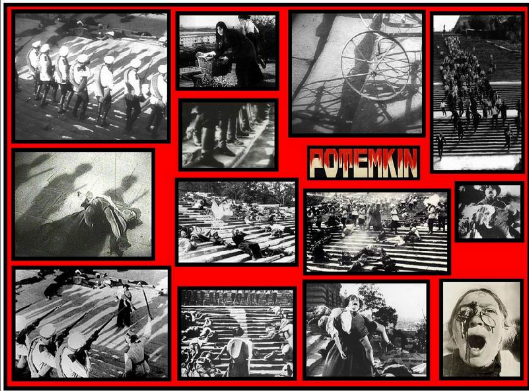
Resim-3: “Potemkin Zırhlısı” filminin merdiven sahnesi