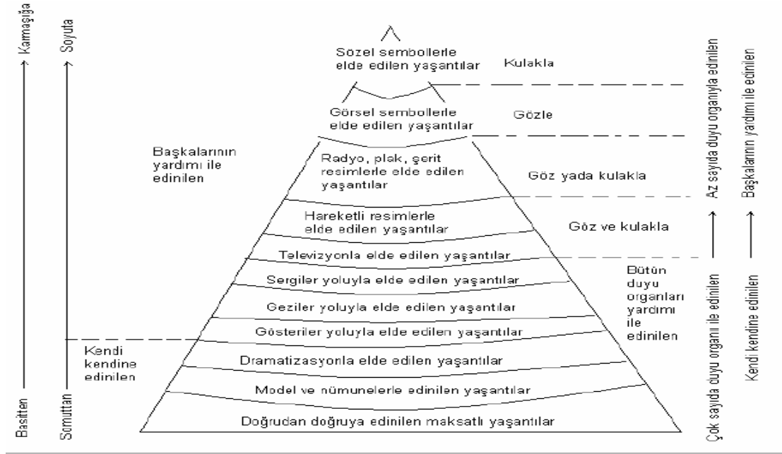
Şekil-1:Dale'nin Yaşantı Konisi

(Ibid,43'ten alarak adapte eden, Çilenti;1988: 56)