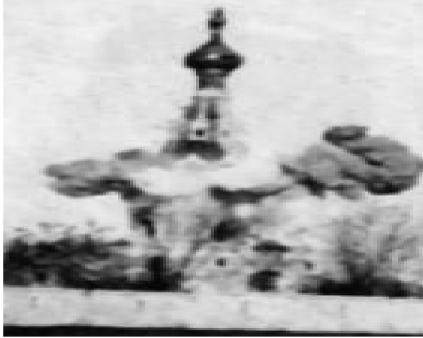
Resim-2: İlk Türk Filmi: Ayestefanos Abidesinin Yıkılışı