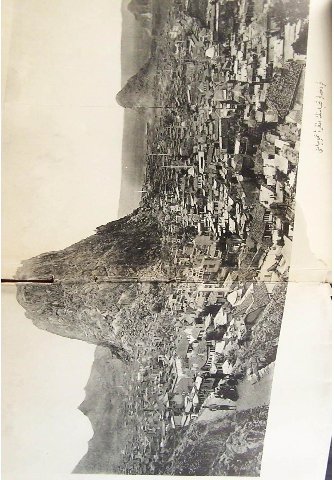
Ek 3: 1907 Yılında Afyonkarahisar'ın Genel Görünümü 363