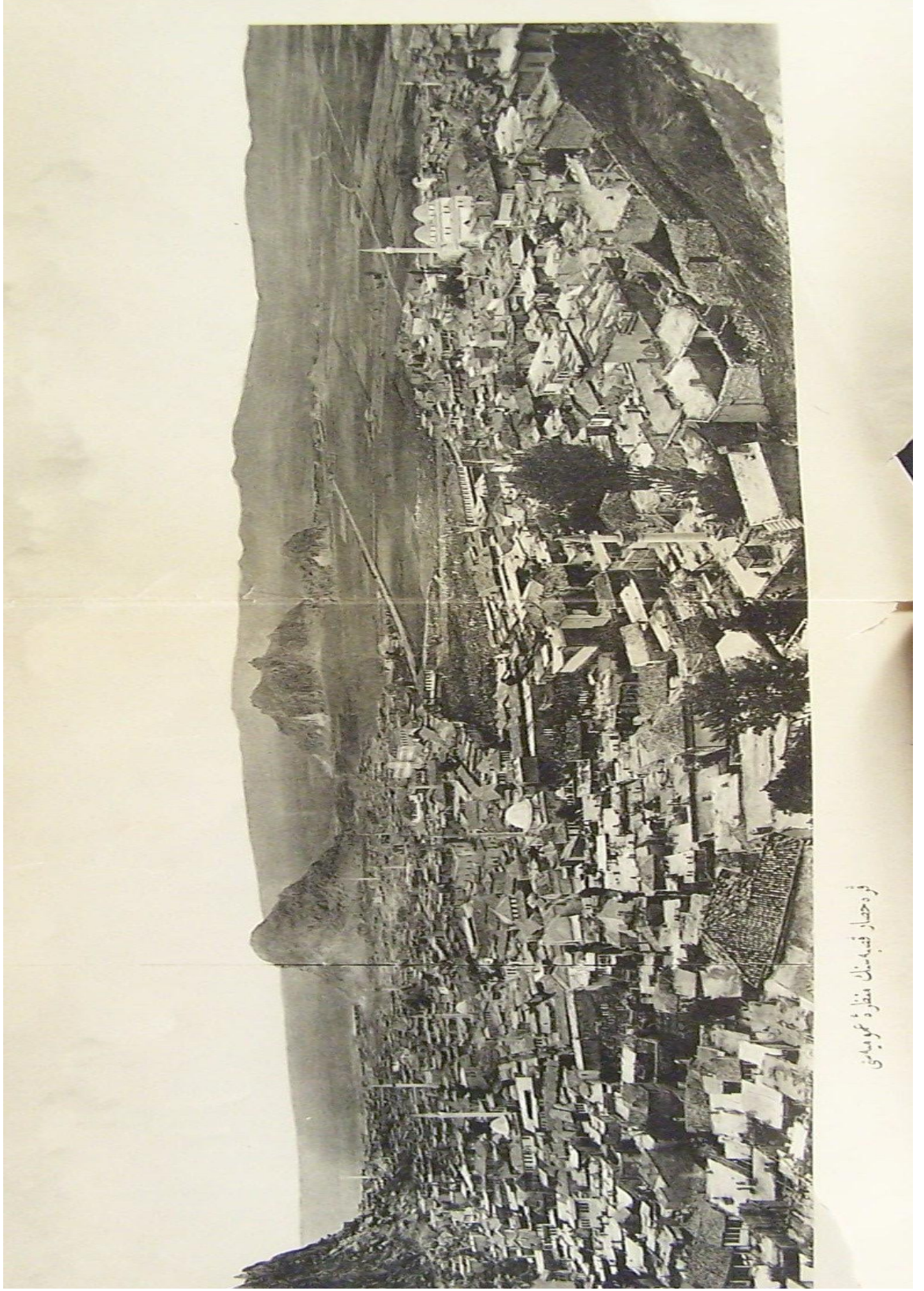
Ek 4: 1907 Yılında Afyonkarahisar 364