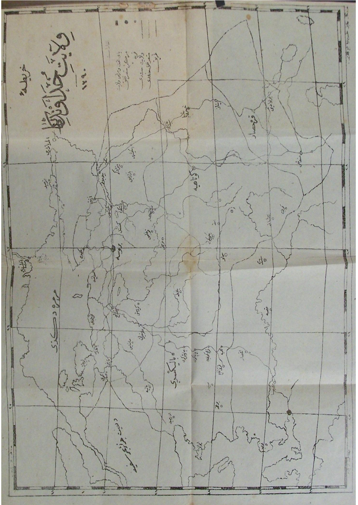
Ek 2: Hüdâvendigâr Vilâyeti Haritası 362