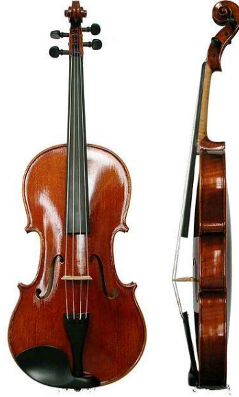
řekil 1. Viyola'nın nden ve Yandan Grnř

braccio) denilen algı geliřmeye bařlamıř ve gnmzde kullanılan halini almıřtır. Viyola ve keman, fiziksel zellikleri, tutuř ve teknik zellikleri bakımından birbirine benzemektedir. Ancak ton ve tını bakımından birbirinden farklıdır (Say, 1985; Yayla, 1999; Ece, 2002).