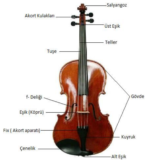
řekil 2. Viyola'ya Ait Aparatlar