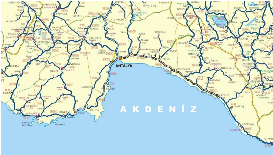
Şekil 1. Antalya İli Haritası