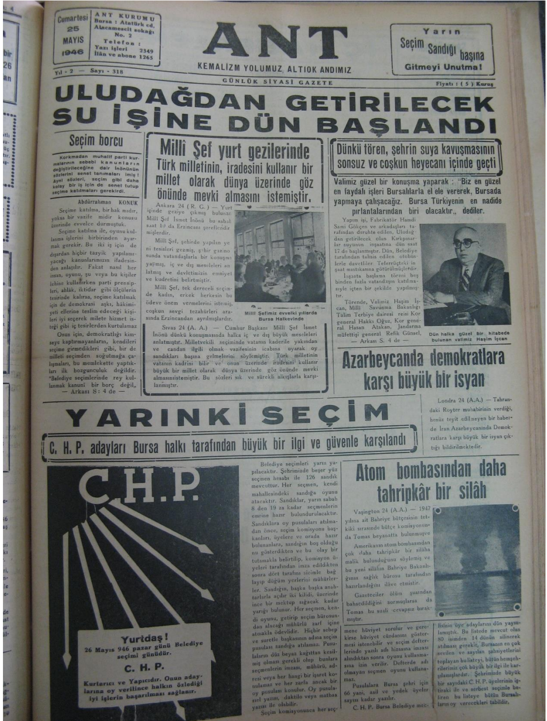
EK-1: 26 Mayıs 1946 Belediye Seçimlerinden Bir Gün Önce Bursa'da Çıkan Ant Gazetesi'ndeki CHP Afişi, Bkz. Ant, 25 Mayıs 1946, nr. 318, s. 1.