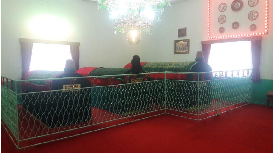
Resim 3. Hak Halili, Bacı Sultan ve Kadir Ağa'nın Türbesi

Kabirler yeşil renkte demir parmaklıklar ile çevrilidir. Bu Parmaklıklar üzerinde kırmızı renkte laleler bulunmaktadır. Toplamda yirmi dört lale vardır bu laleler Kerbela'da hayatta kalan yirmi dört bacıyı temsil etmektedir.