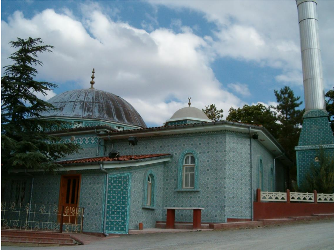
Resim 1. Hak Halili Türbesi Dış Görünümü

1987 yılında kurulan, Hak Halili Türbesini Koruma Kültür ve Dayanışma Derneği, sevenlerin ve üyelerin desteği ile türbenin çevre düzenlemesi, bakım onarım ve giderlerini karşılamakta, her yıl yirmiye yakın öğrenciye karşılıksız burs vermekte, ihtiyaç sahibi ailelere yardımda bulunmaktadır. Dernek inanç ile ilgili temel eserlerin basılması ve telif eserlerin yayınlanması için hazırlıklarını sürdürmektedir.