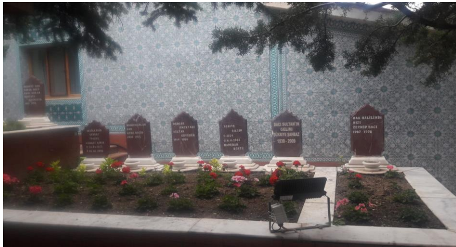
Resim 7. Dergah'ın Dış Mekânında Aile ve İhvanlara Ait Mezarlar

Yeşil renk: Hz. Muhammed Mustafa ve Hz. Fatma'yı, kırmızı renk: Hz. Ali ve Hz. Hüseyin'i Sarı renk ise Hz. Hasan'ı ve bu kişilere beslenen sevgiyi temsil etmektedir.