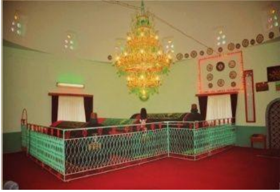
Resim 6. Türbe

Oniki İmamları temsil adına on iki adet pencere bulunmaktadır. Bu pencereler renkli camlardan oluşmaktadır. Camların ikisi yeşil, iki tanesi kırmızı ve son olarak diğer ikisi de sarı renklidir. Her renk bir ismi temsil etmektedir.