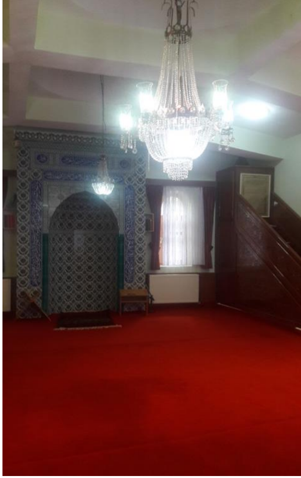
Resim 4. Kadiri Dergâhının İç Mekânı (Mescid Olarak Kullanılan Bölüm)