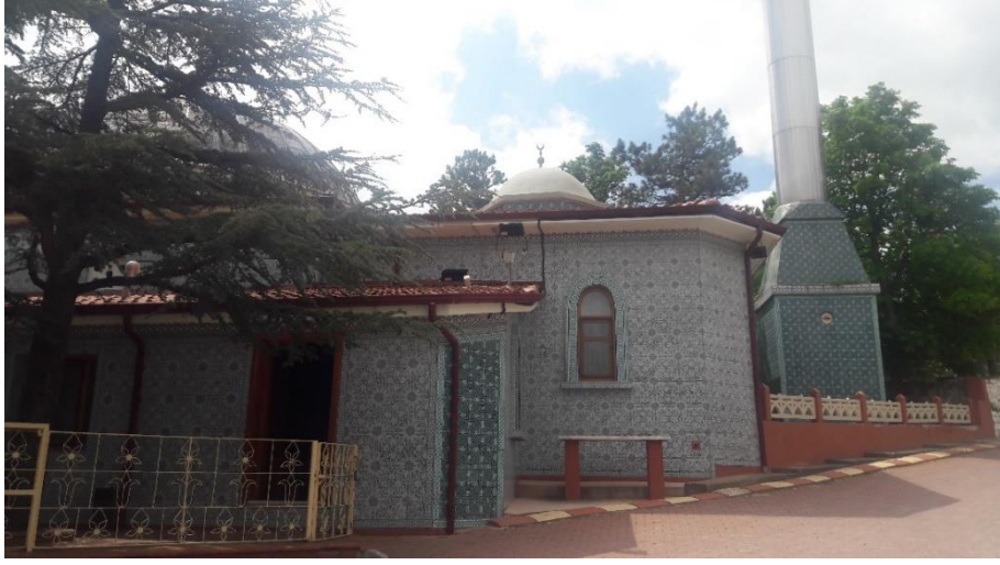
Resim 2. Kadiri Dergâhından Dış Mekânından Bir Görüntü