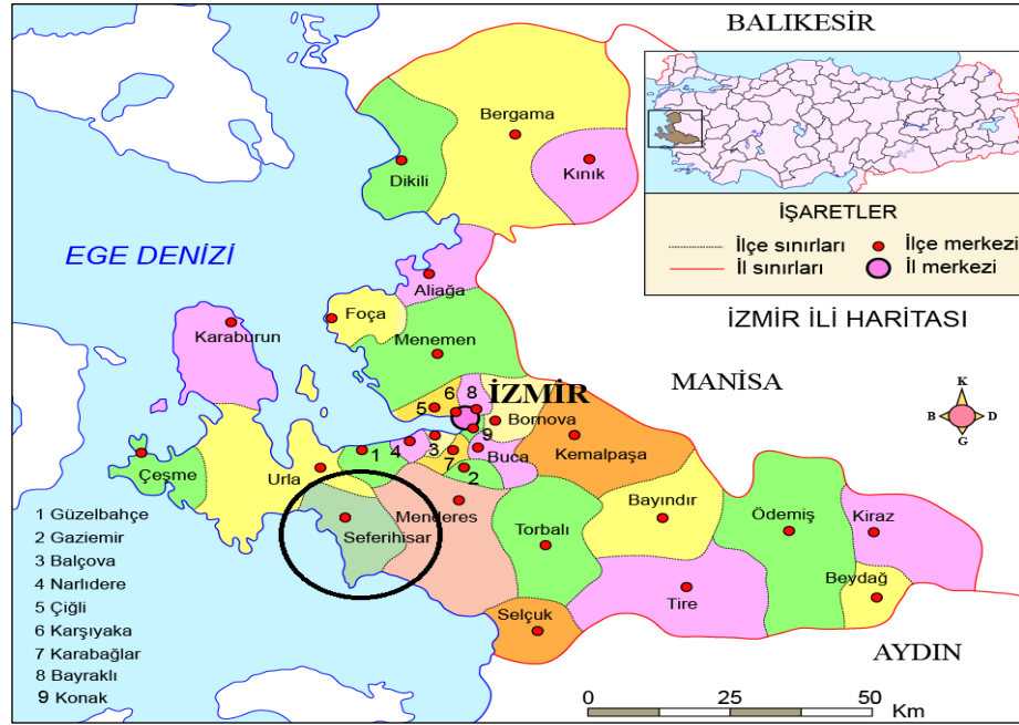
Şekil 4. Seferihisar'ın Konumu