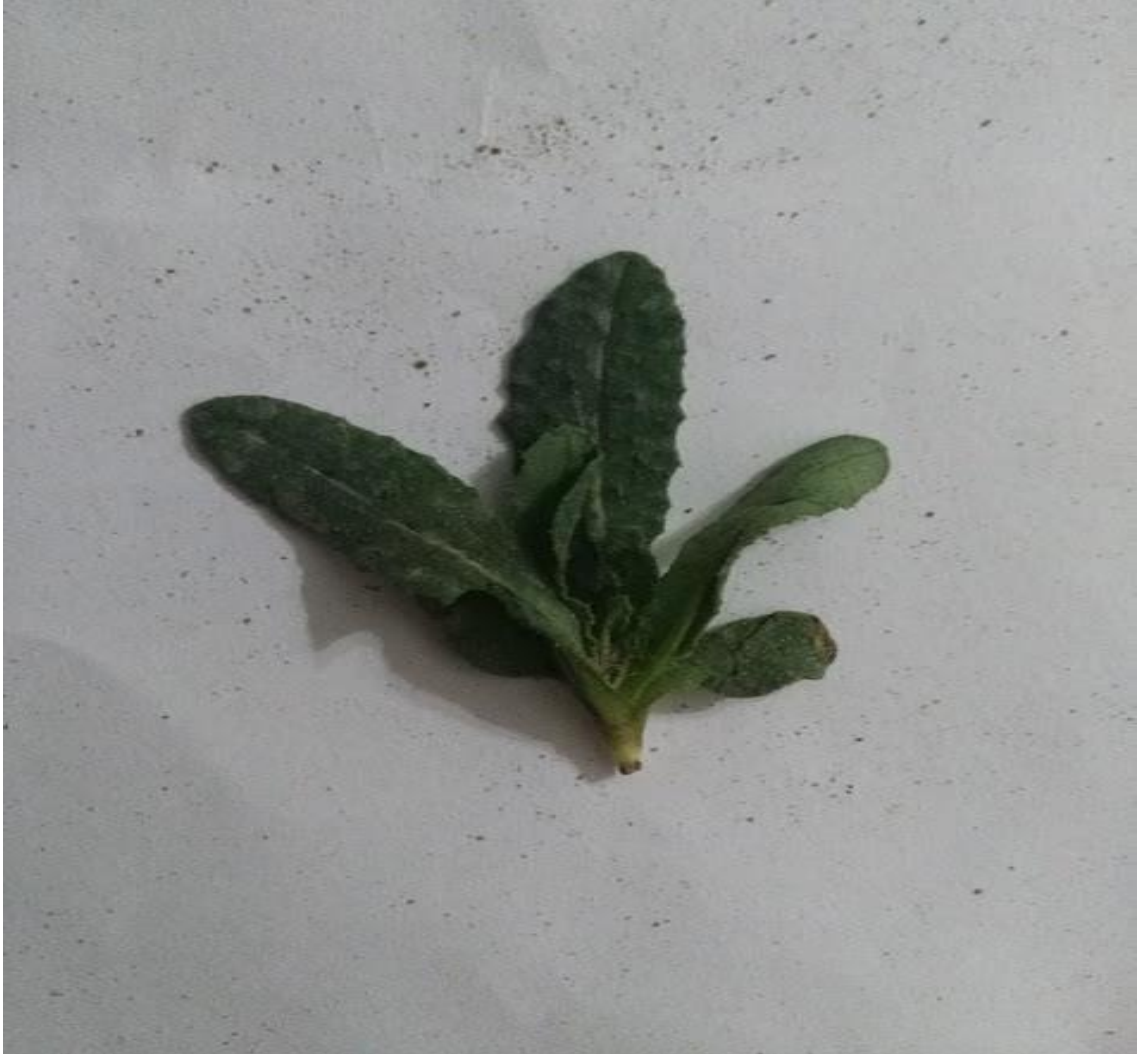
Resim 4.19 Anchusa undulata L. subsp. hybrida (Ten.) Cout. (Ballık, Ballık otu)

Araştırma Alanı: Sandıklı Karadirek köyü, Sorkun köyü