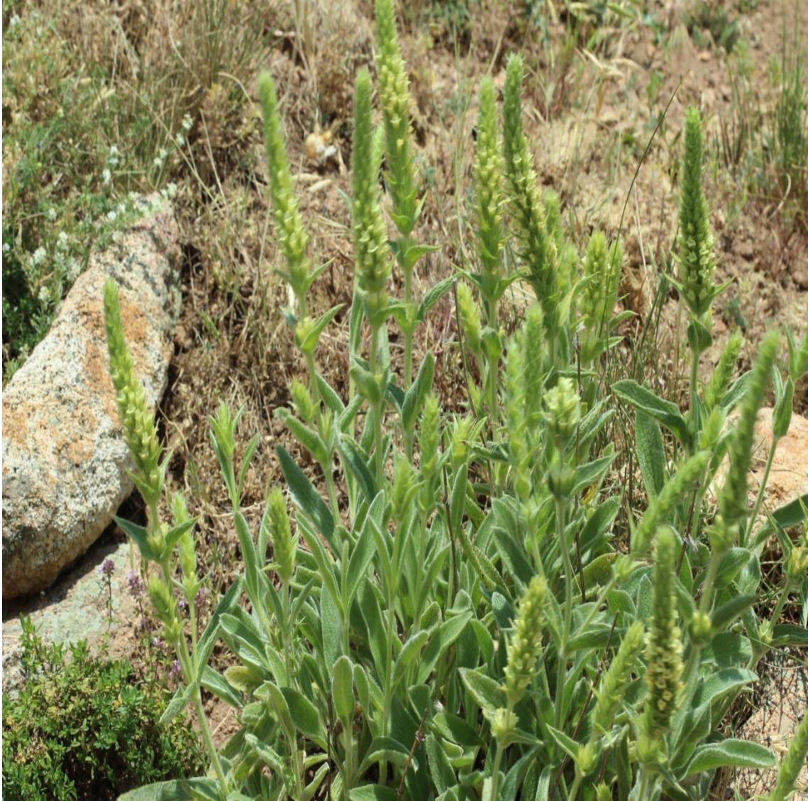
Resim 4.39 Sideritis akmanii Aytac, Ekici & Dönmez (Dağ çayı)

Araştırma Alanı: Sandıklı Bekteş köyü, Dutağaç köyü