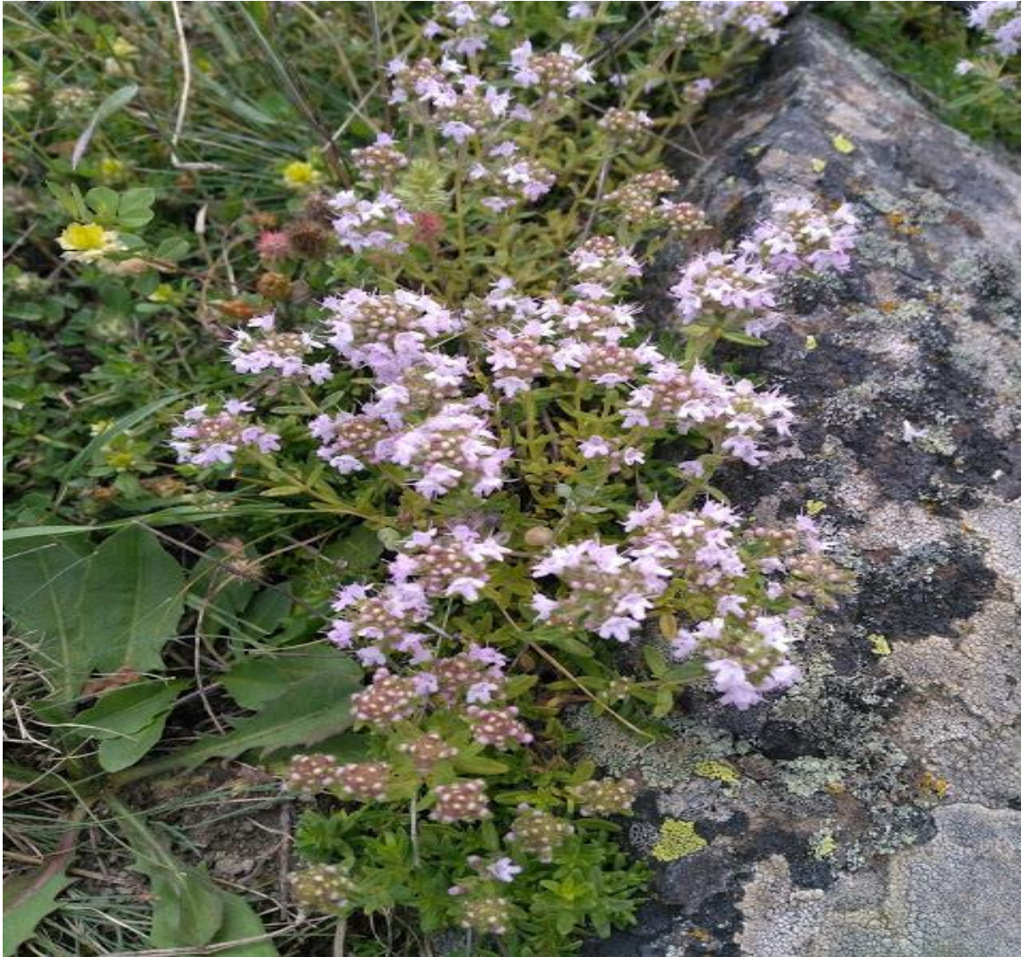
Resim 4.44 Thymus longicaulis C. subsp. chaubardii (Reichb. f.) Jalas (Koyun kekiği, yer kekiği, nane kekiği)

Araştırma Alanı: Sandıklı Ballık köyü, Örmekuyu köyü