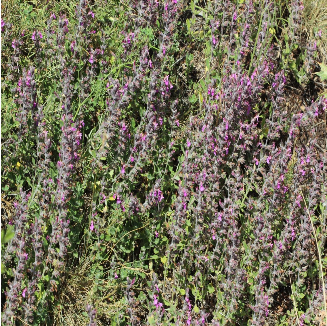
Resim 4.43 Teucrium chamaedrys L. subsp. chamaedrys (Bodur mahmut)

Araştırma Alanı: Kızılören Gülyazı köyü, Dinar Cerit yaylası