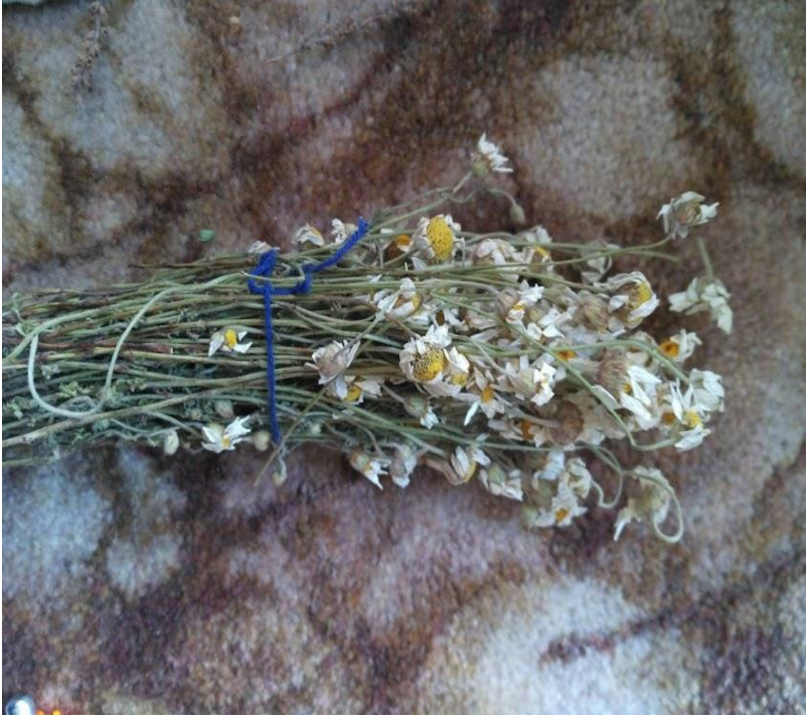
Resim 4.14 Cota coelopoda (Boiss.) Boiss. (Bubeşce çiçeği, Papatya, Bubeşca)

Araştırma Alanı: Kızılören Gülyazı köyü, Sandıklı Ballık köyü, Sorkun köyü, Dinar Cerit yaylası