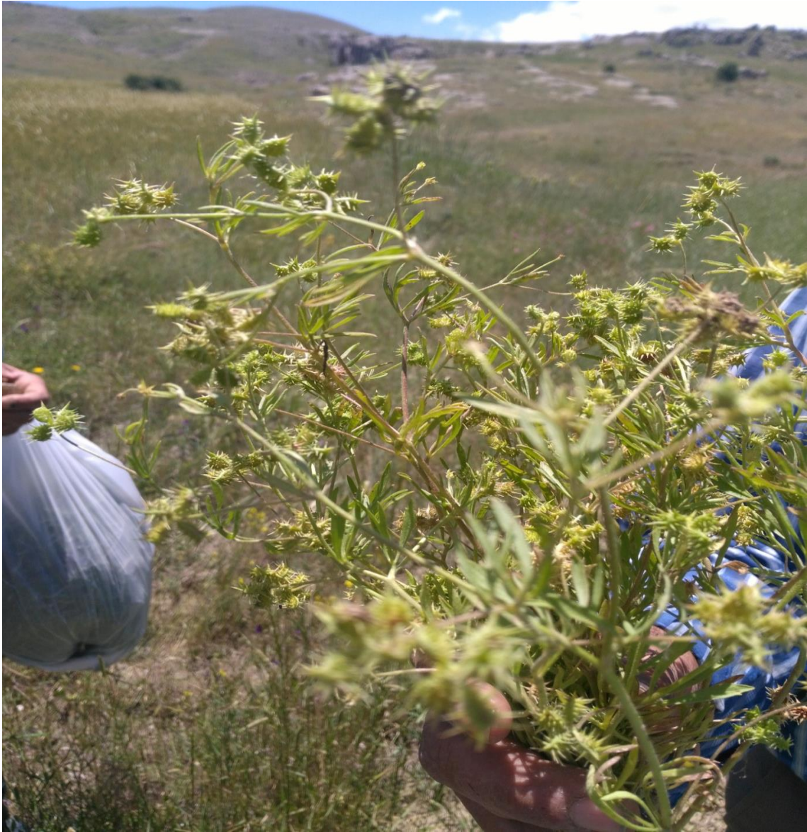
Resim 4.60 Ranunculus arvensis L. (Su pıtrağı)

Araştırma Alanı: Sandıklı Örme kuyu köyü