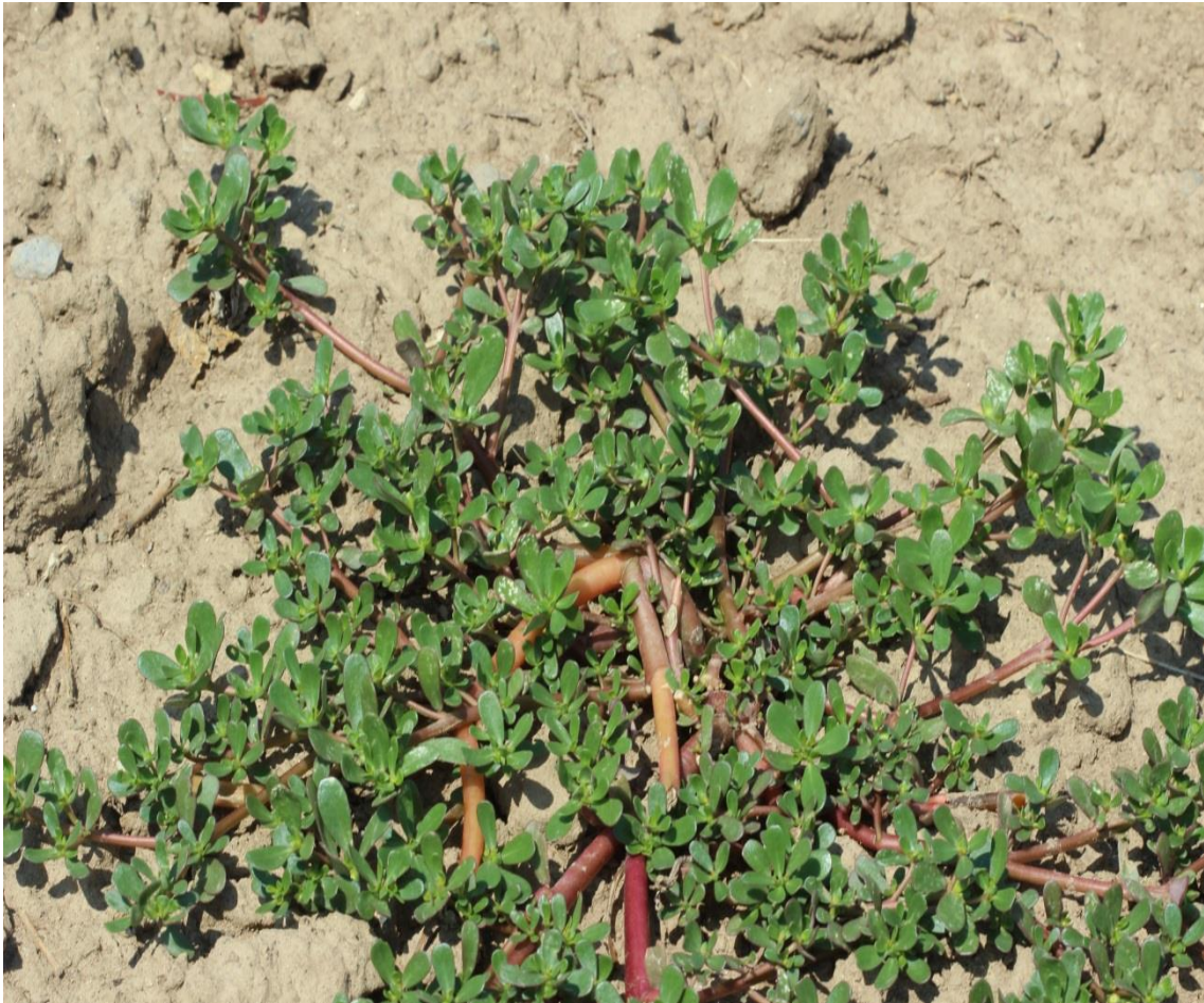
Resim 4.58 Portulaca oleracea L. (Temiz otu, Semizotu)

Araştırma Alanı: Sandıklı Karadirek köyü, Dinar Cerit yaylası