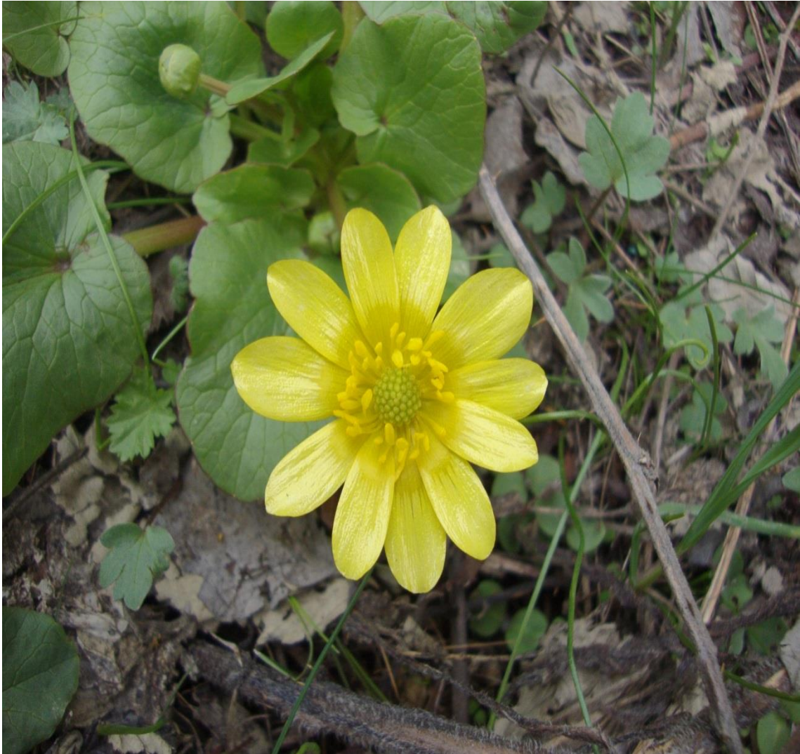
Resim 4.61 Ranunculus ficaria L. subsp. ficariiformis Rouy & Foucaud (Basur otu)