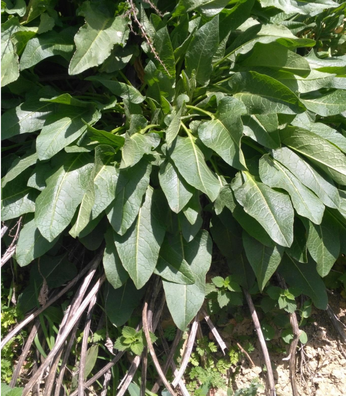
Resim 4.2 Beta trigyna Waldst. & Kit. (Kır ıspanaęı)