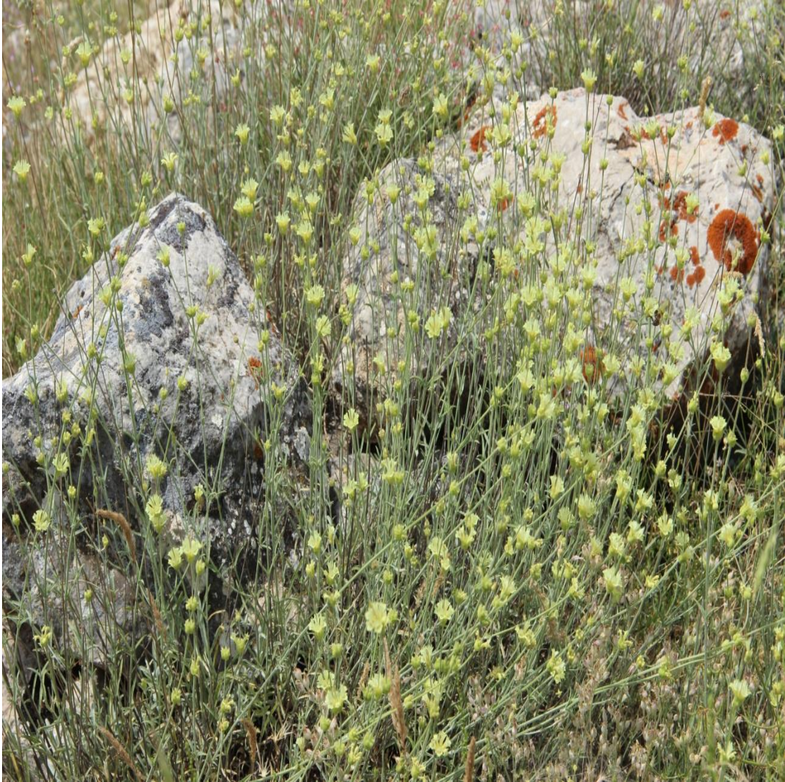
Resim 4.41 Sideritis libanotica Labill. subsp. linearis ( Benth) Bornm (ayotu)

Araştırma Alanı: Sandıklı Örme kuyu köyü, Ballık köyü, Dinar Cerit yaylası