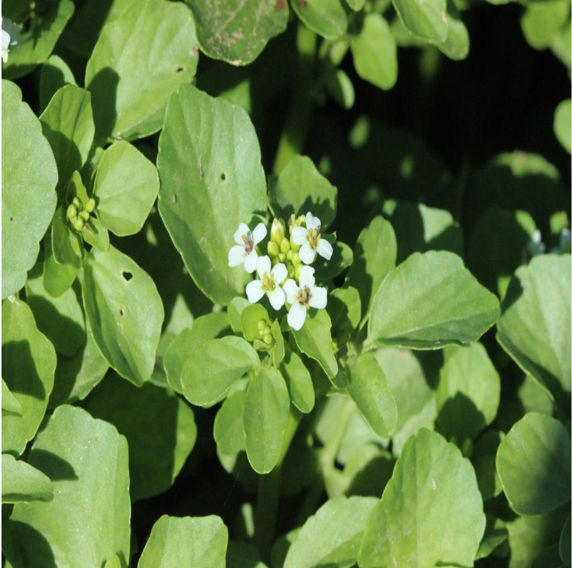
Resim 4.21 Nasturtium officinale R.Br. (Su teresi, Gerdima)