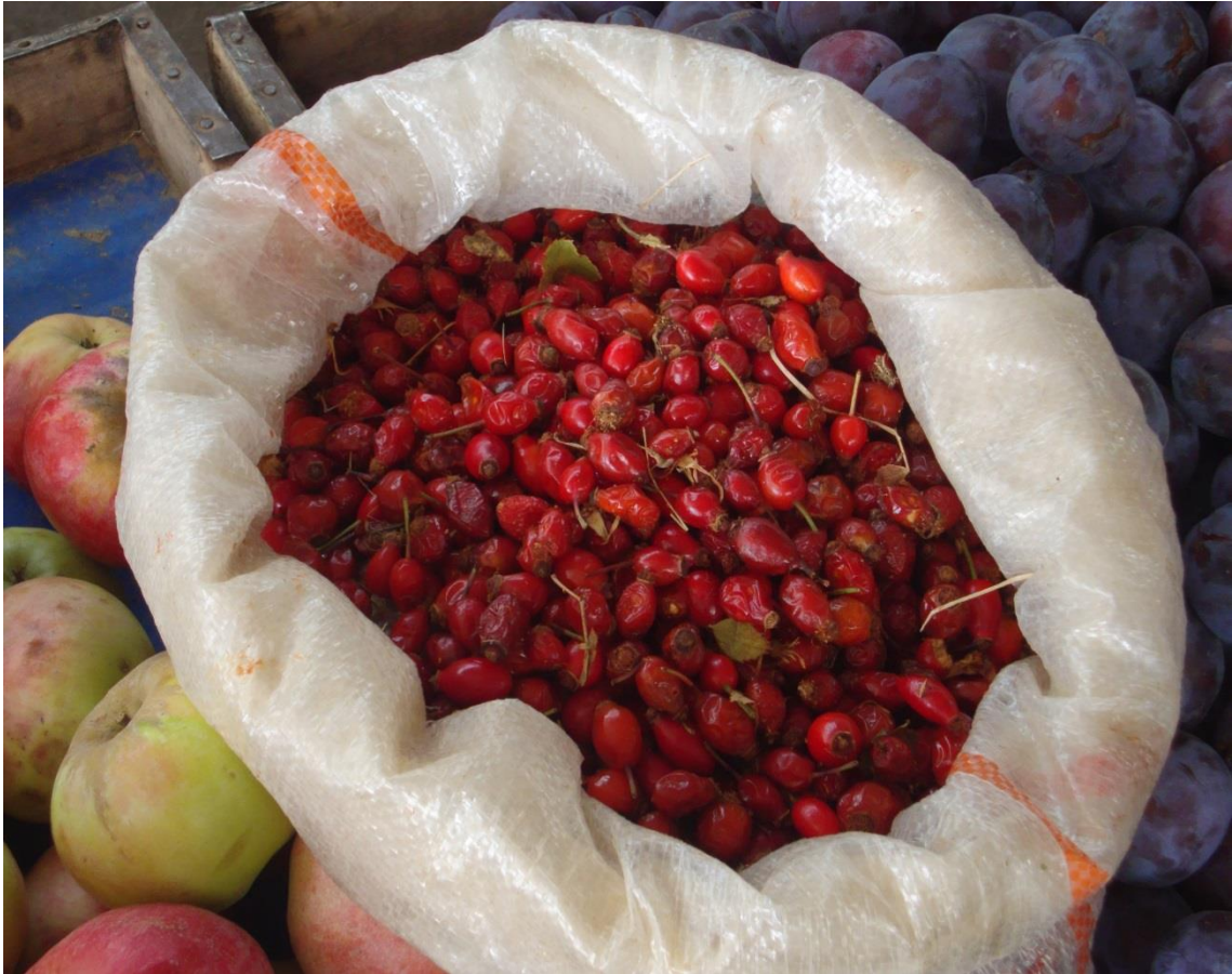
Resim 4.67 Rosa canina L. (Kuşburnu)

Araştırma Alanı: Kızılören Gülyazı köyü, Sandıklı Soğucak köyü