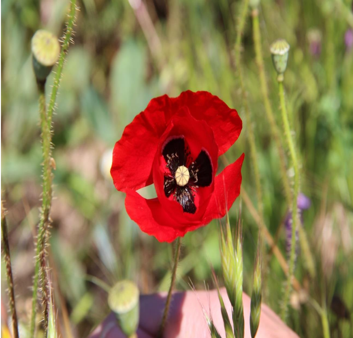
Resim 4.50 Papaver rhoeas L. (Gelincik, Gelincik yeşili)