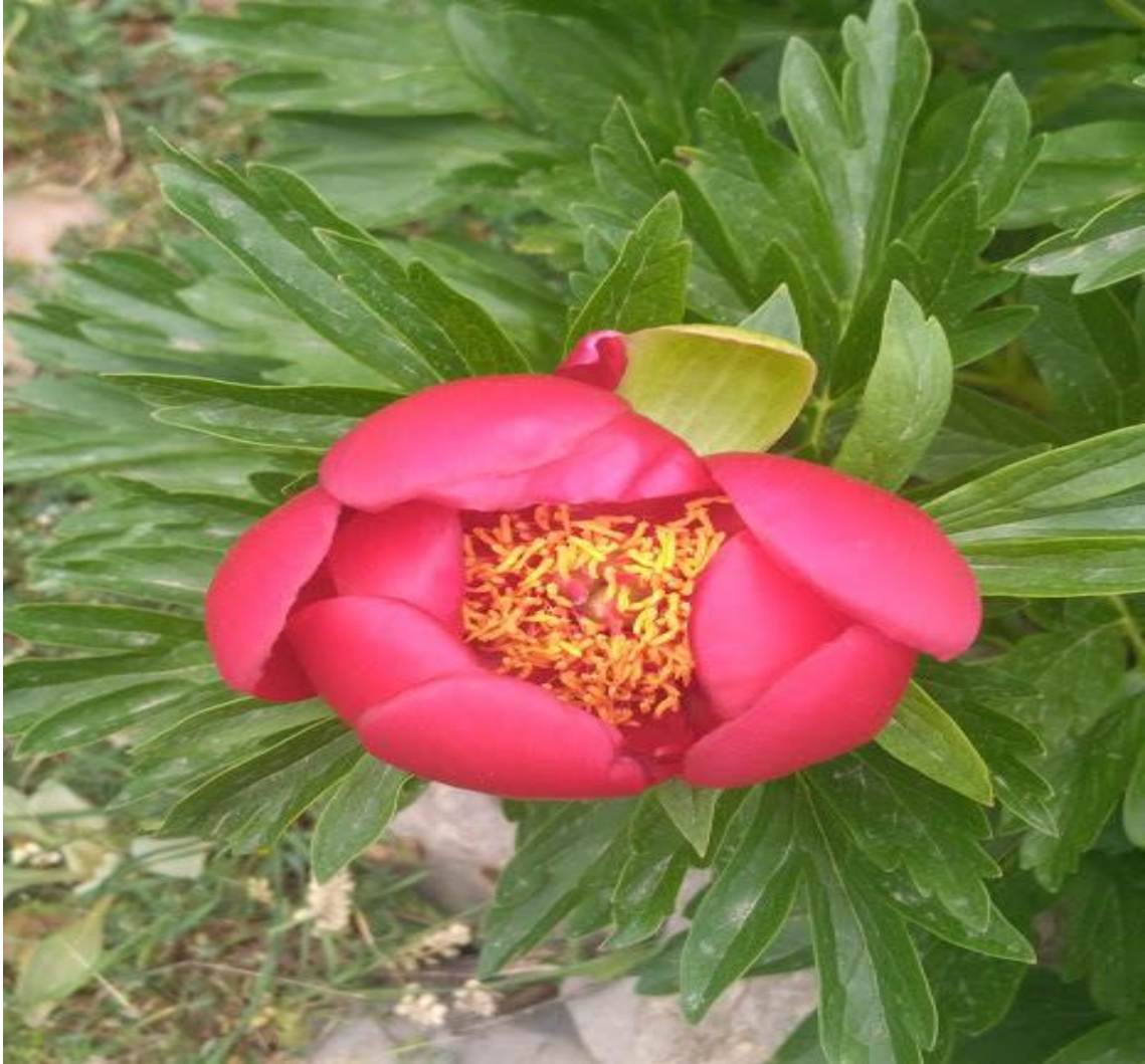
Resim 4.49 Paeonia mascula (L.) Mill. subsp. mascula (Ayı gülü)