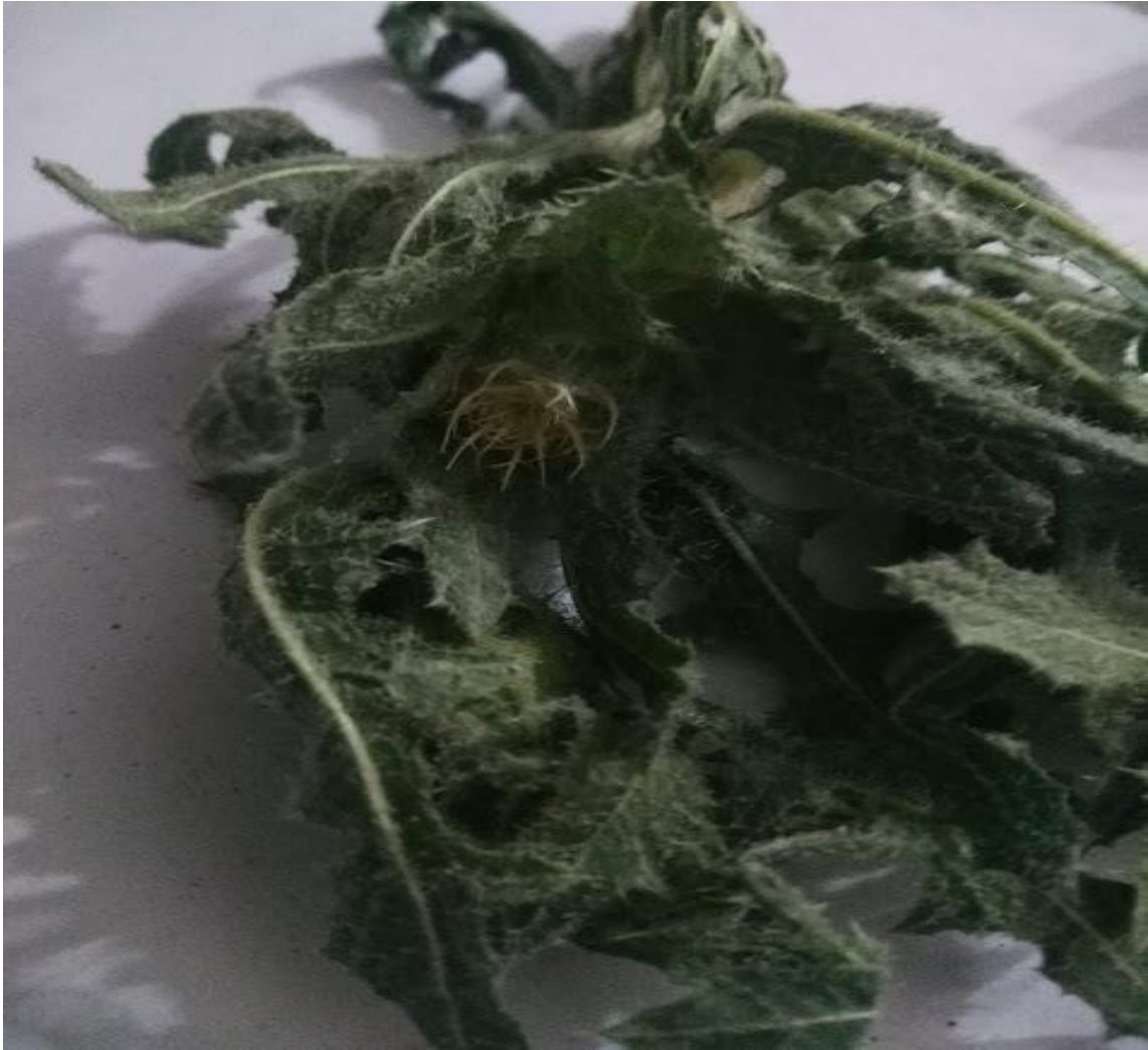
Resim 4.10 Centaurea benedicta (L.) L. (Sancı otu)

Araştırma Alanı: Dinar Cerit yaylası, Sandıklı Karadirek köyü