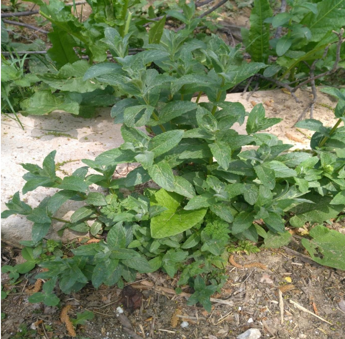
Resim 4.32 Mentha longifolia (L.) Huds. subsp. typhoides (Briq.) Harley var. typhoides (Nane)

Araştırma Alanı: Kızılören Gülyazı köyü, Sandıklı Akharım köyü