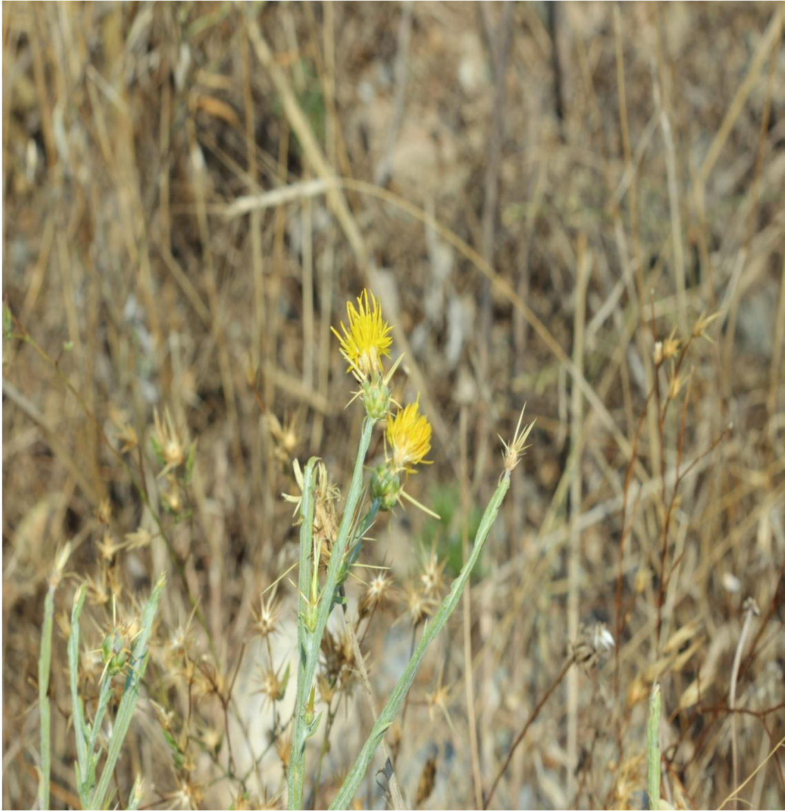
Resim 4.11 Centaurea solstitialis L. subsp. solstitialis (Sarı diken)