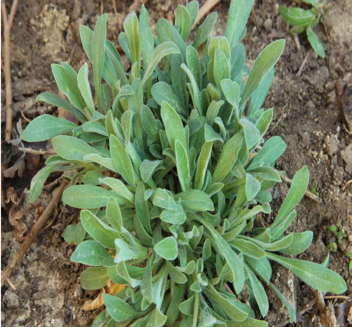
Resim 4.22 Silene dichotoma Ehrh. subsp. dichotoma (Tokluk başı, dişi tokluk başı, kara tohum)

Araştırma Alanı: Sandıklı Bekteş köyü, Sandıklı Ballık köyü, Örme kuyu köyü