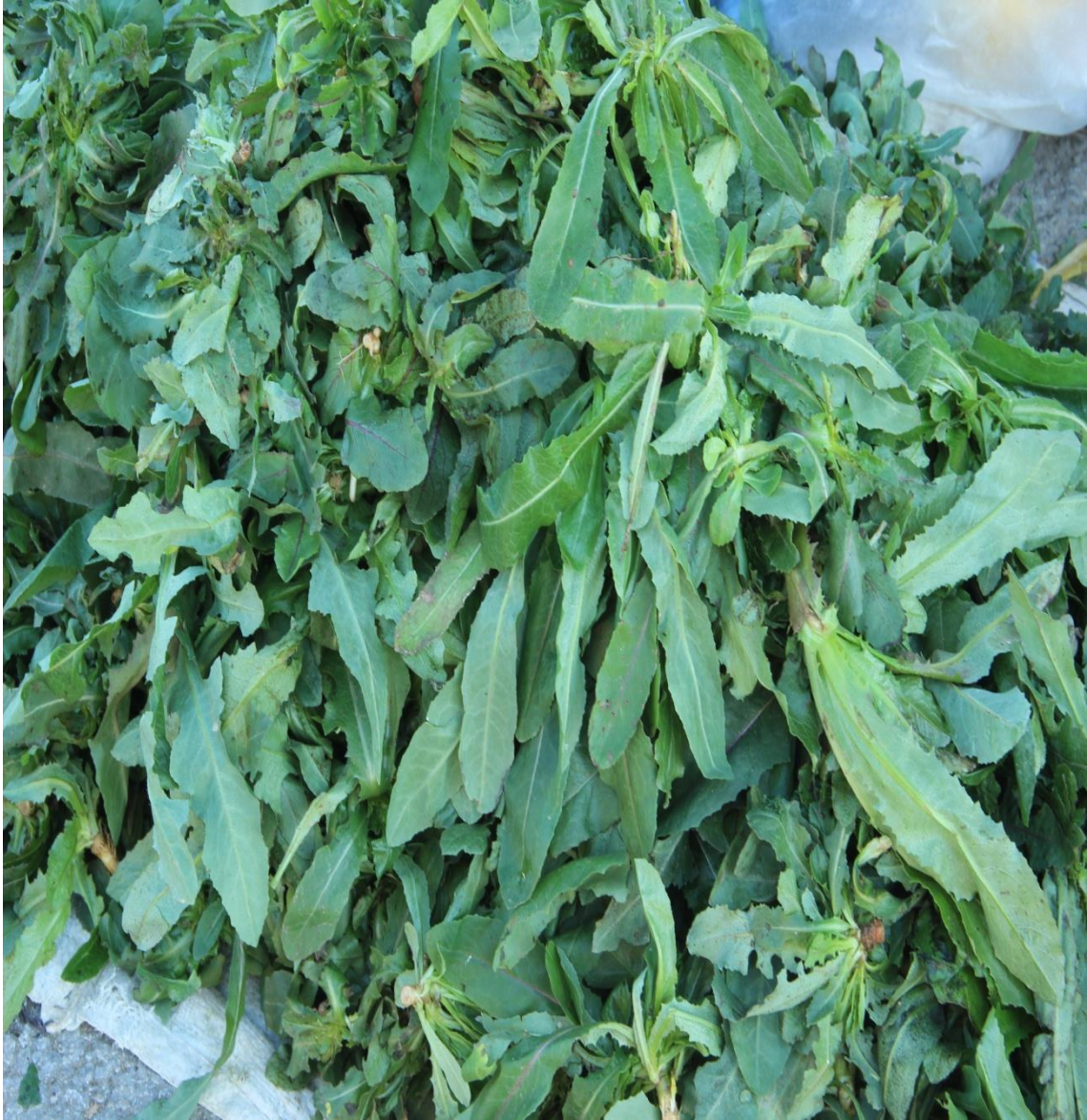
Resim 4.17 Lactuca serriola L. (Acı marul, eşek marul, dağ marul)

Araştırma Alanı: Sandıklı Sorkun köyü, Dinar Cerit yaylası