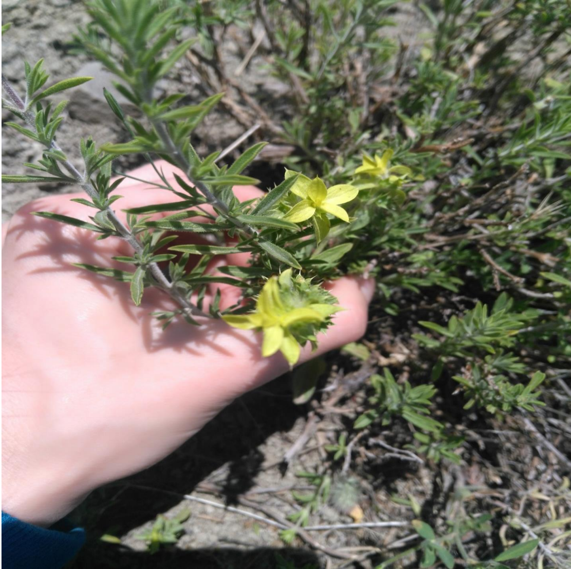
Resim 4.42 Sideritis montana L. subsp. montana (Karaay, ay otu)

Arařtırma Alanı: Sandıklı Ballık köyü, Örmekuyu köyü