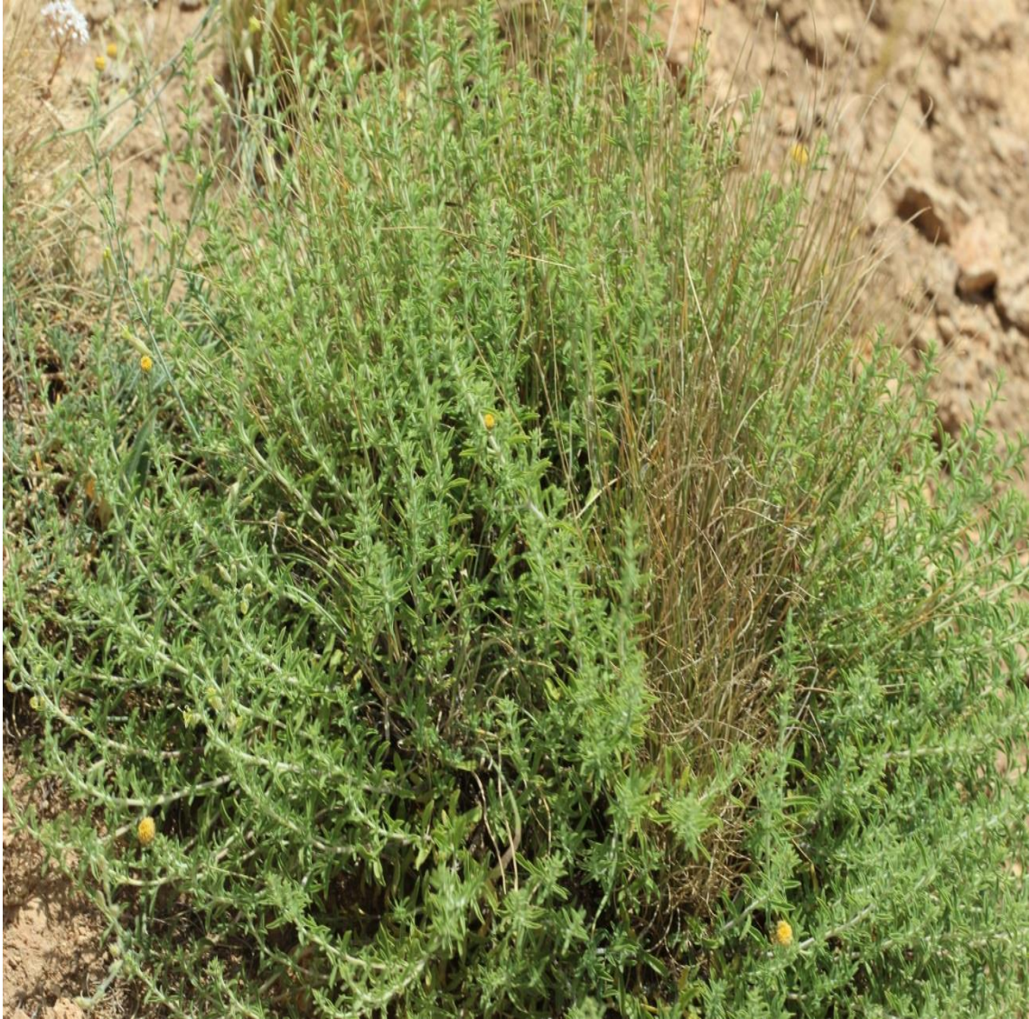
Resim 4.38 Satureja cuneifolia Ten. (Dağ kekiği, Taş kekiği, Karataş kekiği)

Araştırma Alanı: Sandıklı Ballık köyü Örne kuyuköyü, Çukurca köyü