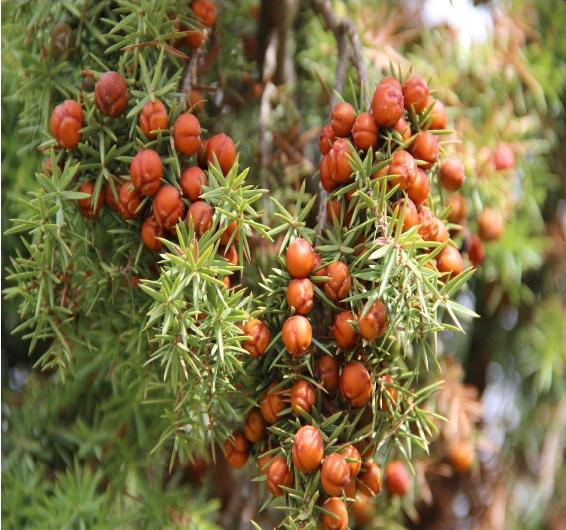
Resim 4.26 Juniperus oxycedrus L. subsp. oxycedrus (Diken ardıcı)