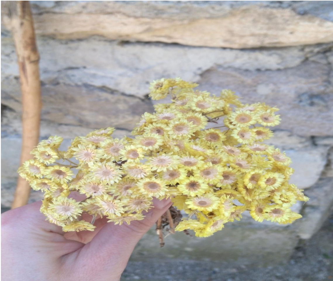
Resim 4.16 Helichrysum plicatum DC. subsp. plicatum (Arı çiçeği, Altın otu)

Araştırma Alanı: Kızılören Gülyazı köyü, Dinar Cerit yaylası, Sandıklı Çukurca köyü