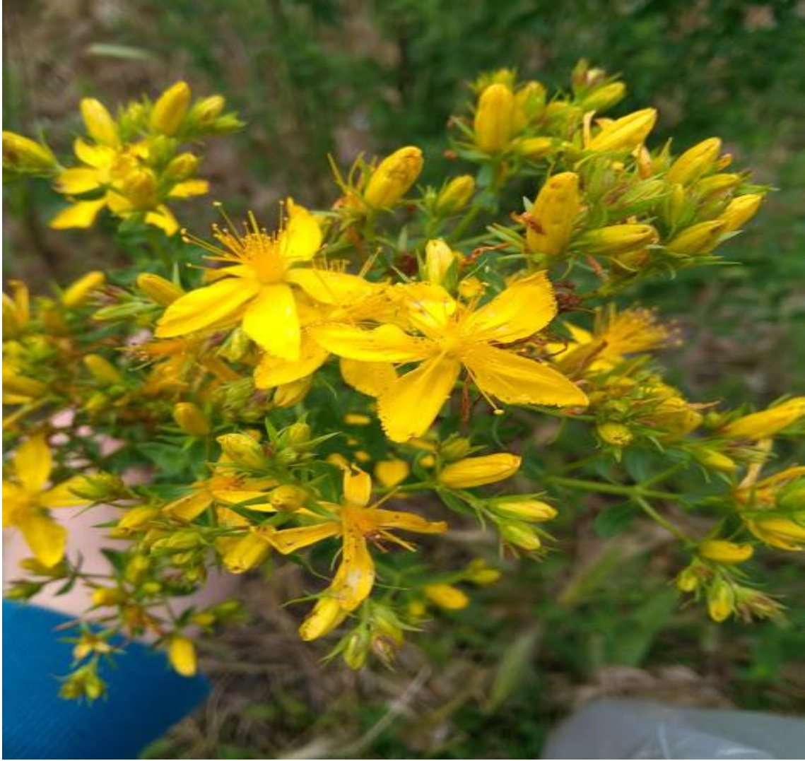
Resim 4.30 Hypericum perforatum L. subsp. perforatum (Sarı kantaron, Kantaron otu)

Araştırma Alanı: Sandıklı Ballık köyü, Sorkun köyü