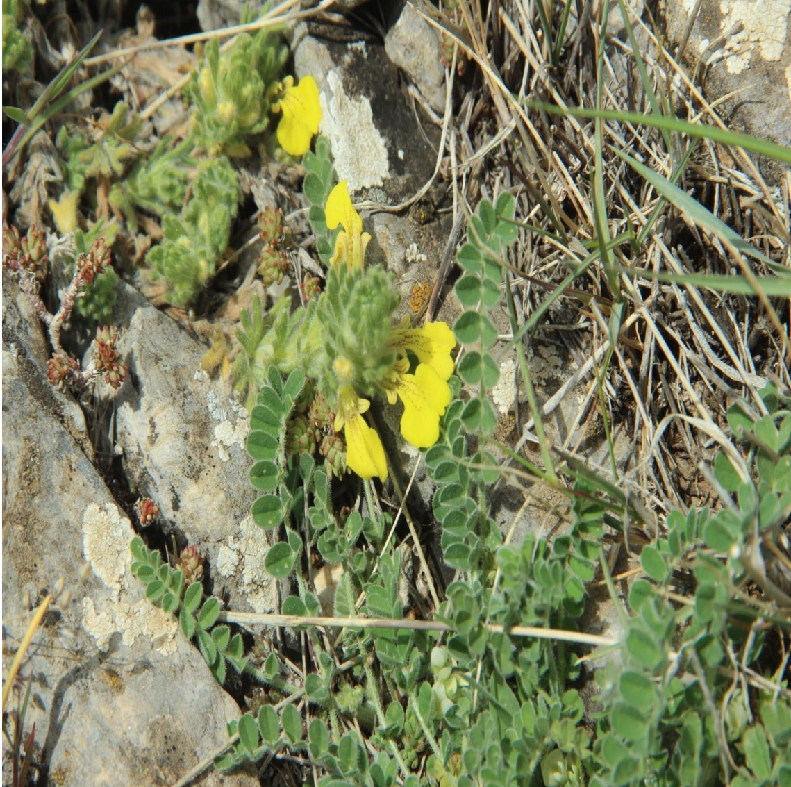
Resim 4.31 Ajuga chamaepitys (L.) Schreb. subsp. chia (Schreb.) Arcang. (Mayasıl otu)