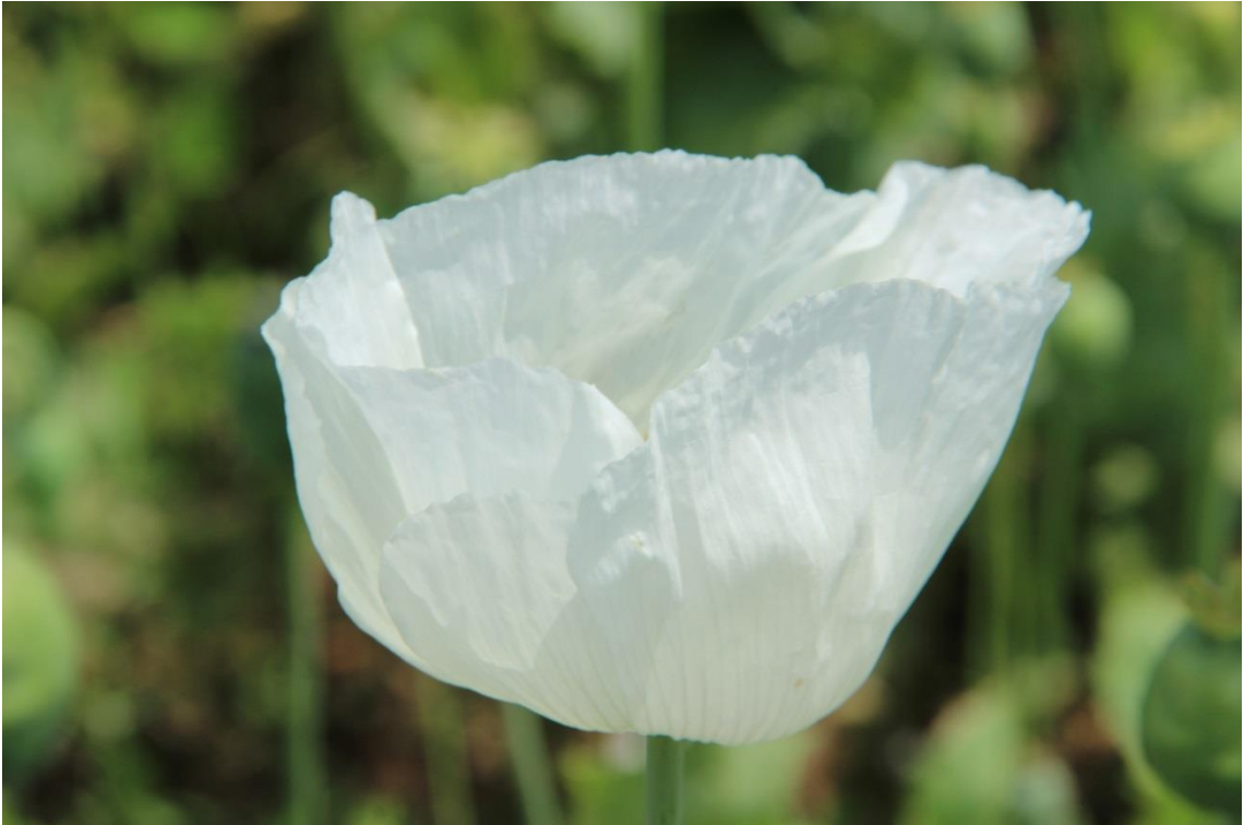
Resim 4.52 Papaver somniferum L. var. somniferum (Haşhaşın Yeşili, Haşhaş, Afyon Haşhaşı, Haşhaş ezmesi, Haşhaş çekmesi)