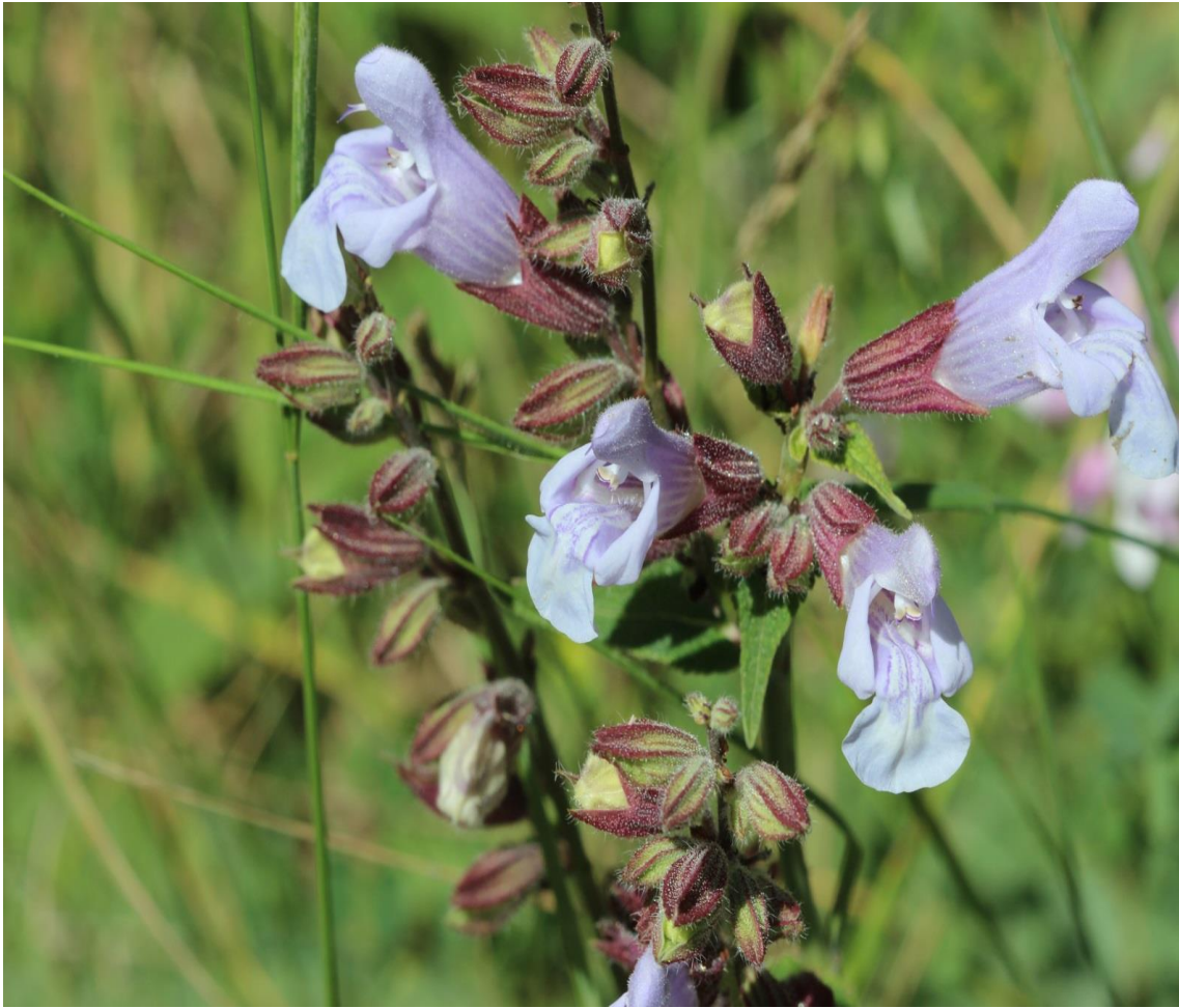
Resim 4.37 Salvia tomentosa Mill. (Calba, Çalba otu, Çalba Bitkisi, Çalba, Can taze, Adaçayı)

Araştırma Alanı: Dinar Cerit yaylası, Sandıklı Soğucak köyü, Örmekuyu köyü