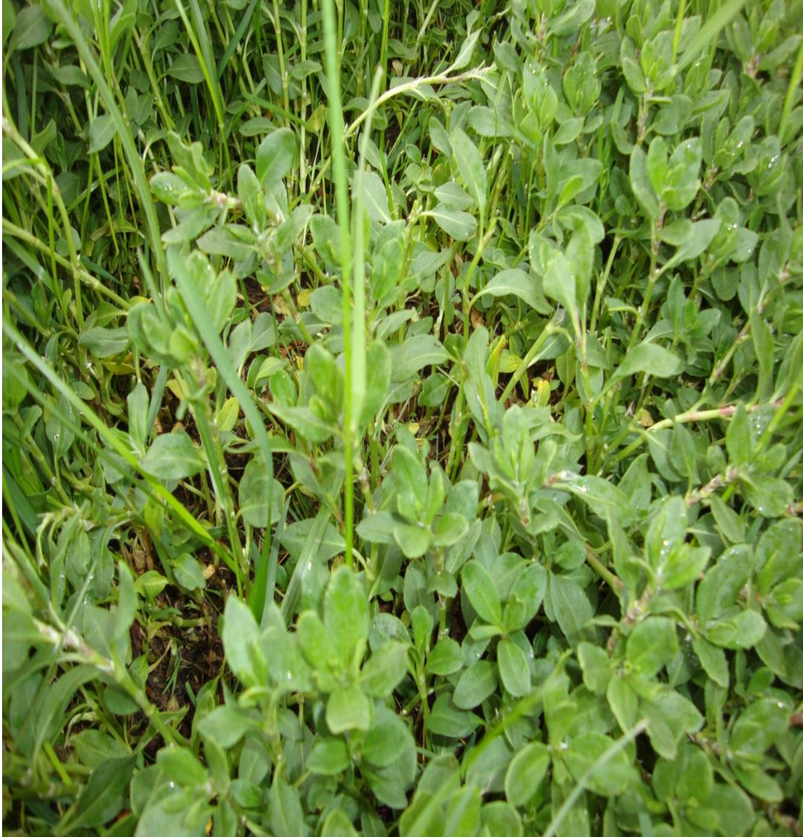
Resim 4.57 Polygonum cognatum Meissn. (Urgancık)