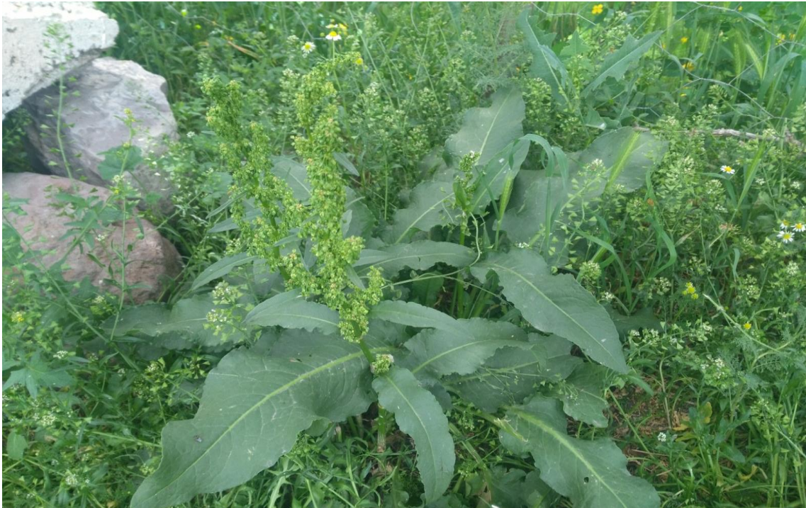
Resim 4.56 Rumex scutatus L. ( Şalva, Ebelik, İlibada, Sabla, Şabla)

Araştırma Alanı: Kızılören Gülyazı köyü, Dinar Cerit yaylası, Sandıklı Akharım köyü, Çukurca köyü, Çambeyli köyü, Dutağaç köyü, Ballık köyü, Sorkun köyü