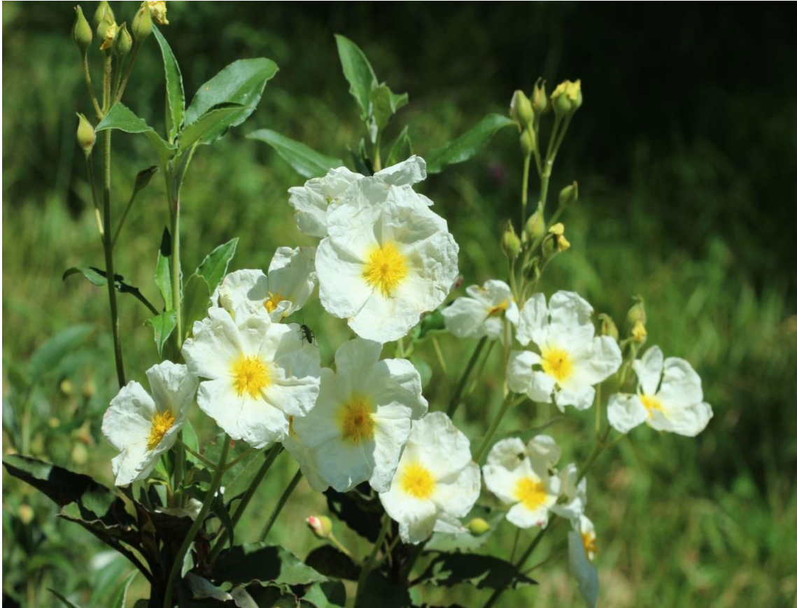
Resim 4.24 Cistus laurifolius L. (Tavşanak, tavşan otu, fısıs)