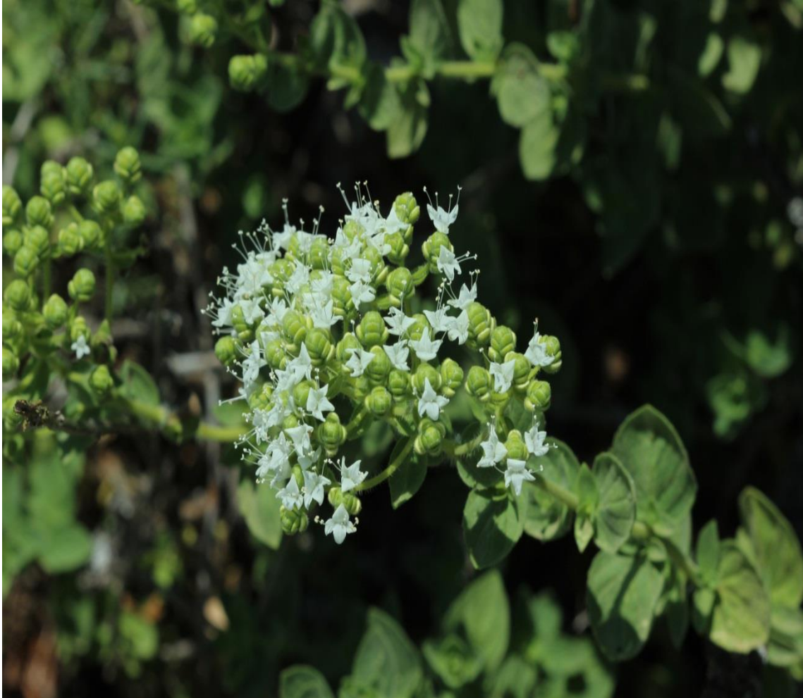
Resim 4.34 Origanum onites L. (Eşek kekiği, Kekik, Taş kekiği, Daş kekiği, Dağ kekiği)