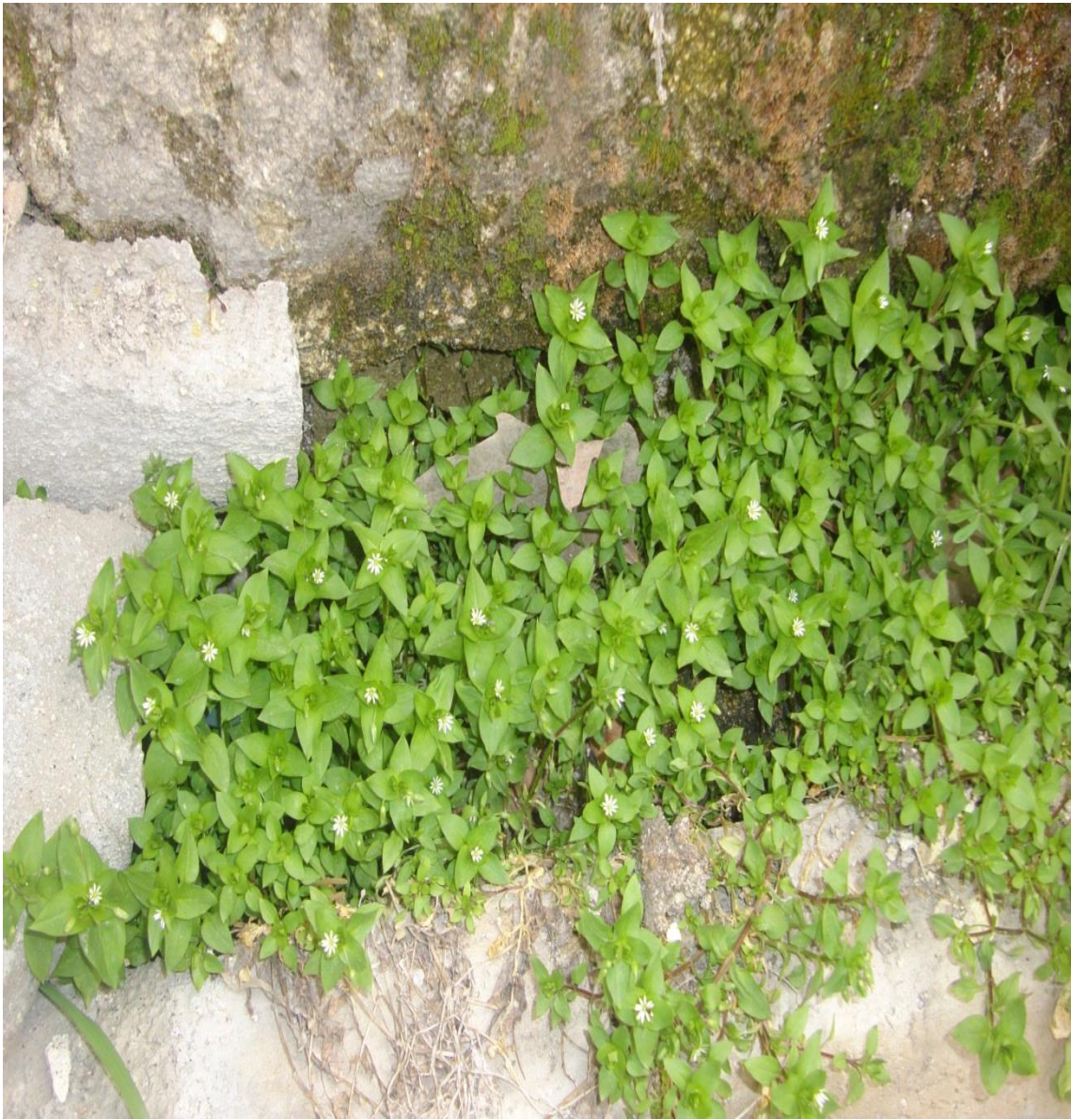
Resim 4.23 Stellaria media (L.)Vill. (Bici bici otu)