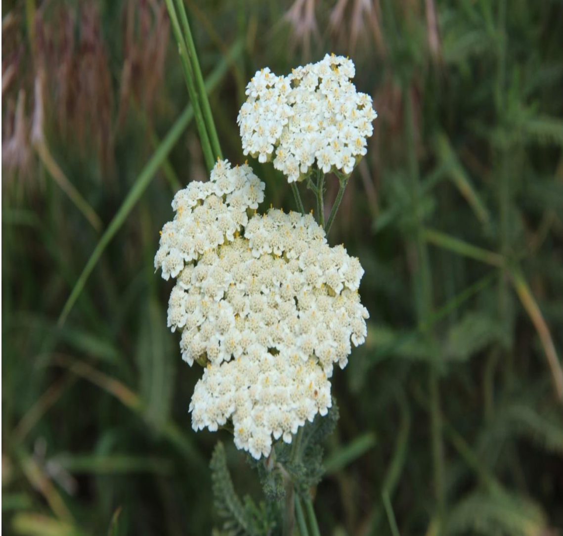
Resim 4.7 Achillea millefolium L. subsp. millefolium (Beyaz çiçekli Ayva dana)

Araştırma Alanı: Dinar Cerit yaylası, Sandıklı Sorkun köyü, Örme kuyu köyü, Ballık köyü