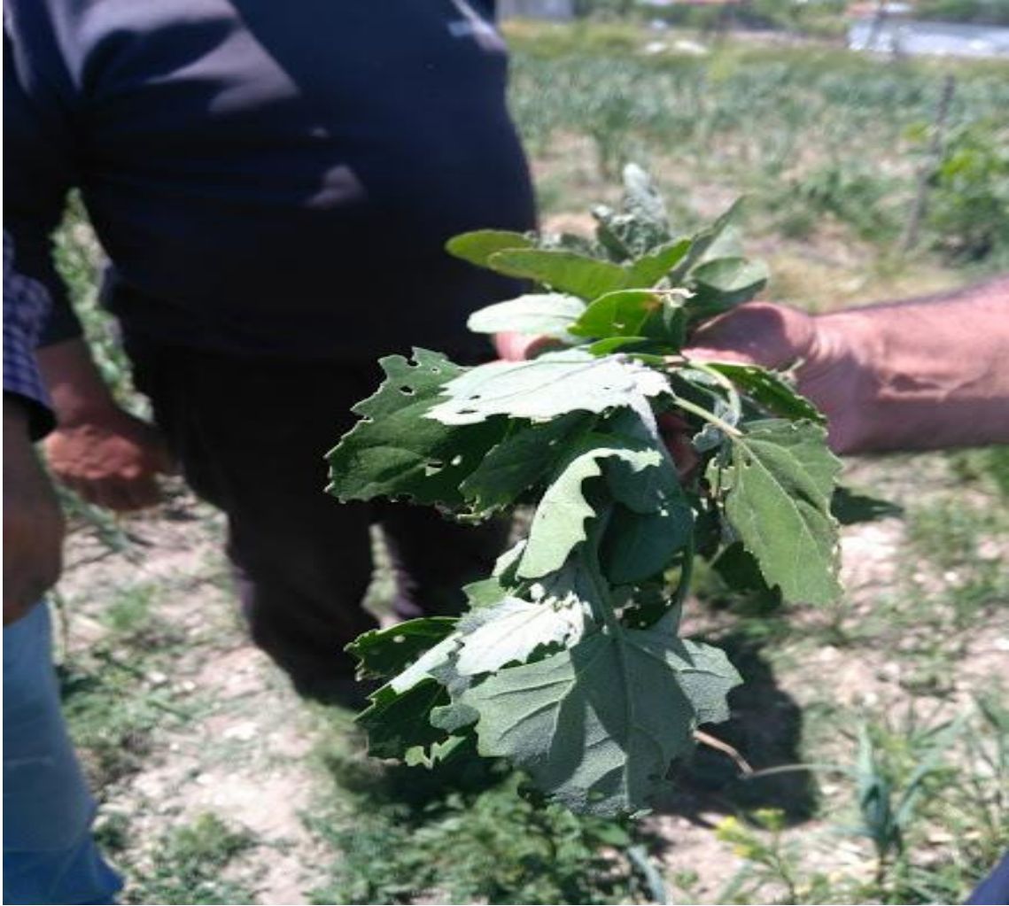
Resim 4.3 Chenopodium album L. subsp. album var. album (Sirken, Sirken otu, Sirkem)

Araştırma Alanı: Dinar Cerit yaylası, Sandıklı Sorkun köyü, Karadirek köyü, Ballık köyü