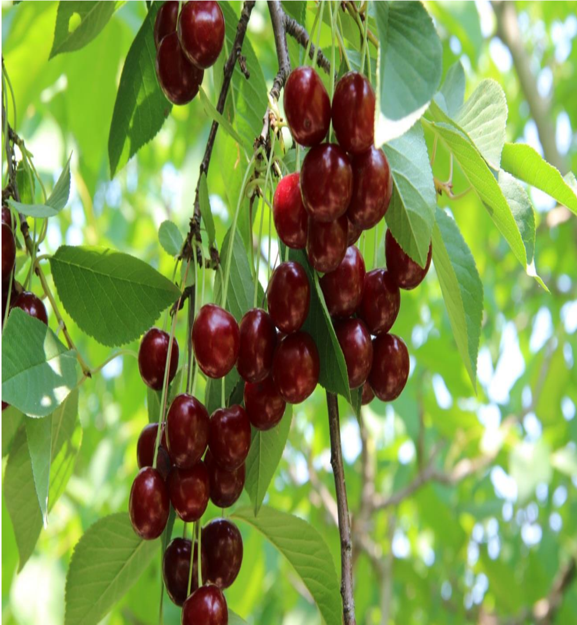
Resim 4.64 Prunus cerasus L. (Vişne)