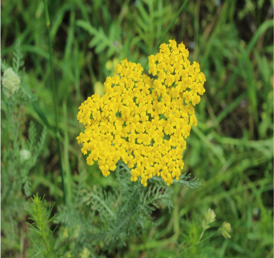
Resim 4.6 Archillea arabica Kotschy (Ayva dana)

Araştırma Alanı: Sandıklı Karadirek köyü, Ballık köyü, Örme kuyu köyü, Sorkun köyü