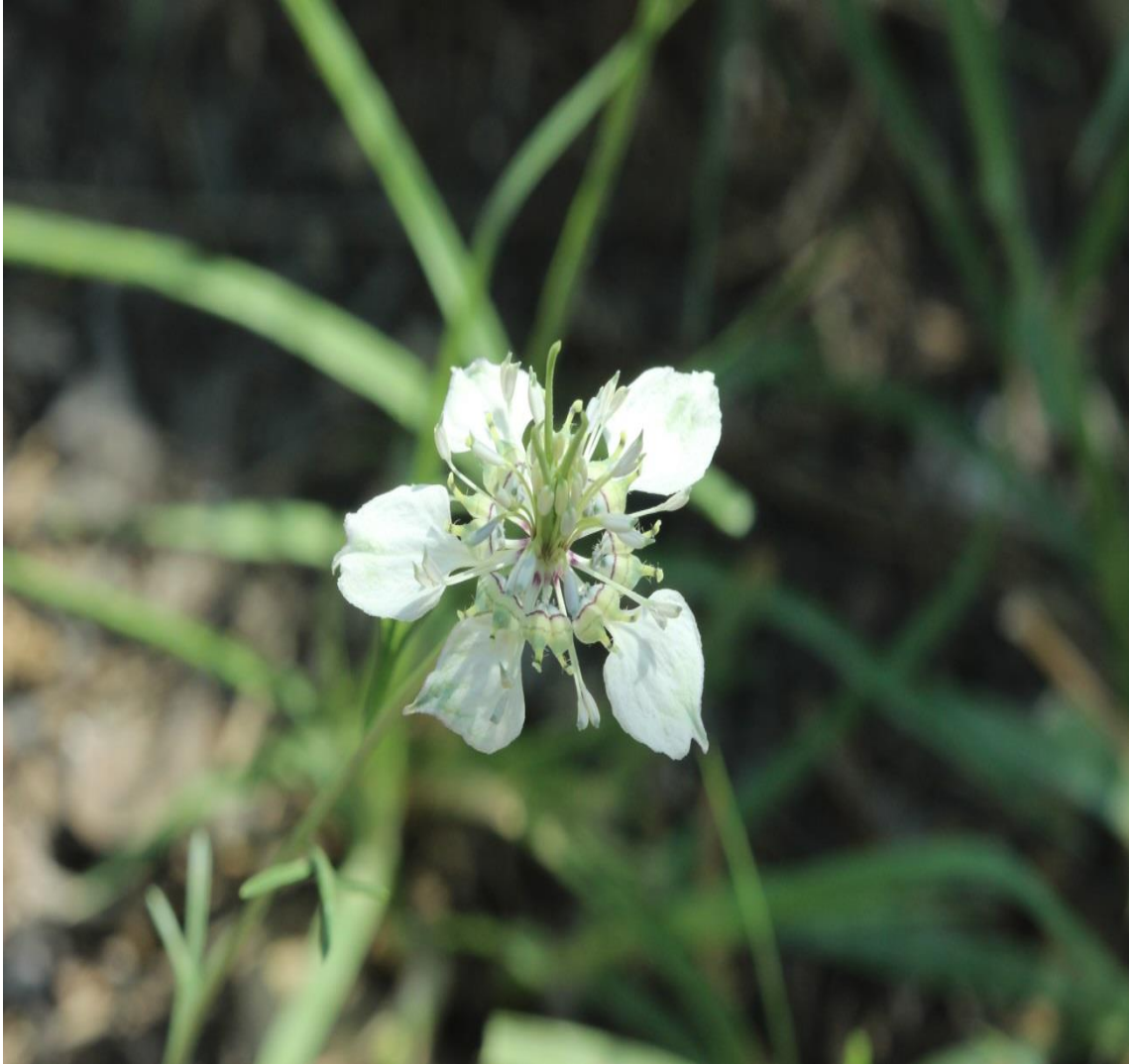
Resim 4.59 Nigella sativa L. (Çörek otu)