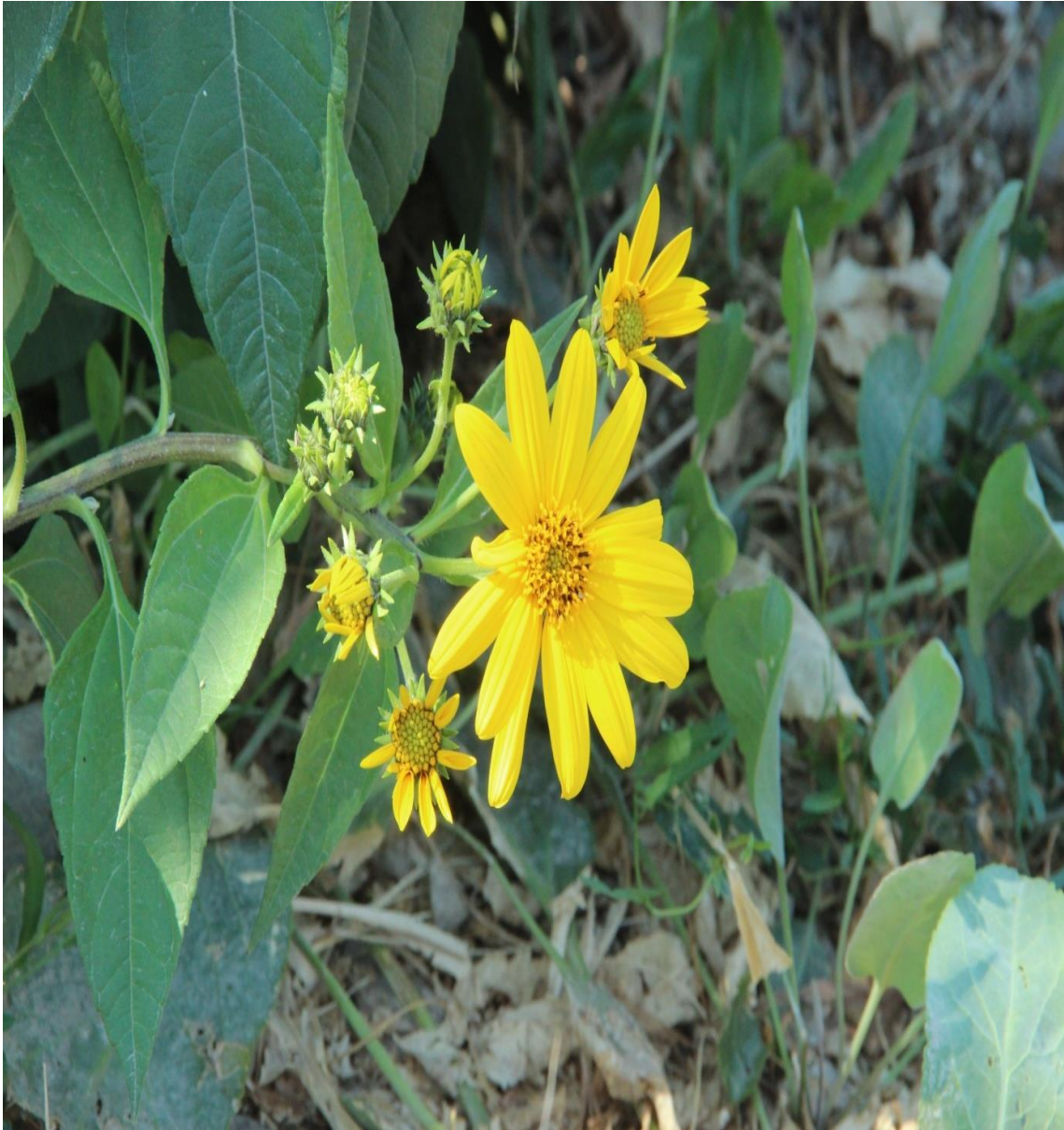
Resim 4.15 Helianthus tuberosus L. (Yer elması)