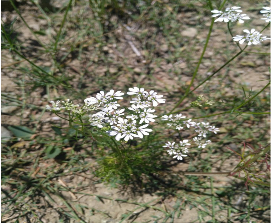
Resim 4.4 Coriandrum sativum L. (Kışniş, Kışneş)