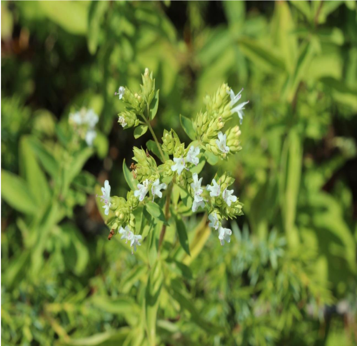
Resim 4.35 Origanum vulgare L. subsp. hirtum (Link) Ietsw. (Beyaz kekik)