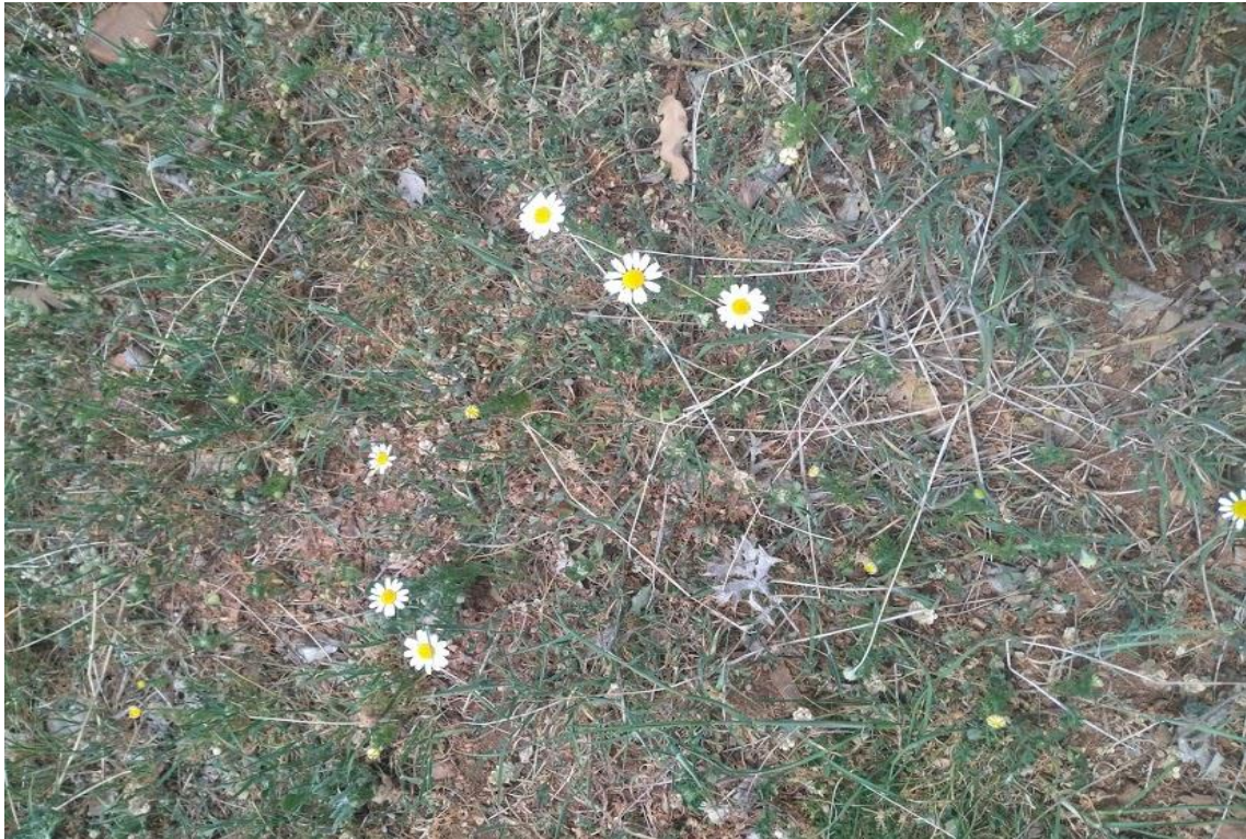
Resim 4.9 Anthemis wallii Hub.-Mor. & Reese (Bubeşce, Papatya)

Araştırma Alanı: Sandıklı Bekteş Köyü, Sorkun köyü, Soğucak köyü