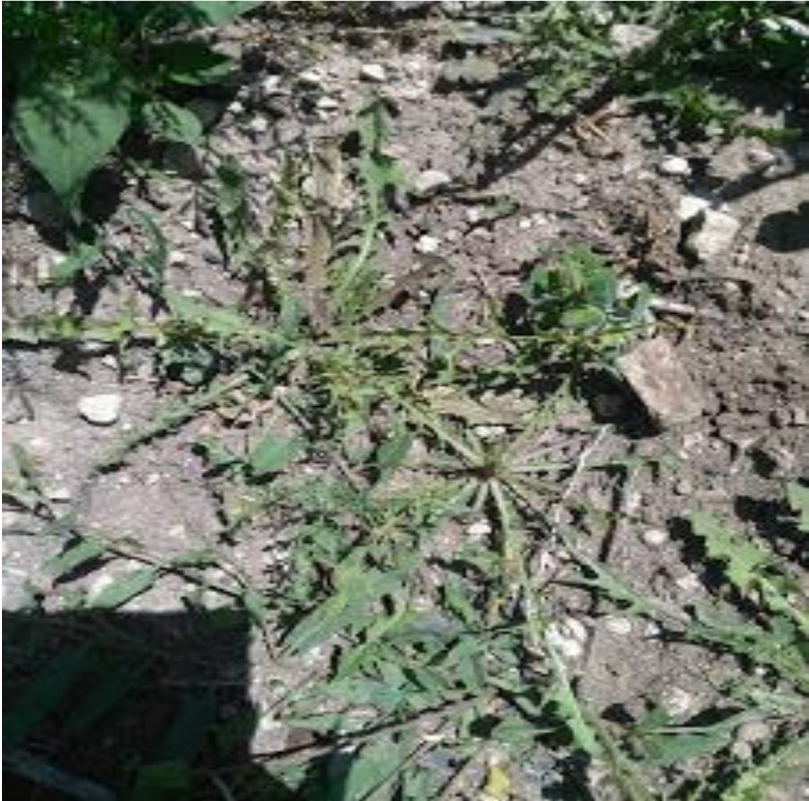
Resim 4.12 Chondrilla juncea L. (Karakavuk-karafuk)