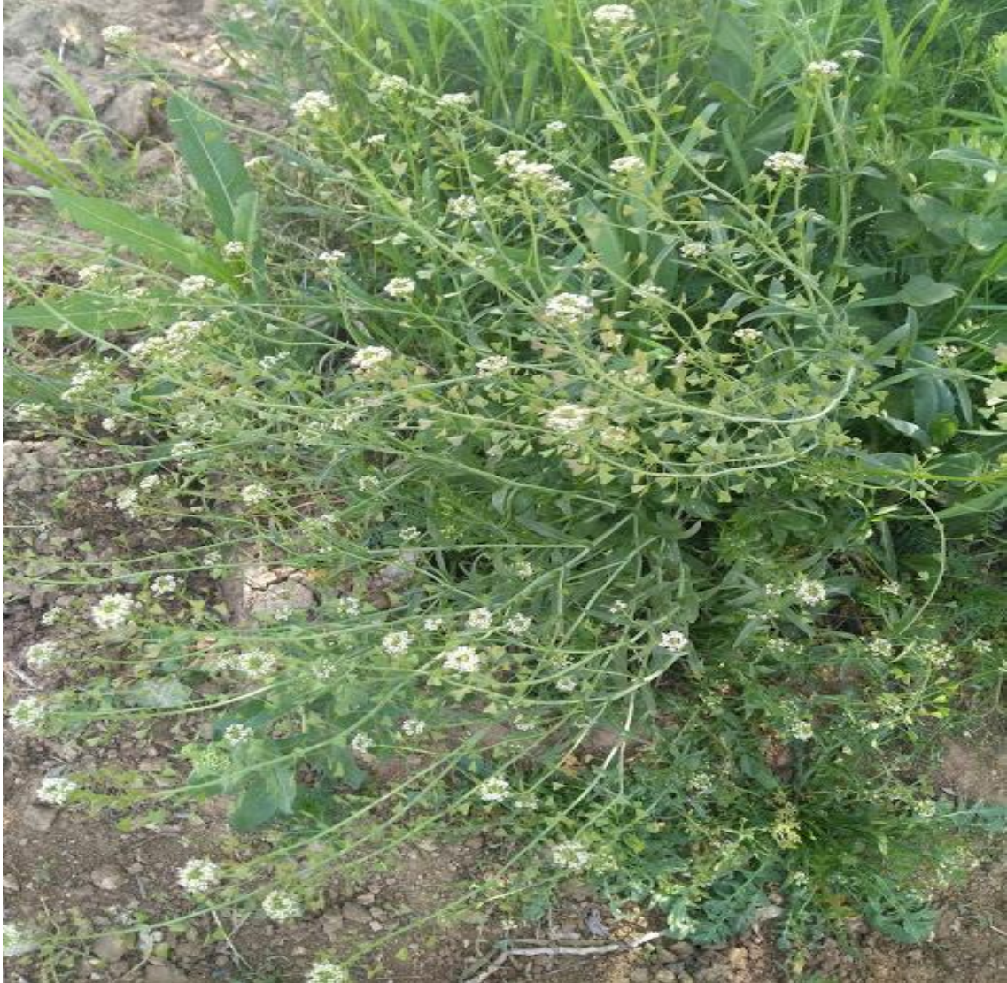
Resim 4.20 Capsella bursa-pastoris (L.) Medik (Çobançantası)