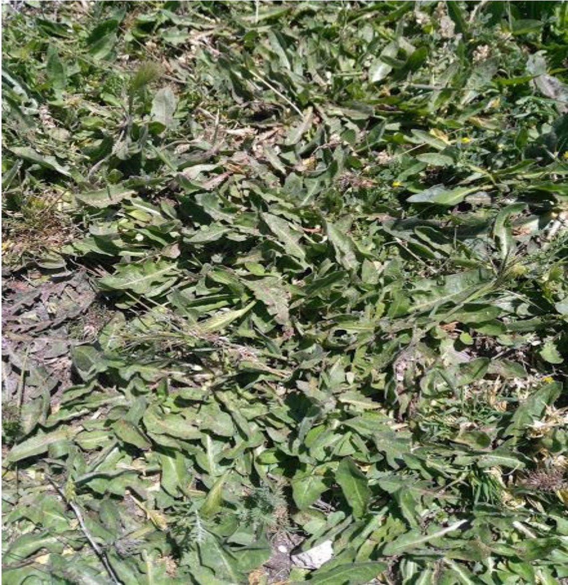
Resim 4.13 Cichorium intybus L. (Acı güneyik)

Araştırma Alanı: Sandıklı Ballık köyü, Sorkun köyü