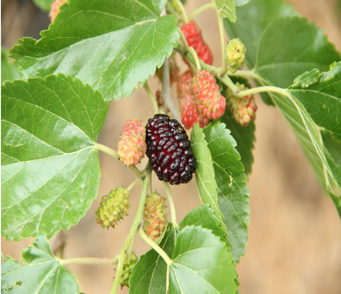
Resim 4.48 Morus nigra L. (Karadut)