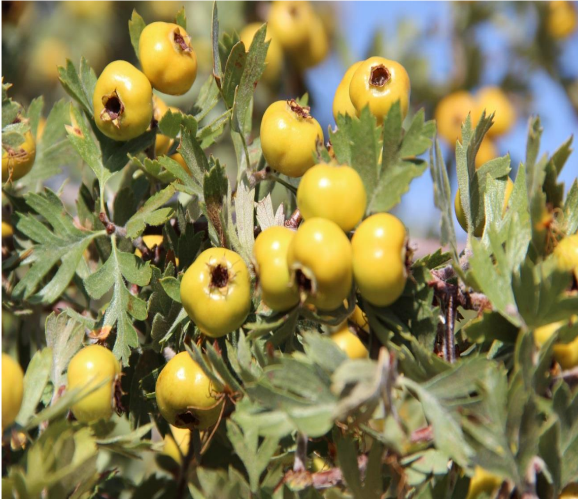
Resim 4.62 Crataegus tanacetifolia (Poir.) Pers. (Beyaz alıç, Alıç, Alıç Yapağı)

Araştırma Alanı: Sandıklı Dutagaç köyü, Bekteş köyü