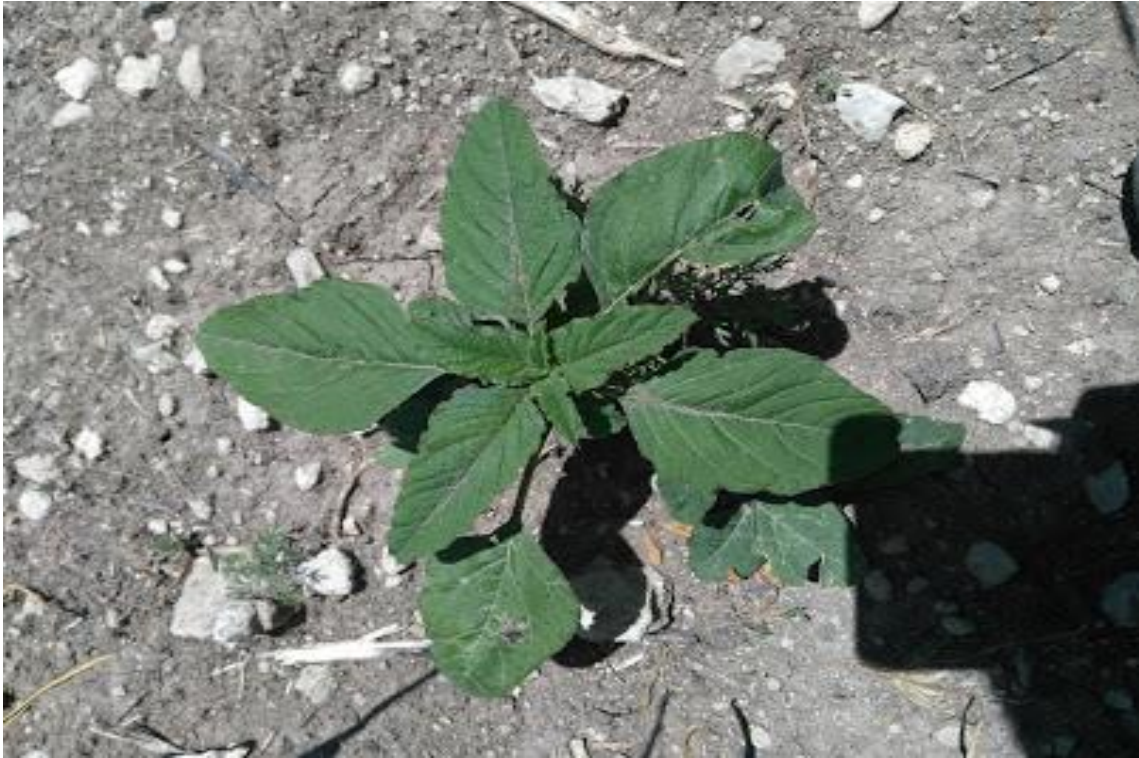
Resim 4.1 Amaranthus retroflexus L. (Kızıl bacak)

Araştırma Alanı: Dinar Cerit yaylası, Sandıklı Ballık köyü