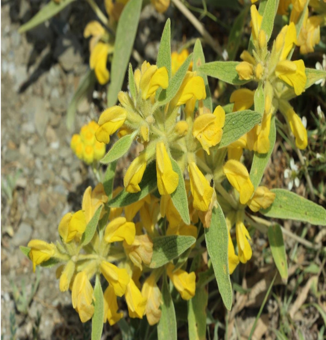
Resim 4.36 Phlomis armeniaca Willd. (Çalba)