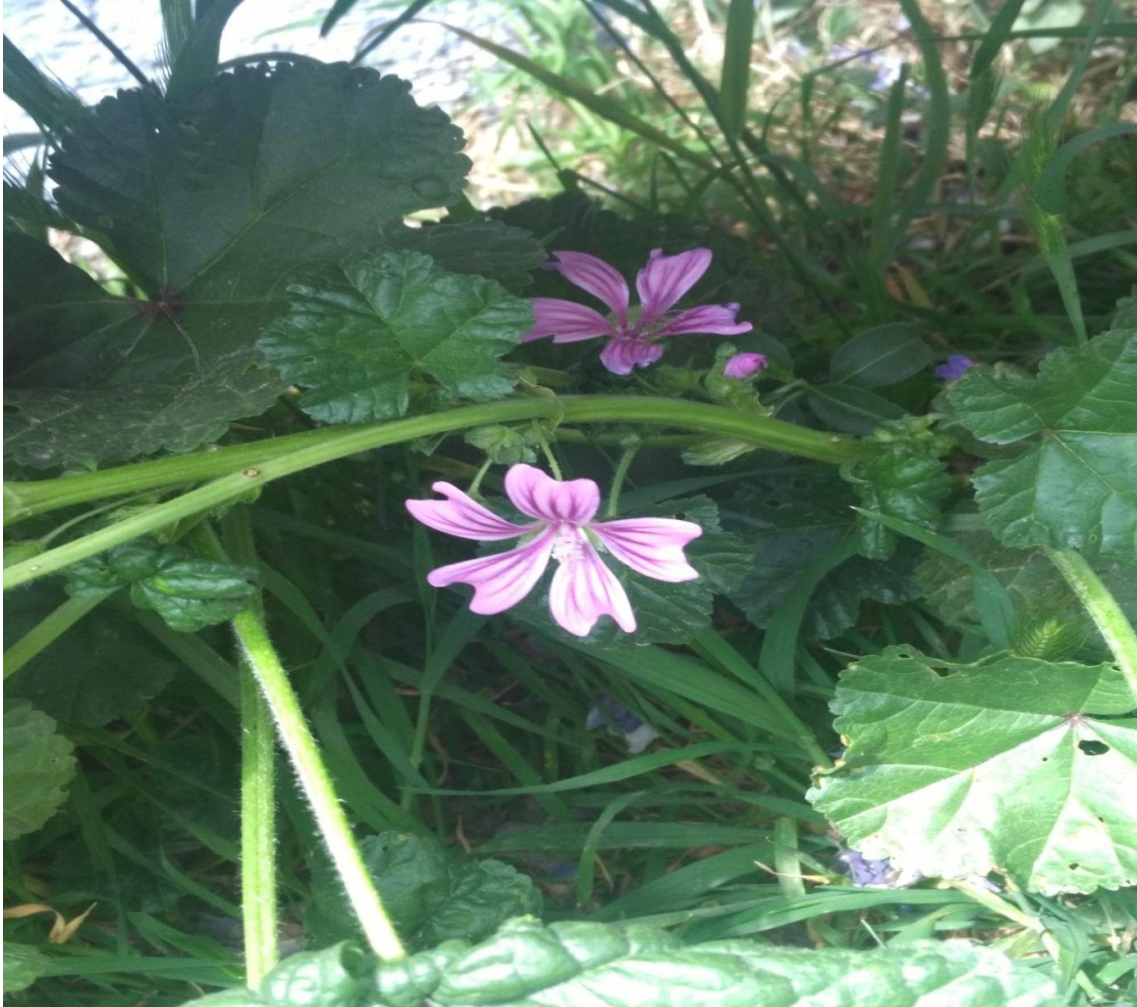
Resim 4.46 Malva sylvestris L. (Ebegümeçi, ebegömeçi)

Araştırma Alanı: Sandıklı Çambeyli köyü, Karadirek köyü, Dinar Cerit yaylası