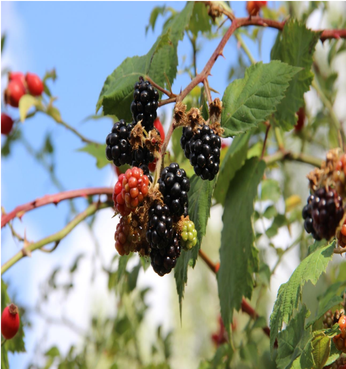
Resim 4.68 Rubus canescens DC. var. canescens (Çalı dudu, Çalı üzümü, Böğürtlen)

Araştırma Alanı: Sandıklı Dutagaç köyü, Bekteş köyü