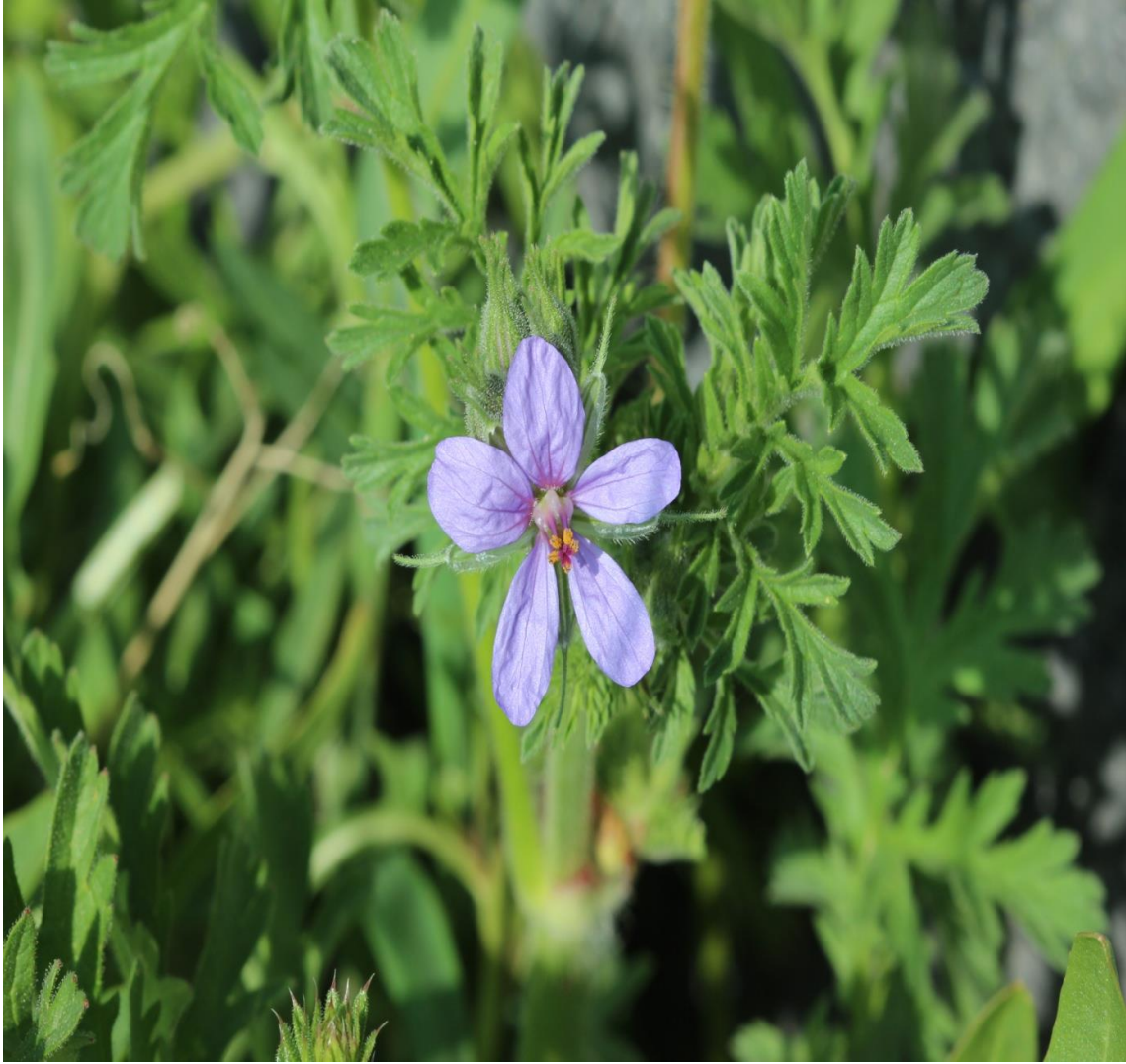
Resim 4.29 Erodium cicutarium (L.) L'Hér. (Turnagagası, Leylek kakacı)