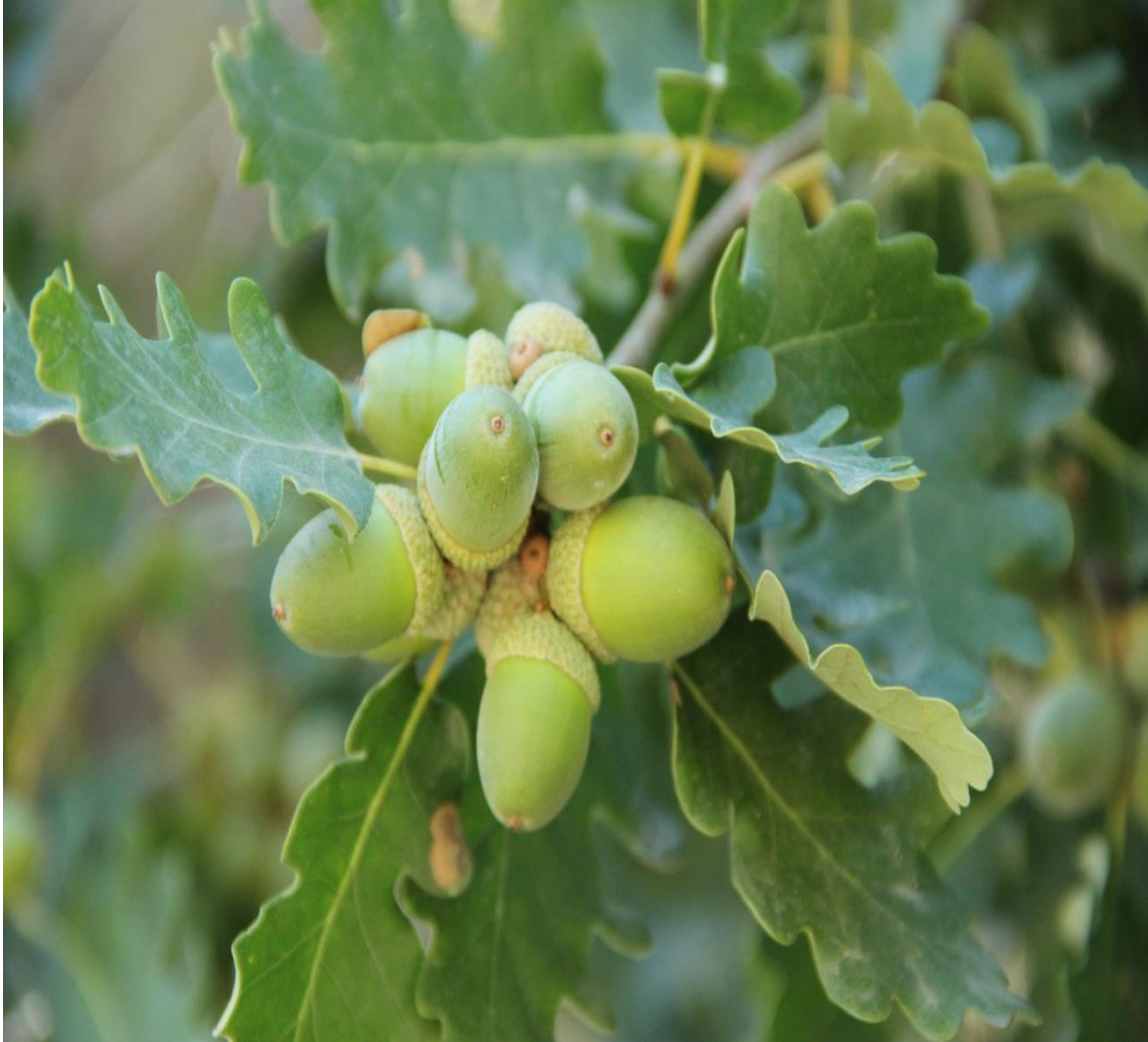
Resim 4.28 Quercus infectoria Oliv. subsp. boissieri (Reuter) O.Schwarz (Meşe, Meşe yaprağı, Mazı Meşesi, Meşe ağacı)