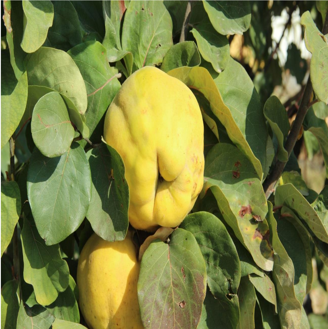
Resim 4.63 Cydonia oblonga Mill. (Ayva, Ayva yaprağı)