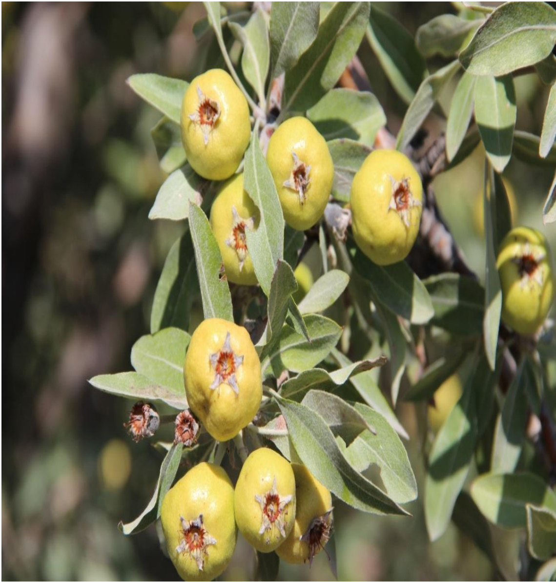
Resim 4.66 Pyrus elaeagnifolia Pallas subsp. elaegnifolia Pallas (Ahlat, Yaban Armudu)