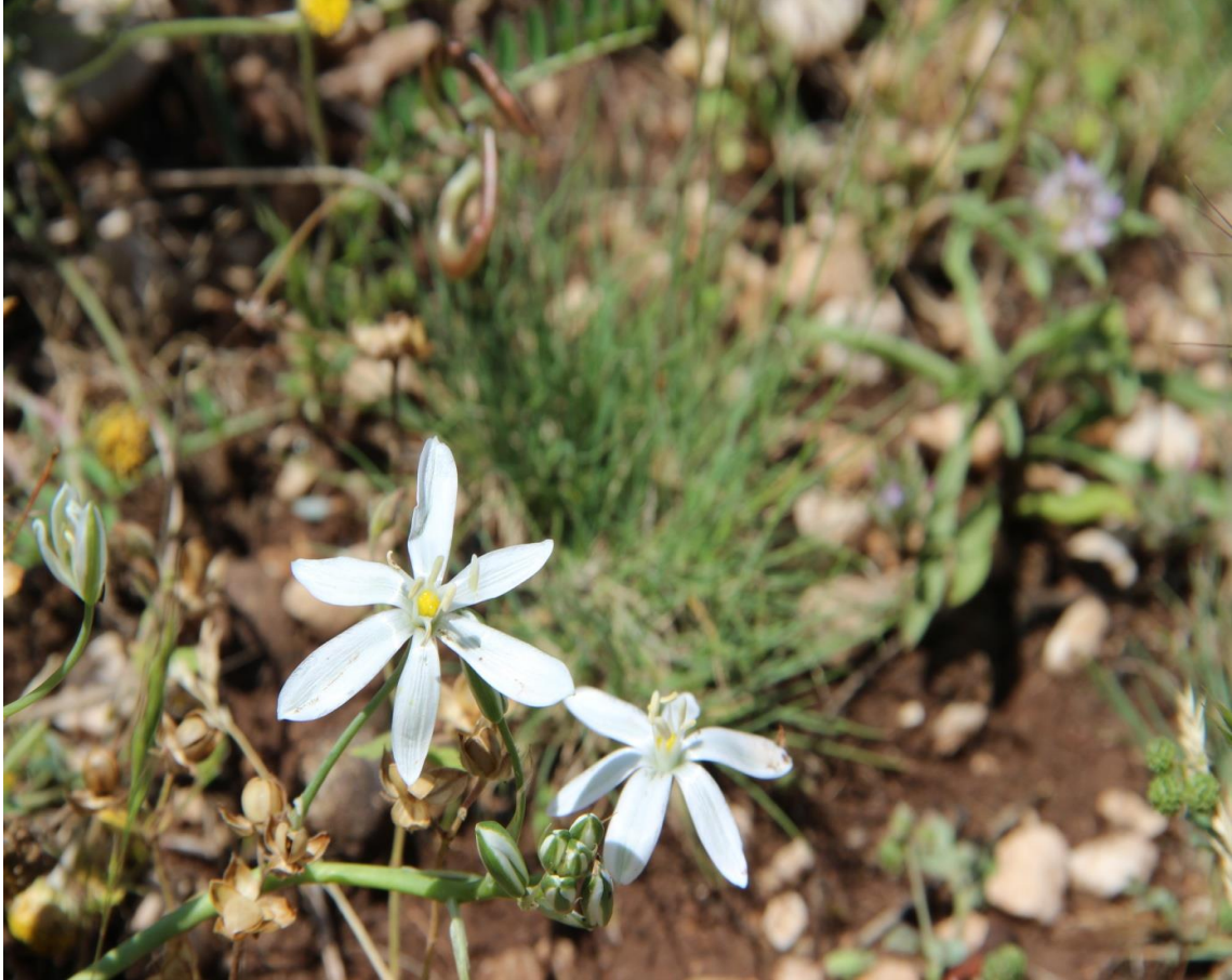
Resim 4.5 Ornithogalum neurostegium Boiss. & Blanche (Köpek soğanı)