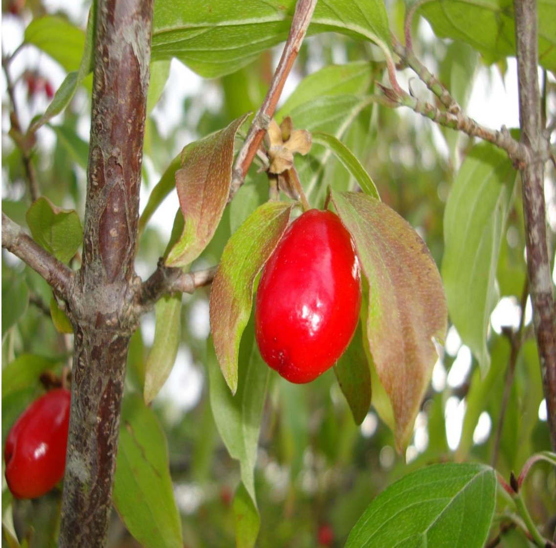
Resim 4.25 Cornus mas L.( Kızılciçkklar, kızılciçk, ergen meyvesi)

Araştırma Alanı: Sandıklı Bekteş köyü, Çambeyli köyü