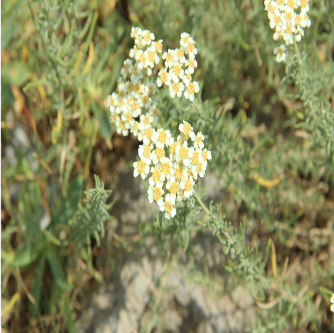
Resim 4.8 Achillea teretifolia Willd. (Ayva dana)

Araştırma Alanı: Sandıklı Örmekuyu köyü, Ballık köyü