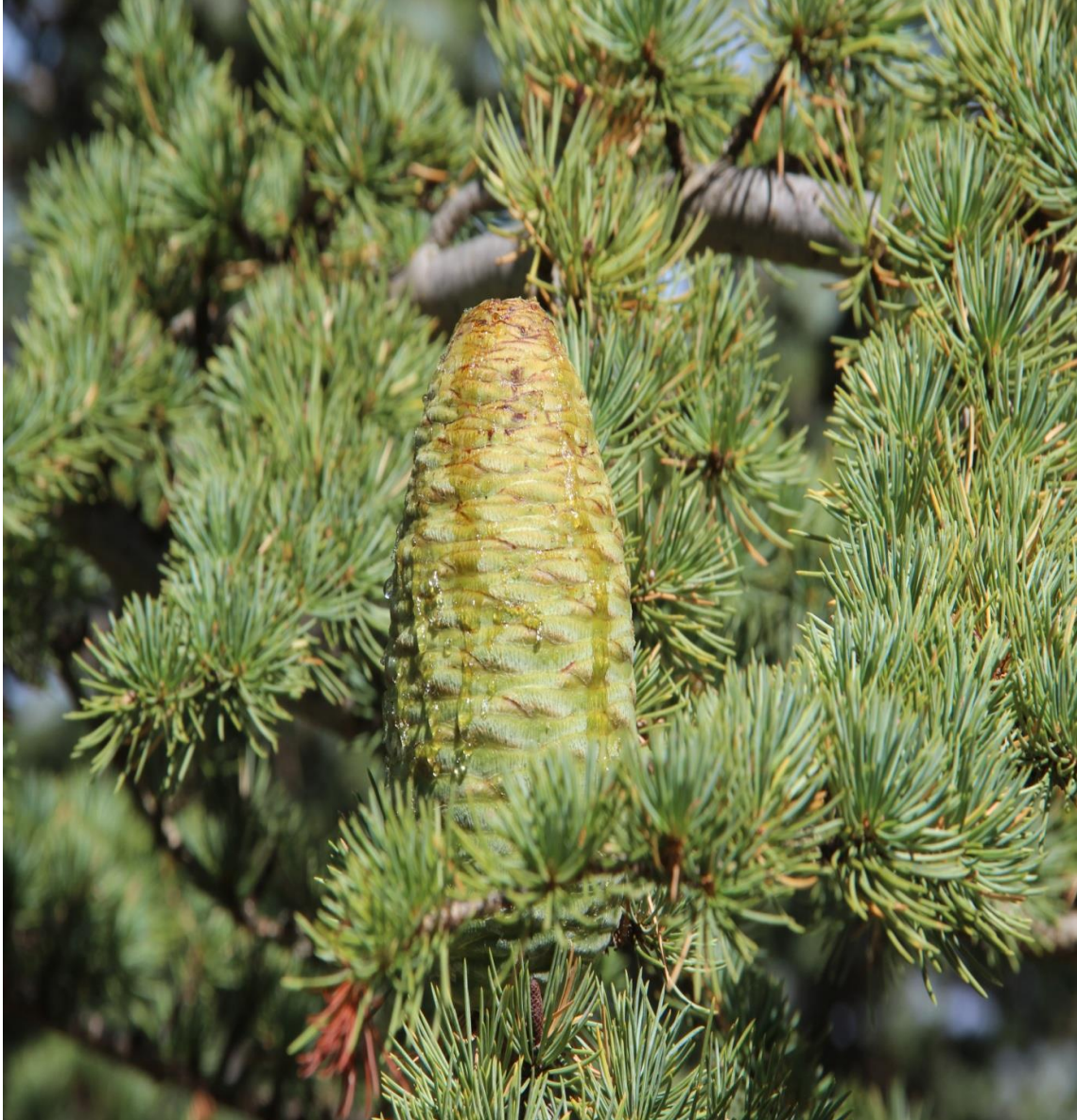
Resim 4.53 Cebrani libani A. Rich. var. libani (Katran ağacı)