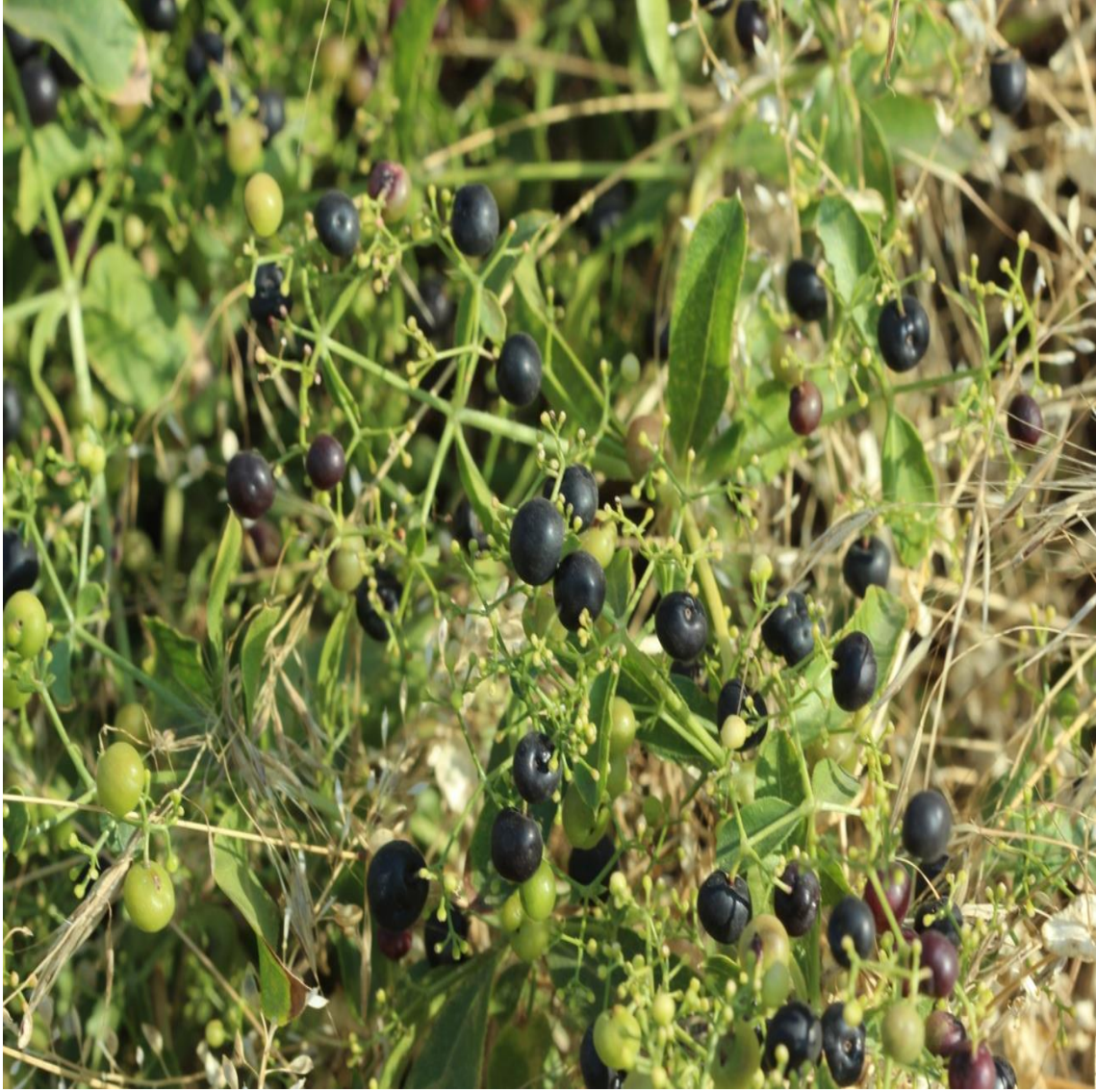
Resim 4.69 Rubia tinctorum L. (Yapışak)