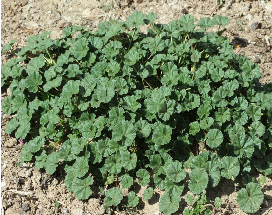
Resim 4.45 Malva neglecta Wallr. (Ebegümeçi, ebeğömeçi)

Araştırma Alanı: Sandıklı Çambeyli köyü, Sandıklı Ballık köyü, Sorkun köyü