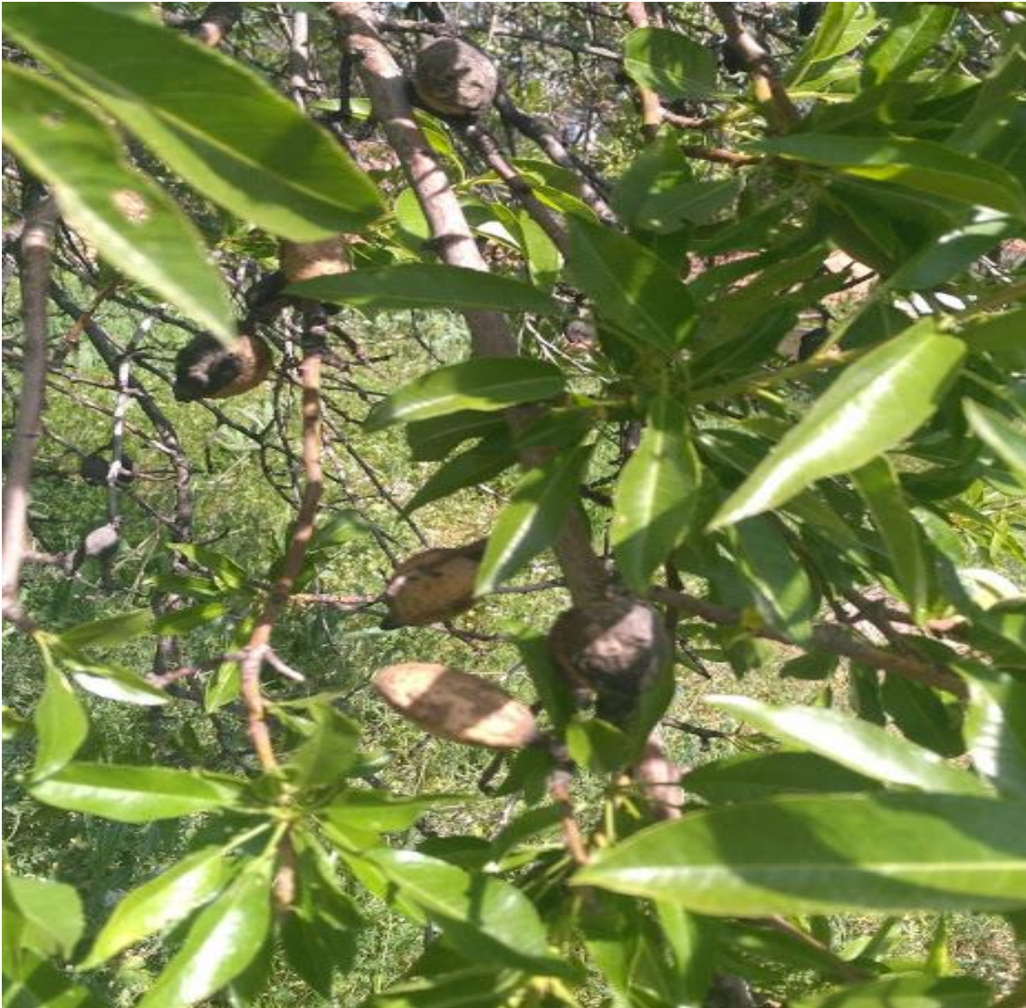
Resim 4.65 Prunus dulcis (Mill.) D.A. Webb (Acı badem)