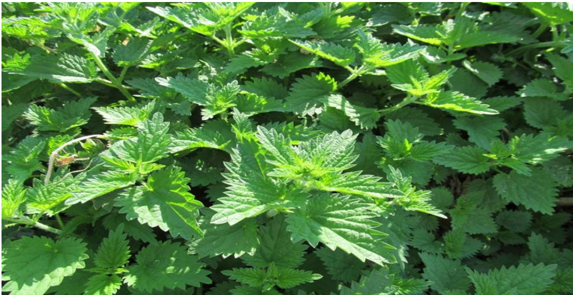
Resim 4.70 Urtica dioica L. subsp. dioica (Isırgan otu, Issıgan otu, Istırkan otu)

Araştırma Alanı: Kızılören Gülyazı köyü, Dinar Cerit yaylası, Sandıklı Çukurca köyü, Sorkun köyü