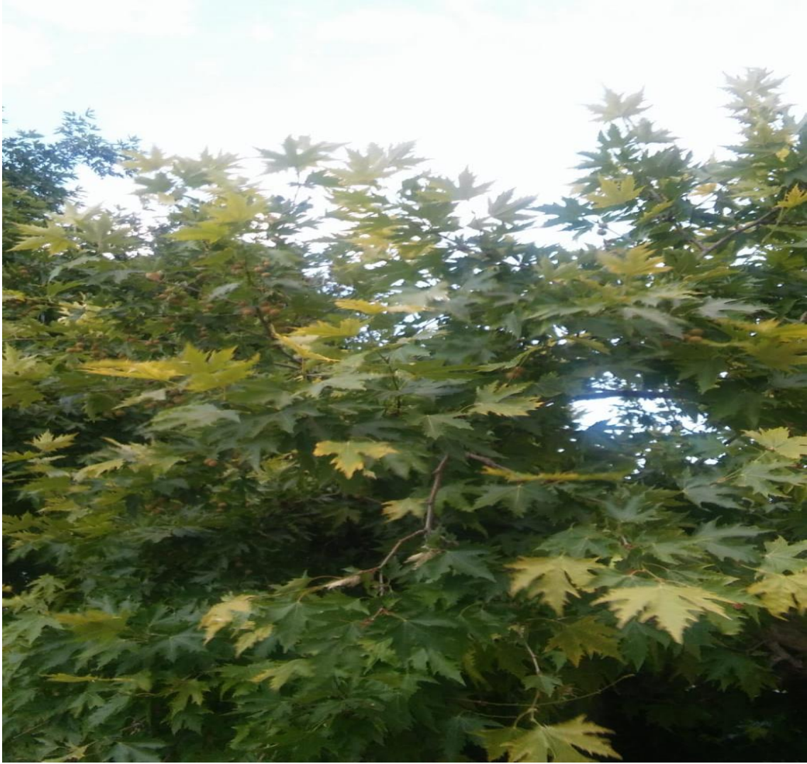
Resim 4.54 Platanus orientalis L. (Çınar yaprağı)