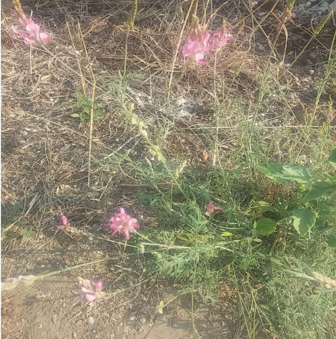
Resim 4.27 Onobrychis oxyodonta Boiss. (Çiçekli Sakarya yoncası, Sakarya yoncası)