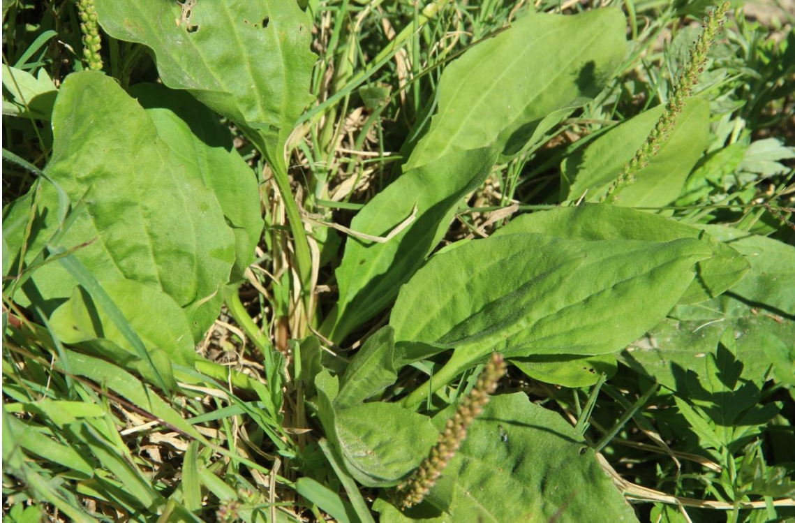
Resim 4.55 Plantago major L. subsp. intermedia (Gilib). Lange (Sinir otu)

Araştırma Alanı: Sandıklı Ballık köyü, Örme kuyu köyü