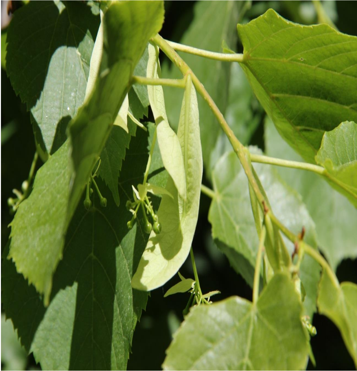
Resim 4.47 Tilia rubra DC. subsp. caucasica (Rupr.) V. Engl. (Ihlamur)