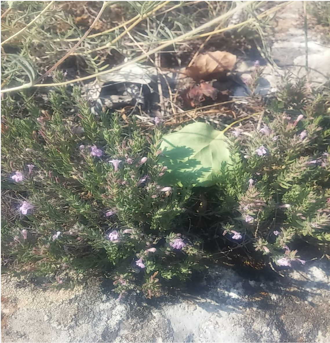
Resim 4.33 Micromeria cristata (Hampe) Griseb. subsp. phrygia P.H. Davis (Taş kekik, kekik)