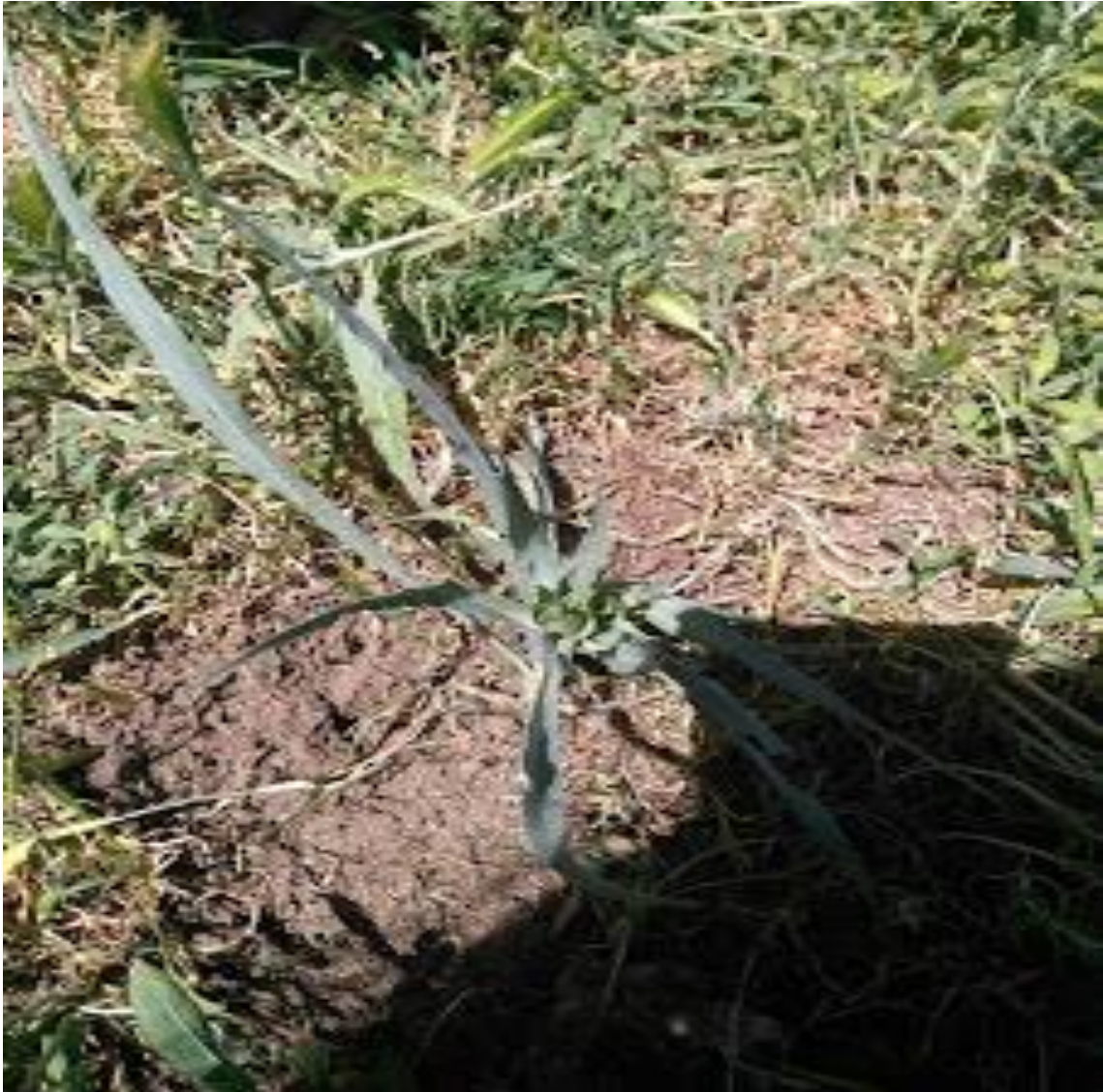
Resim 4.18 Tragopogon latifolius Boiss. (Yemlik)