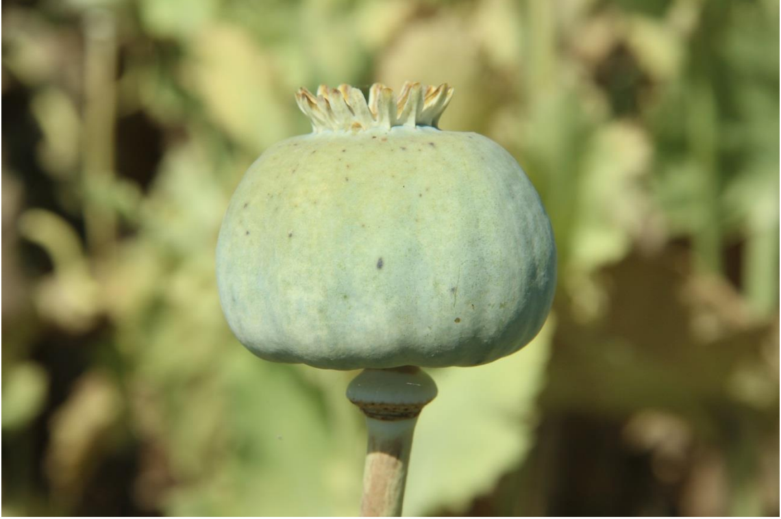
Resim 4.51 Papaver somniferum L. var. somniferum (Haşhaşın Yeşili, Haşhaş, Afyon Haşhaşı, Haşhaş ezmesi, Haşhaş çekmesi)