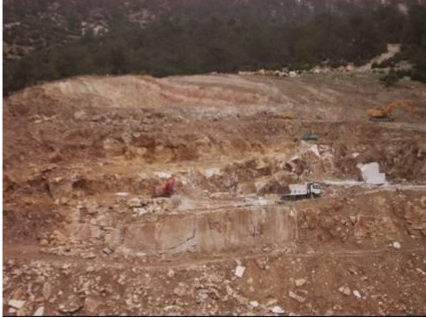
Őekil 4. . Çamlıbel - Ulubey (Uřak) beyaz mermeri örneklerinin alındıęı Aynurlar Mermer ocaęından bir görünüş.

Deneyleerde kullanılan Çamlıbel - Ulubey (Uřak) beyaz mermeri örnekleri, Uřak'ın 50 km güney batısında, Ulubey ilçesine baęlı Çamlıbel köyünde bulunan Aynurlar Mermer ocaęından alınmıřtır. Numunelerin alındıęı ocaęa ait resim Őekil 4'de verilmiřtir. Ocaktan alınan moloz boyutlu mermer parçalarından Afyon Meslek Yüksek Okulu mermer atölyesinde, fiziksel ve mekanik testler için standartlarda öngörölen ebatlarda, küp (70x70x70 mm) ve dikdörtgen prizması (50x100x200 mm) řeklinde örnekler hazırlanmıřtır.