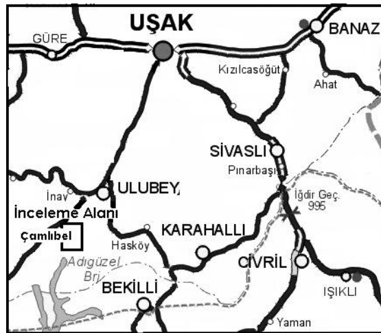
Şekil 1. İnceleme alanının yer bulduru haritası.

İnceleme alanı, Uşak'ın 50 km güney batısında, Ulubey ilçesine bağlı Çamlıbel köyünde (Şekil 1), Uşak mermerlerinin yoğun olarak üretildiği Sivaslı ilçesinin güney batısında yer almaktadır.